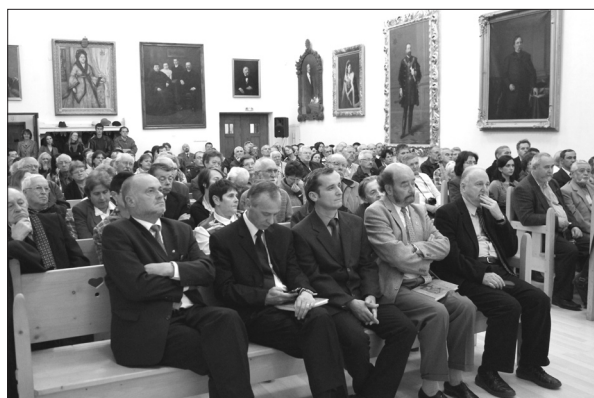
Eveniment cultural în Sala Bartók