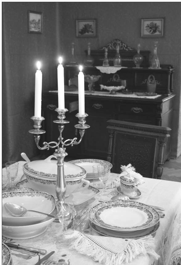
Expoziția Interioare burgheze de altădată din Muzeul Breslelor „Incze László” din Târgu Secuiesc