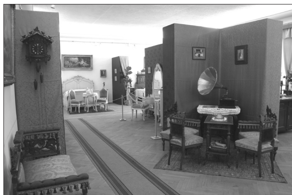
Békebeli otthonok. Polgári lakáskultúra Háromszéken. Kézdivásárhely, 2012

A baróti erdővidék Múzeuma mintegy 70 eseményt szervezett az elmúlt időszakban, melyek közt számos előadás, több kiállítás, filmvetítés és gyermekprogram szerepelt.