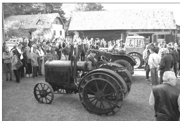
Tractoare și mașini agricole puse în funcțiune în curtea Muzeului „Haszmann Pál”