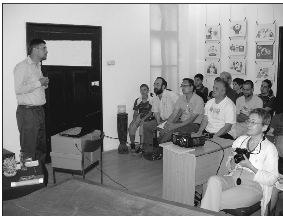
Prezentare tematică în Muzeul Depresiunii Baraolt