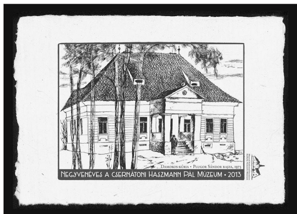
40 éves a Haszmann Pál Múzeum. Csernáton, 2013

Az Erdélyi Művészeti Központ 2013. február–március folyamán Kolozsváron a Minerva kiállítóterben és a bukaresti Balassi Intézetben tartotta bemutatkozó tárlatait. Szeptemberben Sepsiszentgyörgyön nyílt meg a Szocrelatív. Erdélyi magyar művészet 1945–1965 című nagy sikerű kiállítás Vécsei Nagy Zoltán kurátor irányítása alatt, s ugyancsak ezen az eseményen mutatták be a kurátor által írt, a kiállítással azonos című kötetet.