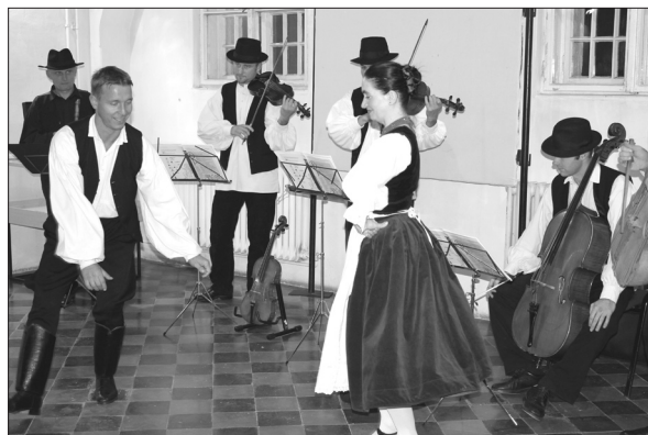
Dans popular în Sala Cavalerilor

Avem încrederea că după parcurgerea raportului și răsfoind paginile anuarului, Cititorului i se va trezi curiozitatea față de munca științifică, culturală și artistică din instituția noastră.