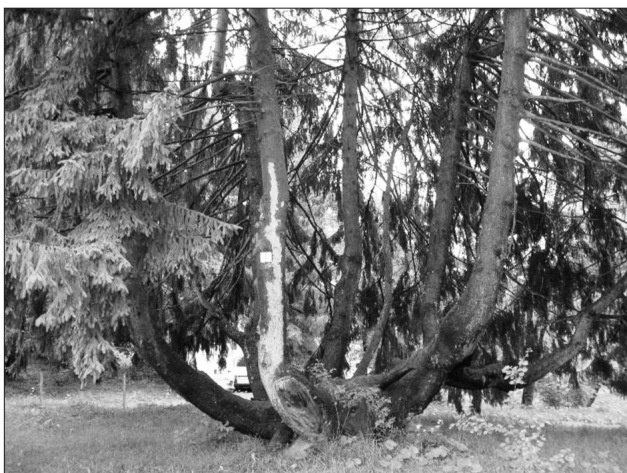
6. ábra Picea abies (Zabola)