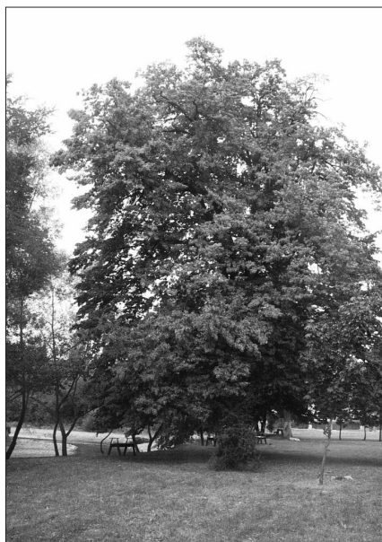
5. ábra Fagus sylvatica f. atropunicea (Vargyas)