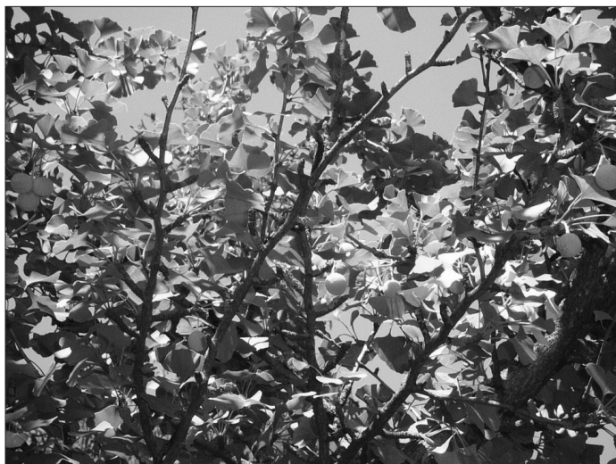
3. ábra Ginkgo biloba (Dálnok)