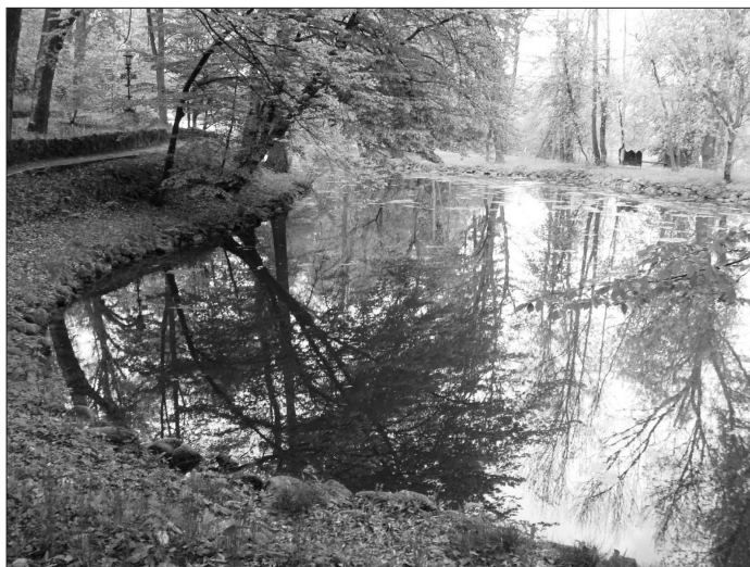
1. ábra Részlet az árkosi kastélyparkból