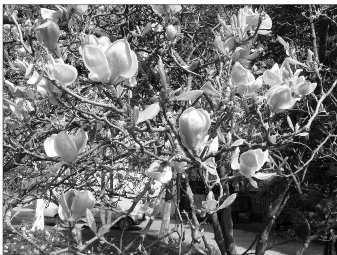
2. ábra Magnolia x soulangiana (Árkos)