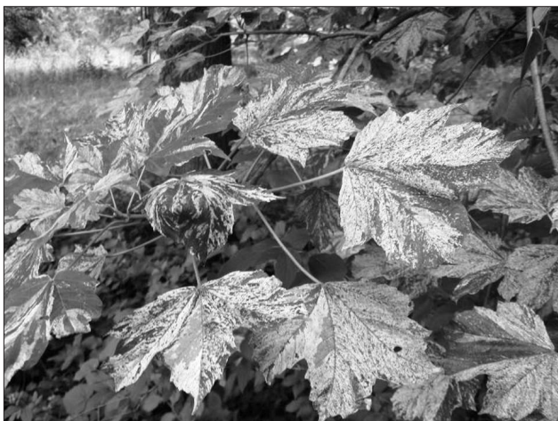
4. ábra Acer hyrcanum (Dálnok)