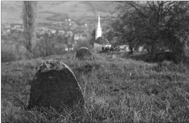
3. ábra A gegesi református egyházi nagytemető (régí temetőrész), Péterfy László felvétele, 1981. (KJNT Fényképtárháza 04822)