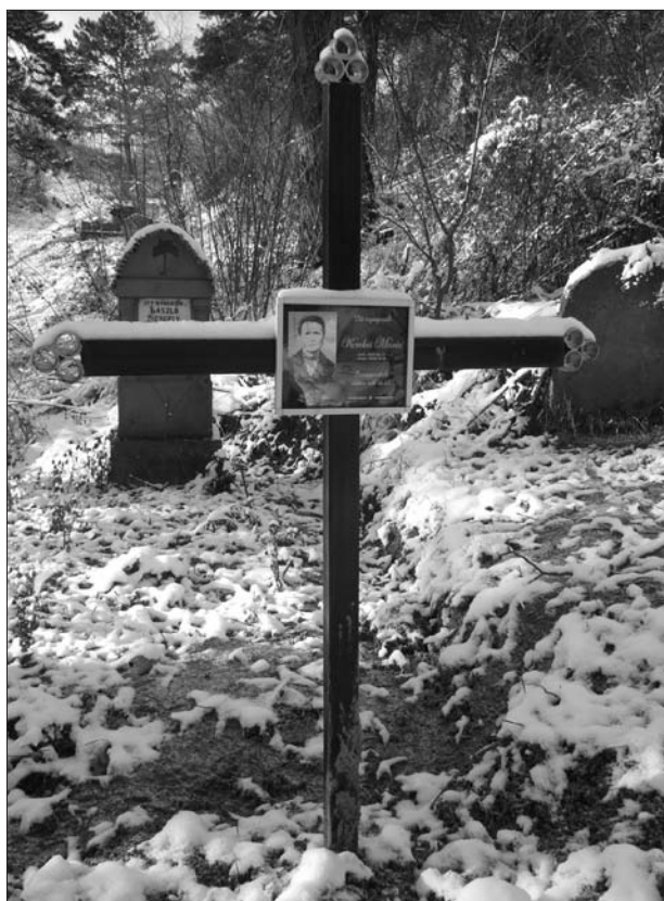
6. ábra Református felekezetű elhunyt katolikus mintára készített fém sírjele a gesei református egyházi nagytemetőben (új temetőrész). Nagy Zsolt felvétele, 2010