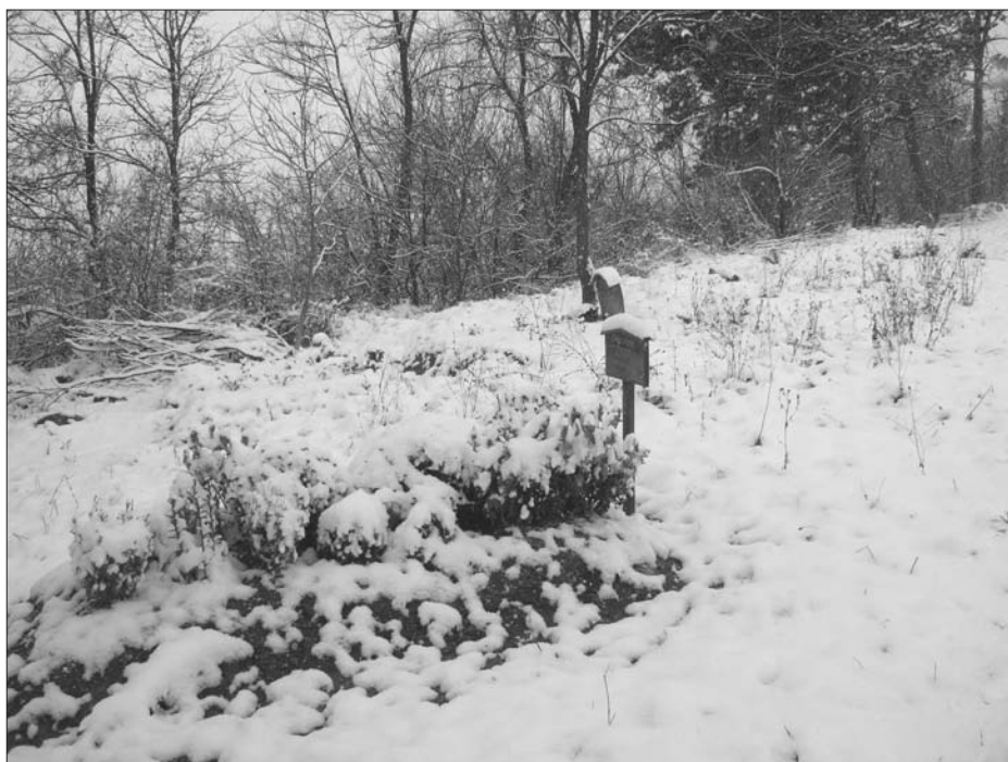
7. ábra Sírjellel ellátott sírhantok a gesei Cigány temetőben . 2010