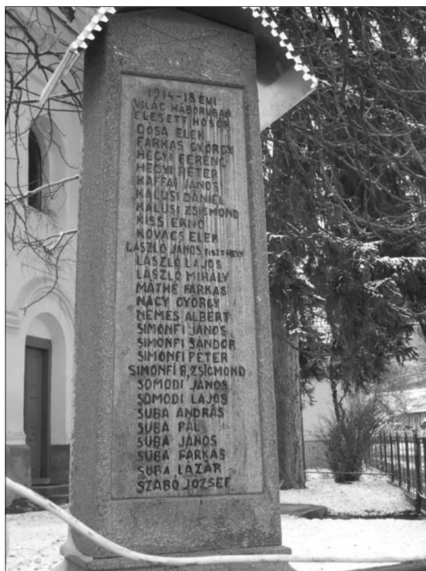
12. ábra A református templom kertjében álló I. világháborúban elesettek emlékére állított kő, Geges. Nagy Zsolt felvétele, 2011