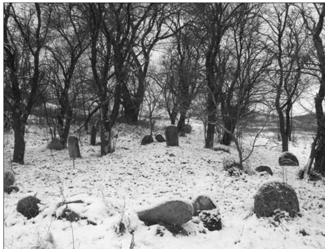
4. ábra A gegesi református egyházi nagytemető (régí temetőrész a gyümölcsfákkal).