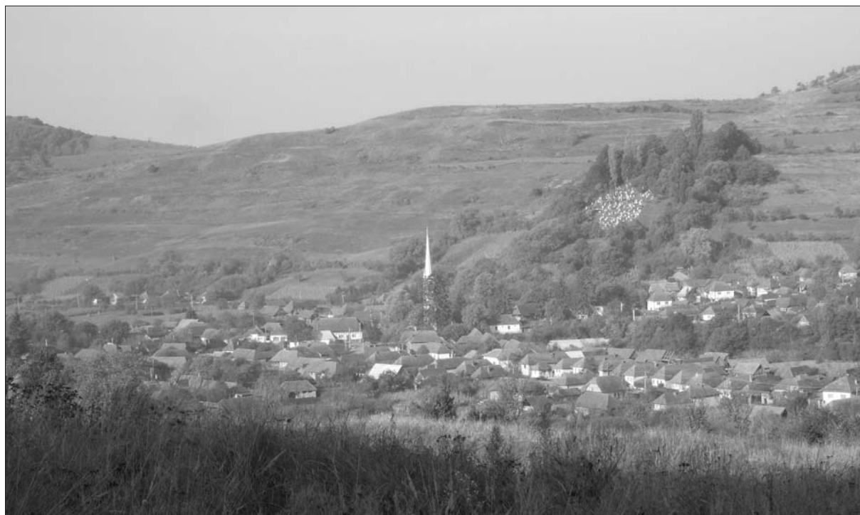
2. ábra Geges látképe. Nagy Zsolt felvétele, 2009