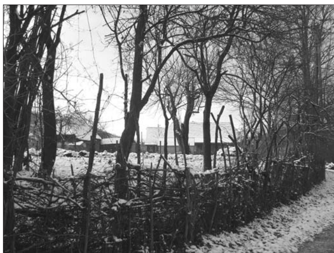
9. ábra A Didi-kert (Jakab-kert) , Geges. Nagy Zsolt felvétele, 2010