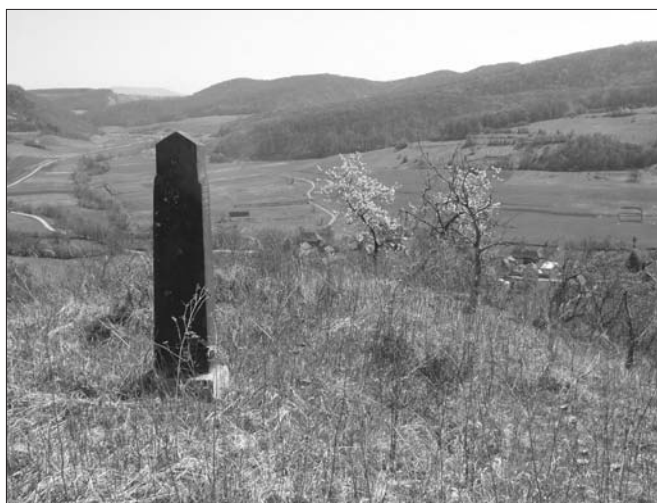
10. ábra Madaras Dénes magántemetkezése a Nagyhegy és Kicsi hegy között, Geges. Nagy Zsolt felvétele, 2011