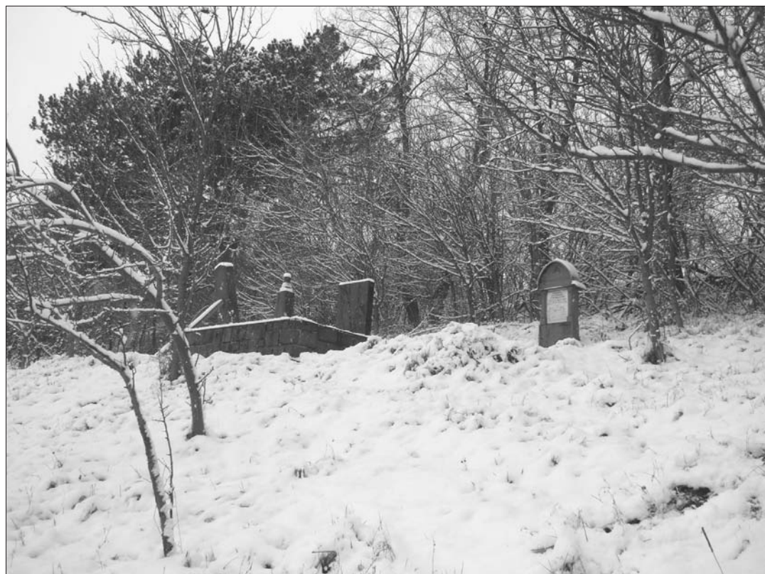
16. ábra A Nemes család nyughelye a Nemes-kertben , Geges.