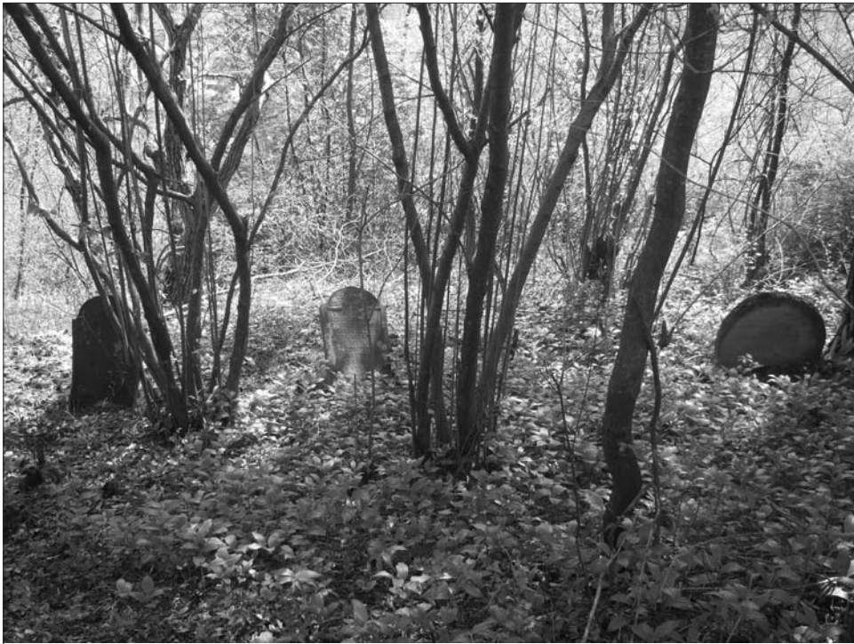
13. ábra Sírkövek a Kissek és Adorjániak családi temetőjében ( Poros-tető ), Geges. Nagy Zsolt felvétele, 2011