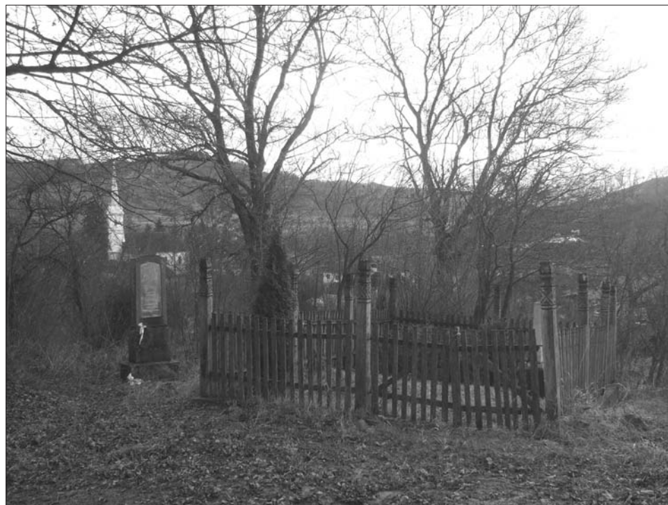
11. ábra Sírjelekkel jelzett magántemetkezések a Ropó útja mentén, Geges. Nagy Zsolt felvétele, 2010