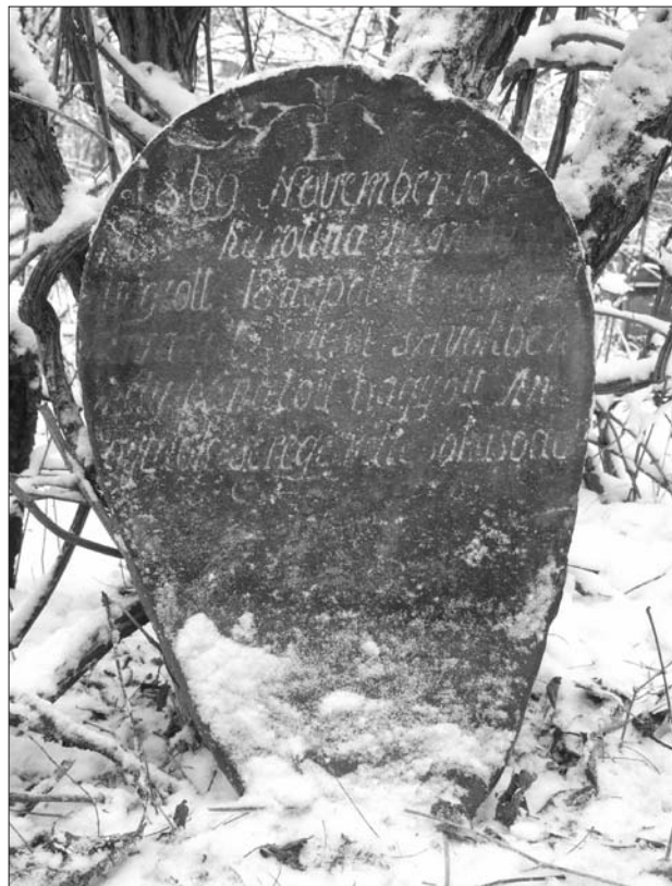
14. ábra Kiss Karolina 1869-ben készült sírjele a Kissek és Adorjániak családi temetőjében ( Poros-tető ), Geges.