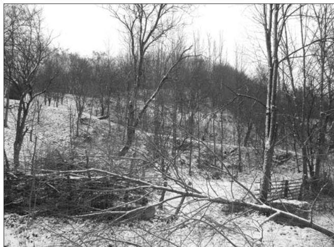
8. ábra Az Oláh temető nevet viselő dombrész, Geges. Nagy Zsolt felvétele, 2010