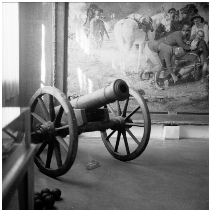
3. kép Nem sokkal a Bukarestbe való elszállítása előtt