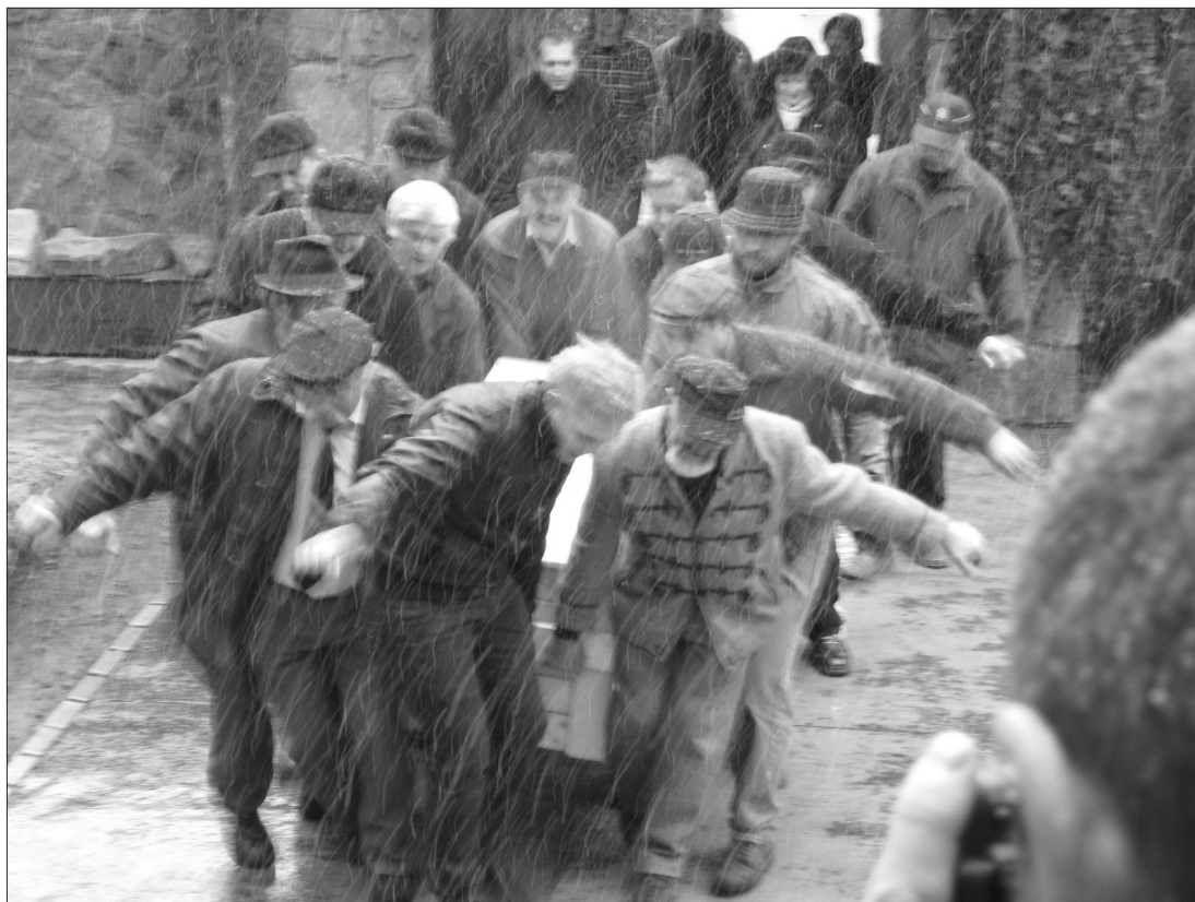
5. kép 2010 márciusa: az ágyú hazatér