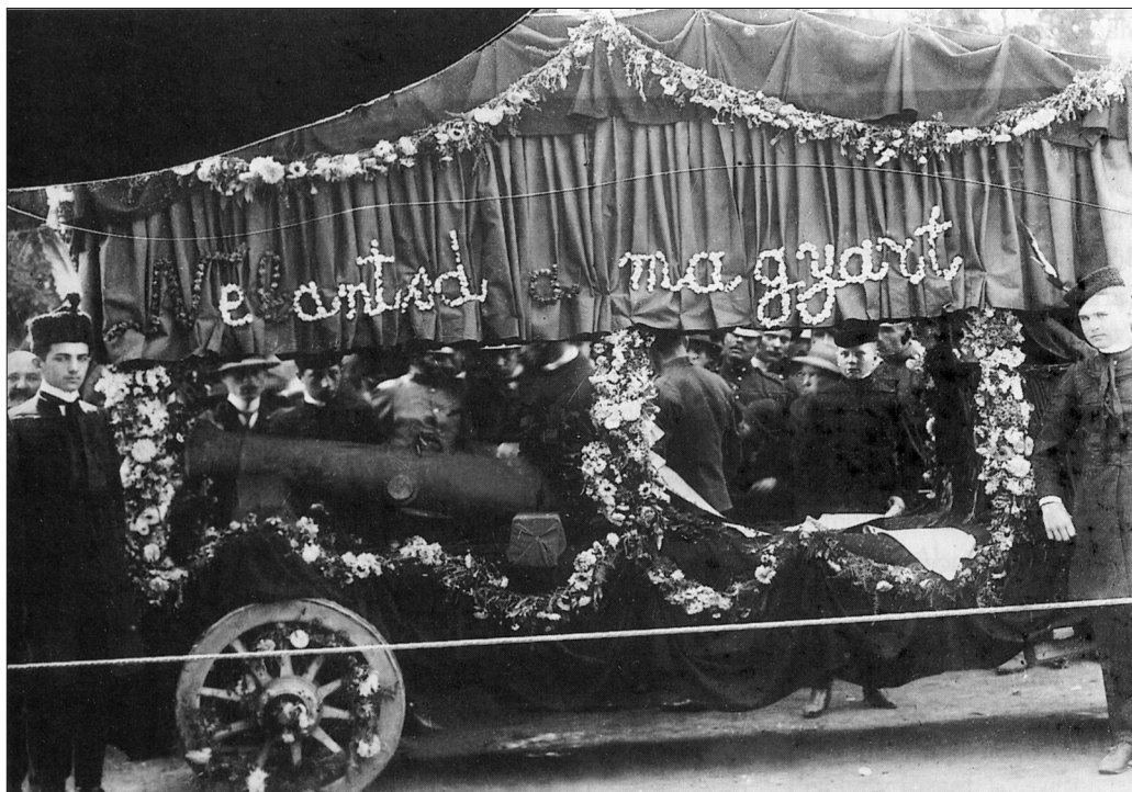
1. kép Az ágyú 1906 augusztusában, Kézdivásárhelyen