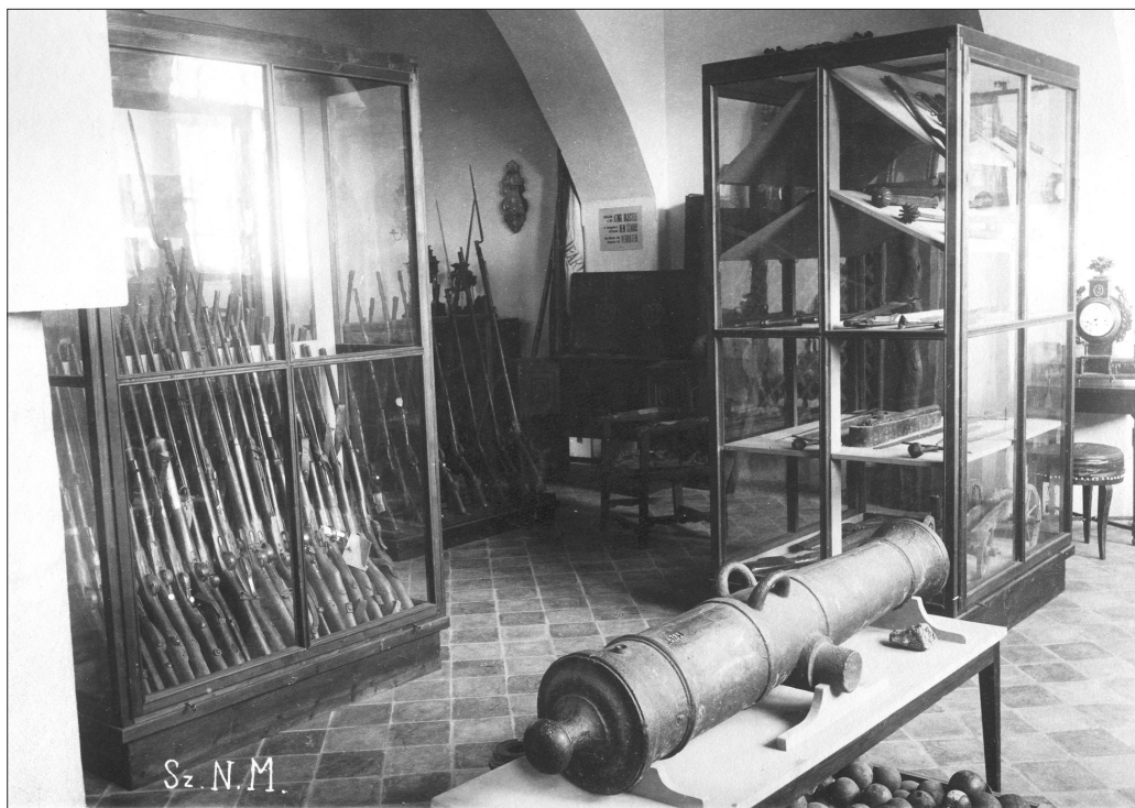
2. kép A két világháború közötti időszakban, a Székely Nemzeti Múzeumban (Incze Lajos felvétele, 1924. SzNM Fotótéka F.462)