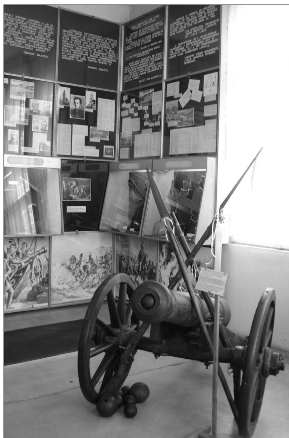
4. kép A 70-es évektől 2010-ig a múzeum kiállításain az ágyú bronz másolata szerepelt