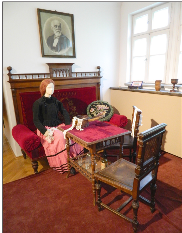
A megújult néprajzi alapkiállítás