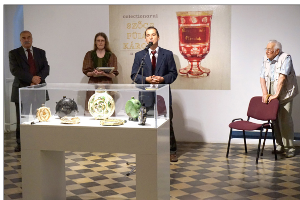
A Szócs Fülöp Károly gyűjteményéből készült kiállítás megnyitóján