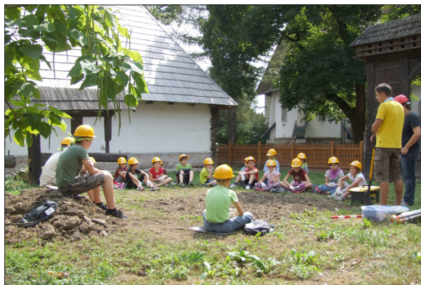
Régészhet a Székely Nemzeti Múzeumban

A kézdivásárhelyi Incze László Céhtörténelmi Múzeum a palócok mindennapjait bemutató kiállítást nyitott ( Kocsira ládám, hegyibe párnám... Ácsolt és festett ládák a Palócföldről ), illetve két kiállítással is megemlékezett a Reformáció ünnepéről ( A Vizsolyi Biblia 425 éve, Reformáció 500 ).