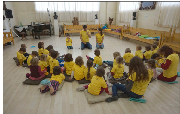
Zenepedagógiai foglalkozás a múzeumban