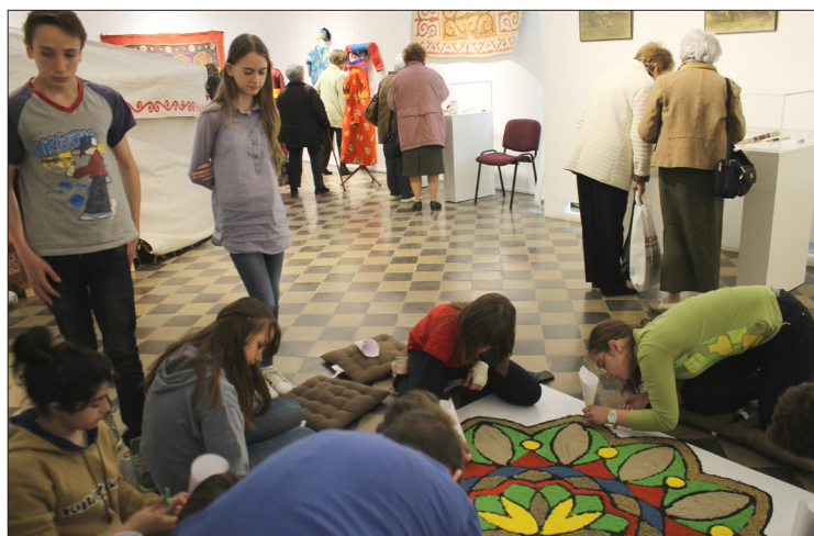
Crearea unei mandala