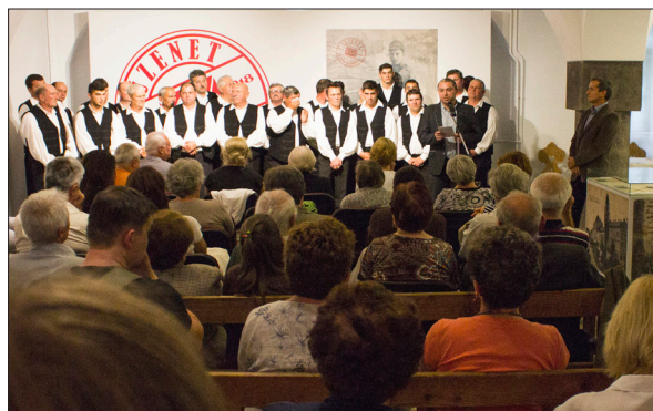
Könyvbemutató az Üzenet a frontról kiállítás megnyitóján

Bízunk benne, hogy beszámolóinkat olvasva, az évkönyvet lapozgatva, tanulmányozva felkeltjük a kedves Olvasó érdeklődését az intézményünkben folyó tudományos, közművelődési és művészeti alkotómunka iránt.