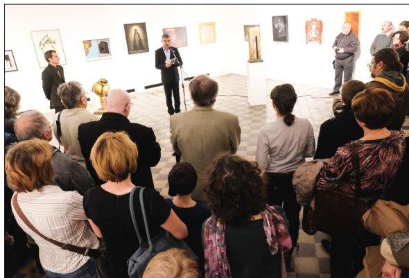
A Boldogasszony kiállítás megnyitója