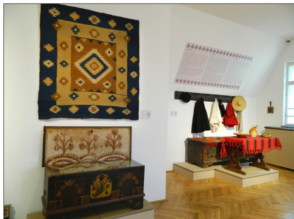
A megújult néprajzi alapkiállítás