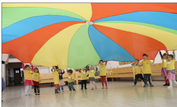
Activitate în cadrul proiectului „Meleté”