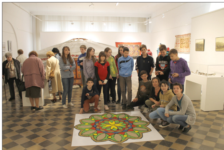
Mandalakészítés a Dzsingisz kán öröksége kiállításon