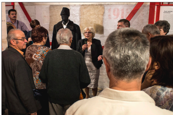
Vernisajul expoziției „Mesaje de pe front”

În aprilie 2017 a avut loc vernisajul expoziției dedicată etnografului Gábor Szinte, organizat de Muzeul de Etnografie din Budapesta.