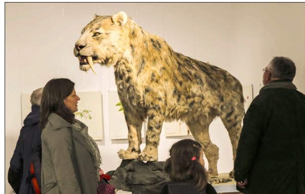
Kardfogú tigris a Jégkorszak kiállításon