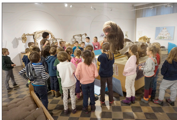
Múzeumpedagógiai foglalkozás a Jégkorszak kiállításon