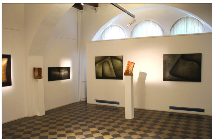
Expoziția de artă plastică „Vinczeffy 70”