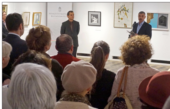
Vernisajul expoziției „Boldogasszony”

Muzeul Național Secuiesc este o instituție regională, a cărei activitate este subvenționată de către Consiliul Județean Covasna. Funcționează cu o bibliotecă, cu secțiile de științele naturii, de arheologie și istorie, de etnografie, respectiv cu unități externe, cum ar fi cea de arte plastice din Sfântu Gheorghe (Galeriile de Artă „Gyárfás Jenő”, Centrul de Artă Contemporană „Magma”), cea din Baraolt (Muzeul Depresiunii Baraolt), cea din Cernat (Muzeul „Haszmann Pál”), cea din Târgu Secuiesc (Muzeul de Istorie a Breslelor „Incze László”) și cea din Zăbala (Muzeul Etnografic Ceangăiesc). Asigurarea funcționării Centrului Artistic Transilvănean a fost preluată de către Primăria Sfântu Gheorghe.