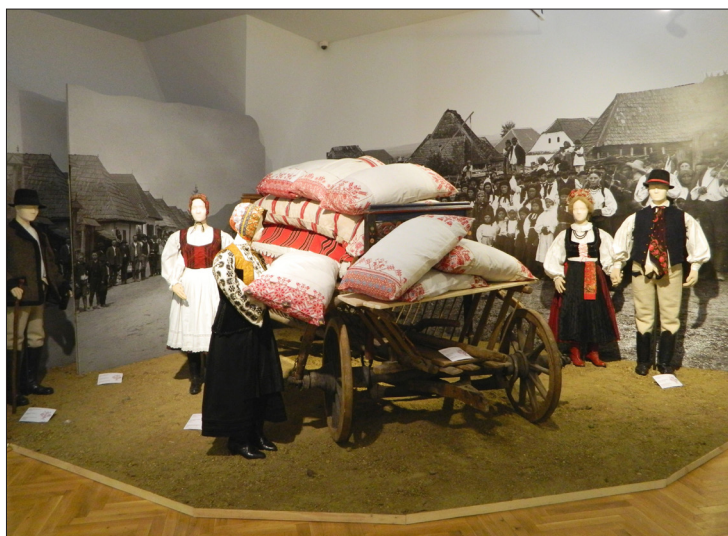
A megújult néprajzi alapkiállítás