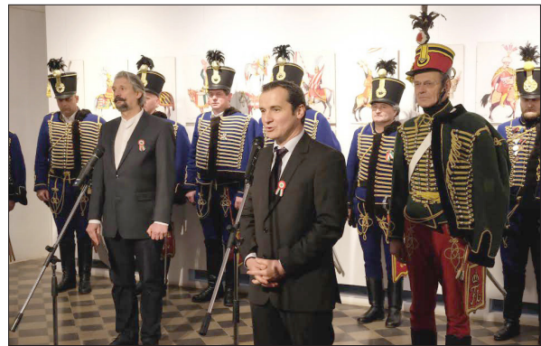
A Száz magyar lovas című kiállítás megnyitóján