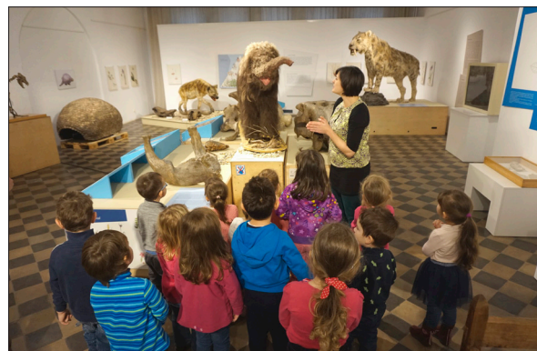
Activitate de pedagogie muzeală în expoziția „Era glaciară”