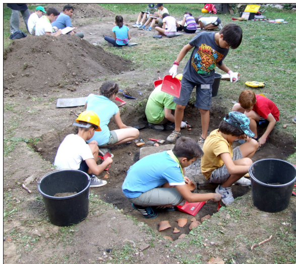
„Săptămâna arheologilor” în Muzeul Național Secuiesc

Muzeul de Istorie a Breslelor din Târgu Secuiesc a organizat conferințe despre Reformație și istoria orașului Târgu Secuiesc, iar Muzeul Etnografic Ceangăiesc a organizat Seminarul Tinerilor Etnografici și Taberele de dansuri și cântece populare .