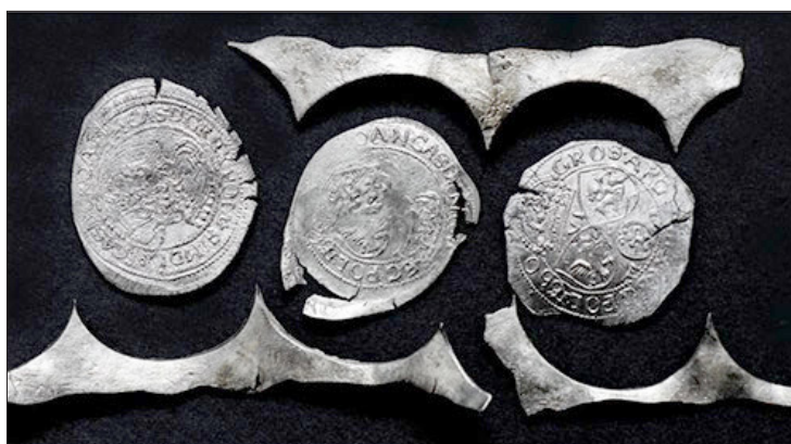
Numizmatikai lelet az uzoni Béldi–Mikes-kastélyból