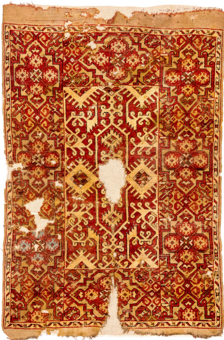
6. ábra Lorenzo Lotto-szőnyeg az oltszemi református templomból. Usak vagy környéke, 17. század. (SzNM, R. 6912, Vargyasi Levente felv.)