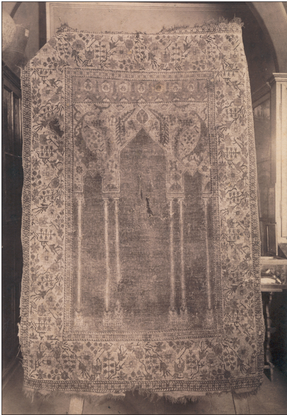
4. ábra Oszlopos imaszőnyeg a SzNM 1914 előtti gyűjteményéből, 20. század eleje. (SzNM Fényképtára, Kat. sz. 616)