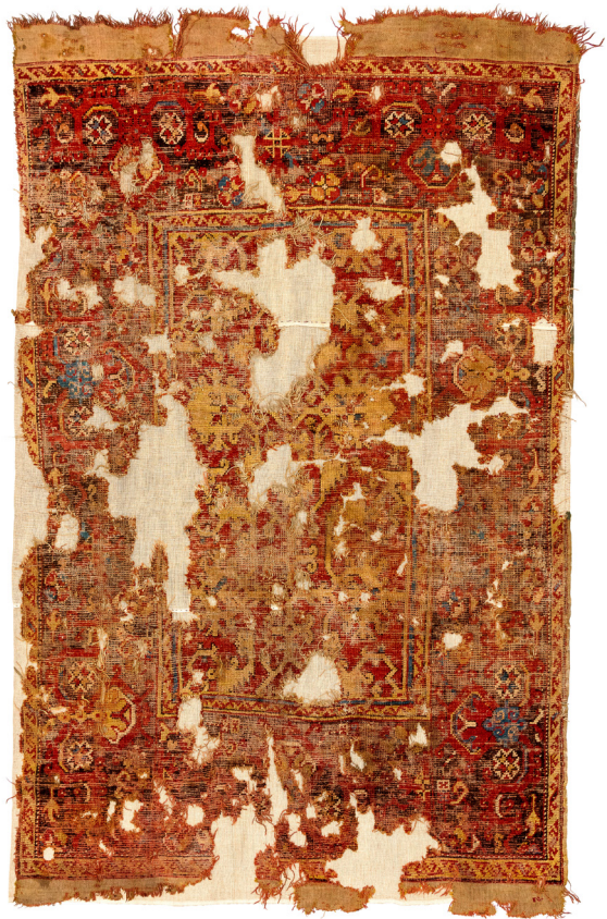
5. ábra Lorenzo Lotto-szőnyeg az oltszemi református templomból. Usak vagy környéke, 17. század. (SzNM, R. 6911, Vargyasi Levente felv.)