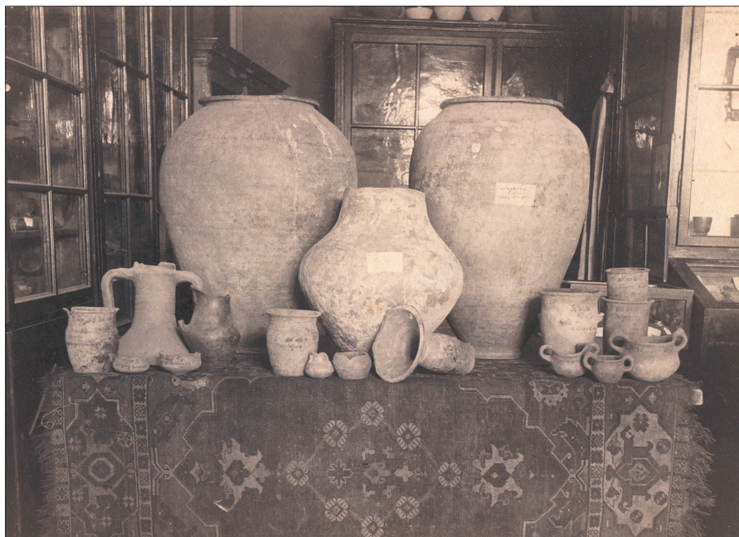
1. ábra Oszmán-török szőnyeg a SzNM 1914 előtti gyűjteményéből, 20. század eleje. (SzNM Fényképtára, Kat. sz. 608)