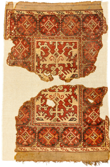
7. ábra Lorenzo Lotto-szőnyeg a kálnoki református templomból. Usak vagy környéke, 17. század. (SzNM, R. 8080)