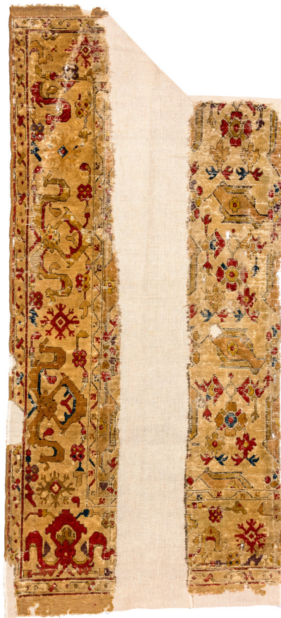
9. ábra Madaras szőnyeg töredékei a dedrászéplaki református templomból. Szelendi(?), 17. század első fele. (SzNM, R. 10550, Vargyasi Levente felv.)