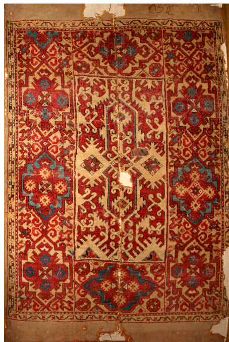
11. ábra Lorenzo Lotto-szőnyeg ismeretlen helyről. Usak vagy környéke, 17. század. (SzNM, Lsz. n.)