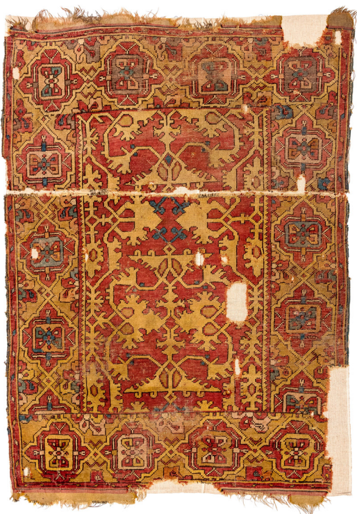
10. ábra Lorenzo Lotto-szőnyeg ismeretlen helyről. Usak vagy környéke, 17. század. (SzNM, Lsz. n.)