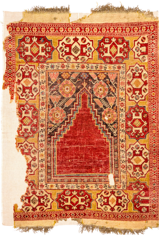
8. ábra Gördesz imaszőnyeg a vajdakamarási református templomból. Usak vagy környéke, 17. század. (SzNM, R. 8601, Vargyasi Levente felv.)