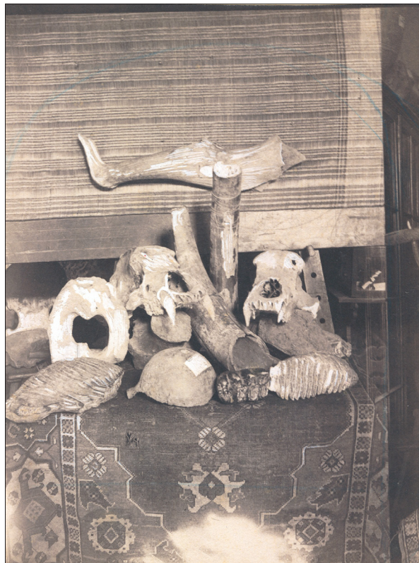
2. ábra Oszmán-török szőnyeg a SzNM 1914 előtti gyűjteményéből, 20. század eleje. (SzNM Fényképtára, Kat. sz. 609)