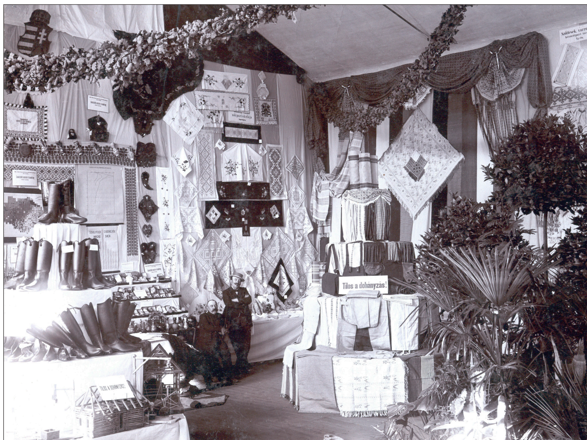
A sepsiszentgyörgyi Nőiipariskola az 1905-ös sepsiszentgyörgyi Székely Kiállításon. Székely Nemzeti Múzeum fototékája, F. 135-ös katalógusszám