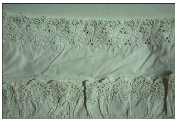
Féherhímzéses párnahuzat részlete. A Nőiipariskola oktatásának hatására terjedt el Háromszéken a féherhímzés. Kézdialmás, 2017