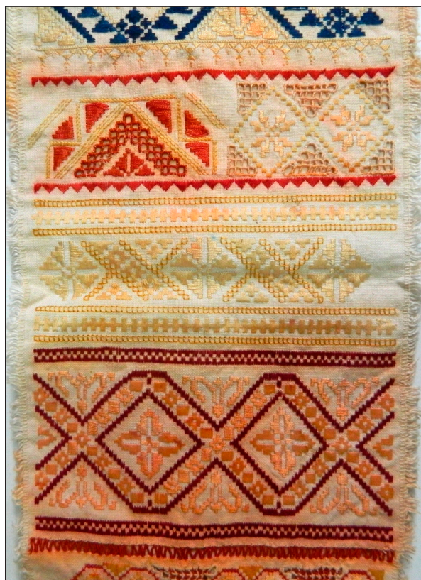
Kalotaszegi vagdalásos minták az előbbi mintakendőről