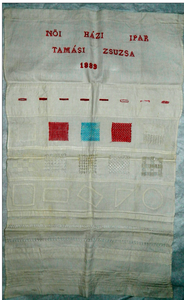
A sepsiszentgyörgyi Nőiipariskolában készített mintakendő. Székely Nemzeti Múzeum tulajdona