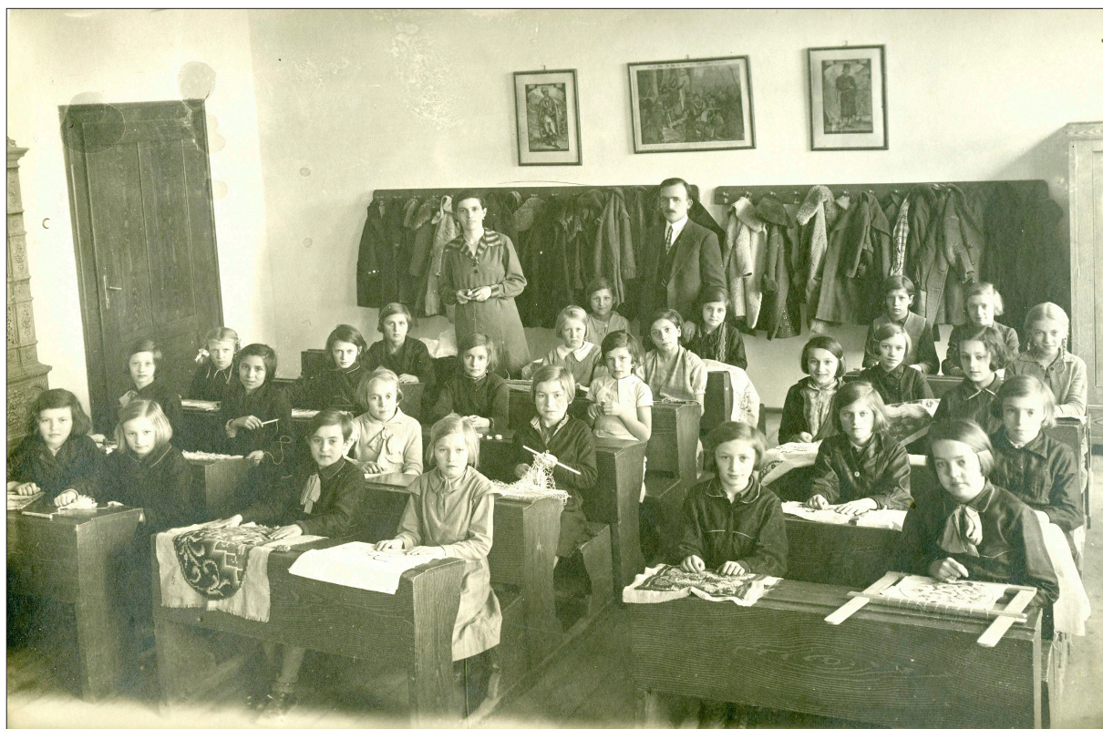
Kézimunkaoktatás, 20. század eleje. Fóris család fototékája