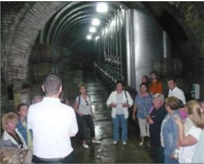
Látogatóban Villányban a Wundereich-pincészetben