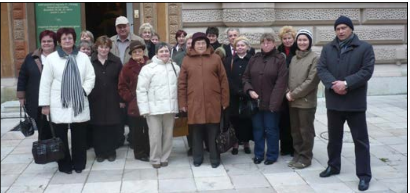
Szekszárdon 2009-ben a Művészetek Háza előtt a Munkácsy kiállítás megtekintése után