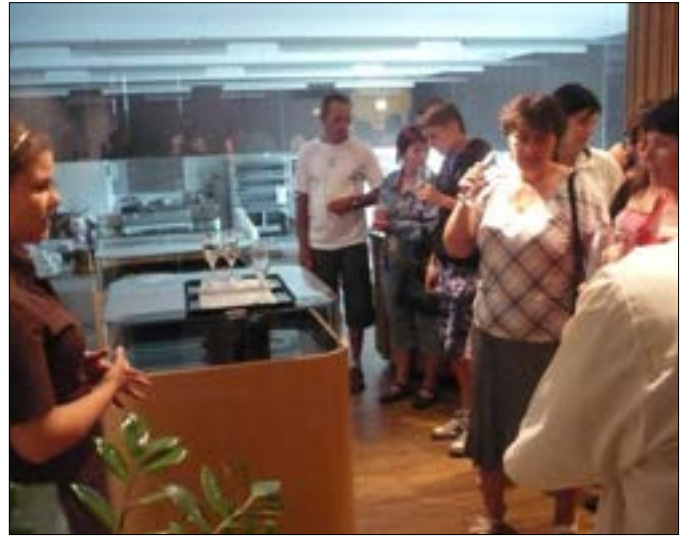
Sopronban 2012-ben a Harrer családi csokoládé manufaktúrában