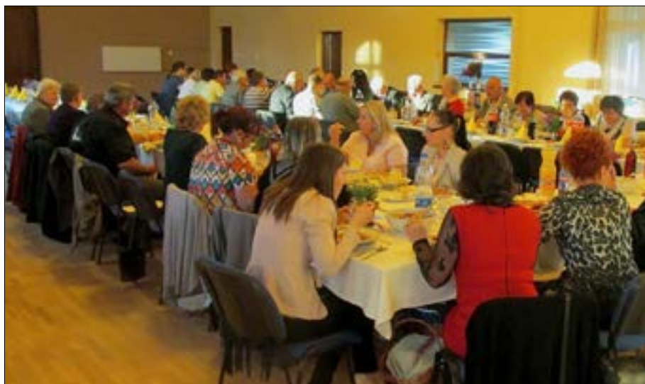
Egy összetartó csapat!