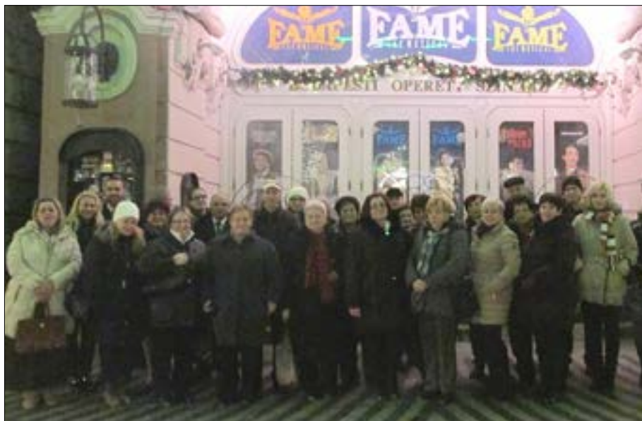
2015. decembere az Operett Színház előtt a népfőiskolások csapata, A menyasszonytánc című darab megtekintése után