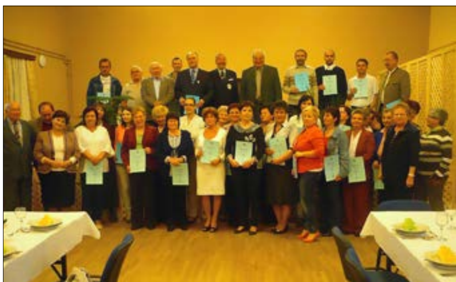
2014. évi évfolyam előadói és oklevélben részesülő hallgatói

aktivitású hulladék elhelyezésének problematikájáról. Ehhez kapcsolódóan szervezett a pusztahencsei népfőiskolások számára egy szakmai magyarázatokkal egybekötött kirándulást a bátaapáti hulladékártólóba. Ennek költségét a RHK KHT fedezte. A következő évben Villányba megnéztük a szoborparkot majd meglátogattuk a Günzer és a Wunderlich-pincészeteket, utóbbiban üzemlátogatáson is részt vettünk és egy szakképzett sommelier kalauzolásával borkóstoláson vettünk részt. 2012-es kirándulásunkon felkerestük a Jeli Arborétumot majd Sopronban meglátogattuk a Harrer-csokoládé manufaktúrát, ahol amellet, hogy megismerkedtünk a csokoládé gyártás technológiai folyamataival megízlelhetjük a finom végterméket is. Ennek a látogatásnak az adta az apropóját, hogy egyik népfőiskolai társunk előadása felcsigázta a csapat érdeklődését a téma iránt. Fertőrákost is meglátogattuk. Következő alkalommal Gödöllőn megtekintettük a Grassalkovich-kastélyt, ahol Sissi nyomaiba eredtünk – szintén egy népfőiskolai előadás ihletésére. Innen Visegrádra mentünk, ahol megcsodáltuk a Fellegvárból nyíló fenséges panorámát. A Duna mentén visszafelé indulva megálltunk Szentendrén, ahol kellemes sétákat tettünk az óváros ódon sikátoraiban. Tavaly pedig Budapestre utaztunk, hogy részt vegyünk az Adventi vásár forgatagában a Vörösmarty-téren és a Bazilika előtt, azután pedig megtekintettük az Operett Színházban A menyasszonytánc című előadást, ami nagy tetszést aratott csapatunk körében.