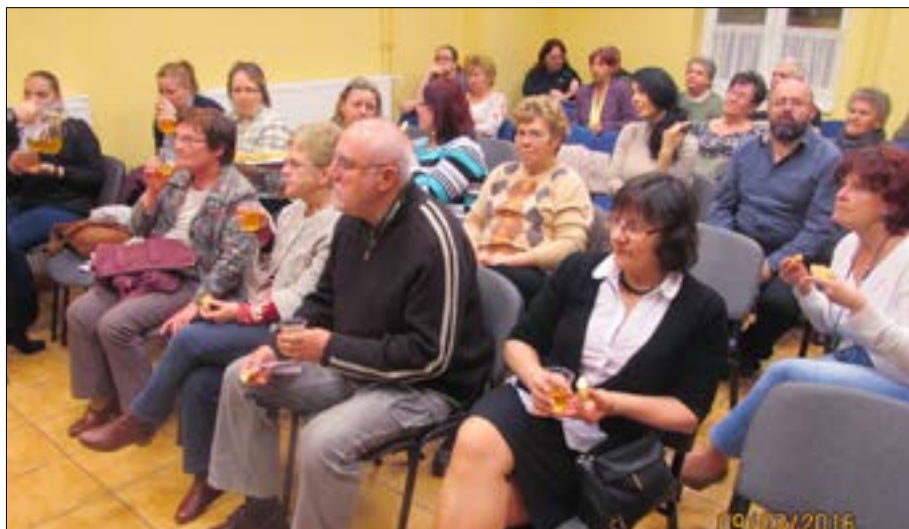
Az előadások kellemes hangulatban, interaktív módon zajlanak