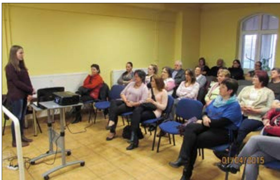
Ifjú Tudor előadása a Puztahencsei Népfőiskolán

Az előadás sorozat január elején kezdődik és általában április elején (tavaszi munkák kezdetére) fejeződik be. Minden szerdán 18 órakor találkozunk a művelődési ház videó termében. A december elején közösen meghatározott rend sze-