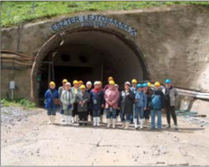
A Bataapáti Nemzeti Radioaktív Hulladék – tároló kiépítésének megtekintésénél a pusztahencsei csapat