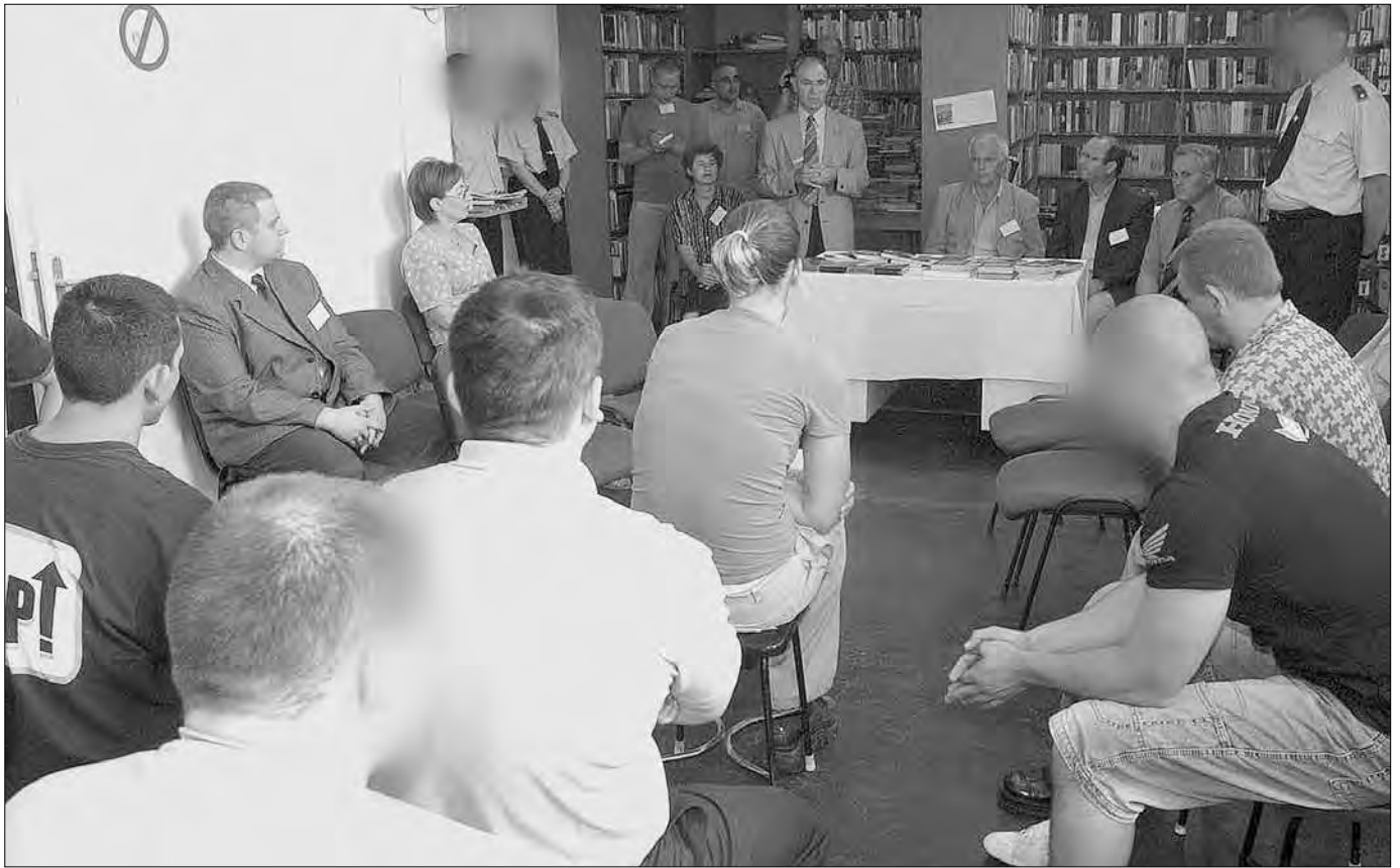
Ünnepi pillanat a hosszú bétköznapokban (Képiünk „idézet” a Zalai Hírlap egyik börtön-népfőiskolai tudósításából)

A kérdőívek alapján azt láttam, hogy teljesen más feladatot kell végezniem, mint Szolnokon, mivel képzett, sok esetben csupán felsőfokú iskolájukat be nem fejező fiatalokkal álltam szemben.