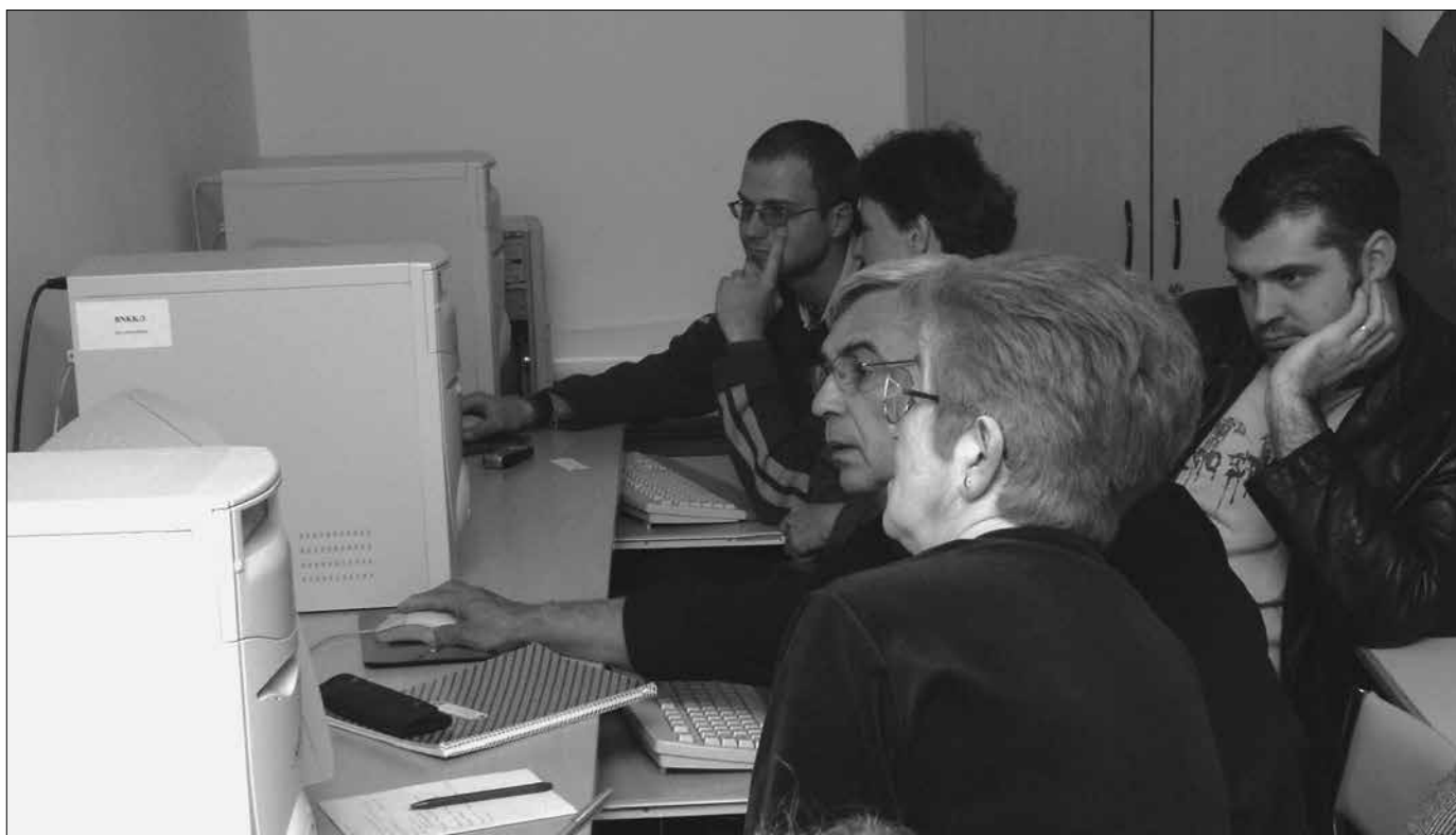
A pályázati kiírásokról és feltételekről bővebben a weben...

lenne, ha a továbblépésben is tudnánk segíteni. A haladó csoport munkájáról tudok többet mondani, minthogy mindkét látogatásom alkalmával ennek lehettem részese. Az első pillanattól kezdve megragadott az a szó szoros – és többféle – értelmében is vett „projekt-módszer”, amellyel Czinkotai Renáta tanított. A mindkét nyelvet anyanyelvi szinten beszélő tanár – eredeti szakmáját tekintve – nem tanár. Azonban nem csak az angol nyelvet beszéli anyanyelvi szinten, hanem a brit kultúrában is ugyanígy otthon van, mivelhogy évekig élt az Egyesült Királyságban. S hogy a pályázatok világában is hasonló tájékozottsággal mozog,