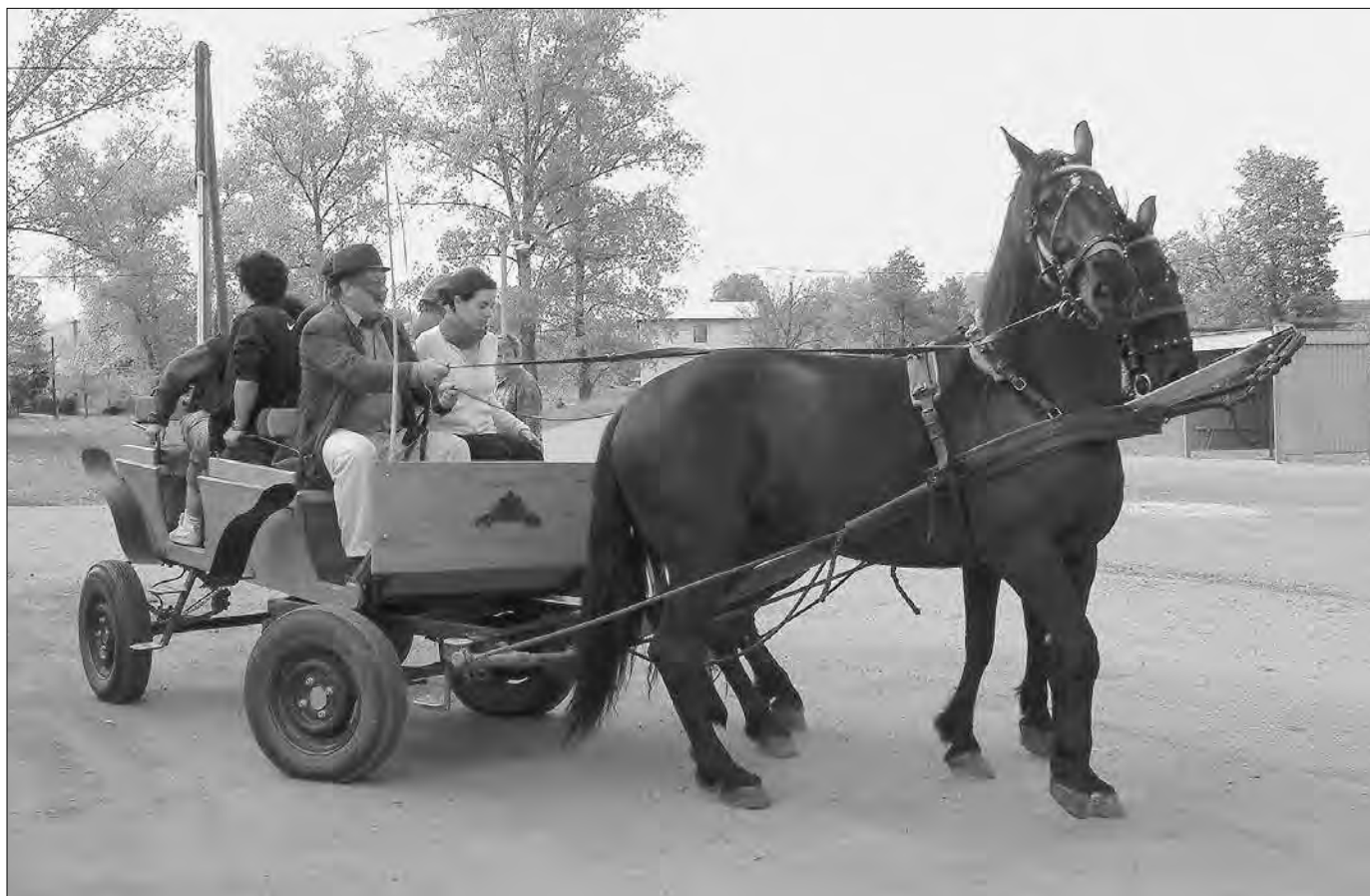
Ismerkedés a faluval

Beszélgetőtársaink elbeszéléseiből valamint az Ezredforduló című - községi önkormányzati - millenniumi kiadványból egyértelműen kitűnt, hogy nem az eltérő anyanyelvű (szlovák, magyar) emberek közötti, hanem a politikai ellentétektől, illetve a határmenti régió magárahagyatottságától szenvednek az itt élő magyarok.