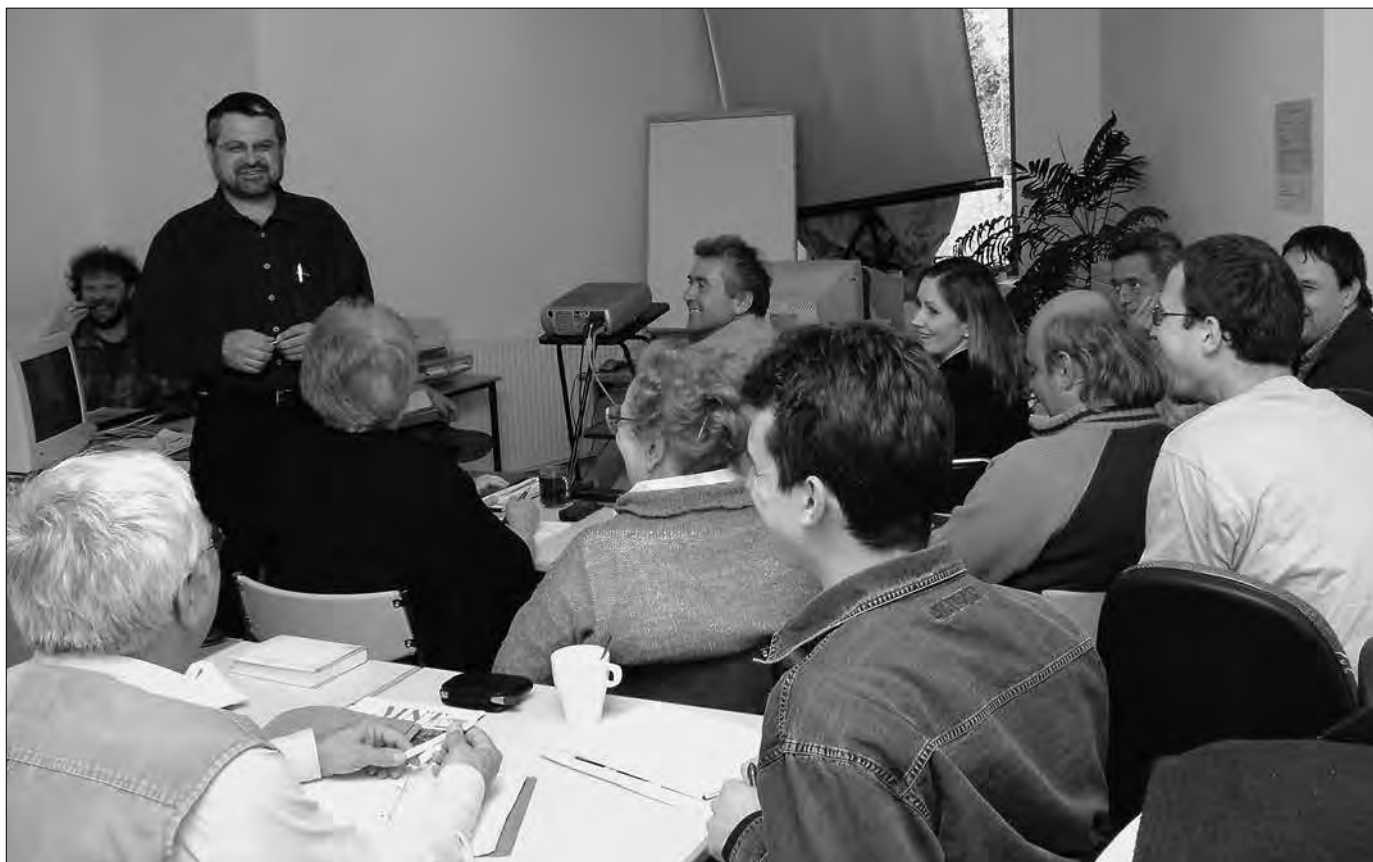
Bevezetés a projektmenedzsment műhelytitkaiba

A fenti címmel a Magyar Népfőiskolai Társaság – a Nemzeti Civil Alapprogram támogatásával – ez év első félévében tíz hétvégét felölelő bentlakásos képzést szervezett Balatonszepezden.