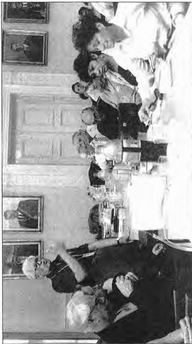
Forum a millenniumi Szent István Egyetemi Napok keretében

„A társadalmi élet alapjelensége a kiváló utánsága. Az elit megteremti egy kor életstílusát, kitűzi céljait, az átlagember pedig átvesszi, nem is annyira külső, mint belső kényszerből: azért, mert maga nem tud a határom céljaival szemben önálló célokat kitűzni. Akármelyik történelmi korszakot nézzük, elit és tömeg közt megtaláljuk az utánság társadalom-fenntartó köteleit. Ortega szerint a mi korunk hallatlan újsága, hogy a tö-