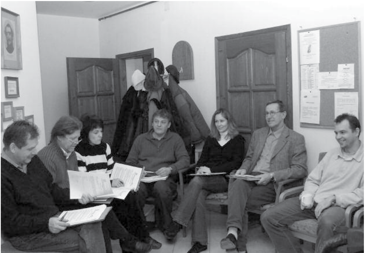
Gyakoroljuk a fókuszcsoporthos interjúkészítést