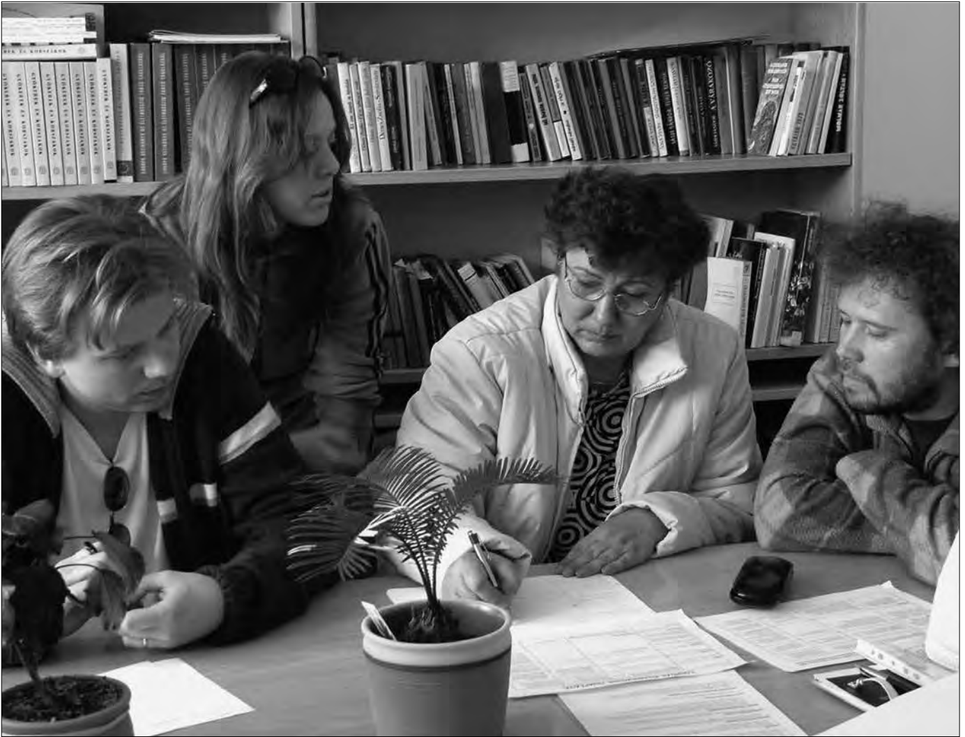
Egyszerre két nyelven (angolul és projektül)

Szükséges e ponton azt is megjegyezni, hogy nem (csupán) a pályázati szakzsargon készségi szintű puffogatásáról van szó (bár ez idő szerint is olyan készség, amelynek jobb, ha birtokában vagyunk, mint ha nem), de (szerencsére) nem ez a siker egyetlen záloga. A pályázatbírálók (a brüsszeliek is) annyi rutinos – ám tartalmatlan – frázist olvasnak, hogy szinte hálát éreznek, ha valami konkrétumba botlik a tekintetük.