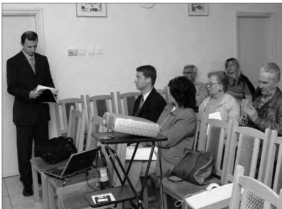
Autentikus tájékoztató a LEADER programról

A másik alkalommal nagyobb szükség volt az anyanyelv használatára, mert ekkor már nem csak beszélgetni kellett a már olvasható projektekről, hanem eredeti, innovatív projekteket kellett szabályosan, az EU-s pályázatok nyelvén és logikája szerint megfogalmazni. Így az egyik csoporttag javaslata mellett döntve, nyugdíjasklubok klubjainak megyei ernyőszerkezete számára terveztünk országjáró programokat az idős emberek életminőségének