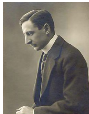
Klebelsberg Kuno az 1900-as évek elején

Az 1940-es évek első felében a közművelődés szó nem lelhető fel a napilapok és folyóiratok hasábjain. Megjelentek és szaporodtak azonban a világháborút lezáró évtized második felében