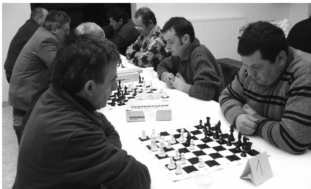
Szemtől szemben küzdenek a világos és sötét bábukat irányító „hadvezérek”