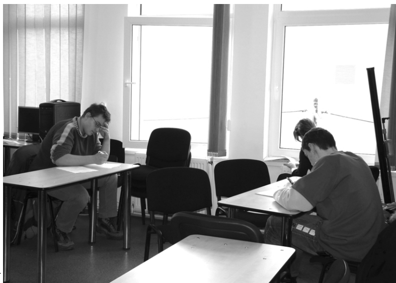
Szabadjára engedhették a fantáziájukat a diákok