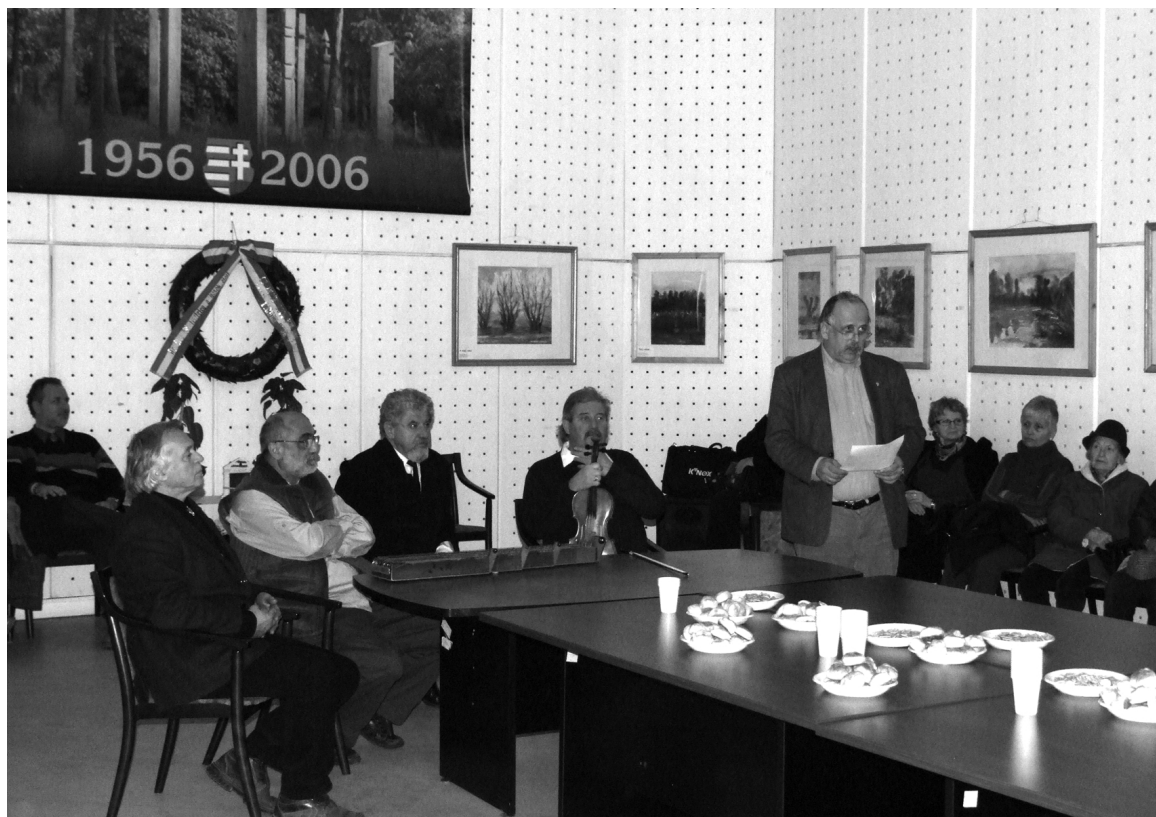
A kiállítás megnyitója a Magyarok Házában