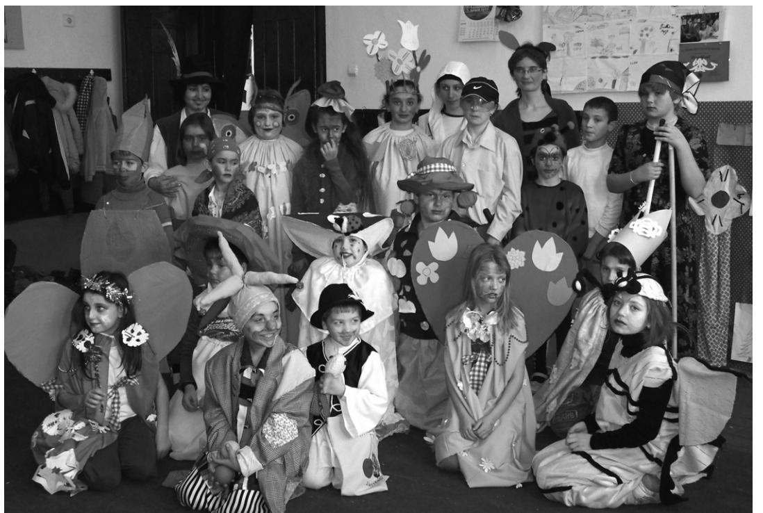
A gyerekek fantasztikus jelmezekkel kedveskedtek a közönségnek

A záróeseményről természetesen nem hiányozhatott a mosolygós farsangi óriásfánk sem, melyet minden résztvevő meleg tea kíséretében jóízűen fogyasztott. ☞