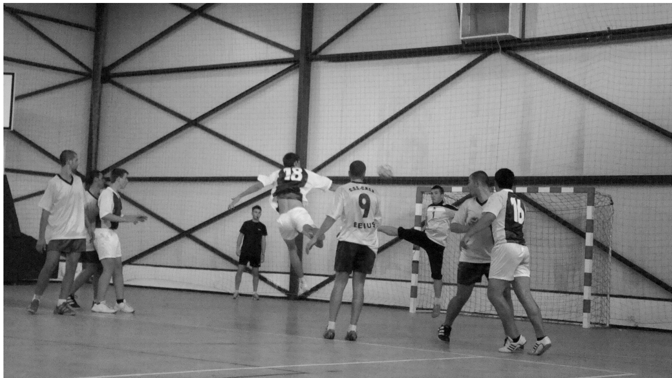
A székelyhídi játékosok sokszor megzörgették a többi kézilabdacsapat hálóját

Most továbbra is folytatjuk az edzéseket, készülünk a megyei megmérettetésre, és reméljük a legjobbakat. ☞