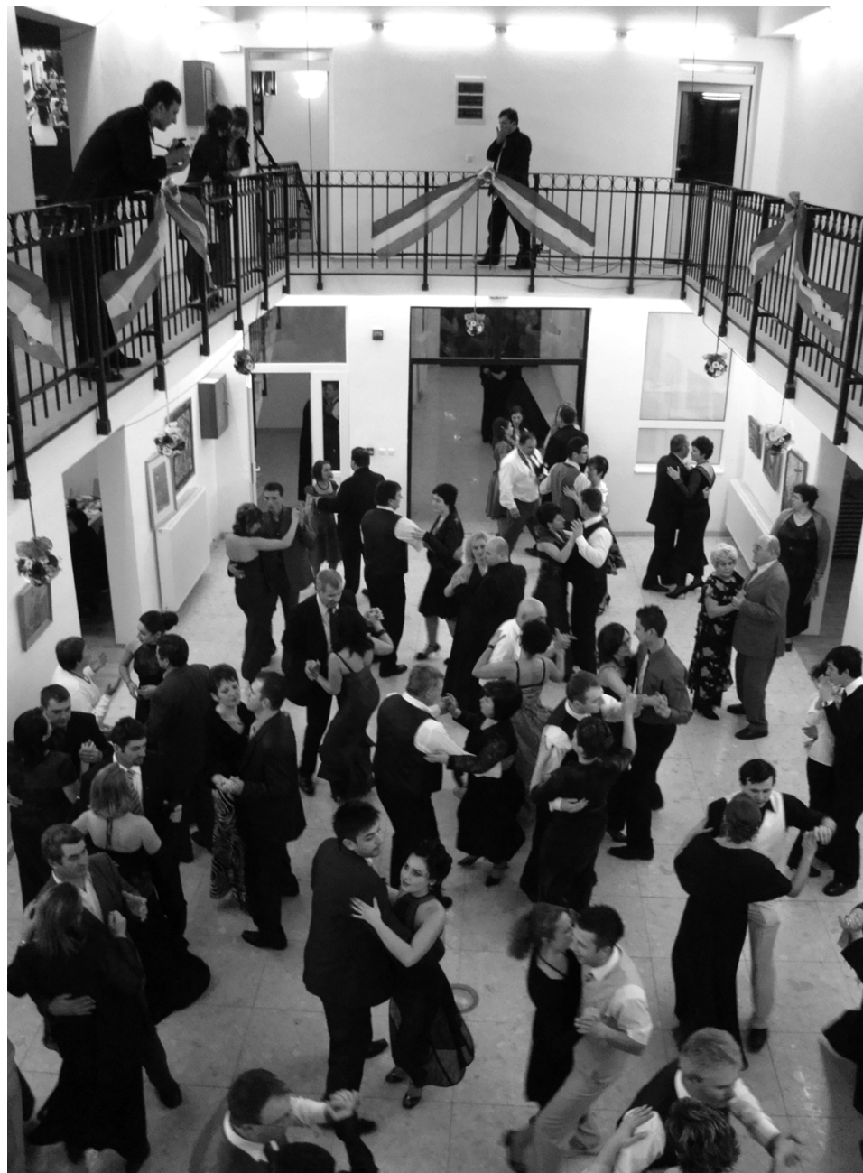
A jó hangulat sem maradt el, mindenki táncra perdült