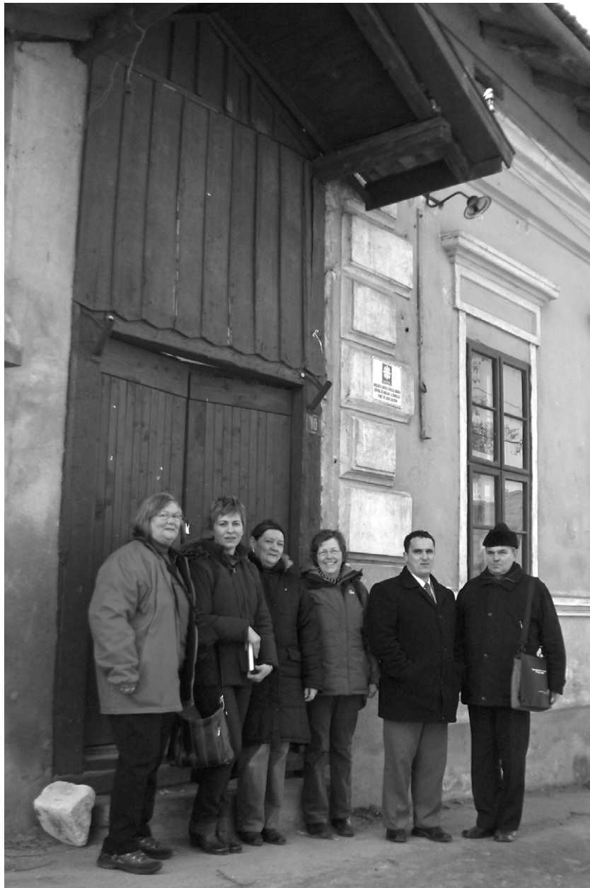
A Caritas Catolica küldöttsége az iroda előtt

A szolgáltatásaik akkreditálva vannak, szerződésük van a megyei egészségügyi biztosítópénztárral (CAS Bihor). Az egészségügyi biztosító (CAS) által elszámolt szolgáltatásokat a beteg nem fizeti. ✎