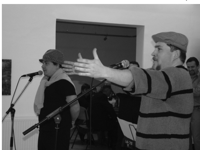
Az Open Stage (Székelylend) megnevetteti a közönséget