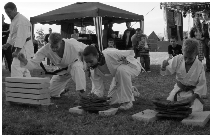
Mit bámulsz? Próbáld utánunk csinálni!