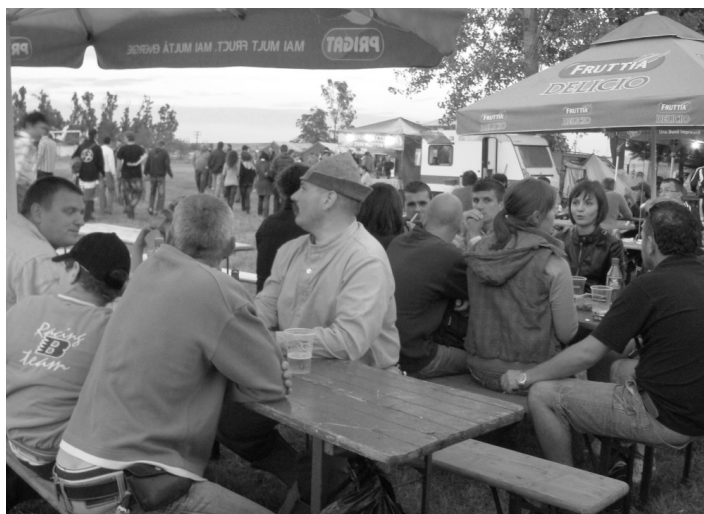
Itt az ideje egy sör melletti tereferének