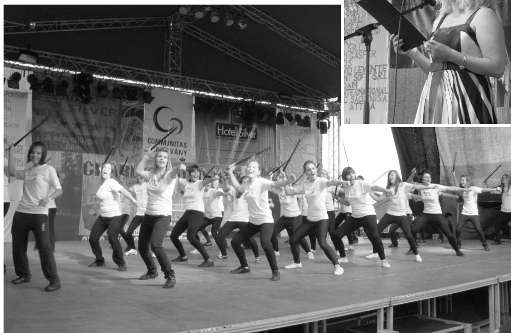
Együtt is táncoltak: a közönségkedvenc Flying Steps és a tiszalöki K!ng and Pr!nce Dance Team