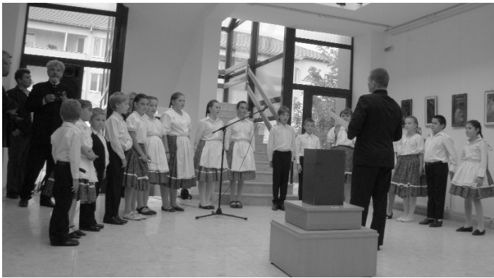
A múzeumban felcsendült a gyerekek által előadott népdal