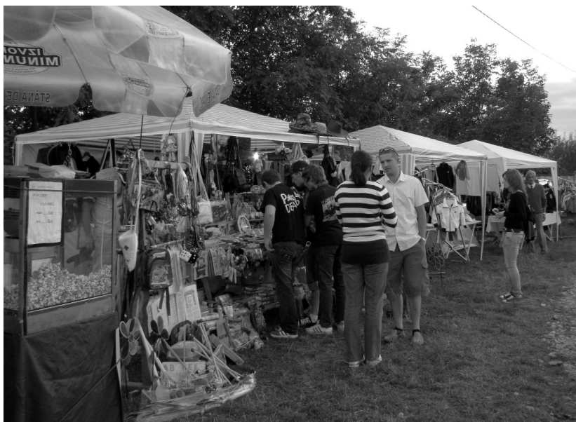
Az „üzleti soron” BÁRMI megkapható