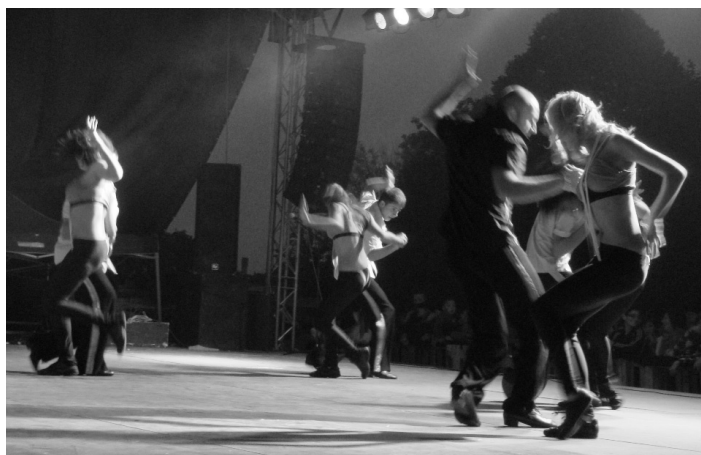
A Tankcsapda előtti művészi provokáció: Control Dance Group