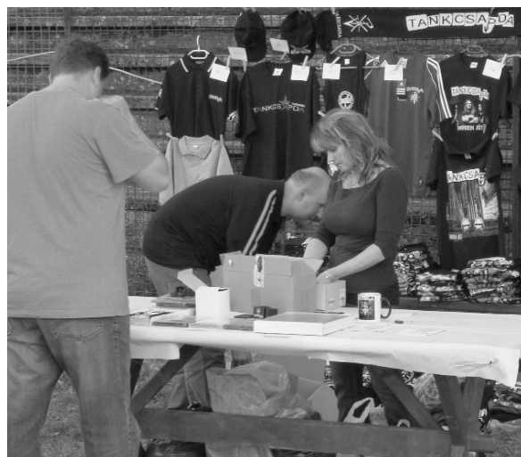
Tankcsapda-cuccokkal készülünk a koncertre