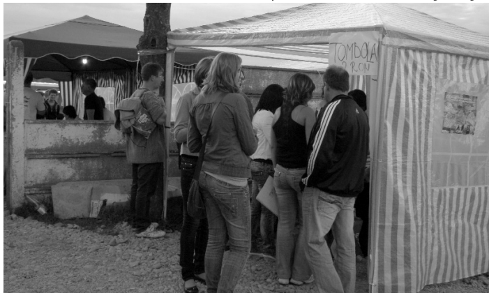
Illik útbaejteni őket: jegyáruda és információs pont, tombolával