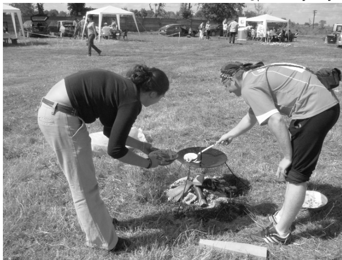
Tárctalapon készül a szalmakrumpli

* A legnagyobb népszerűségnek a szabadtűzi főzőverseny örvendett. A sportszarnok mögötti területet „kisajátító” versenyezni vágyó tizenöt szakács csapatok - köztük határon túliak is - gyakorlatilag bármilyen étellel nevezhettek a leves,