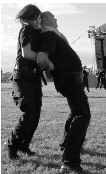
Tonfa-bemutató: hadd halljam, melyik is az ERŐSEBB nem?