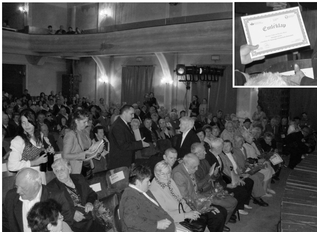
Az ünnepeleket díszoklevelet, virágcsokrot, egy palack bort és pénztalványt vehettek át