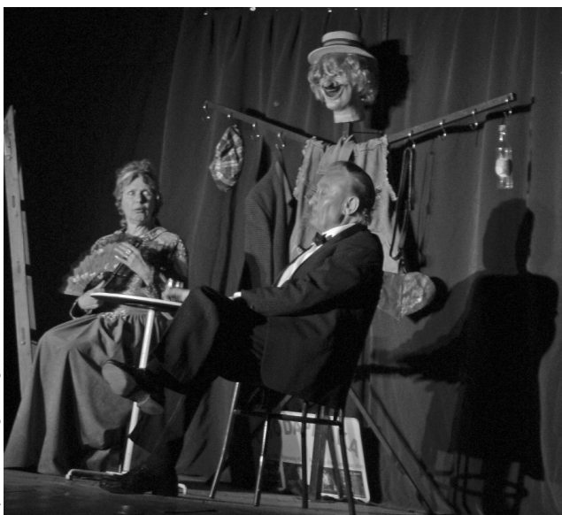
A szórakozást a váradi Kiss Stúdió művészei biztosították