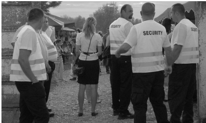
Nem könnyű belépni a csodák földjére