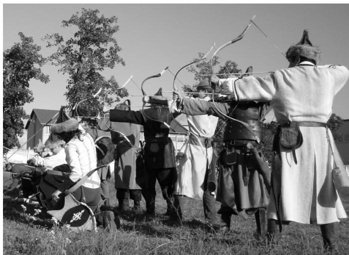
Hihetetlen, de mindig célba találnak ezek a Pusztai Farkasok