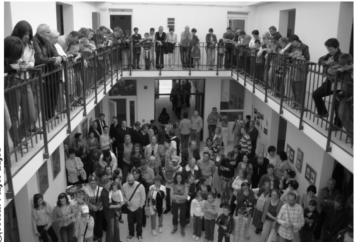
Nagyszámú művészetpártoló vett részt a kiállítás megnyitóján

lékmű előtt tiszteletüket tették és koszorúztak Székelyhíd, Érmihályfalva és Létavértes előljárói, a megnyitón felszólaló személyiségek, a Petőfi Sándor Elméleti Líceum és diáktanácsának vezetősége, továbbá a Dévai Szent Ferenc Alapítvány helyi csoportja és az Álmosdi Tűzoltó-egyesület is.