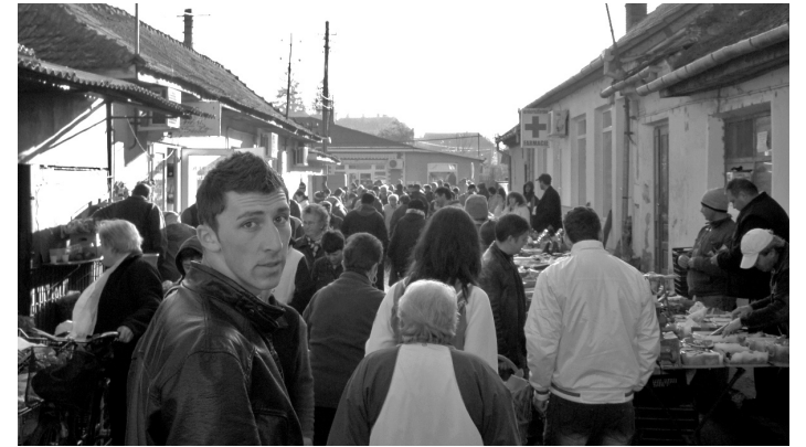
... és vásárlók is vannak bőven