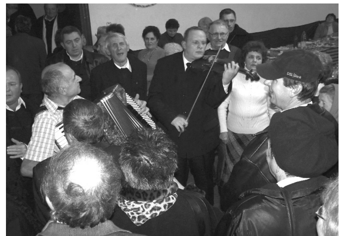
Közös éneklés a Munkás klubban