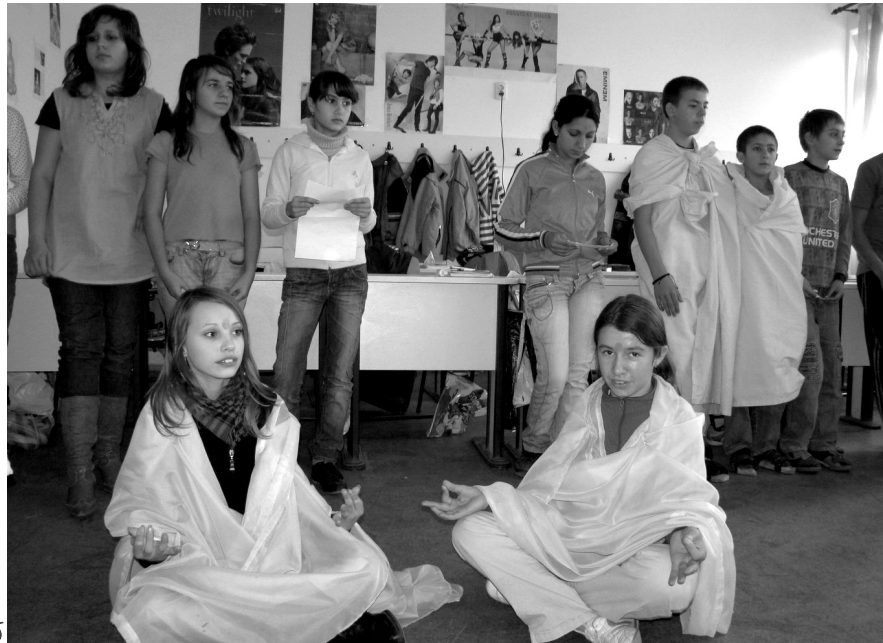
Megelevenedő történelem a Kul-túra egyik bemutatóján

Pénteken a manzárdban az iskolai pszichológusának jóvoltából