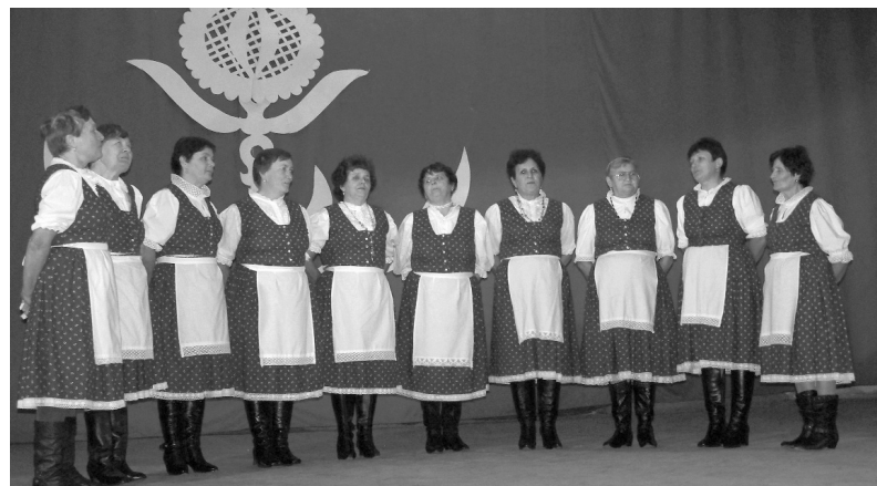
A székelyhídi Búzavirág Népdalkör