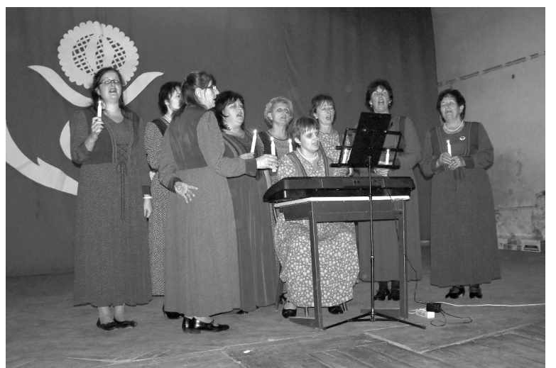
A létavérsesi Csormolya Népdalkör

A rendezvény csodálatos színfoltja volt a Székelyhídon idén először bemutatkozó kolozsvári Visszhang di-