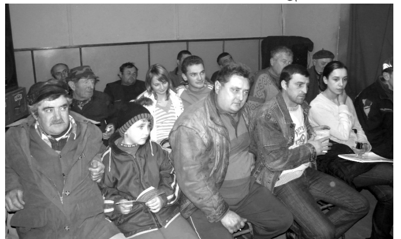
Népes érdeklődés a csokalyi fórumon

A kettős állampolgársággal kapcsolatban az információátadás mellett (lásd vonatkozó írásunkat) az előjárók megnyugtatták azokat az állampolgárokat, akik azért aggódnak, hogy ha igénylik a magyar állampolgárságot, elveszítik a román állampolgárságot. Ez a félelem alaptalan, a magyar törvény ugyanis a román kettős állampolgársági törvénykezés mintájára készült, továbbá az alkotmány szerint nem vonható vissza el a román állampolgársága azoknak a személyeknek, akik román állampolgárnak születtek. Érdekes, hogy a kettős állampolgárság mellett kérhetjük nevünk magyarosítását is (pl. Vasile = László). A székelyhídi önkormányzat szeretné szervezeten bizto-