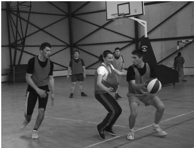
A sport sem maradt el

Remélem, semmit nem hagytam ki a rendezvény gazdag programjából, de ha igen, akkor elnézést. Mint az elején is mondtam, idén kicsit szerényebbre sikeredett a dolog, azonban bízunk benne, hogy jövőre kamatoszul be tudjuk majd pótolni. Végül pedig köszönetet szeretnék mondani a szervezőknek és a résztvevőknek egyaránt, elvégre kettőn áll a vásár.