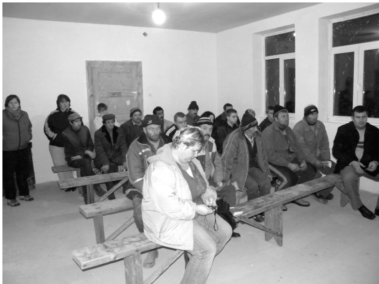
Az érolaszi falugyűlés résztvevői