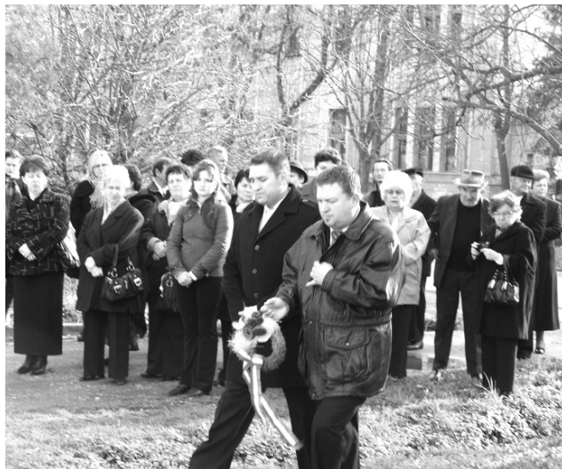
Koszorúzza tisztelegnek a költő előtt