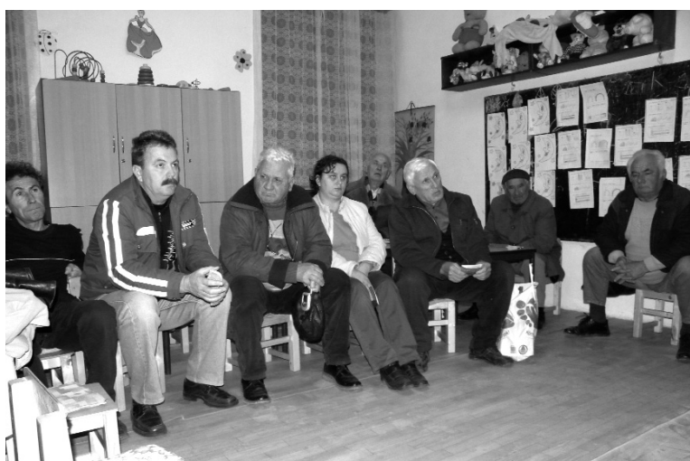
Az egyik székelyhídi fórumon jelenlevő polgárok