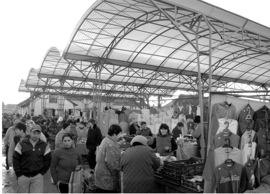
Ahol mindenféle portéka megtalálható

✱ Székelyhídon a keddet és a pénteket emberemlékezet óta piaci napként emlegetik. Elég régi hagyomány ez városunkban, legalább húsz éve, tehát valószínűleg a rendszerváltás óta ez így van, és ez rendben is van így. Mivel hamarosan nagy változások lesznek a piacon, gondoltam meg kellene örökíteni a jelenlegi állapotot, és ezt elárulni a kedves olvasónak a jövőből.