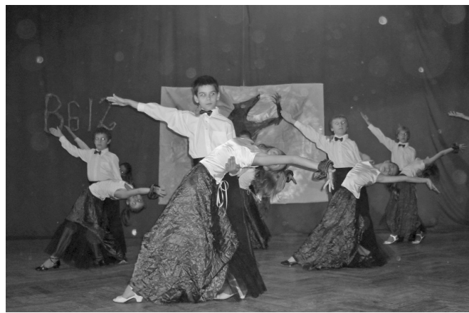
... és tánc, tánc, tánc