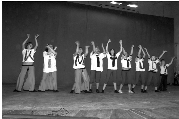
A csokalyi Fresh Dance