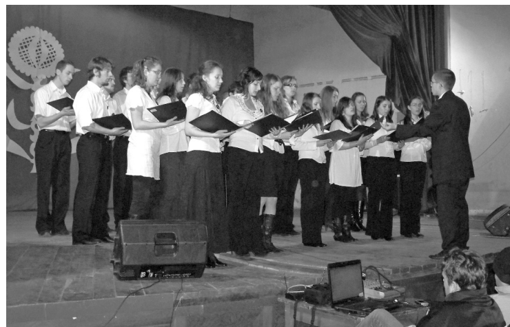
A Visszhang kórus Kolozsvárról