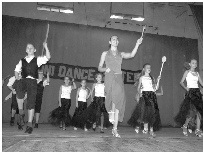
Kicsik és nagyok egyaránt örömmel táncoltak, hogy segíthessenek