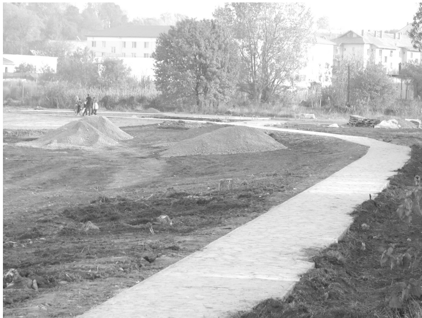
A járda egyik része már kész is van

Folytatás az 1. oldalról A csemeteültetést és füvesítést jövő tavaszra tervezik.