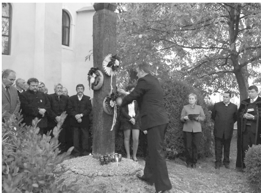
Számos koszorút helyeztek el a kopjafára