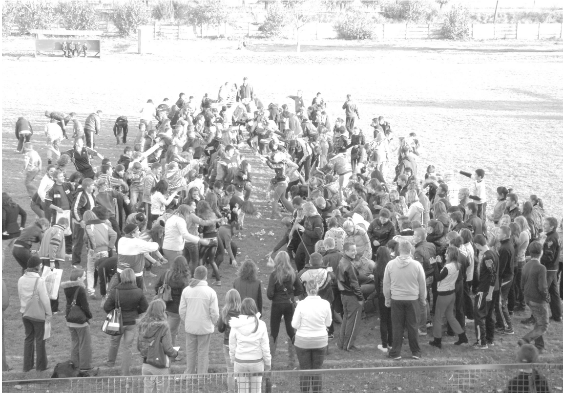
Tömeges szabadtéri szórakozás