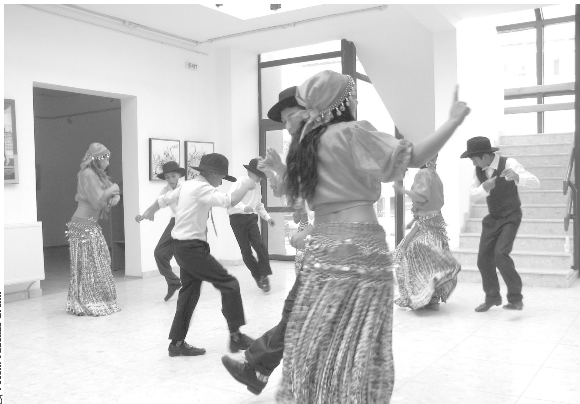
A roma iskolások lendülete

☼ Hatodjára rendezte meg Székelyhídon az Érmelléki Nemzetiségi Néptáncfesztivált a Pro Székelyhíd Egyesület október 8-án, szombaton.