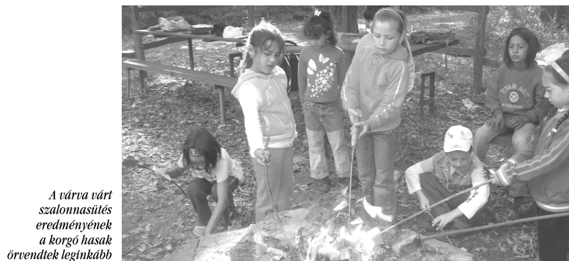
A várva várt szalonnasütés eredményének a korgó hasak örvendtek leginkább