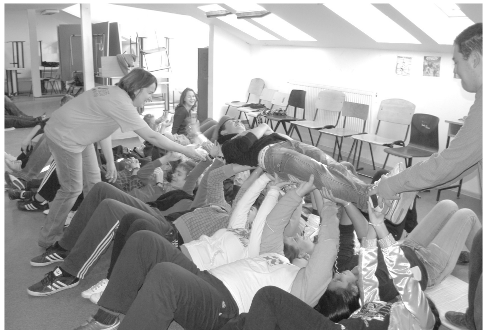
A futószalag nevű játékhoz bizony „erőtlen” csapatmunka szükséges