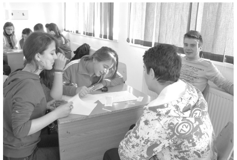
... és benn

A jó időnek hála, a játékok nagy része a szabadban folyt, de persze nem mindent lehetett odakinn megoldani. Így aztán a tevékenységek közötti rö-