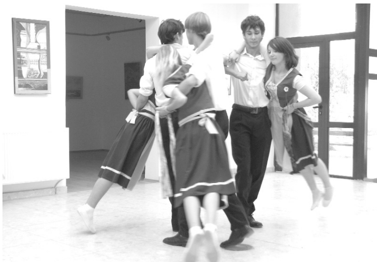
Kiemelkedett a német Szivárvány Néptáncscsoport előadása

Őket követte a monospetri Szivárvány Néptáncscsoport, akik régi viszatérői a rendezvénynek, ők az érmelléki német nemzetiség dalait, táncait, viseletét ismertették meg az érdeklődőkkel.