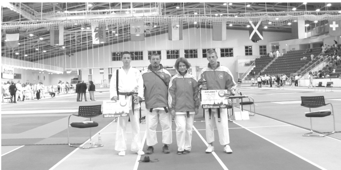
A székelyhídi csapat a világbajnokság helyszínén

1. Mindenképpen egészségükre válik a mozgás, a jó kondíció, még az ortopéd orvosok is ezt ajánlják a helyes testtartás érdekében.