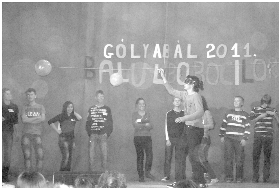
A beavatás egyik próbája