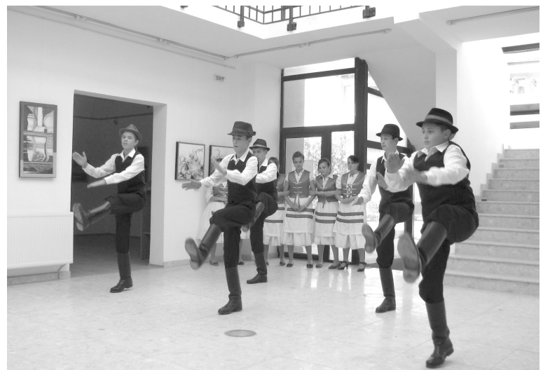
A nagykágyai fiúk legényest táncolnak