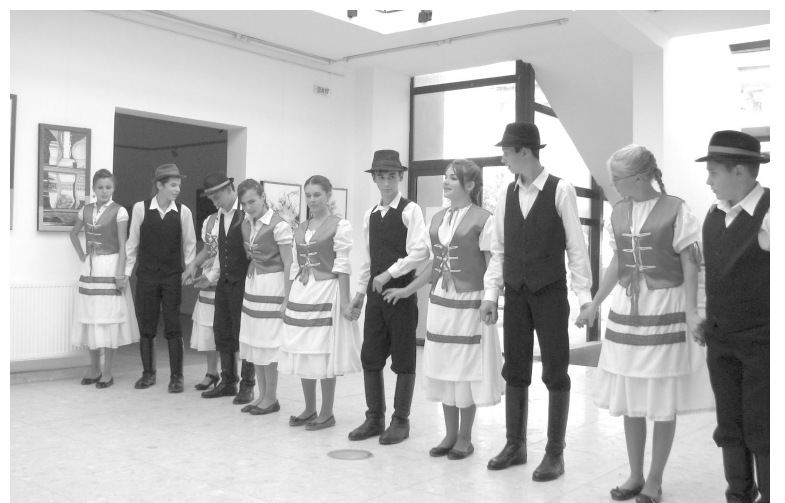
Sorba áll az összes „harmatcsepp”