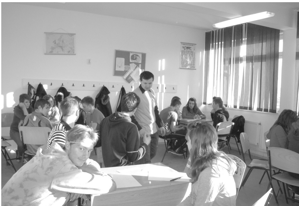
Ugyan lehetett kérni a tanár segítségét, de...