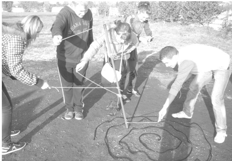
A gyerekek közös erővel jutnak be a csigaházba

A játéknapi tevékenységek közül három tematikus program volt: médiatudatosság, tolerancia, fenntartható fejlődés. Ezekben a játékokban a diákok behelyezkedhettek a média szerepébe vagy elgondolkodhattak a nehéz sorsú, előítéletekkel gátolt emberek életén, de egy hivatalos vitán is részt vehet-