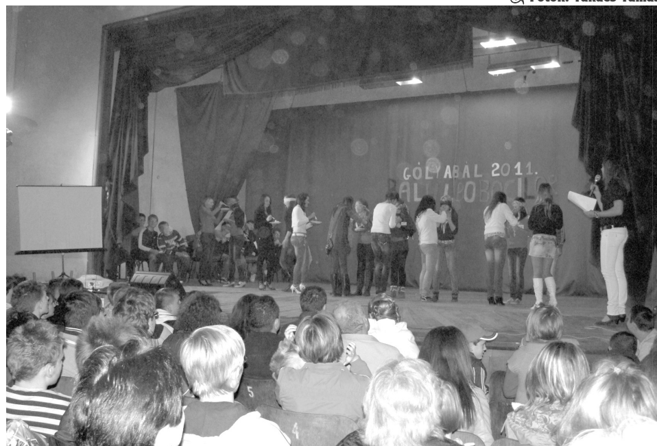
A páros táncok sem jelentettek akadályt

* Mind a gólyák, mind pedig a szervezők nagy örömmel várták a székelyhídi Petőfi Sándor Elméleti Liceum Gólyabálját, amelyet az Ady Endre Művelődési Házban tartottak október 28-án, pénteken 18 órai kezdettel