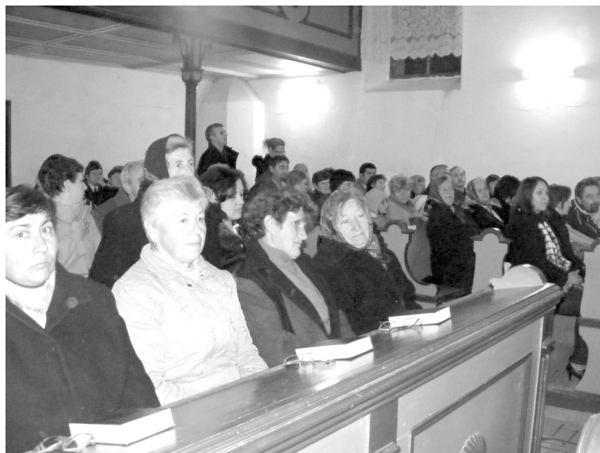
A közösség ereje: megtöltötték a zenekedvelők a templom padjait

* Jótekonysági orgonakoncertet szervezett Hegyközszentmiklóson október 30-án az Érmelléki Református Diakóniai Alapítvány.