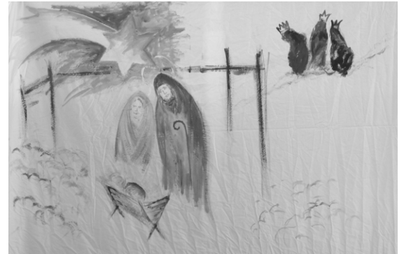
Az időutazás képei: szálláskeresés Bethlehemben

nagyszakállú, piros ruhás, pocakos Mikulás, akinek zsákja tele volt mindenféle jóval, a gyerekek nagy örömeire.