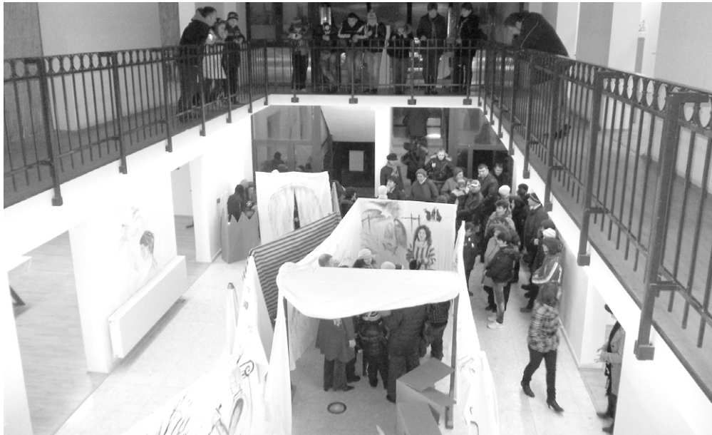
Karácsonyi időutazáson a gyerekek a múzeum épületében

Hétfőtől csütörtökig az érolaszi, érköbölküti, hegyközszentmiklósi, csokalyi, nagykágyai, illetve székelyhídi óvodások és elemi iskolások zenés-verses előadásait láthattuk a felállított színpadon, akik hol szégyenlősségükkel, hol gyermeki komolyságukkal és talpraesettségükkel csaltak mosolyt nem túl nagyszámú közönségük arcára, és nem ritkán könnyet a nagymamák szemébe. Minden osztályt előadása után átkísértek a múzeumba, ahol meglepetéskiállítás várta őket, melyben egy karácsonyi időutazásnak lehettek részesei. Hangulatos zene mellett a gyerekek meghallgathatták, s néha maguk is mesélhették a kis Jézus születésének történetét és arról is szó esett, hogy mi is a karácsony, azaz a szeretet ünnepe. A kiállítás érdekességét az jelentette, hogy a történet különböző epizódjait a gyerekek képeken is megtekintették, sőt maguk is végigjárhatták Mária és