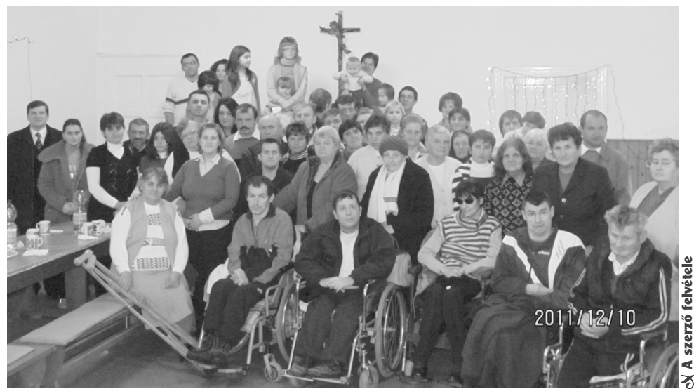
Meleg, családi hangulatban telt a fogyatékkal élők összefoetele