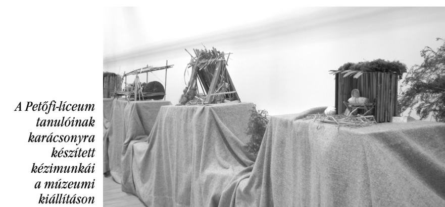
A Petőfi-líceum tanulóinak karácsonyra készített kézimunkái a múzeumi kiállításon