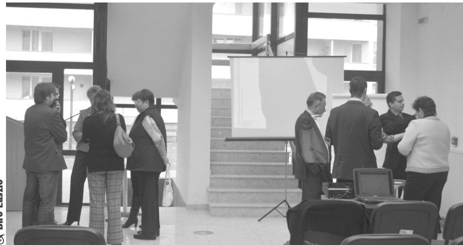
Kötetlen beszélgetés a műhelymunka résztvevői között

A térségi közbiztonsági rendszer kiépítése témakörben a jelenlevők az ilyen jellegű civil