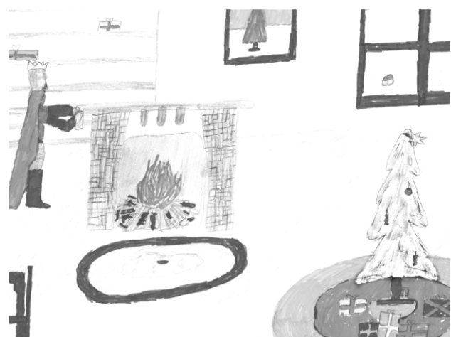
✎ Rheindt Arnold-Otto rajza

János király nem volt jó – Karácsony reggel Eljött vidáman s számtalan Szép ajándék vele. A harisnyákban játékok, Sok-sok kíváncsi szem Mindentre boldogan tekint, János mogorván mondja: „Mint Sejtettem, úgy történt, úgy történt megint: Számomra semmi sem.”