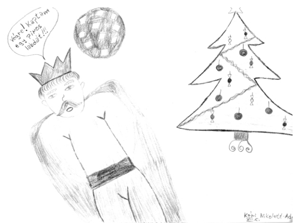
✎ Kéri Nikolett Adél rajza

„Szerettem volna puskát és egy kis édességet és egy kis csokoládét a szopogatás végett; kértem diót, narancsot, mert nagyon szeretem, és minthogy nincs zsebkésem, hát nem is szeletelt. És, ó, Karácsony Apó nem hozott kegyesen Egy igazi nagy piros gumilabdát nekem!”