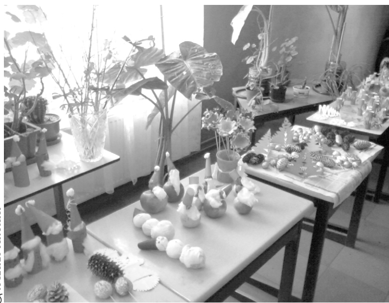
☞ A szerző felvétele

Számtalan érdekes munka került ki a kis kézművesek keze alól