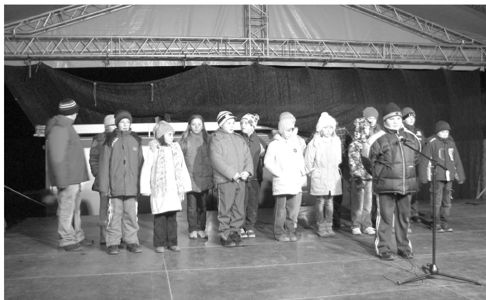
Székelyhídi IV. osztályos tanulók ünnepi műsora