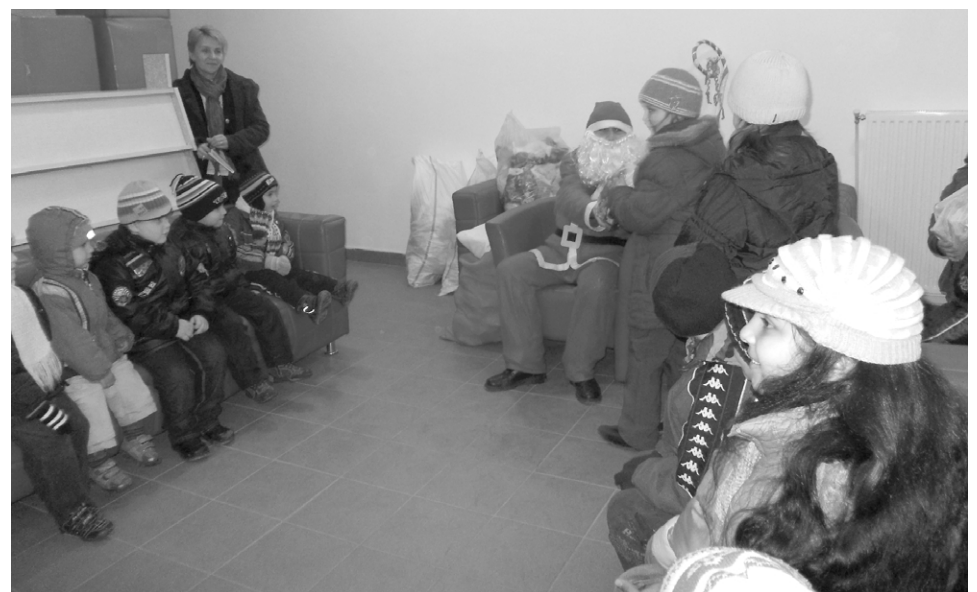
A Mikulás átadja a gyerekeknek az önkormányzat karácsonyi ajándécsomagjait