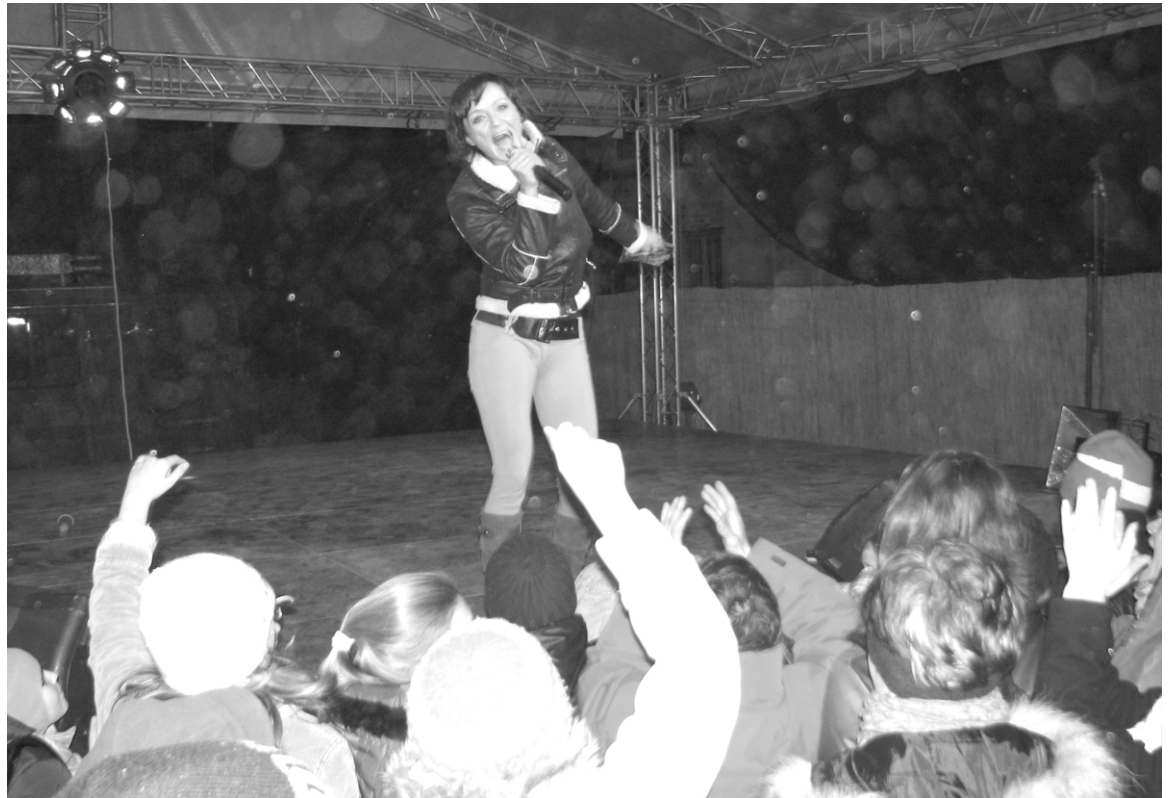
Elbűvölte a székelyhídi közönséget a jó humorérzékű Szandi

Az est sztárvendégét ekkor már mindenki nagyon izgatottan várta, hiszen a magyarországi énekesnő, Szandi eddig még nem lépett fel városunk színpadán. A mosolygós, közvetlen, jó humorérzékkel megáldott művésznő jópofa történeteivel azonnal levette a közönséget a lábáról. A koncerten összegyűltek kortól és nemtől függetlenül tapsoltak a dalok között. A legnagyobb tombolást a legkisebbek produkálták, akik, bár a számok nagy részét nem ismerték, a színpad előtt örömtől csillogó szemekkel csápolgáltak és táncoltak. De nemcsak ők adtak hangot tetszésüknek, a tömegben sétálva ugyanis több elejtett, dicsérő és elismerő mondat tanúskodott arról, hogy az idősebb generáció is jól szórakozott a koncerten. A hideg ellenére is nagyon sokan hallgatták az