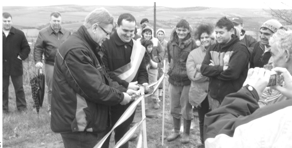
A hivatalos szalagátvágás után birtokukba vették a házakat új lakóik

* Négy új, két-két család számára tervezett lakóházat adott át hegyközszenmiklósi roma családoknak a hollandiai Teréz anya alapítvány december harmadik hétfőjén. A nagy költségvetésű külföldi projekt első lépése nyomán így nyolc szerencsés család kerül a nyomorból most normális életkörülmények közé. A helyi roma közösség tagjait Szentmiklós határára a zuhogó eső sem akadályozta meg, hogy ünnepeljenek.