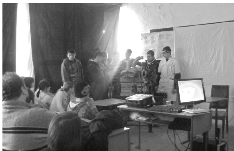
Filmvetítés és szemlélet a dízelmotor fejlődéséről