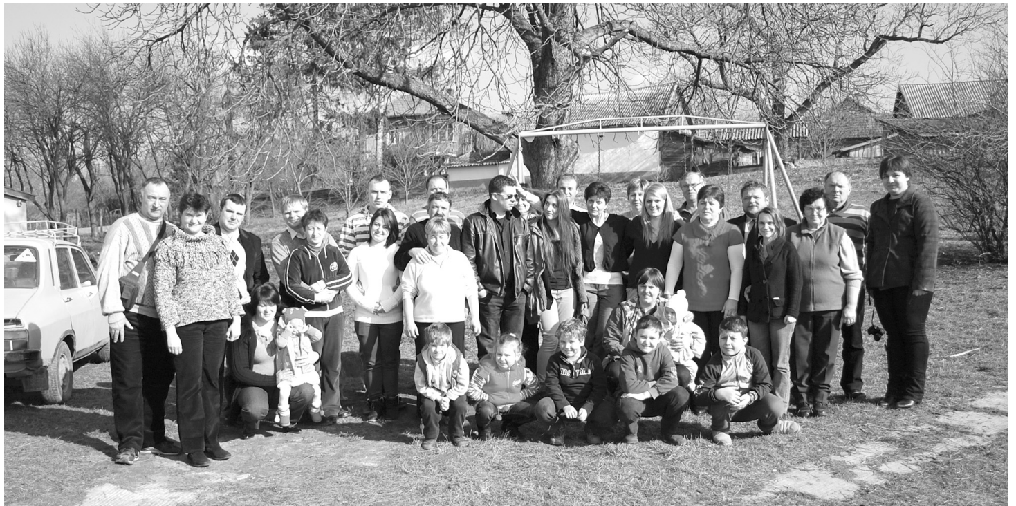
Magyarországi vendégek és házigazdák baráti, családi hangulatban – kölcsönösen hasznos Cserhátaláp és Érolasz együttműködése

Az estére tervezett program keretében a helyi vállalkozókat várták sok szeretettel egy ünnepi vacsorára, ahol megismerkedhettek és kapcsolatokat alakíthattak ki magyarországi baráta-