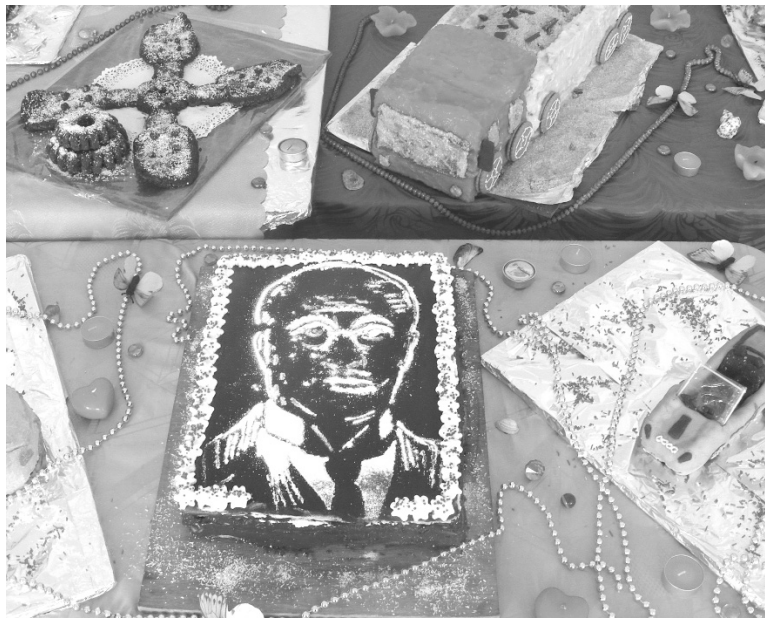
Édes tisztelegések között torta Rudolf Diesel mérnök képmásával

* Ünnepi eseménysorozattal emlékezett meg Rudolf Diesel német mérnök halálának 100. évfordulójáról, és az általa 120 éve megépített első levegősűritéses motor prototípusáról február 26-án a Nagykágyai 1. Számú Technológiai Líceum.