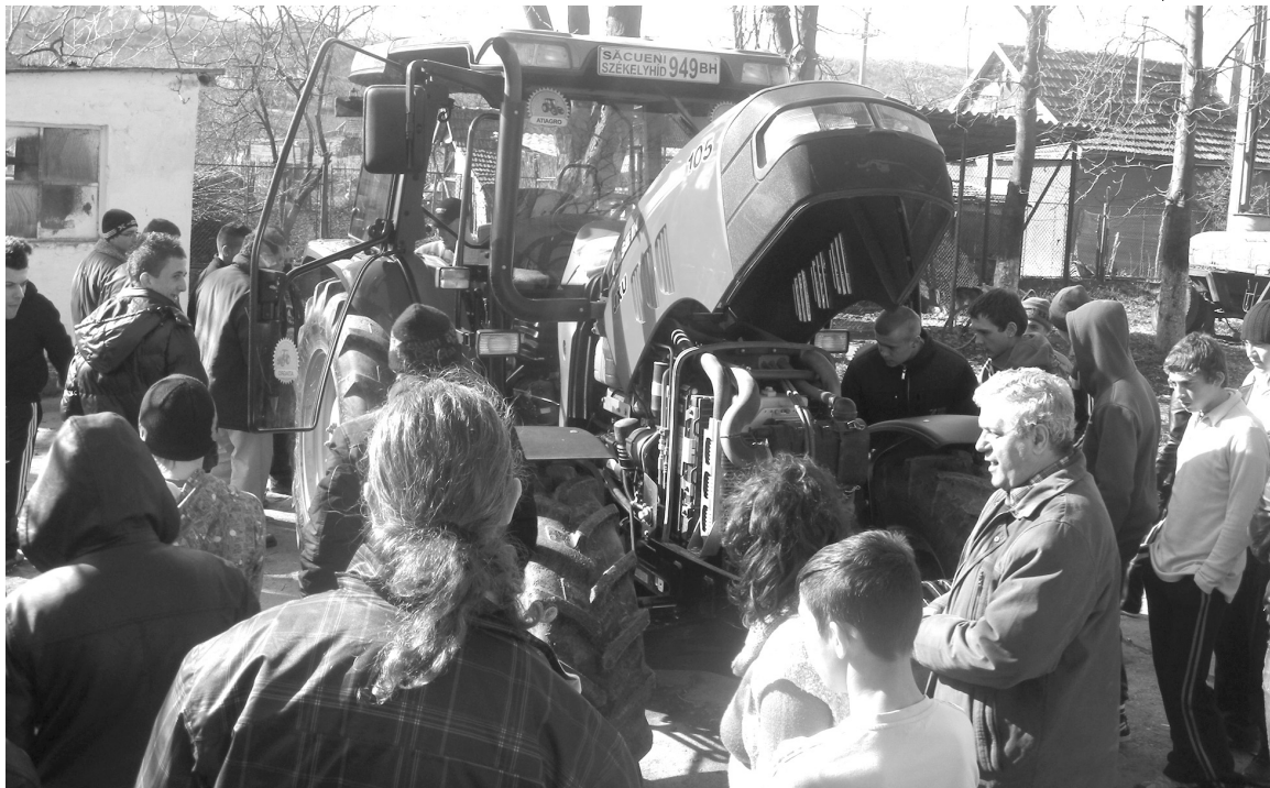
Számos érdeklődőnek magyarázták a XII. osztályos diákok a traktor működését az iskolaudvaron

A rendezvény az élelmiszer-ipari diákok látványos kiállításával zárult, ahol sikerült a mechanika szakot egyesíteni az élelmiszeriparral. A di-