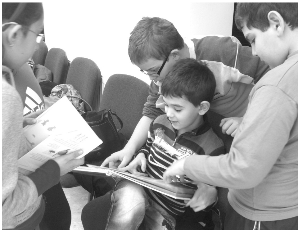
A legfiatalabb könyvmolyok azonnal lecsaptak az újdonságokra