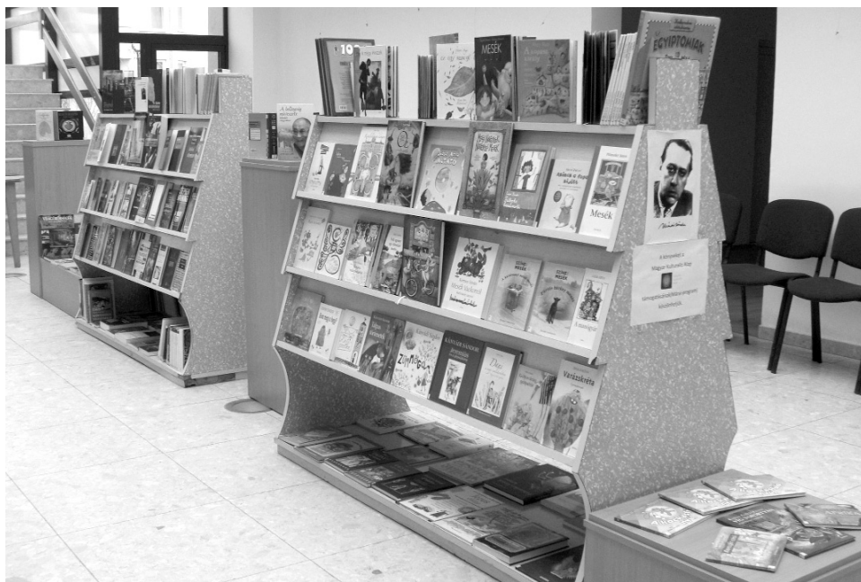
A Márai-program keretében újra sokszínű könyvállománnyal gazdagodott a könyvtár