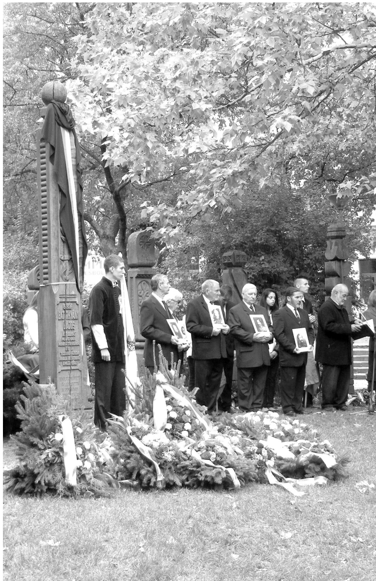
Koszorúk a Batthyány Lajos miniszterelnök és az aradi tizenhárom emlékére állított kopjafájánál

☞ A Petőfi Sándor Elméleti Líceum oktatói és diákjai meglátogatták a tatabányai testvériskolát