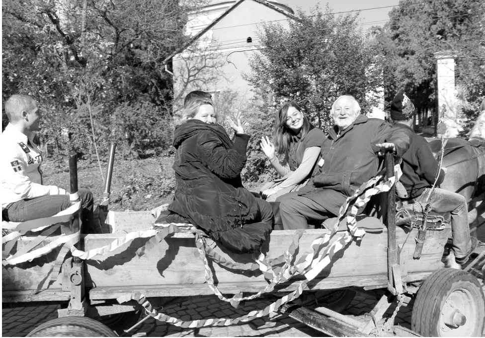
☞ A szerző fényképe

☞ Székelyhídon vendégeskedtek a belga, magyar, német és olasz küldöttségek