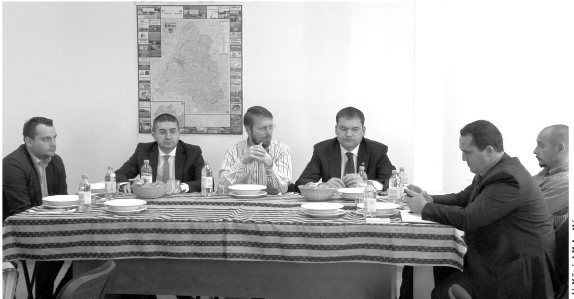
A megbeszélésen Bihar megyei RMDSZ-es vezetők és pályázati szakemberek vettek részt