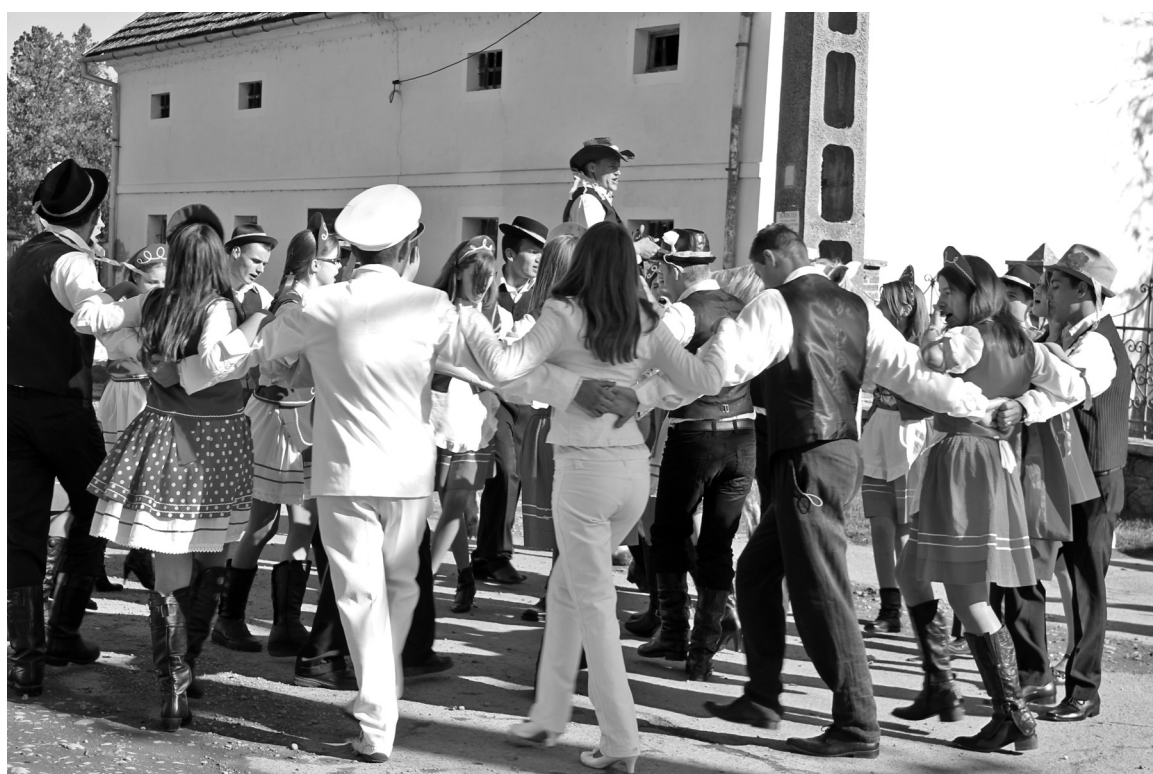
Fiatalkok hívogadják a falu lakosait a szüreti bálba

* Szüreti bált szerveztek Csokalyon, a fiatalok szorgalmasan készültek a nagy napra, heti 3-4 alkalommal tartottak próbát, ami csapattá kovácsolta őket. Október 18-án, szombaton kora délután indult a felvonulás Csokaly utcáin, elől a postás, utána a hagyományos viseletbe öltözött fiatalok. Az ünneplők régi szüreti bá-