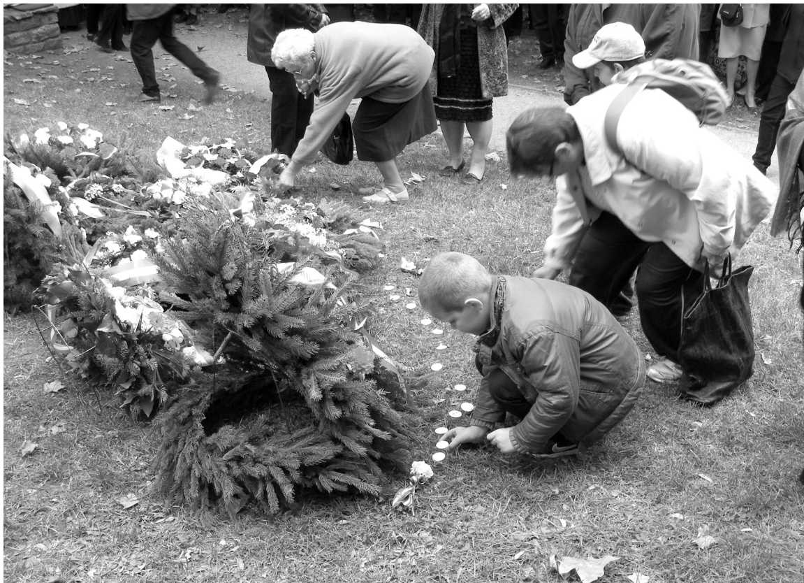
Ég a sok mécses a vértanúk emlékére

A Tatabányán töltött hétvégén a székelyhídi diákok és tanáraik a Háttalanul pályázat keretében ellátogattak a bányászati múzeumba, a komáromi termálstrandra és megnézték a méltán híres, Közép-Európa legnagyobb madarat ábrázoló szobrát, a Turul-szobrot is. Ugyanakkor eljutottak az esztergomi bazilikába, megnézték a Duna magyar és felvidéki oldalán található Komárom/Komárno nevezetességeit, többek között a monostori erődrendszert is.