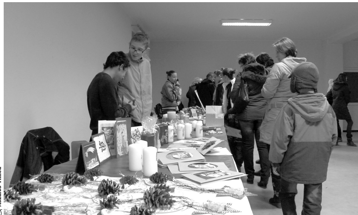
A gyerekek örültek, hogy a vásárlóknak tetszetek saját készítésű munkáik