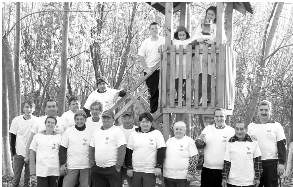
Példáan összefogtak a Legelő városrész tette kész lakosai