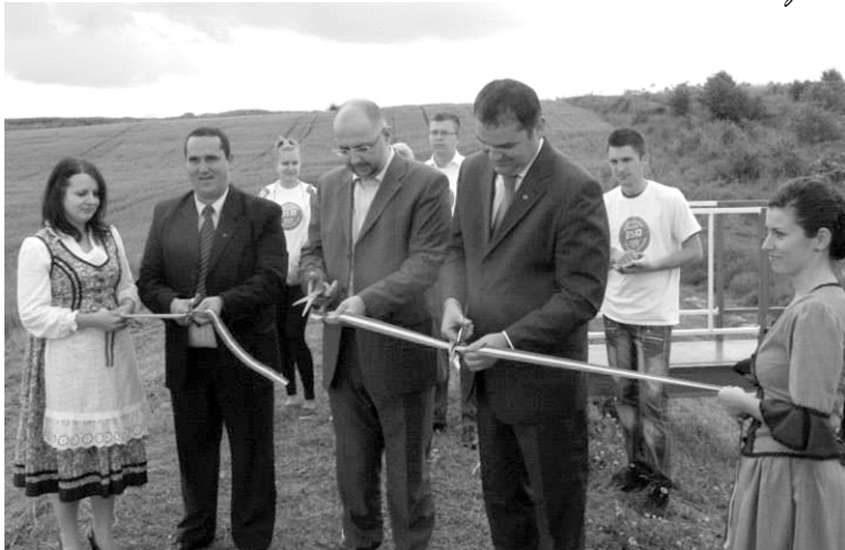
Ünnepélyes szalagvágás az egyik lassítógátánál

a szennyes a szennyeskosárból kibukik. Ez a gát is, amikor nincs rá szükség, akkor csak egy földhalom, amikor viszont esik a torrenciális eső, amikor jönnek a záporok, zivatarok, és az árvíz jönne, fenyegetné Székelyhídat, akkor lesz egy áldás városunk számára, és hogy ezt meg sikerült valósítani, ennek nagyon-nagyon örülünk.”