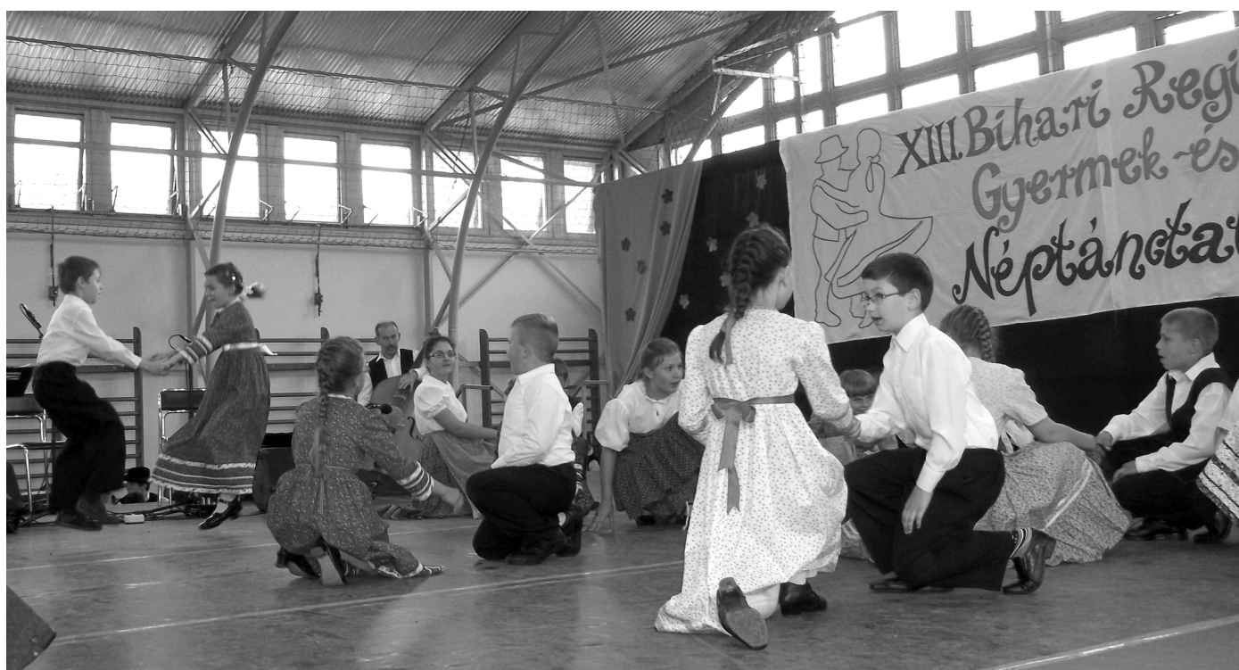
A kis néptáncosok élvezettel léptek fel a bibarkeresztesi néptánc Találkozón

Először lépett színpadra a székelyhídi néptáncscsoport a XIII. Bihari Regionális Néptánc Találkozón, Biharkeresztesen május 17-én. A tavaly őszi alkult csoport tíz párral képviseltette magát a találkozón. Művészeti vezetője