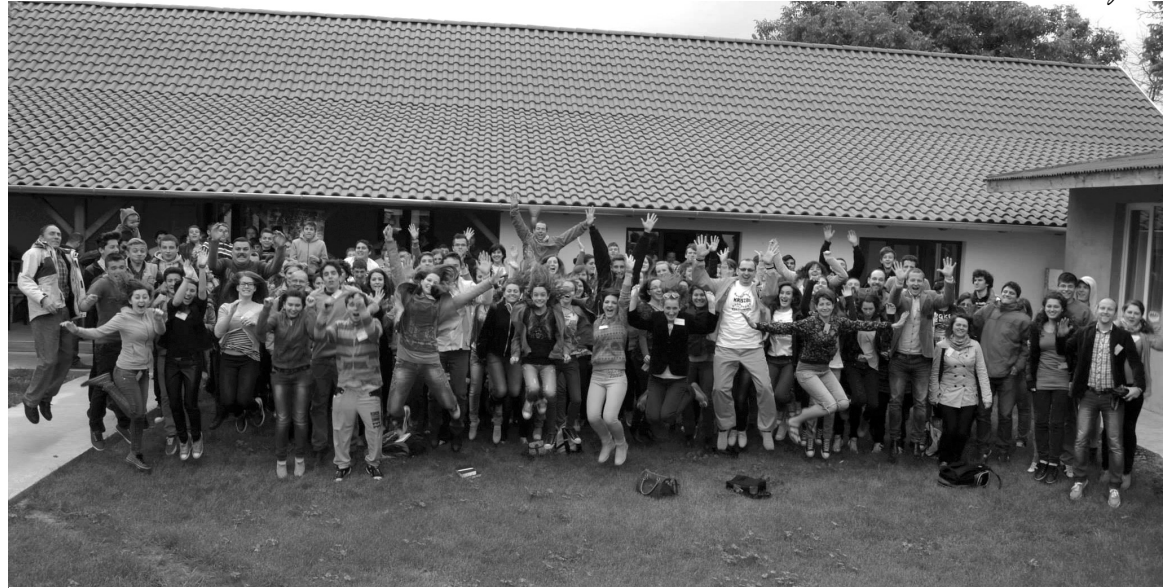
FÜGGŐleges hősök csoportképe a konferencia végén

Hatalmas hősrobbanás „rázta meg” Székelyhídat, hiszen itt rendezték meg az idei FÜGGŐleges Keresztény Ifjúsági Konferenciát május 16–18. között. Az évente megrendezendő találkozó mindig más helyszínen és más témákkal várja a fiatalokat egy közös együttlétre, ahol különböző életkérdésekre, miértekre keresik a válaszokat. A rendezvény neve az Istenhez való kötődésre, függőségre utal, de a felekezeti hovatartozás nem jelent akadályt. A CE szövetség szervezésében a környező településekről közel kétszáz, tizennégy-tizenkilenc év közötti fiatal érkezett a helyi református parókiára.