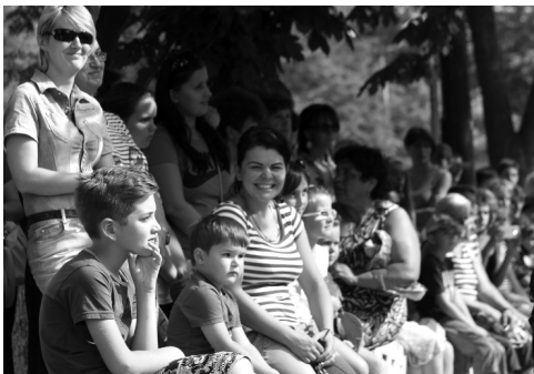
A megnyitó felszabadultan vidám közönsége