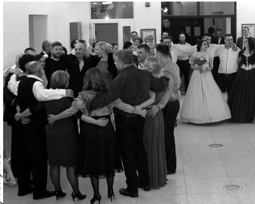
A bálozók gyakran egymásba fonódva táncoltak

Kétszázötven résztvevővel zajlott a jótékony célú kultúra napi bál