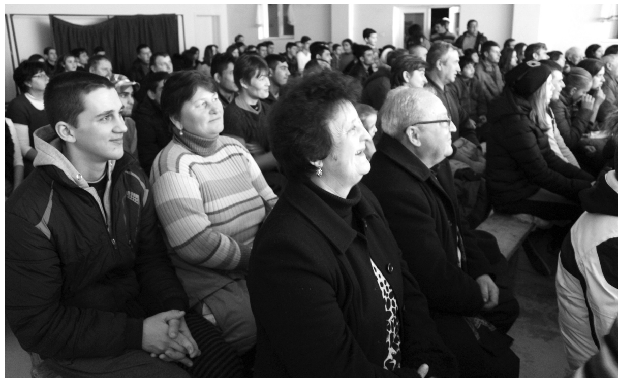
Számosan szórakoztak a januári előadáson