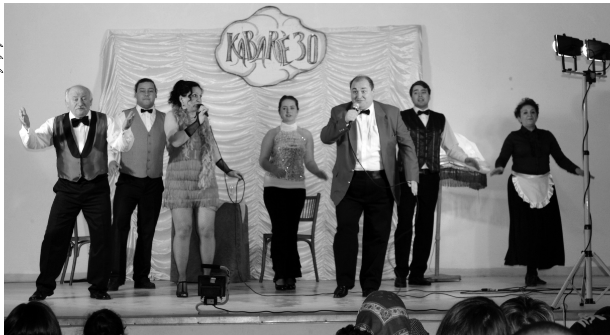
Az MM Pódium művészei visszatérő vendégei a falunak

Igényesen szórakoznak a Nagyváradi MM Pódium Színház mulattató előadásán