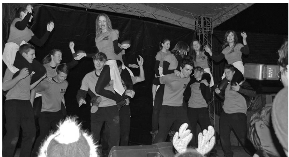
A TDC táncosai látványos koreográfiát adtak elő

Így telt az ötödik karácsonyi vásár 2015-ben Székelyhídon, amelynek felhozatalában kicsi-és nagy, öreg és fiatal egyaránt megtalálhatta a neki legmegfelelőbb programot. A nyolcnapos vásár idején naponta több százan fordultak meg. Színvonalas kulturális műsorok és nagy választék fogadta a látogatókat. A vásár jó eredményekkel zárta kapuit.