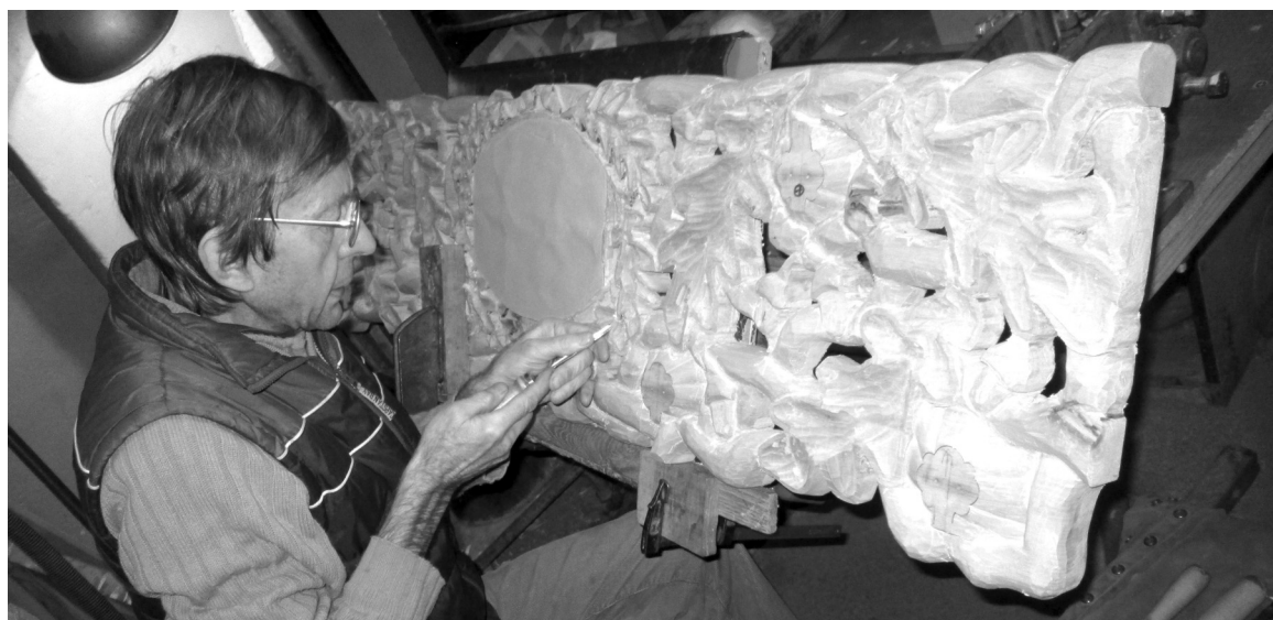
Aprólékos munkát igényel a címeres fogas elkészítése