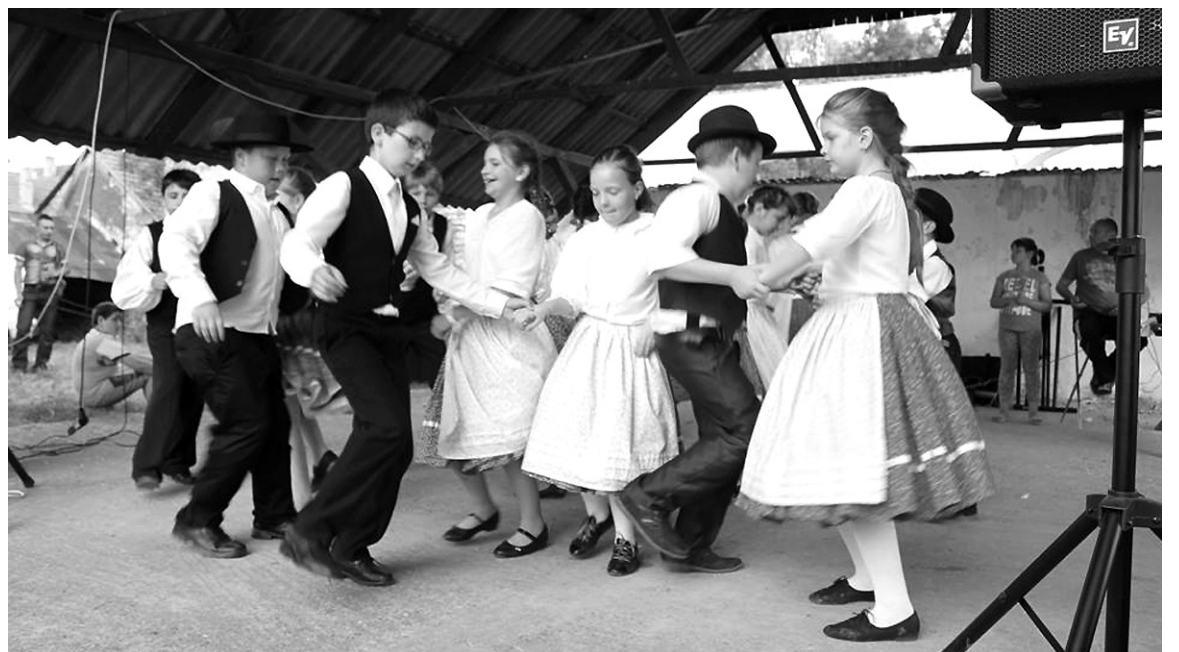
Szilágyságit roptak a székhelyi néptáncosok

A gyermekek sem unatkoztak, hiszen a szervezők rájuk is gon-