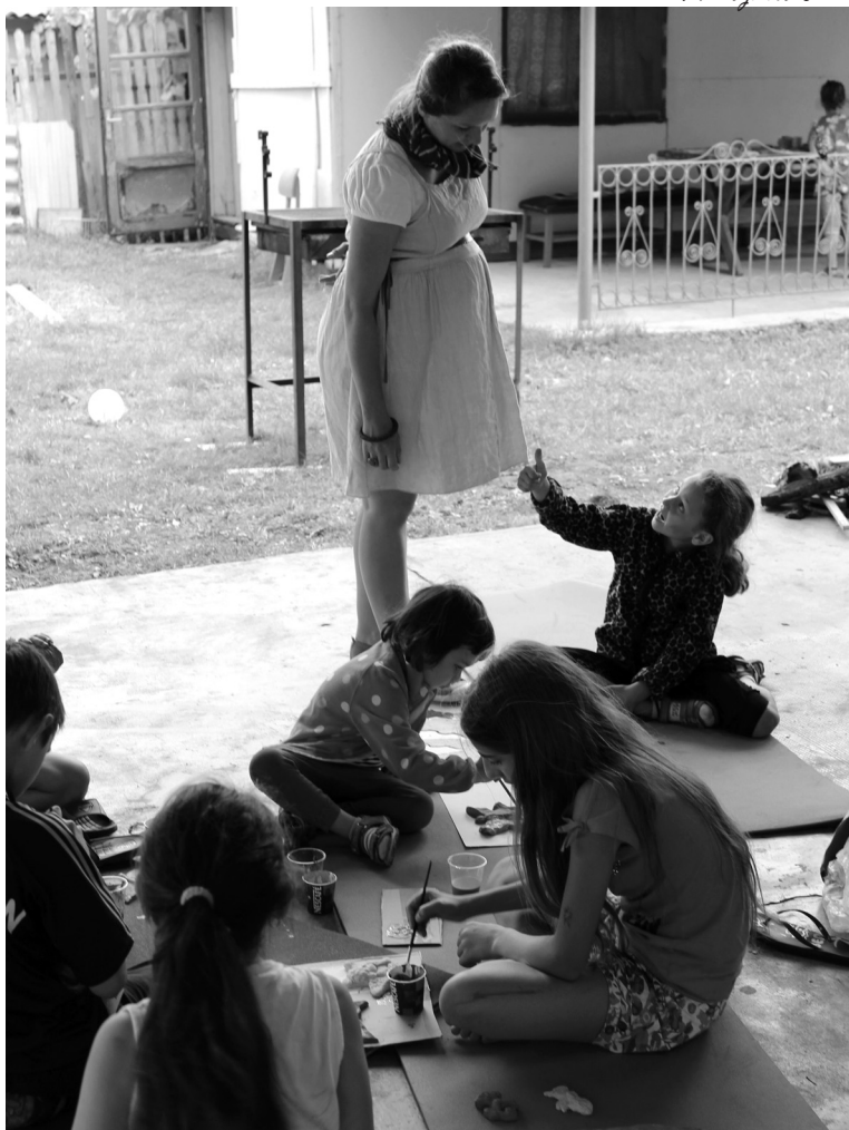
Festgetnek a kis művészek

Azóta egy-egy év kihagyással rendszeresen érkezhettek gyerekek a különböző székelyhídi helyszínekre, ám a kisebb szervezésben felmerülő problémák mi-