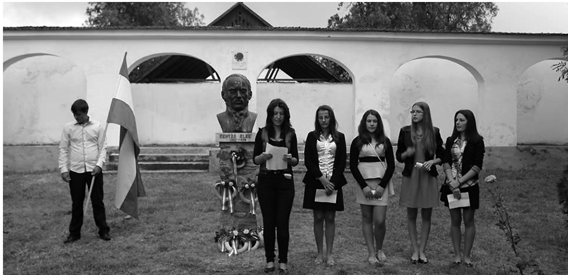
A csokalyi fiatalok versekkel emlékeztek Fényes Elek statisztikusra

ben, és elnyerhetjük az örök mennyei életet” – jött a válasz a szöszékről.