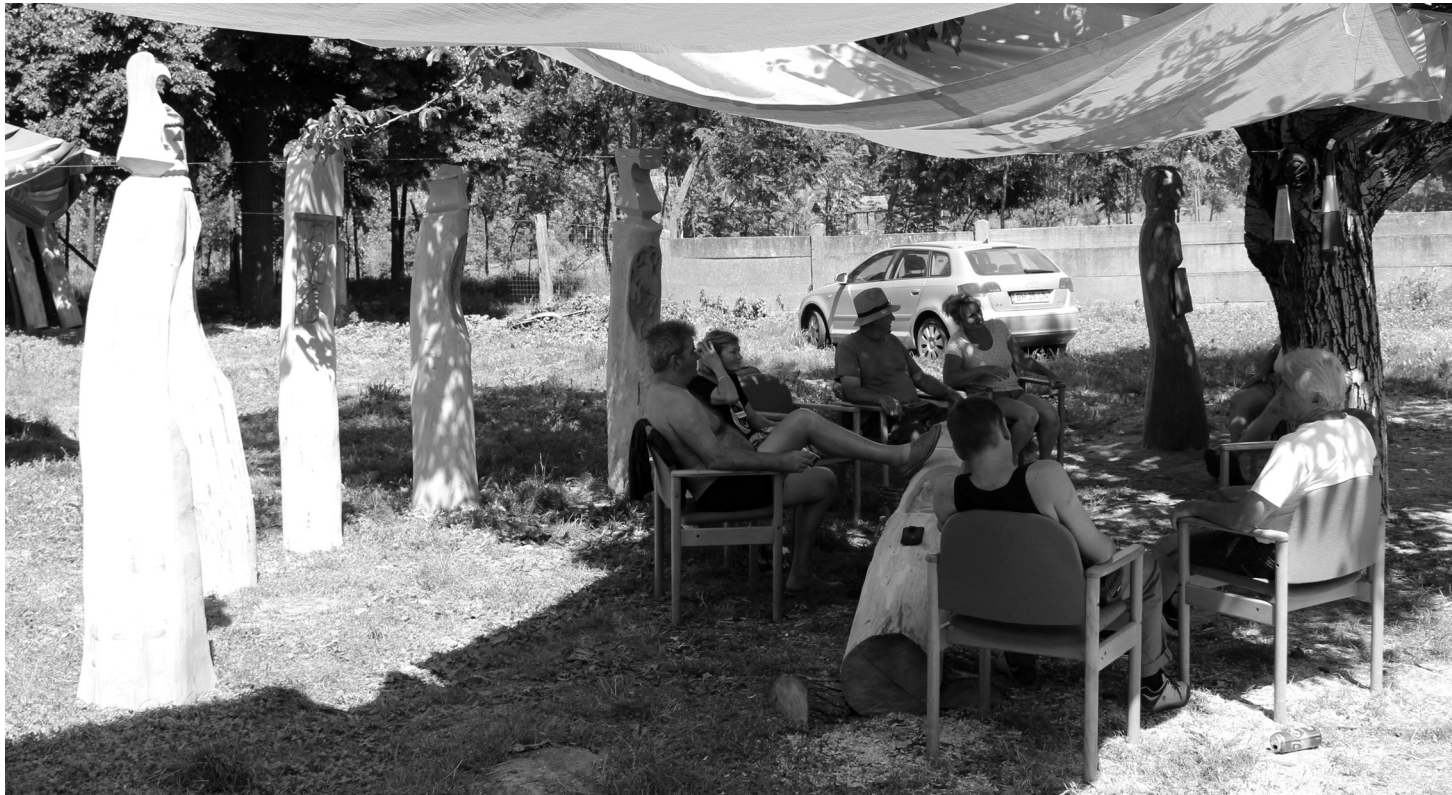
Szusszanásnyi pibenő a nyári bőségben két forgácsröppentés között