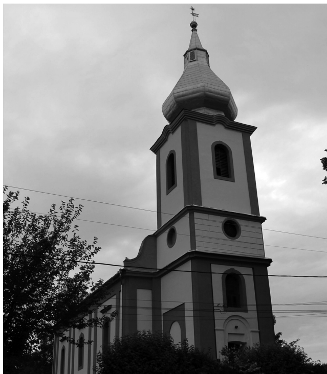
Magyar nemzeti színekben pompázik az istenháza

Eközben az istenháza állapota láthatóan romlott, elodázhatalanná vált annak teljes tatarozása. Az imádkozás helyét 1823-ban építették a hithű protestánsok, utoljára közel negyven évvel ezelőtt végeztek rajta javítási munkálatokat. Ahogy Érmellékszerre tapasztalható a sík területekre épített, nem megfelelően szigetelt régi épületeknél,