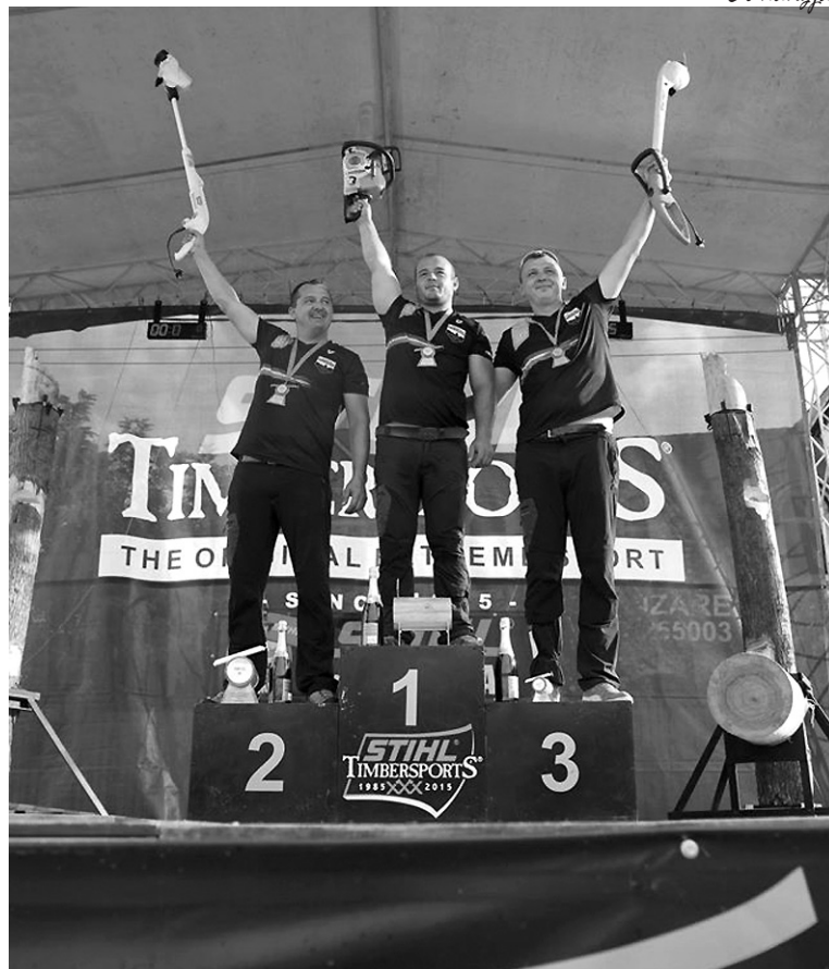
Városunk büszkeségei az országos bajnokság dobogóján