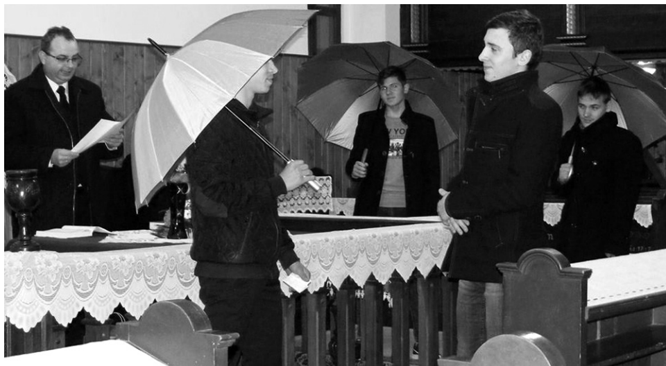
Fiatalok szolgálata az esti alkalmakon a gyülekezetben