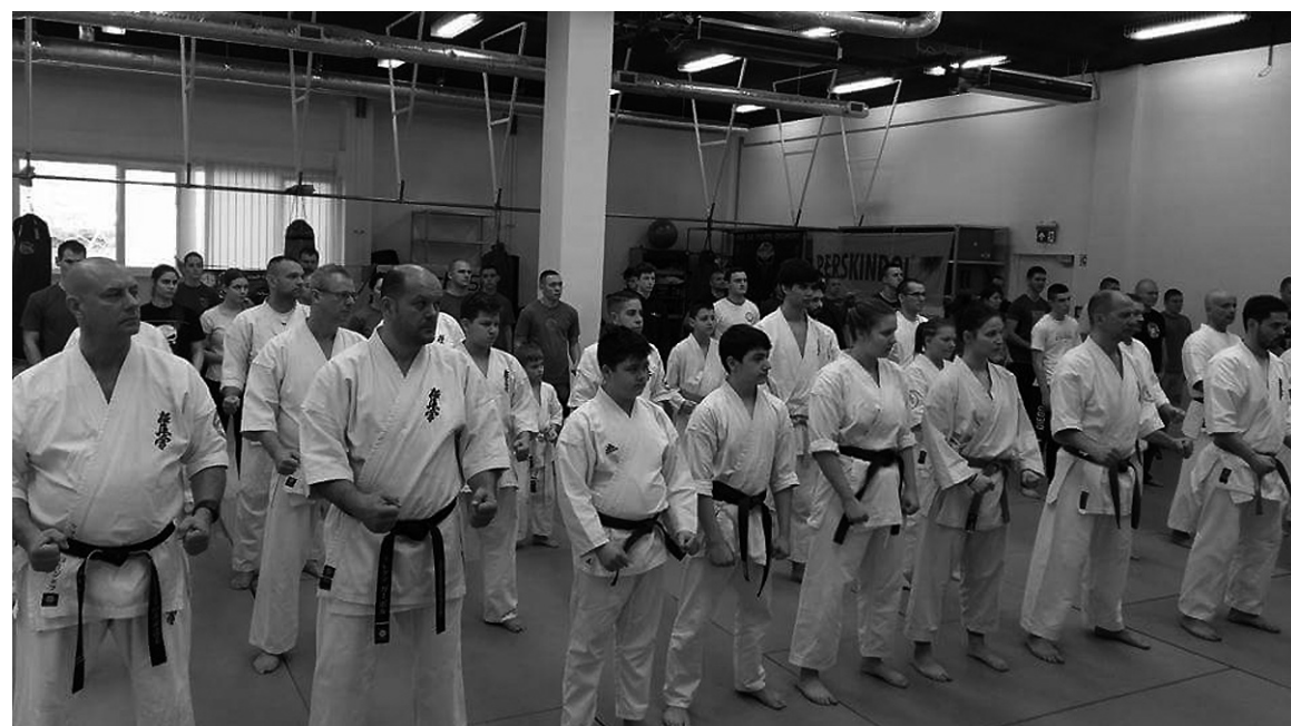
Közös edzésre készülnek vendégek és vendéglátók – egymástól tanulják a harci különböző harci technikákat

Jótekonysági edzőtáborban edzettek együtt kicsik és nagyok február 9–11. között Budapesten. Az eseményt közösen szervezte a magyarországi BRSE Keikan Dojo és az NKE Sportegyesület tonfacsoportja. A Székyehídi Phoenix Sportegyesület jelenlétével erősítette a harci szellemet az ottani sportolóknak, a shotokan karatét képviselte sok más stílus mellett. A résztvevők betekintheztek a bra-