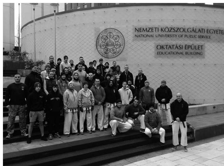
Maradandó élményekkel tértek haza a székyehídi karatésok

Hogy jobban átlássák kedves olvasóink, hogy miről is szól egy ilyen edzőtábor: edzés, edzés, edzés, ebben a sorrendben, némi edzéssel megspékelve. De komolyra fordítva a szót, a sportolók hasznos önvédelmi technikákat tanultak, tanácsokat kaphattak a tapasztaltabb edzőktől, ismerkedhettek,