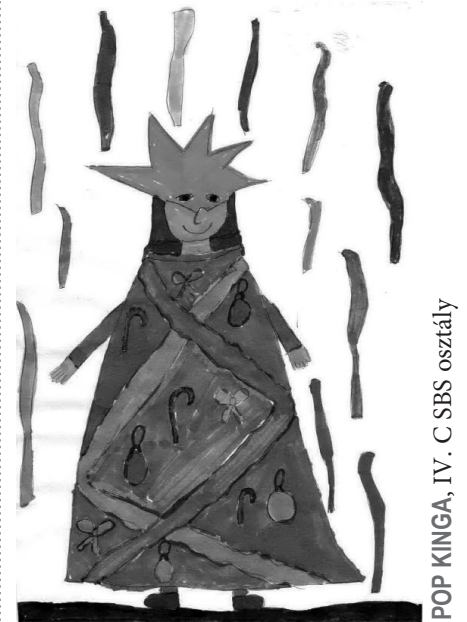
POP KINGA, IV. C SBS osztály

A farsang csúcspontja a karnevál , hagyományos magyar nevén „a farsang farka”. Ez a farsangvasárnaptól húshagyókeddig tartó utolsó három nap, ami nagy mulatságok közepette, valójában télbúcsúztató is. Számos városban ekkor rendezik meg a híres karnevált (riói karnevál, velencei karnevál), Magyarországon pedig a farsang legnevezetesebb eseményét, a mohácsi busójárást. Szintén húshagyókeddi szokás a farsangtemetés, a tréfás felvonulás, amelynek végén a farsangot (vagy telet) jelképező és a faluban végighordott szalma- vagy rongybábut tréfás siratás közben elégették, esetleg a vízbe dobták.