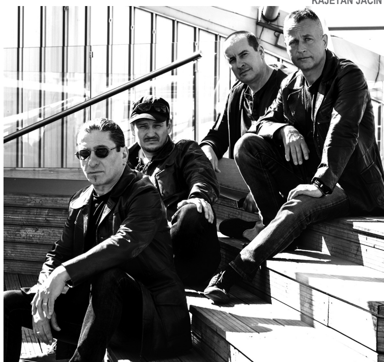
A székelyhídiak kedvencei nemsokára ismét városunkban lépnek fel