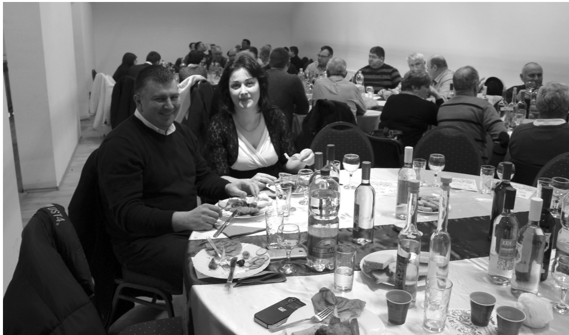
Színvonalas vendéglátás a nedűk viadalán. Voltak, akiket egy kellemes este reménye vonzott

A tavalyinál több gazda több nedűvel vett részt az idei borversenyen. A minőségi italok, a jó szervezőmunka, az esemény gördülékeny lebonyolítása kivívta a jelenlévők elismerését.