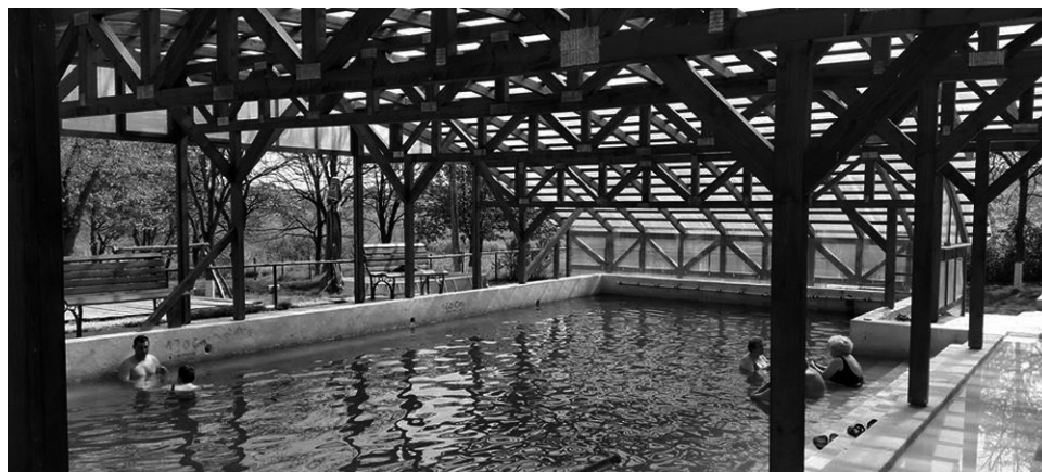
Számtalan betegségre, nyavalyára gyógyír a szentmiklósi strand vize