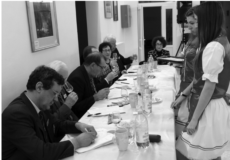
Neves szakemberek alkották a zsűrit