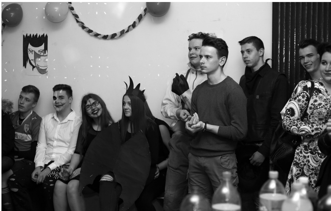
Ötletes jelmezekben jelentek meg a farsangozók – nagy feltűnést keltek a városközpontban

Az esemény hagyományos farsangi szabályokon alapult, azaz a jelmez viselete elengedhetetlen volt. A maszkos, kifestett, illetve beöltözött fiatalokat nagy feltűnést keltek a város központjában az épp arrajárók körében. Mint minden farsangi mulatságon, itt is jutalmat kaptak a legkreatívabban öltözött résztvevők. Az eseményt a székelyhídi Enemy Dance Family hiphop-táncscsoport rövid, de annál dinamikusabb előadása nyitotta meg, táncra buzdítva ezzel mindenkit. A jelmezek között színesebbél színesebb, ötletes gondolatok jelenítődtek meg, mint például a gigantikus méretű jägermeisteres üveg, Joker és kedvese, Harley Quinn, fekete angyal, tündér, bárány, hóember, határőr, minyon, pantomimesek csoportja, Hófehérke, katonák, vudubaba, Minnie Mouse, retródiva, a Hihetetlen család, velencei masz-