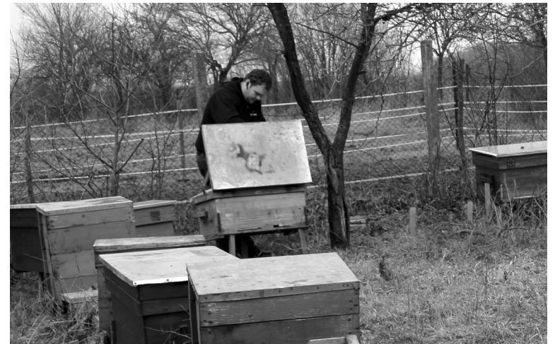
Tél végi vizitáció a méhesben, ahol etetéssel segítik az állományt

Kánikula idején további feladat is akad a barackosban, öntözni kell, másként a termés nem tud kifejlődni, megfonnyad, és idejekorán lehull. Jobbára korai érésű fajtái vannak. Az elmúlt évi termés hozammal és a piaci árral is elégedett. Szezonkezdetkor 12 lejért mérte