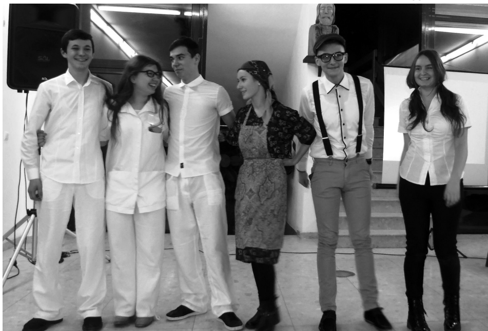
Humoros jelenetekkel szórakoztatták a tizedik osztályos diákok a közönséget

Nem hiányoztak az este során a videók sem, melyekből többek között megismer-