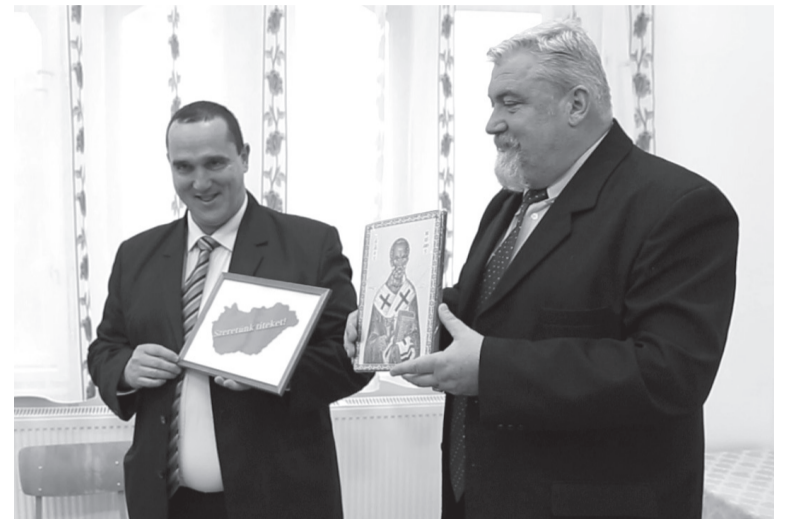
B. O. Az intézményvezetők megilletődve vették át a szimbolikus ajándékokat

Ezekre a próbálkozásokra ad lehetőséget az a LEGO-tanterem, amelynek felszerelése közel kilencezer euróba került, és amelyet nulladik osztálytól második osztályig használhatnak a gyerekek az okostáblával, a legószettekkel és az azokhoz járó feladatlapokkal, így téve lehetővé, hogy a modern technikába születő gyerekeket oly módon tanítsák, ami szembemegy az egyszerű frontális információátadással, hisz a gyerekek virtuálisan kapják meg a feladatot, majd kétkezűleg pakolva oldják meg azt, így kötve össze hatékony módon a két világot.