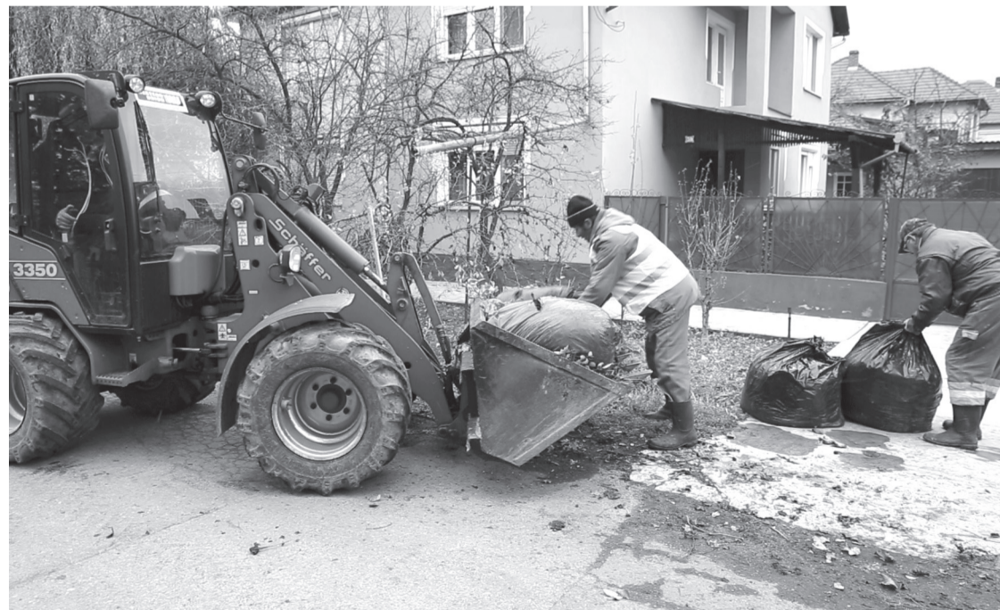
Nagy segítséget jelentett a lakosok részéről, hogy zsákokba tömörítve állították ki a lomokat

Ön is az ingyenesen terjesztett Ér hangja havilap rendszeres olvasója? Esetleg az Ér Tv nézője vagy a Rádió Ér hallgatója?