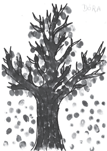
SZABÓ DÓRA (előkészítő C SBS o.)

meg se mutatom neked, holdfényt fonok békarokkán, mák-olvasót pergetek. Jó lesz, jó, neked is, nekem is jó... Majd kérmél tőlem süteményt, de nem ülök a pamlagon: nedves fű közt lakom, harmatgyöngy ablakom, majd megállj, még visszahívnál -