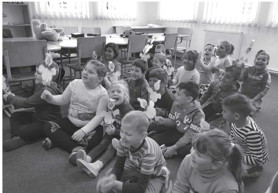
Bár megsütni nem lehet őket, a gyerekek kezeinek munkáját dicsérik a papírlibuskák