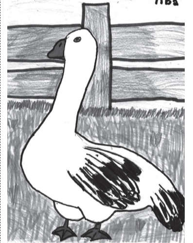
KALLÓ ÁRVEN (II. SBS osztály)