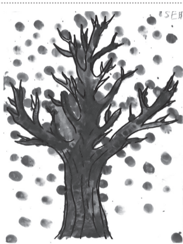
KÓS SZEBASZTIAN (előkészítő C SBS osztály)