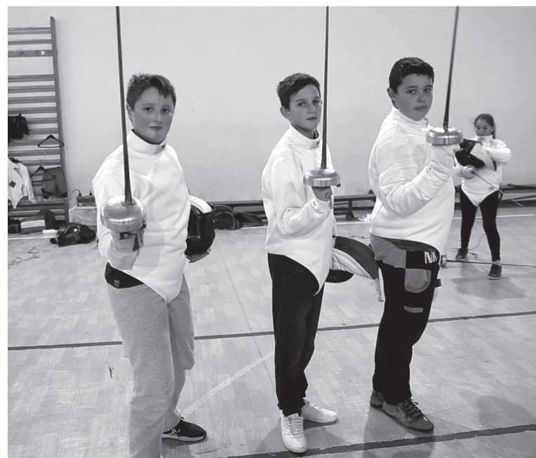
A három muskétásra még sok gyakorlás vár a sikerig vezető páston