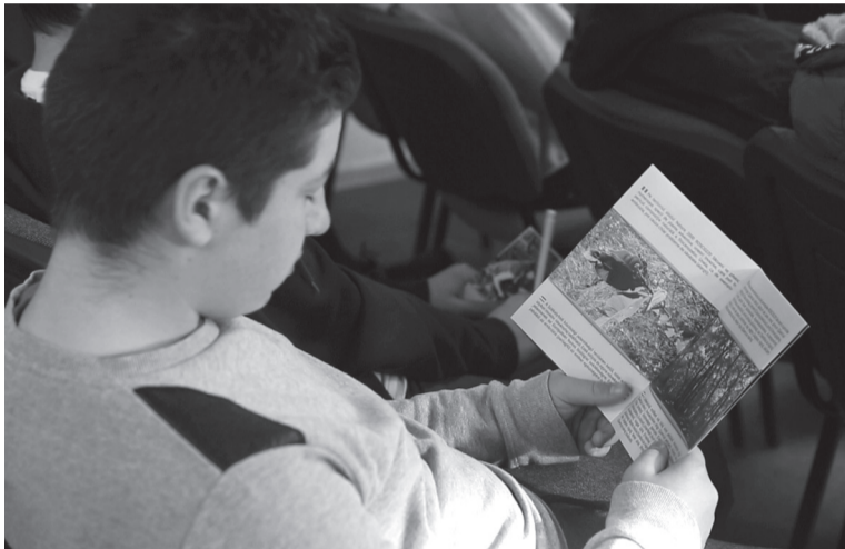
A diákok nyomtatott bemutatót olvashattak az érmelléki kincses szigetről

Vajon így ki védi majd meg a Csíkos-tó egyedülálló élővilágát?... – kérdezi a központi hatóságtól a szerkesztőség.