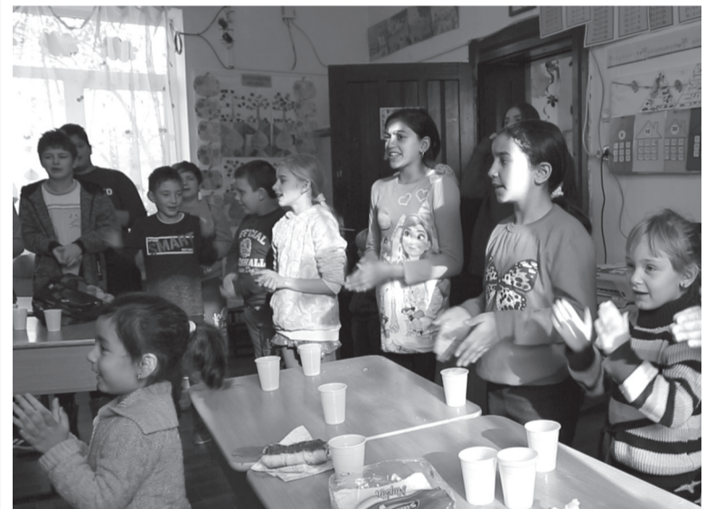
A gyerekek énekekkel teremtették ünnepi hangulatot