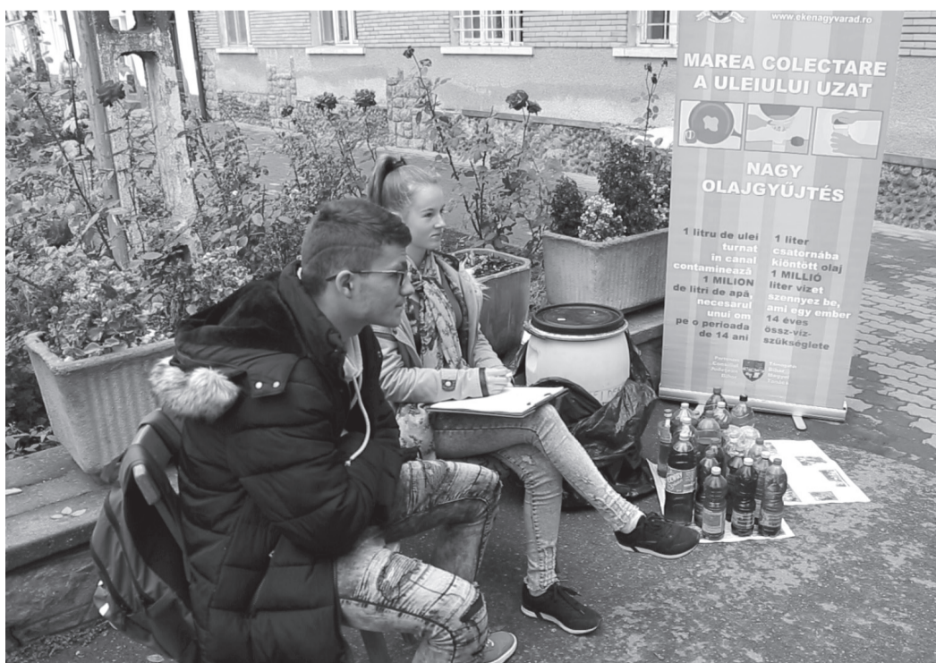
A fiatal önkéntesek példát mutatnak környezettudatosságából generációjuknak