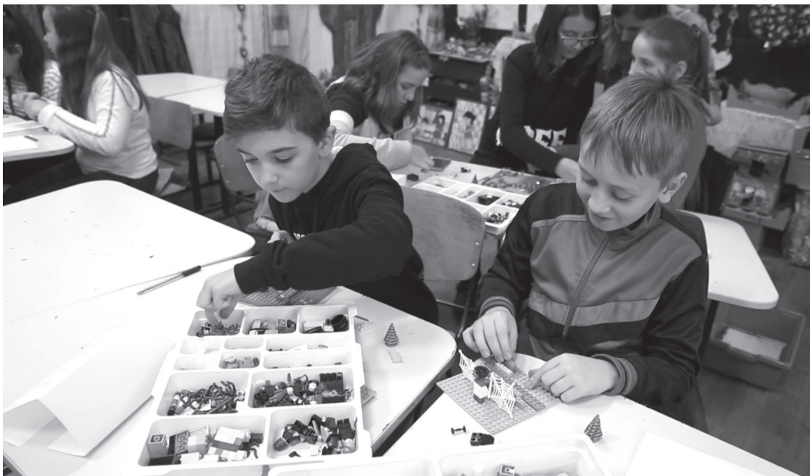
A gyerekek arca nem az átlagos tanítási napot tükrözte

Az edelényi Szent Miklós Görögkatholikus Általános Iskola, Művészeti Iskola és Óvoda együttesen jóbaráti kapcsolatot ápol városunk középiskolájával. A többéves barátság gyümölcse lett az is, hogy az Edelényben már évek óta sikeresen alkalmazott LEGO-módszertan most városunkban is