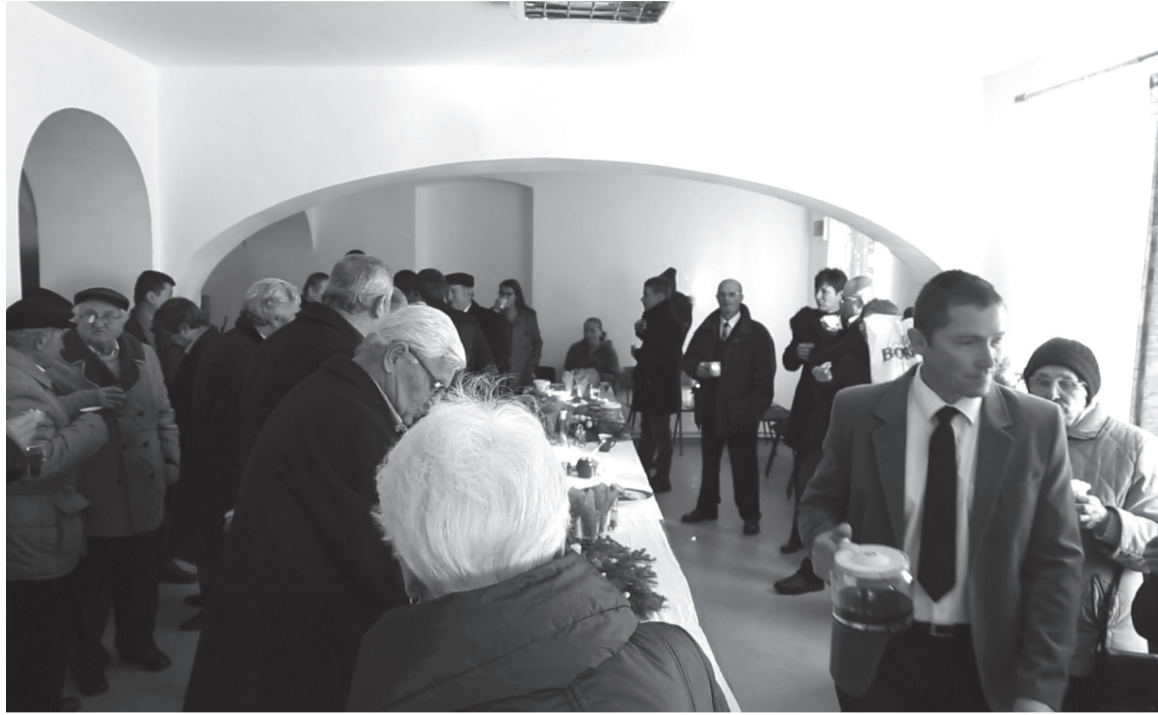
Kész a nagyobb gyülekezeti terem, ami a jövőben a közösségépítő eseményeknek helyszíne lesz

Meghozta gyümölcsét a többnapos csokalyi készülődés