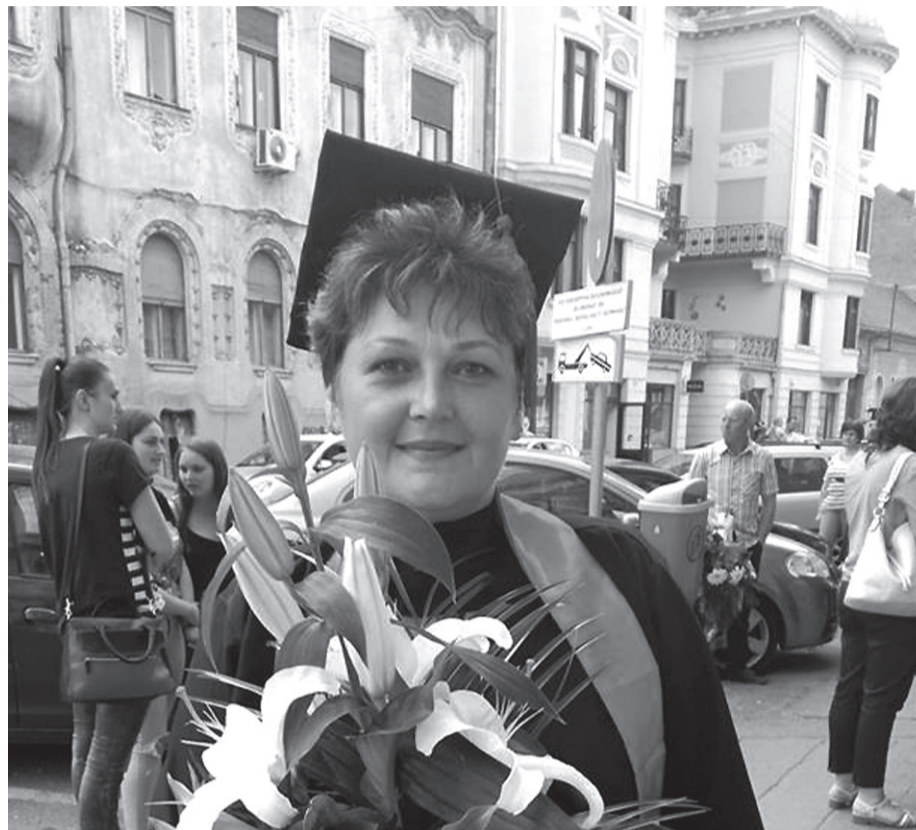
A posztliceális egészségügyi asszisztens-képzés sikeres végzőseként a székelyhídi önkormányzatnál szociális asszisztensként áll a rászorultak szolgálatára