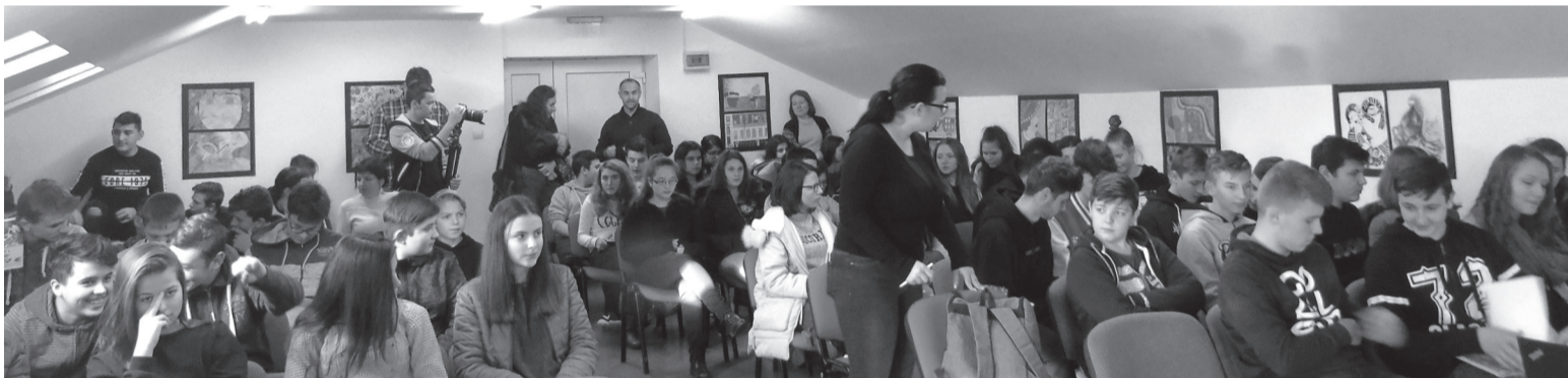
A tájékoztatóon a székelyhídi középiskola mintegy nyolcvan érdeklődő diákja vett részt