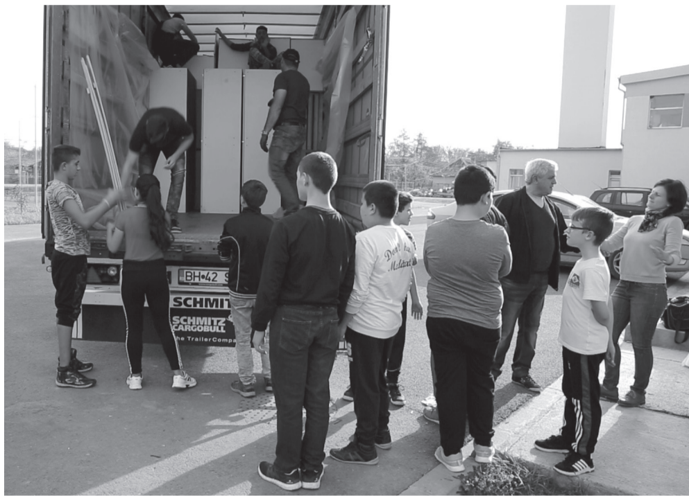
Kíváncsiság és segítőkészség jellemezte a lerakodásnál sorbanálló gyerekeket