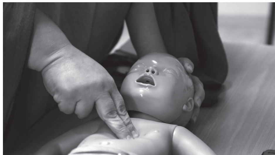
A fej helyes rögzítésének és a mellkasi kompresszió végrehajtásának példája

Ha észleljük, hogy baj van, mit tehetünk? A sürgősségi szakápoló azt javasolja, semmiképp se kapjuk fel a gyermeket és kezdjük el rázogatni hirtelen ijedtségünkben! Először bizonyosodjunk meg róla, hogy valóban baj van-e vagy csak egy veszélytelen apnoe, vagyis rövid, lélegzetvétel nélküli periódusról van szó? Mérjük meg, amit meg lehet, vagyis a légzésszámot, hisz a vérnyomás és a pulzusszám észlelése és értékelése laikusok számára nagyon nehéz feladat csecsemőknél. A babák ugyanis meghatározott korban adott légzésszámmal rendelkeznek, lásd a mellékelt táblázatot.