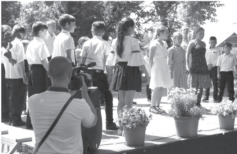
A gyermekotthonok lakói a kastélyudvaron tartottak előadást