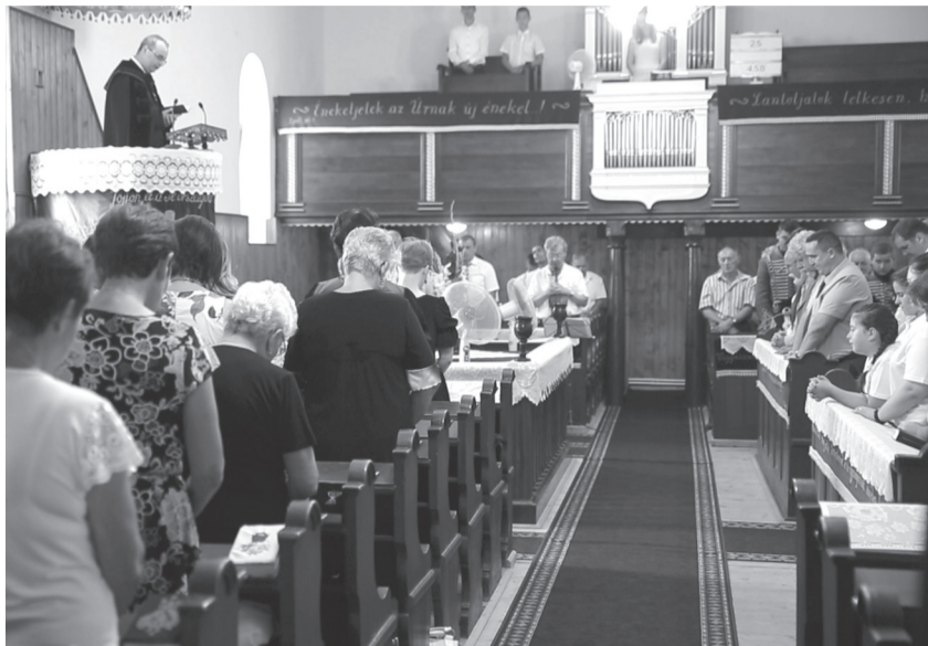
A rendhagyó istentiszteleten nagy családként vettek részt a település lakói

Reményre ad okot és nemzetünk megmaradásának záloga, hogy van olyan rendezvény, amit a családnak szentelnek. A család és az egyház azok a szerkezeti elemek, melyek megtartották a magyar közösséget itt a Kárpát-medencében több mint ezerszáz éven keresztül.