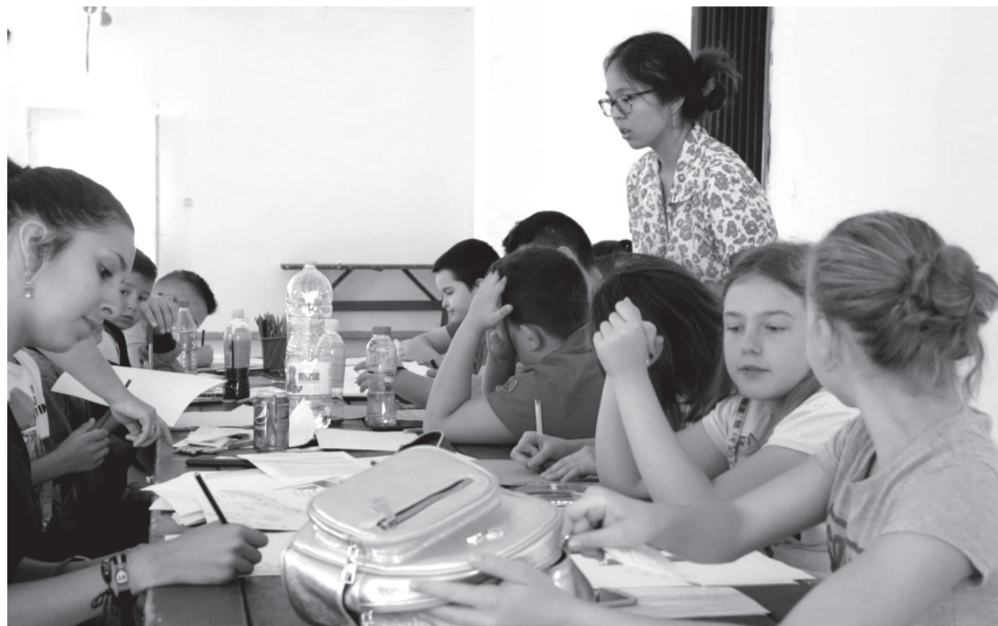
Visszatérnek: több gyerek már harmadik, negyedik alkalommal vett részt az angoltáborban