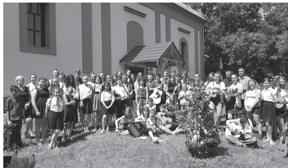
Idén közel hetven fiatal gyűlt össze az érmelléki református zenetáborban

„Ha csak hangulat él a szívemben, Ha tanácsa vezet egyedül, Ha csak érzések hulláma tölt el, Hitem is a veszélybe kerül.”