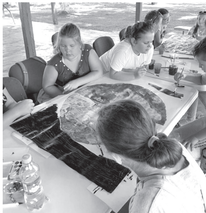
A. N. Cél a környezettudatosabb fiatal generáció nevelése