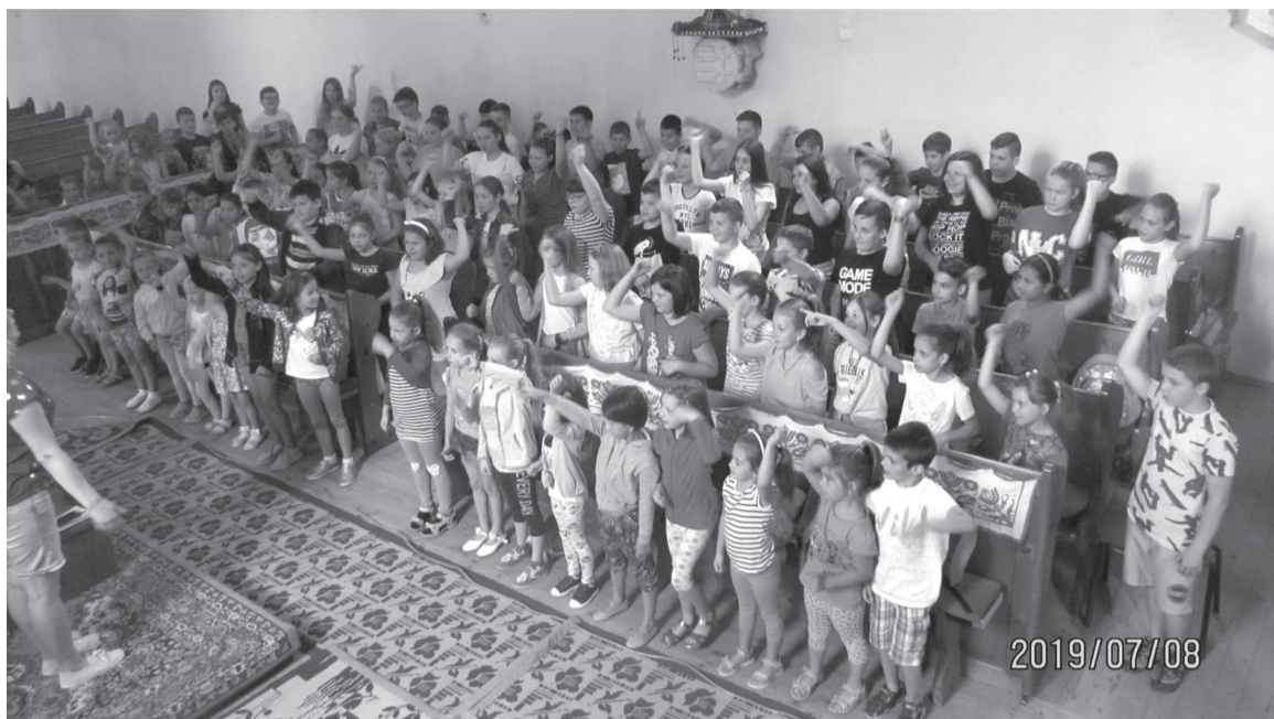
A gyerekek minden reggel imádkozással és énekléssel kezdték a napot a székelyhídi református templomban

Különleges kerettörténetbe foglalták az idei székelyhídi vakációs bibliahetet. A résztvevő majdnem 150 gyerek egy párizsi divathét zsűriszerepében volt „jelen” július második hetében, ahol az egymással versenyző modellek – név szerint Juliette, Monique és Chloé –, valamint stílustanácsadójuk, Pierre minden nap tanultak valamit a saját hibáikból. Ugyanis naponta egy-egy tanulságos, bibliai történetet ismerhettek meg, amelyeknek a főhőse József volt (a református egyházkerület Öltöztető gyerekmissziós programja alapján).