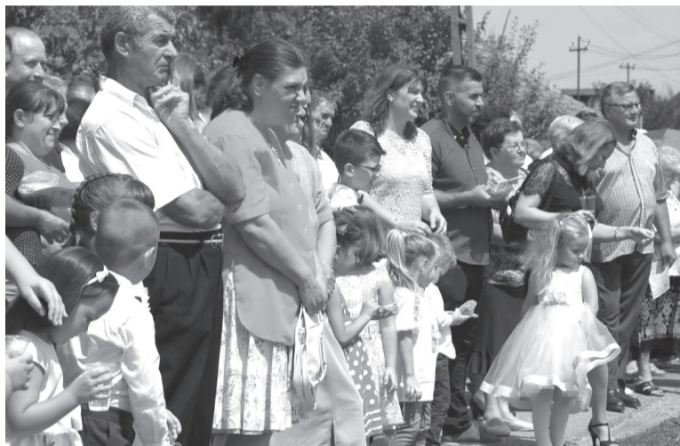
Az istentisztelet után, az alapköv elhelyezésének helyszínén

Református napközinek és bölcsődének helyet adó épület alapkövét tették le július 28-án, Székelyhídon. A város oktatási intézményrendszerének újabb épületét a Kárpát-medencei Óvodafejlesztési Program keretében fogják felépíteni, amelynek köszönhetően az említett térségben 152 új óvoda épül, és több épületet újítanak fel.