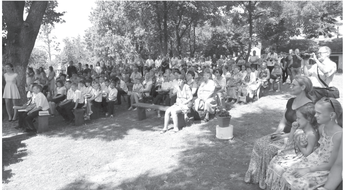
A búcsú minden évben időt és helyet ad a támogatóknak a gyerekekkel való találkozásra