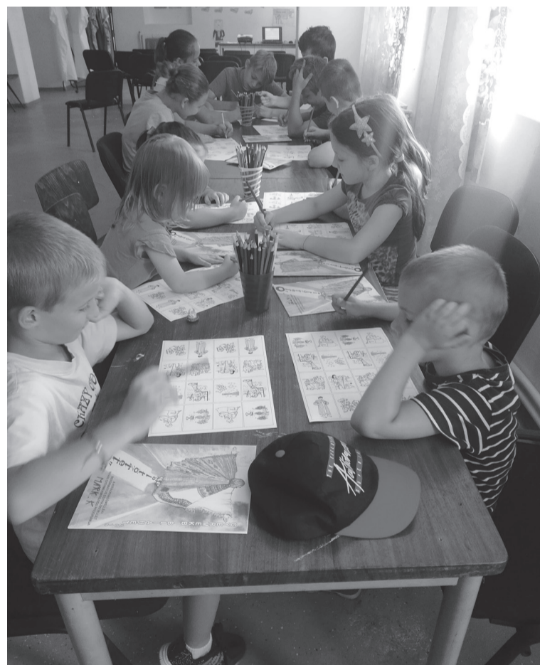
A jól megszokott kézimunka hozzájárult a tanultak játékos elmélyítéséhez