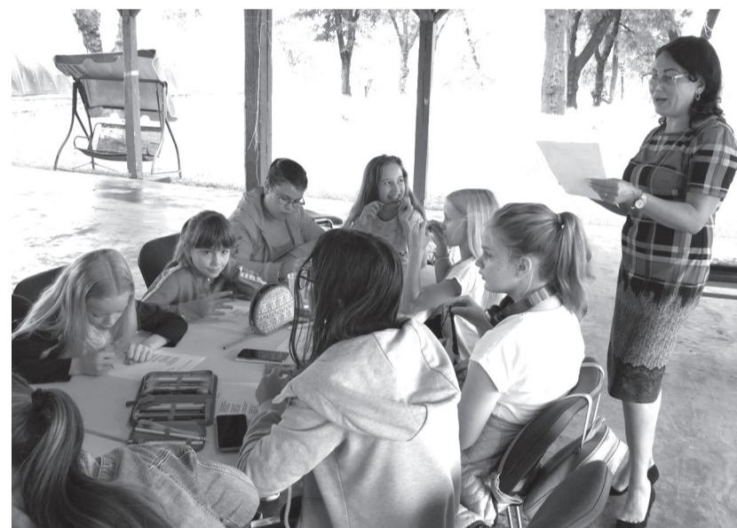
A magyar lakosságú településeken élő gyerekeknek szólt a román nyelvtábor