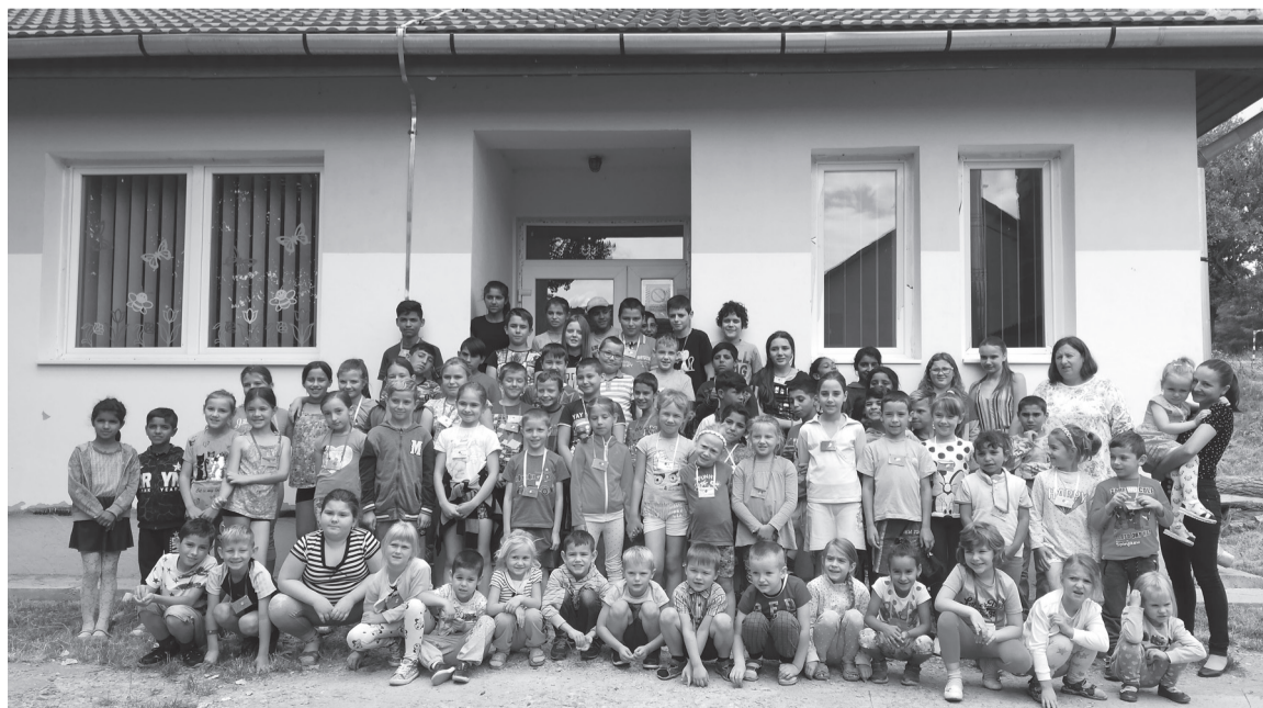
A táborban idén nagy számmal résztvevő gyerekek József történetével ismerkedhettek meg a hét folyamán