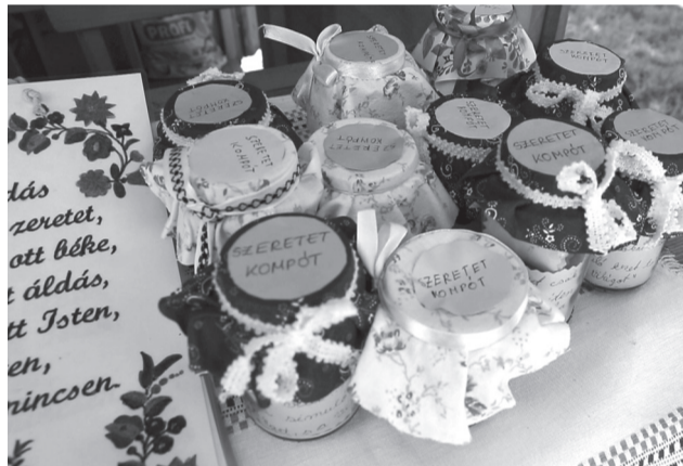
A látogatók számos jótékonyági portéka közül vásárolhattak