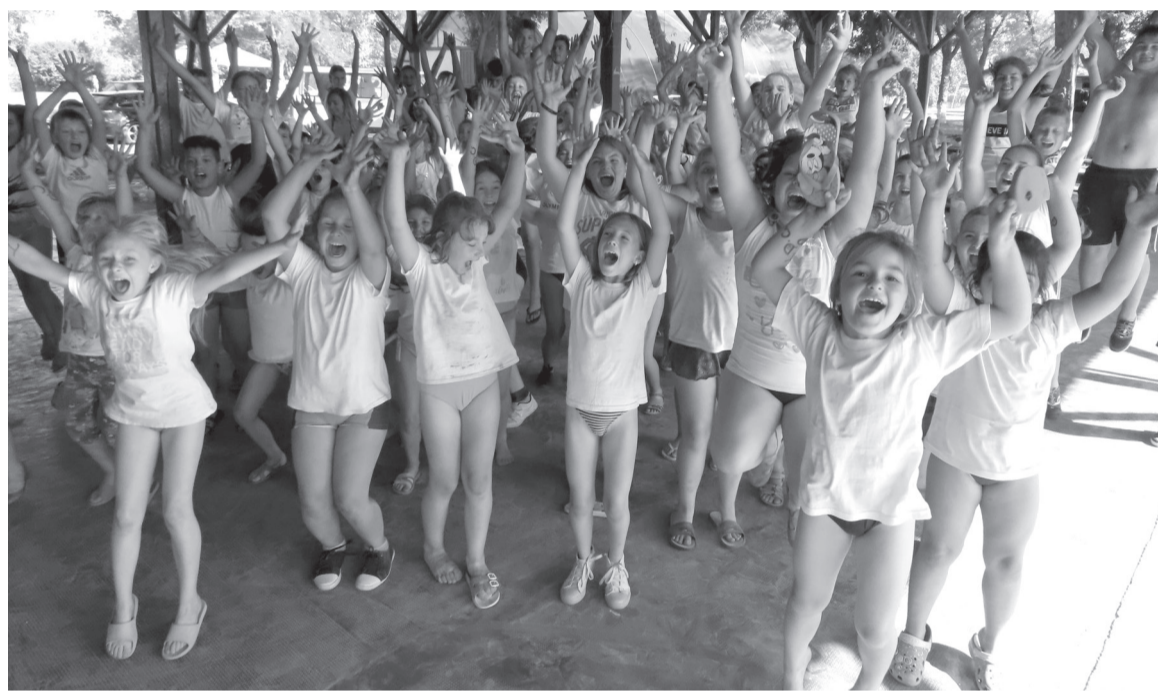
Ugrás a következő szintre: jövőre veletek ugyanitt!