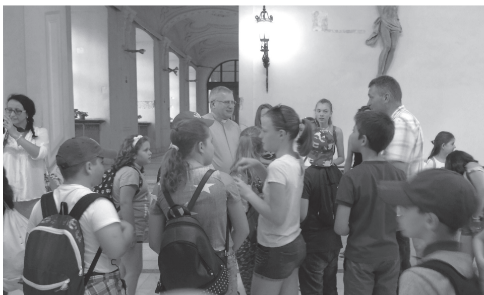
Böcskei László püspök személyesen mutatta be a gyerekeknek a püspöki palotát