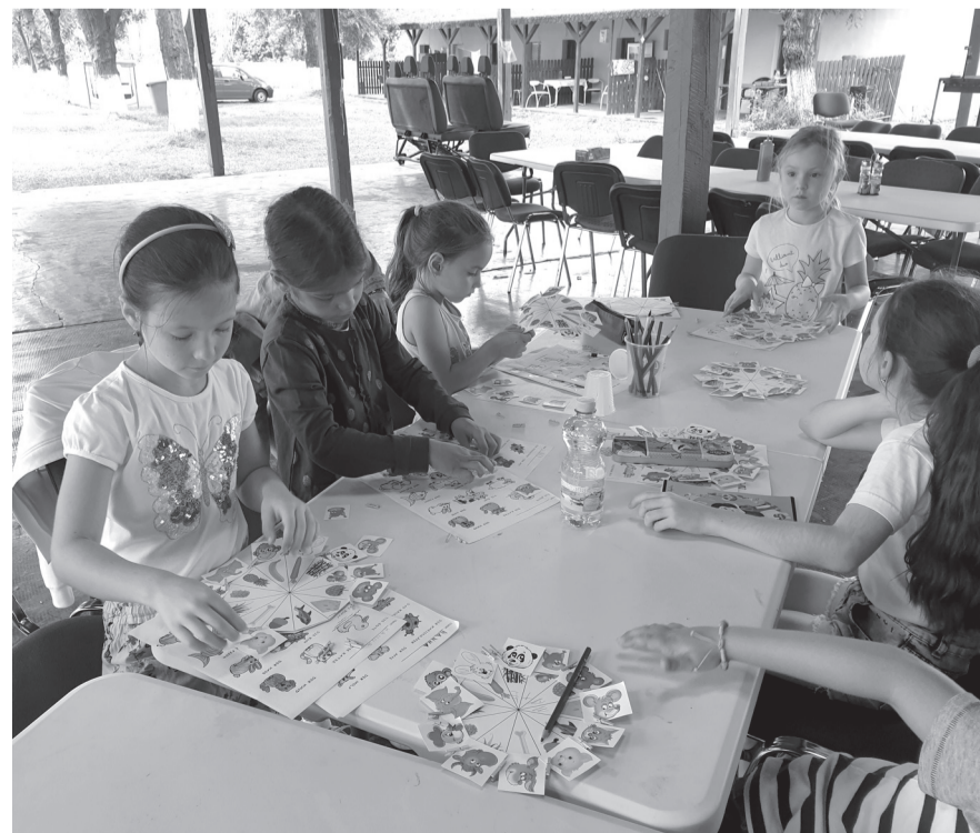
A német nyelv alapjaival ismerkedhettek meg a gyerekek az először megszervezett nyelvtáborban