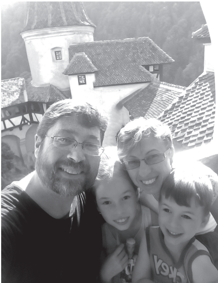
A szerelem városunkba irányította a nagyváradai történészt

– Mikor a liceum utáni továbbtanulásról volt szó, nem volt kérdés, hogy hová fogok menni. 1994-ben kezdtem történelmet tanulni a kolozsvári Babeş–Bolyai Tudományegyetemen. Soha nem felejttem el, ott ért először az a kellemes meg-