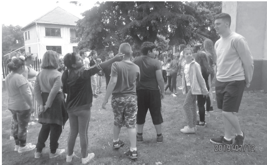
A nyolc „hátizsákos” írországi fiatal a világ számos pontjára látogatott el virtuálisan a gyerekekkel