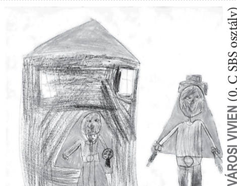
ÚJVÁROSI VIVIEN (0. C SBS osztály)