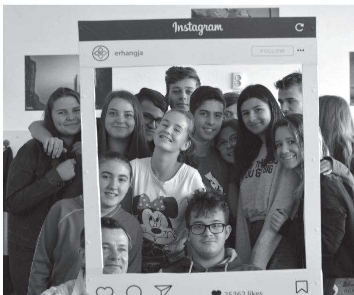
Az erre az alkalomra készített keretben a diákok lelkesen fotózkodtak