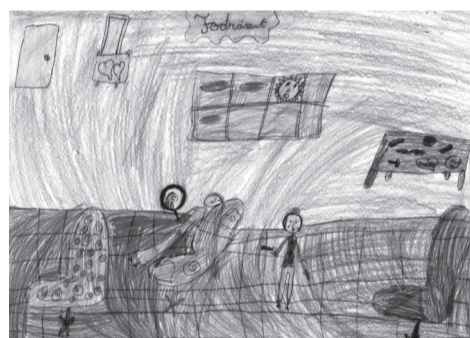
RÉZMŰVES ETA (II. D osztály)