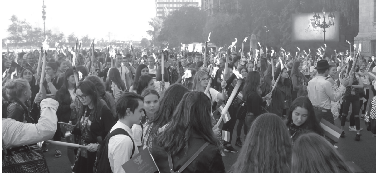
A székelyhídi csapat a grandiózus fővárosi fáklyás felvonuláson

Budapestre utazott egy teljes buszt megtöltő székelyhídi, nagykágyai és érmihályfalvi diákcsoport és kíséretük az 1956-os forradalom és szabadságharc hősei előtt tisztelő Gloria Victis elnevezésű program keretében. A Rákóczi Szövetség hagyományos rendezvényére a magyar fővárosba meghívott 3000 diák közül az idén 250 Bihar megyéből érkezett.