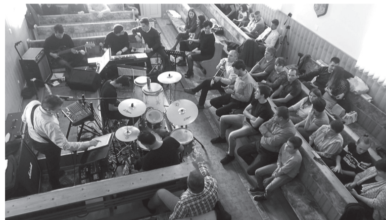
Az ismert felekezeti rendezvényre idén 220 személy látogatott el