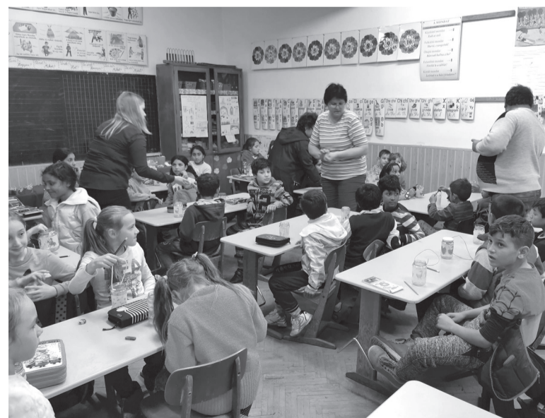
A négy éve indított program a mai napig töretlen sikernek örvend