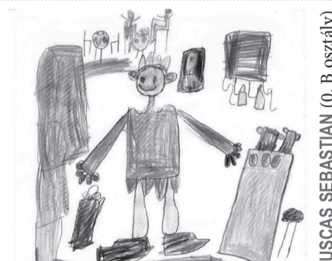
PUSZÁS SEBASTIAN (0. B osztály)