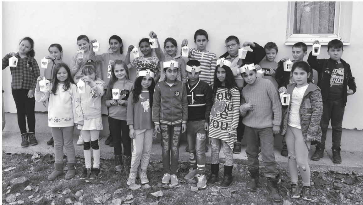
A Márton-napi lámpásokhoz, fejdíszekhez a III. osztályosok üzenetet is tanultak