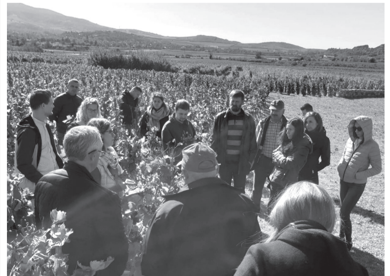
B. A. Elősegítette a részletes szőlészeti terepszemlét a kedvező őszi idő