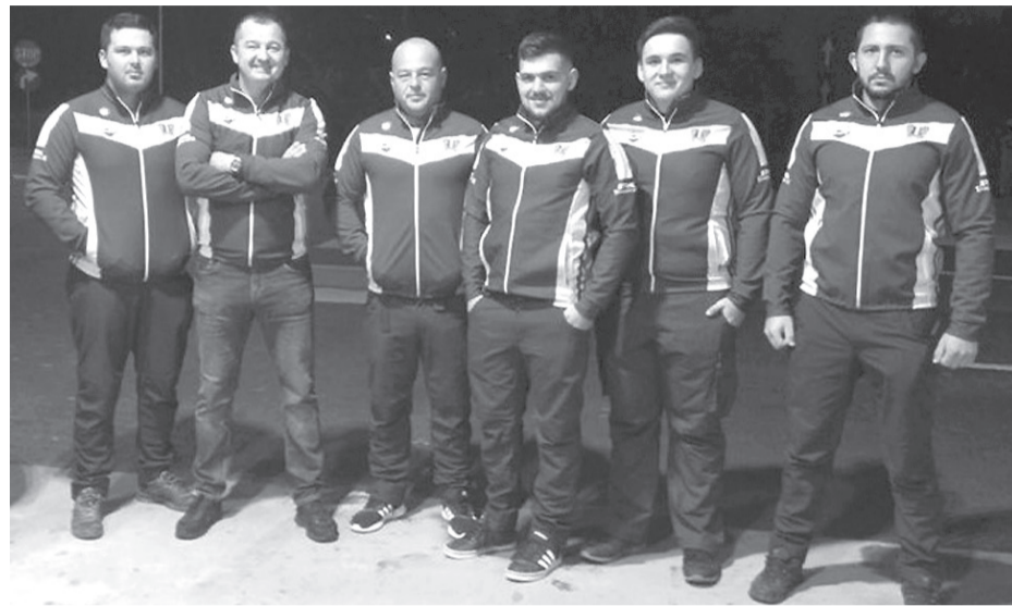
A prágai vb-17. helyet jövőre javítaná a többségében székelyhídiakból álló válogatott

Keserű szájjal tért haza a román sportfavágó-válogatott a vb-ről