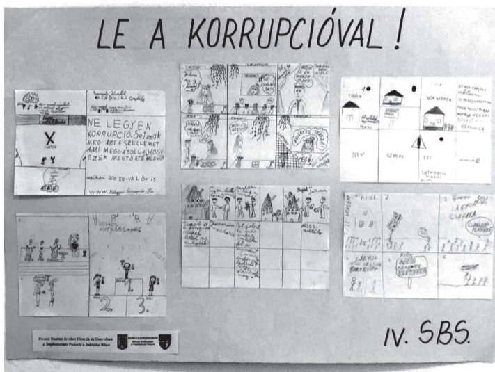
A múzeum falain ötletes korrupcióellenes plakátokat láthattunk