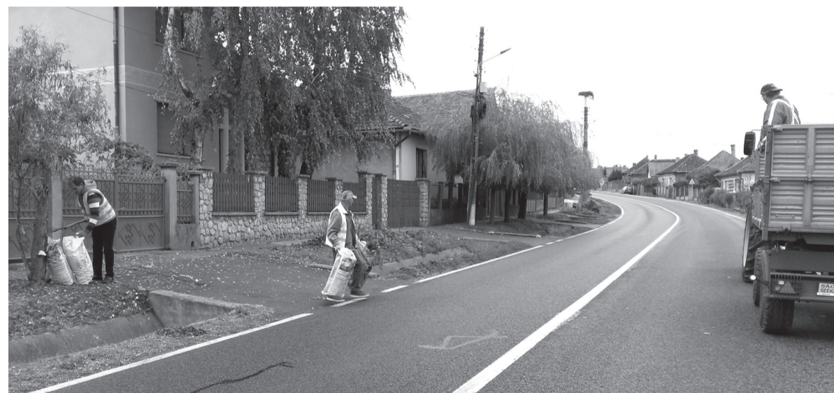
Idén is több tonna hulladékot sikerült elszállítani az AVE Bihor Kft. közreműködésével