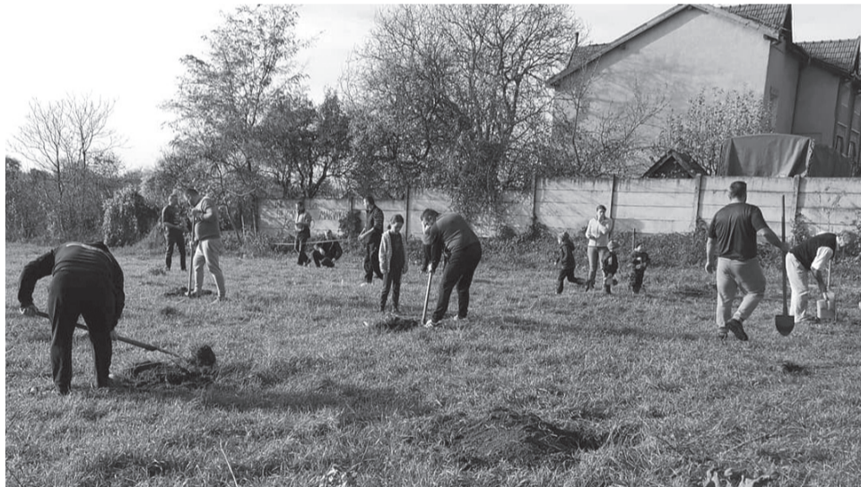
Majdnem ötven facsemetét ültettek el a lelkes szülők és mindegyikre szalag került a családok gyerekeinek neveivel