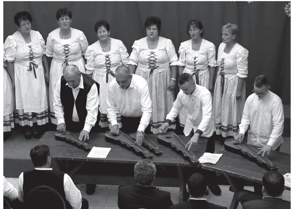
A Csormolya Népdalkör és Citerazeneke a magyarországi Létavétesről érkezett