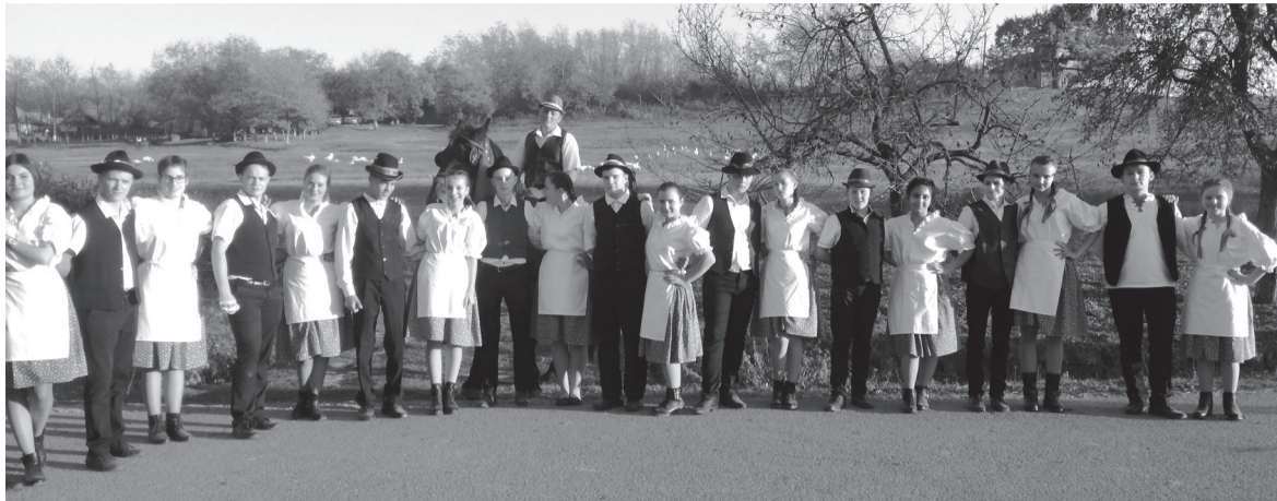
A szüreti bálozás hagyományát továbbörökítő fiatalok igazi lelkes csapatát kovácsolták össze a felkészülés alatt