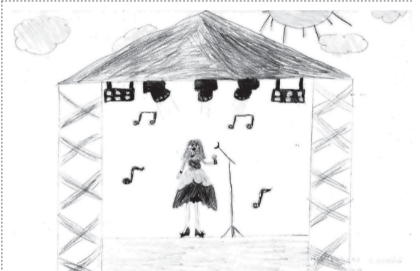
GOMBOS ANASZTÁZIA (III. B osztály)