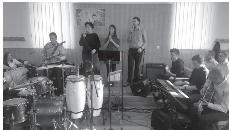
A jelenlevők együtt dicsérték az Urat a Shina zenekarral és barátaikkal