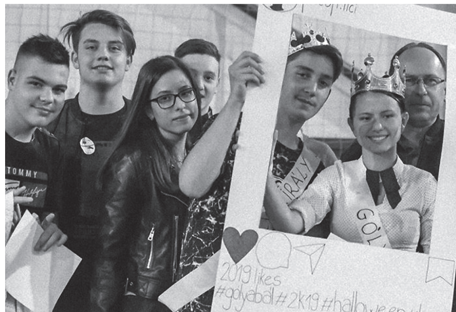
A gólyapárok idei vetélkedője új játékot, fogalmat is bevezetett a diákok körében