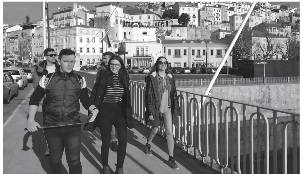
Coimbrai városnéző. Székelyhíd csapata a portugáliai világorökségi helyszíneken

Már jelentkezünk összefoglalóval az Ér Hangja Egyesület nemzetközi ifjúsági programjairól (a havilap tavaly októberi hasábjain), ám ahogy ott megírtuk, van folytatás. Tavaly fiataljaink Norvégia, Litvánia, Spanyolország levegőjébe szagolhattak bele, míg mások pontosan Székelyhídra voltak kíváncsiak az egyesületen keresztül. Alig ért haza mindenki, már itt is volt a 2020-as év, amelynek nemzetközi eseményei rögtön januárban kezdetüket vették.