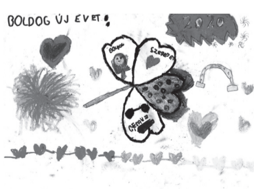
SZABÓ VIKTÓRIA (I. C o.)