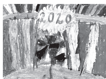
SZILÁGYI DOMINIK (I. C o.)