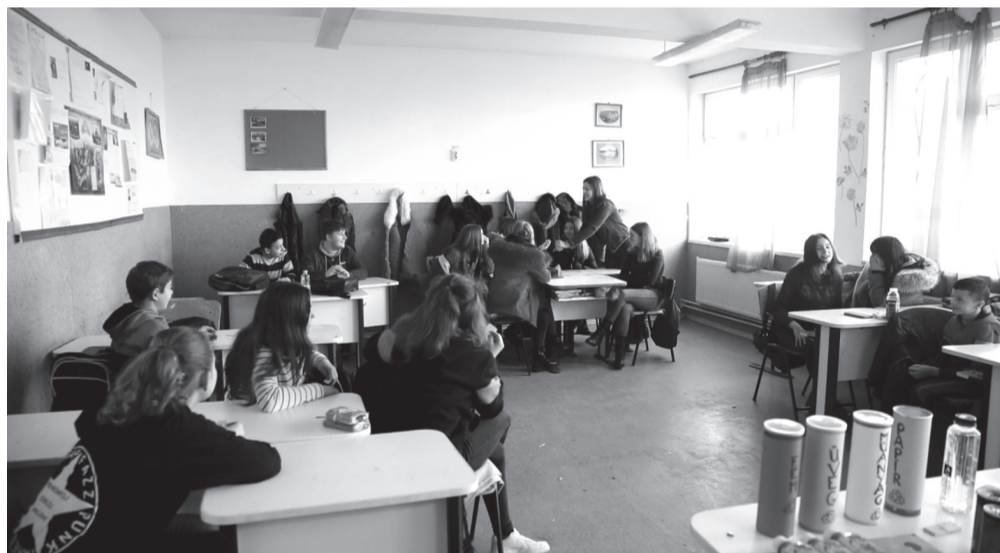
A bemutatók után négy csoportba rendeződtek a diákok, a szelektív hulladéktárolók színei szerint

A rövidke szünet után négy csoportba ültek vissza a padokban, a különböző szelektív hulladéktárolók színei szerint (piros, zöld, sárga és kék). Ezt követően kezűgyességet igénybe vevő foglalkozás vehette kezdetét, miszerint a katedrán elhelyezett hulladékokból válogatva, egy vagy több kreatív alkotást kellett készíteni. Az nem volt meghatározva, hogy mi legyen a végeredmény, csakis a képzelőerejükre támaszkodhattak. De minden csapat munkájának a fő alkotója a színnek megfelelő szeméttípus kellett legyen: a pirosaknak fém,