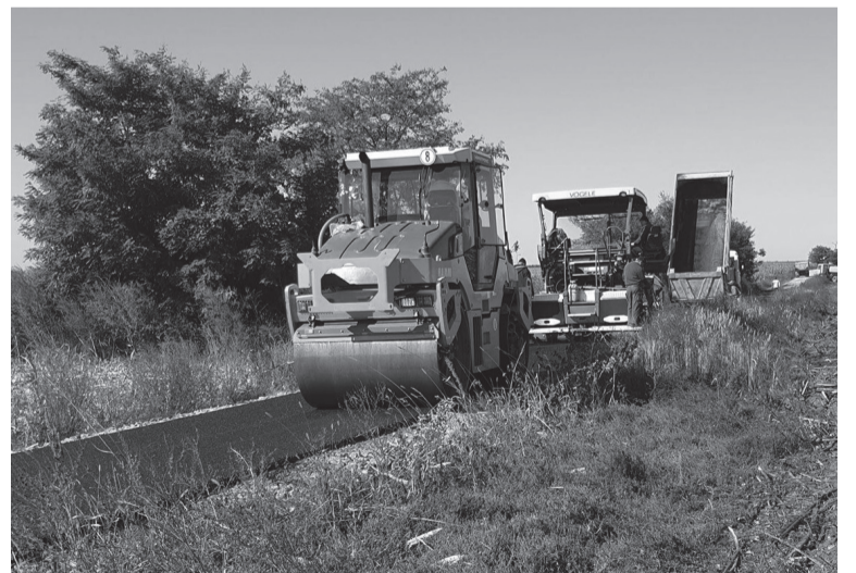
Tavaly 2 165 353,78 lejt fordítottak mezőgazdasági utak aszfaltozására

Jelenleg folyik a Székelyhidat Érselénddel összekötő 2,596 kilo-