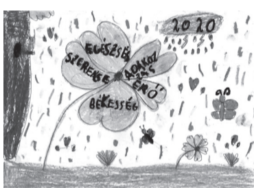
BÉRES ABIGÉL (I. C o.)