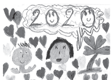
HEGYESSY ZSÓFIA (I. C o.)