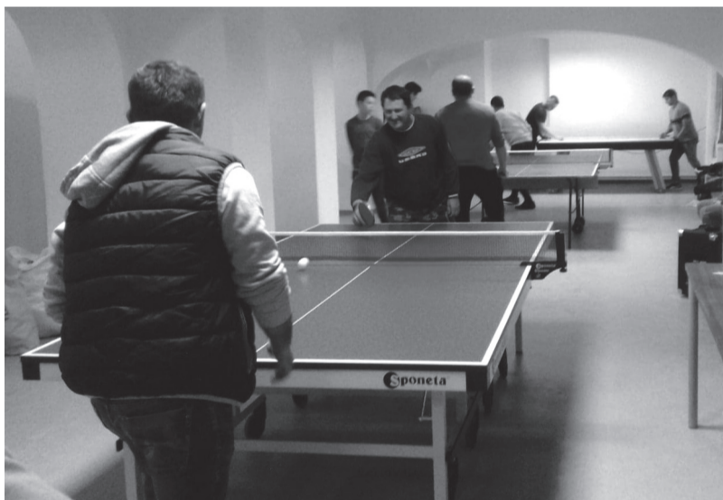
A nagy sikerre való tekintettel a jövőben heti-kétheti rendszerességgel rendeznek majd sportvetélkedőket Csokalyon

Használatba vették a csokalyi fiatalok a magyar kormánytámogatással megvásárolt sporteszközöket a helyi református közösségi házban december elején. Az eszköztár bővítését a Bethlen Gábor Alapkezelő Zrt. Ifjúsági- és cserkész-közösségek tevékenységének támogatása elnevezésű pályázata tette lehetővé.