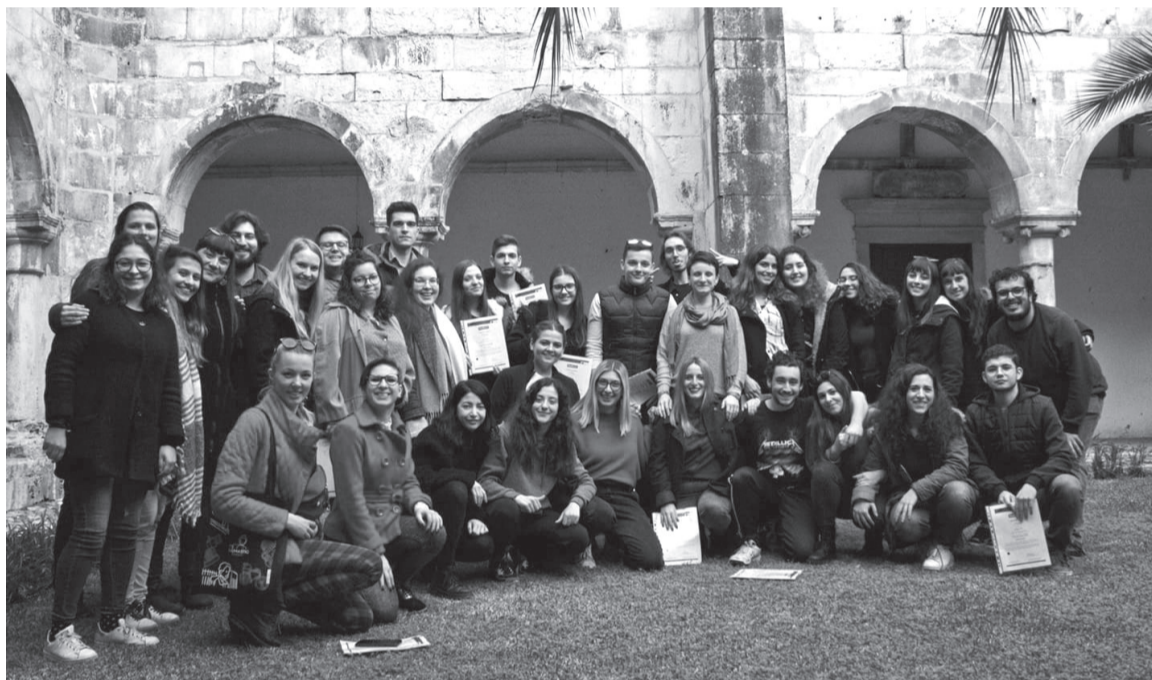
Varietas delectat (a változatosság gyönyörködtet): öt nemzet fiataljai együtt Coimbrában

Az újév teljes harmadik hetét hat szerencsés fiatal Portugáliában, Coimbrában tölthette egy Erasmus Plus ifjúsági csereprogramon az egyesület küldöttségében. A Romániát, ezen belül Székelyhídat képviselő csapat görög, litván, olasz és portugál fiatalokkal ismerkedve vett részt a rendezvényen, amelyet a Coimbrai Egyetem diákszervezetének emberi jogok védelméért felelős szakosztálya szervezett. Innen már esetleg sejteni lehet, mivel is foglalkozott az öt képviselt ország összesen harminc résztvevője egy héten át: az alapvető emberi jogok megismerésével. A szervezők a napjainkban talán legsértettebb jogcsoportokat rábízták a nemzeti csapatokra, hogy azok készüljenek fel és mutassák be őket társaiknak a hét során, nem formális módszerekkel, műhelymunkák által.