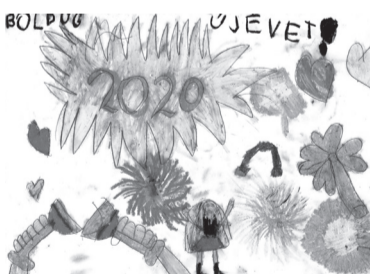
KÓPIS DOROTTYA (I. C o.)