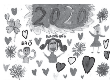
SZABÓ DÓRA (I. C o.)