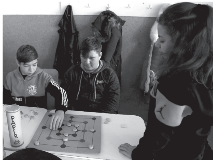
A diákok újrahasznosított tárgyakból készült ix-ox játékot és malmot is játszhattak