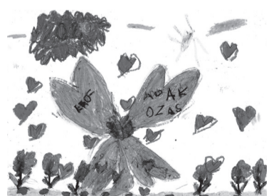
SOÓS REGINA (I. C o.)