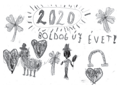
BEREZKI ZSELYKE (I. C o.)