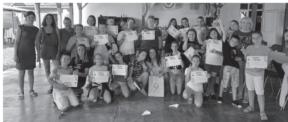
A nyári szünidőben hasznos, játékos és szórakoztató programokat biztosítottak a gyerekeknek