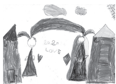
LAKATOS CLEOPATRA (0. D o.)