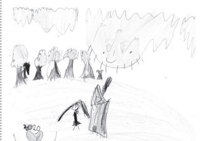
TALPAS ALEXANDRA (0. D o.)