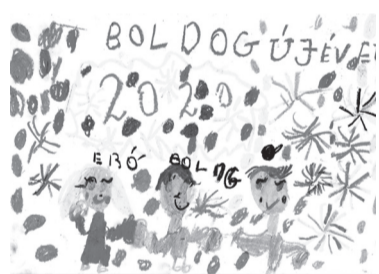
DOMBI LORENA (I. C o.)