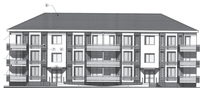
Az Eroilor utcában márciusban indul az új ANL-tömbház építése