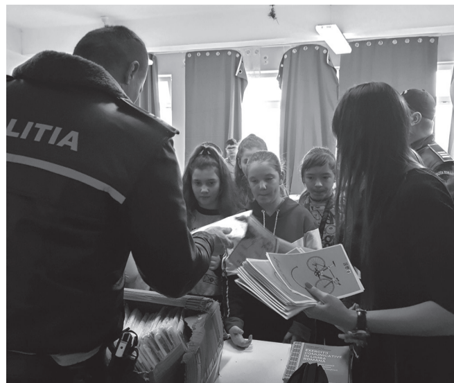
A rendőrség és a helyhatóság a jövőben újabb és szélesebb körű figyelemfelhívó akciókat tervez