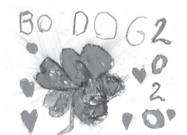
DOMBI EVELIN (I. C o.)