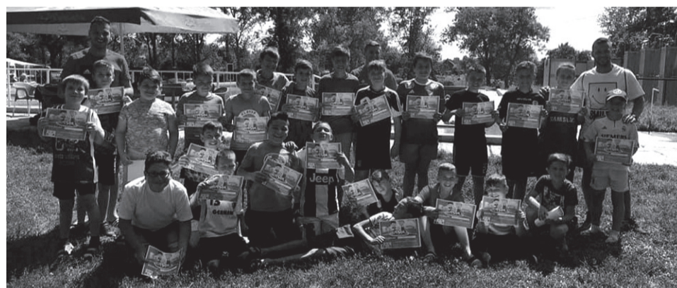
Néhány táborban a helyiek hasonló korú magyarországi gyerekekkel kötöttek barátságot