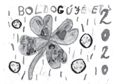
CSUKA HANNA (I. C o.)