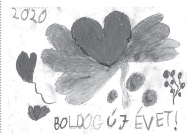
ÓB SEBASTIAN (I. C o.)