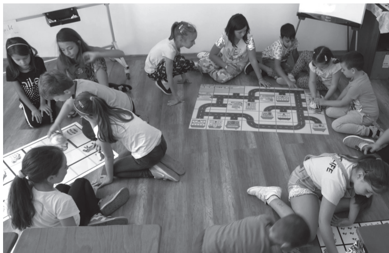
A fő cél, hogy a modern oktatási eszközök a nagyobb osztályok tantermeibe és az óvodákba is beköltözzenek

Településünkön 2 165 353,78 lejt fordítottak mezőgazdasági utak aszfaltozására, így összesen 8,91 kilométernyi útszakaszt terítették be burkolattal a helyi fejlesztéseket célzó országos program (PN DL) keretében, illetve a polgármesteri hivatal saját hozzájárulásával. „Például Csokalyon a Becsalító a csokalyi Temető utcá-