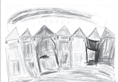
LAKATOS ALEXANDRA (0. D o.)