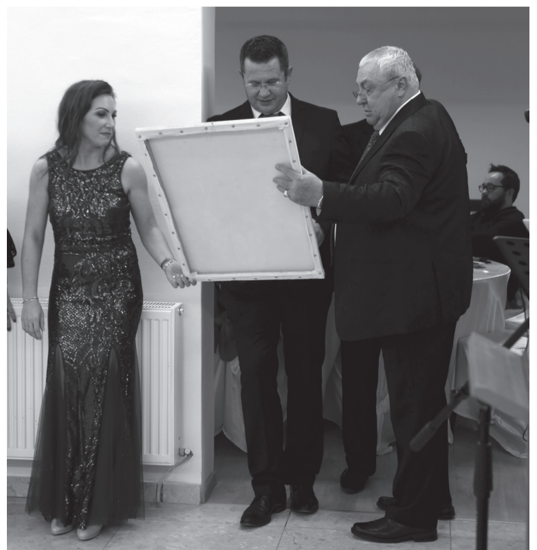
A liciten befolyt 30 400 lej a Gyermek Jézus-otthon költségvetését gyarapítja