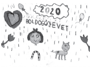
DOMBI PATRÍCIA (I. C o.)