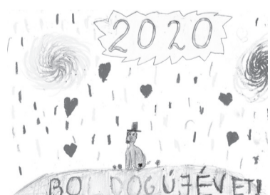
MURÁNYI LINDA (I. C o.)