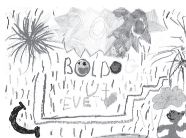
KULCSÁR TAMARA (I. C o.)