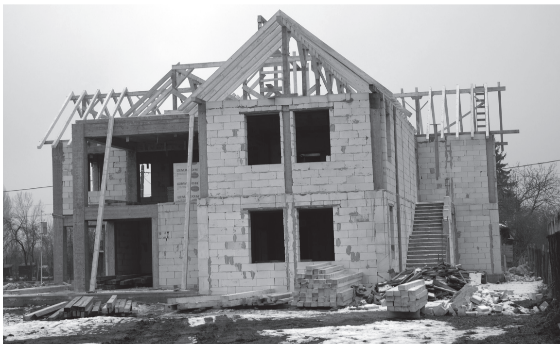
Még az idén birtokba vehetik az apróságok a bölcsőde és új napközi épületét

Tavaly számos kulturális és családi programnak adtak helyet Székelyhíd és a hozzá tartozó falvak. Ehhez szükség volt a helyi civil egyesületek és a város polgármesteri hivatalának összefogására. Több rendezvény a Bihar Megyei Tanács két alegysége, azaz a Szociális és Közösségi Igazgatóság, illetve a Projektkezelő és Fejlesztési Igazgatóság támogatásával valósult meg. „Januárban megszervertük a nagy sikernek örvendő magyar kultúra napi jótékonyági bá-