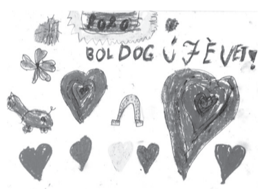
BALÁZS OLÍVIA (I. C o.)