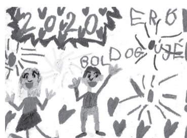
NAGY HANNA (I. C o.)