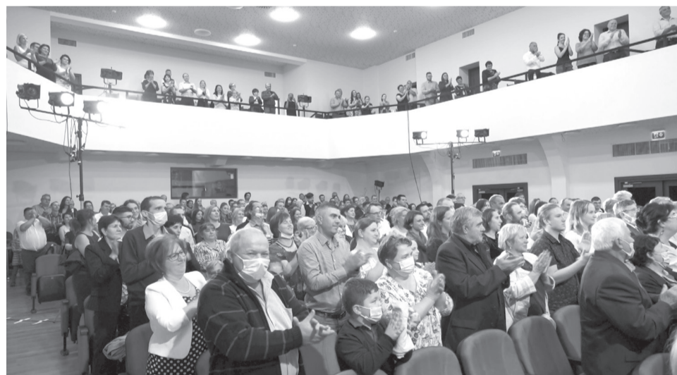
Megtelt a nézőtér a nyitányon: a szigligetisek a Valahol Európában című musicalt adták elő