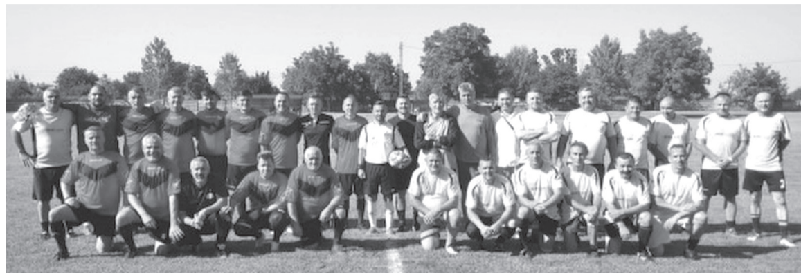
Az egykori székelyhídi játékosok nagyon jó mérkőzést játszottak a Nagyvárad Öregfiúk csapata ellen

Centenáriumot ünnepelt a székelyhídi labdarúgás