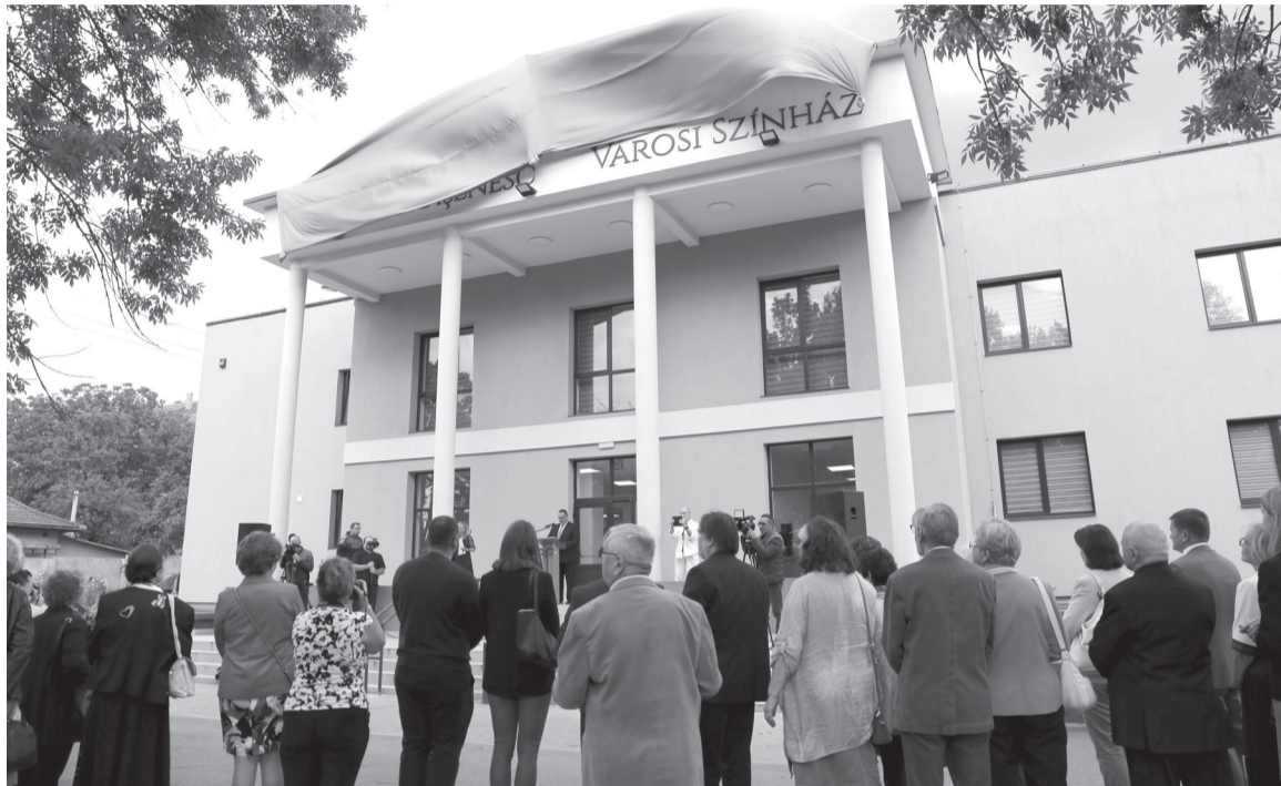
A felújított székelyhídi művelődési ház a rendezvények mellett közsínházi előadásoknak is helyszínt fog biztosítani

Szabó Ódzsa-vándorbérletet hirdetett a nagyváradai társulat