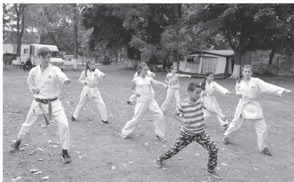
A változatos karatétábor napi programjában három edzés is szerepelt

Ezekon a programokon kívül olyan, önkéntes tevékenységeket kínáltak a táborozóknak, mint a rajzverseny, szalmafonás, festés, ismerkedés a kovácsolás alapjaival.