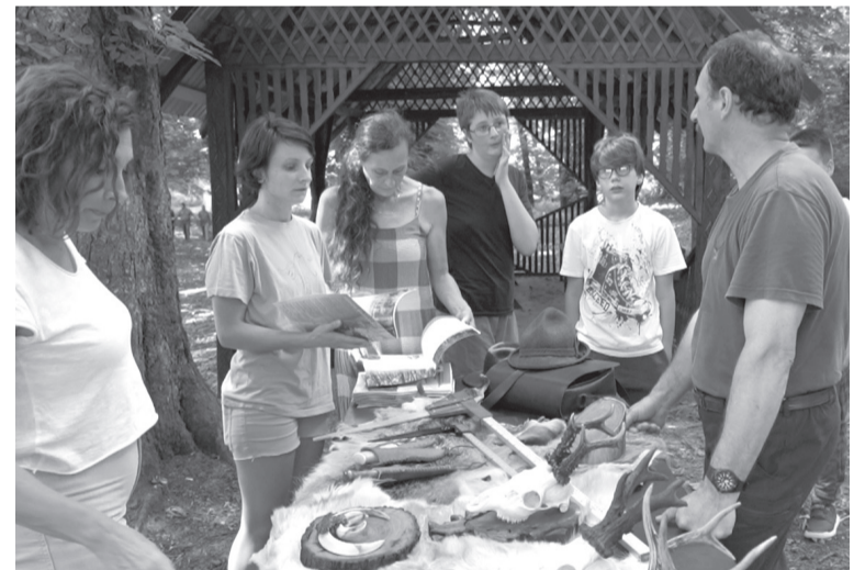
A túrázók az erdészet szerepéről és tevékenységéről is hallhattak egy gyors ismertetőt és termékbemutatót

Végigsétáltunk a halastó partján, elértük a majdnem másfél százados őstölgyes rezervátumot. Kettős indokkal helyezték