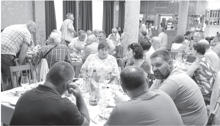
Jó hangulatban telt el a változatos nedűk kóstolása Hegyközszentmiklóson