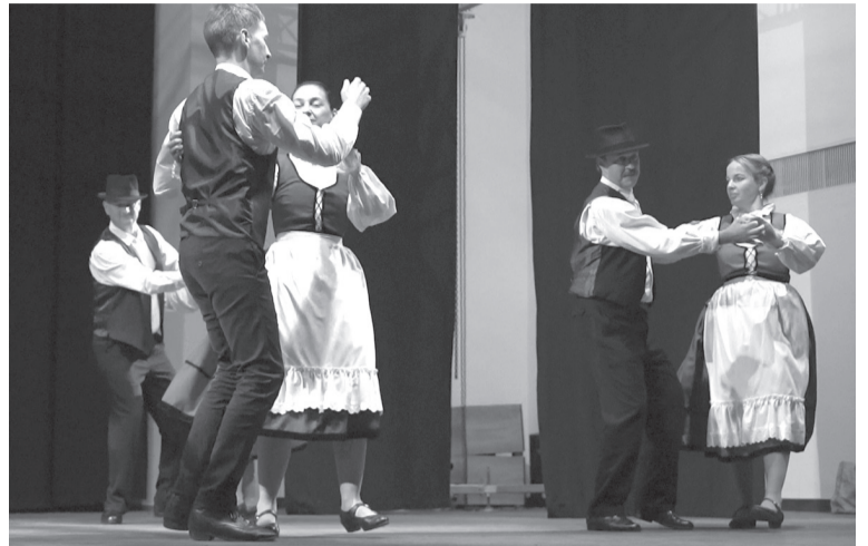
A szegedi Senior csoport bonchidai táncokat mutatott be