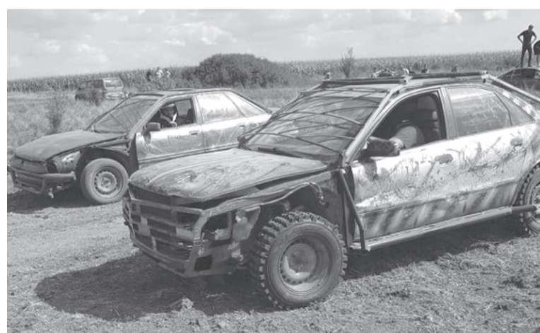
Több mint húsz autó versenyzett az először megszervezett roncsderbin