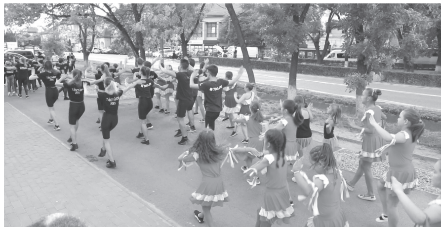
A TDC-sek a fellépés előtt látványos próbát tartottak a színház előtti téren