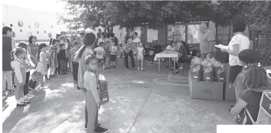
Az adományozó Rákóczi Szövetség arra is figyelte, hogy a fiúk és lányok eltérő színű táskát kapjanak