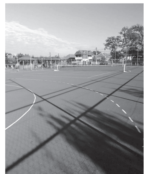
Gumiréteggel látták el a focipályát, ahol lábteniszpályát is sikerült kialakítani

Az érkörtvélyesi képviselő-testület ülésén a tanácsosok felvetették azt a problémát, hogy az orvosi rendelőknel várakozó betegeknek esetleg esőben kell állniuk. A helyi tanácsosok arra kérték a polgármestert, hogy vegye fel a kapcsolatot egy kivitelezővel, hogy teraszt építsen ki mindkét orvosi rendelő elé, azért, hogy civilizáltabb körülmények között tudjanak várakozni a lakosok. Nagy István polgármester közölte, hogy ez a terv is meg fog valósulni.