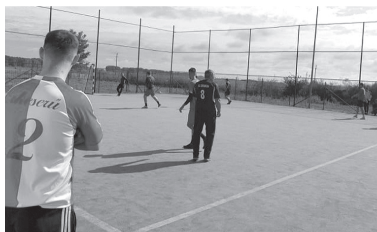
Sokan voltak kíváncsiak a környező települések csapatainak focibajnokságára