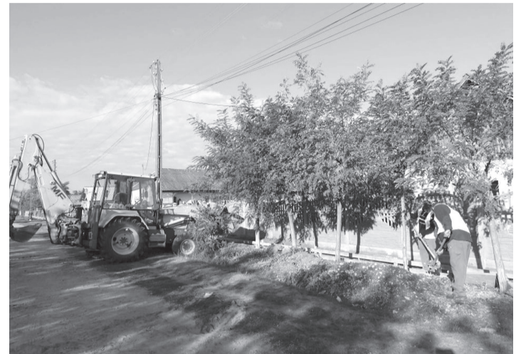
Járdákat építenek, szélesítenek, korszerűsítene

nek járdák Érkörtvélyesen és Vasadon. Ezek kiválasztása úgy történt, hogy Érkörtvélyesen megbeszéltek a tanácsosokkal, hogy melyik utcába létesítsenek járdát, Vasadon pedig a régi járdát újították fel, felszedték a régi elavultat, és újat helyeztek el mintegy ötszáz méteren.