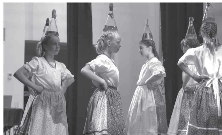
A Zajgó kiscsoportjának tagjai eszközös táncokkal nyitották az előadást

Az 1955-ben alakult Szeged Táncegyüttes a város legnagyobb létszámú és legrégebbi múltra visszatekintő hagyományörző együttese, amely Szeged kulturális-közművelődési és művészeti életében évtizedek óta meghatározó szerepet tölt be. Az együttes célkitűzése a Kárpát-medencei magyar és más nemzetek folklórhagyományainak megismertetése, terjesztése és színpadra vitele korszerű koreográfiák képében.