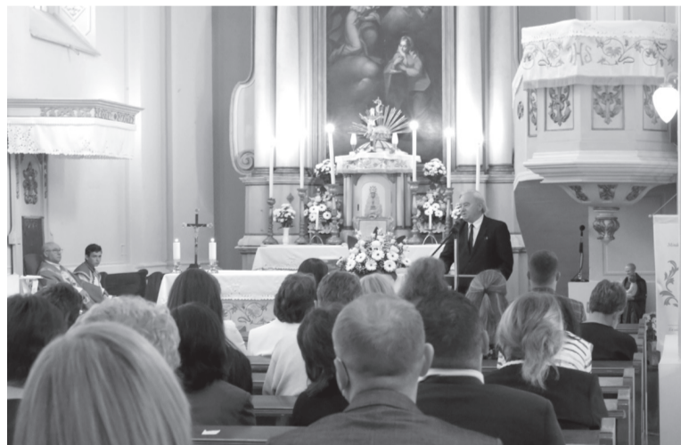
Ünnepi szentmisével egybekötött tanévnyitót tartottak a Bihar megyei magyar iskolák számára a szentjobbi római katolikus templomban

hegyi beszédét példázva, anyanyelvünk megőrzésének felelősségét nyomatékosította. A pedagógus feladata, hogy ne csak tudást, hanem az általános derűt, világosságot is vigyen az iskolákba.