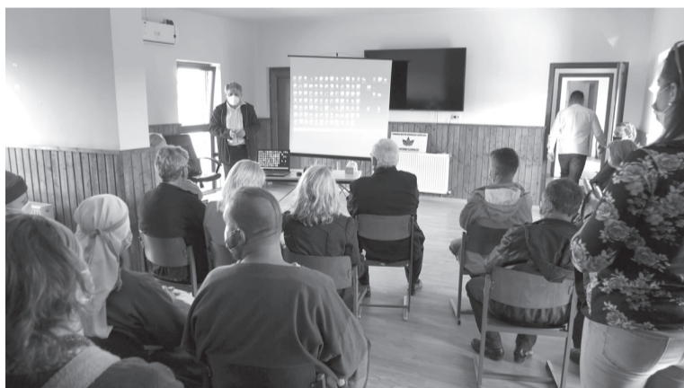
A helyi értékeket ismertető konferenciával kezdődött a szőlőfesztivál és vásár