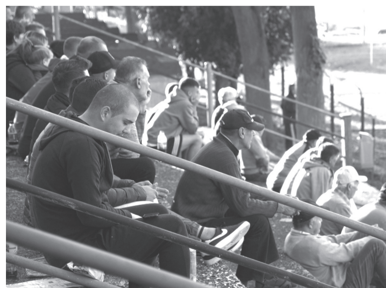
Nélkülük nem megy. A szurkolók érdeklődéssel kísérik kedvenc csapatukat

Újra elrajtolt a Bihar megyei első osztályú labdarúgó-bajnokság idén szeptemberben, amelyben az idén százéves fennállását ünneplő székelyhídi Sasok focicsapat is szerepel. Mint ismeretes, a versenykiírást a világhírűvany miatt a múlt idényben felfüggesztették, a 2021–2022-es idényt a hatályban lévő egészségügyi szabályozások betartása mellett kezdhették csak meg. A csapatokat két nyolcas csoportra osztották, a Sasok az Északi csoportban hetedmagukkal kezdhették meg a küzdelmeket. Az első játéknapon magabiztos, 8-0-s győzelmet arattak Élesden, a helyi Crişul csapata ellen. A második fordulón a Sasok hazai pályán látták vendégül az erre a kiírásra feljutó Cserpataki Slovan csapatát, az összecsapás gól nélküli döntetlennel ért véget. A veretlen székelyhídi gárda a harmadik fordulón, a papíron esélyesebb Borsi Viitorulnt látta vendégül, a mérkőzésen a vendégcsapat 2-0-ra diadalmaskodott, így három forduló után egy győzelemmel, egy döntetlennel és egy vereséggel a negyedik helyen állnak a Sasok.