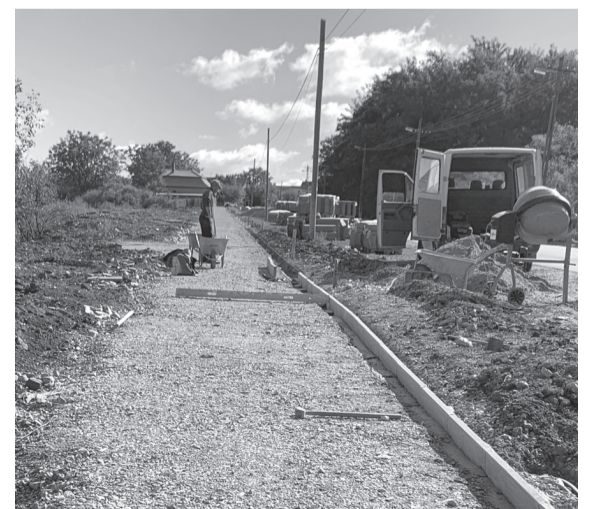
Elkezdődtek a sétány kialakításának munkálatai

A munkálat szeptemberben vette kezdetét, kivitelezését hosszú előkészítő munkák előzték/előzik meg, azonban a végeredmény egy mintegy 220 méter hosszúságú és két méter széles gyalogos közlekedést biztosító szakasz építése lesz. Az előljárók szerették volna kicsit egyedivé és szebbé tenni egy egyszerű járdánál, így kezdeményezték, hogy a sétányt színes járólappal rakják ki. Ennek teljes hosszán végig kihelyeznek kültéri padokat, melléjük parki, utcai hulladékgyűjtő kukákat, díszfákat. A kellemes esti hangulatot pedig több dekoratív napelemes villanyoszlop fogja biztosítani.