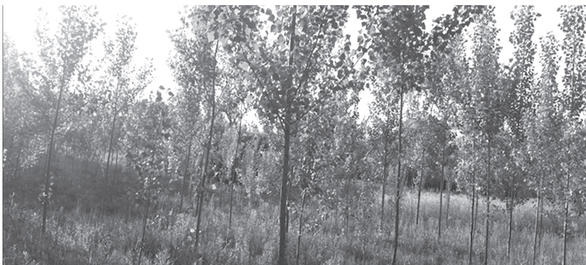
Magasabb dombvidékek, hegyek esetében a túlevelűek ajánlottak, mint a luc-, jegenye-, sima-, fekete-, erdeifenyő

Azok a fajok, amelyeket érdeme-sebb magról vetni: akác, tölgyfajta, bükk, éger, hársfa, szelídgesztenye, nyírfa és a különböző fenyőfajta. A magról vetés esetében a magokat beszerezhetjük csemetekertekből, az erdőből vagy akár otthonról a saját fánkról is, ha erre módunk van. Direkt vetés esetében a beszer-