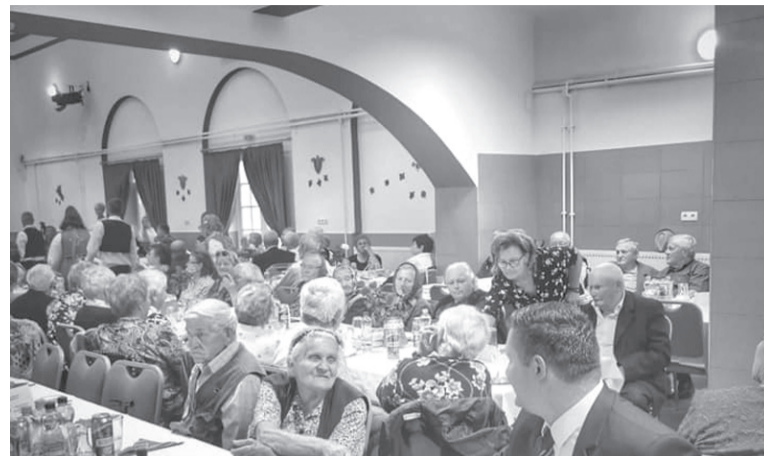
Ünnepeltek Bihar községben a szép korúak első találkozásán

Az egyházakkal, a civil szervezetekkel hagyományosan szoros és jó az együttműködés. A polgármesteri hivatal állandó támogatója, társszervezője, adott esetben kezdeményezője több jelentős ünnepségnek, melyeken keresztül erősítik a közösségi szolidaritást, megőrzik a nemzeti hagyományainkat, kultúránkat. Ide sorolható a magyar kultúra napjának ünnepi rendezvénye, a virágkarnevál bihari megrendezése, az első Őszi szüreti vásár, a nemzeti és egyházi ünnepeink támogatása, ahogyan a népi hagyományainkat felelevenítő szüreti bálóké is mind Biharon, mind Hegyközkovácsiban is. A polgármester közölte, a kultúra terén elért