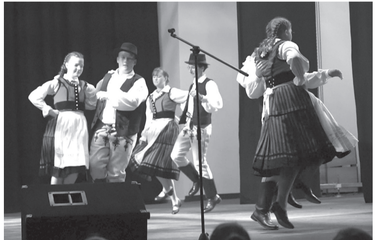
Dél-alföldi táncokat láthattunk a házigazda Zajgó Néptáncsoporttól

az együttes mellett felnevelőkben van a hasonló nevet viselő zenekar.