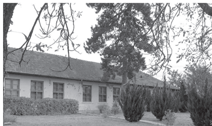
A gálospetri Roth-házban korszerűsítik a fűtési rendszert, az épületbe egy időre az iskola fog átköltözni