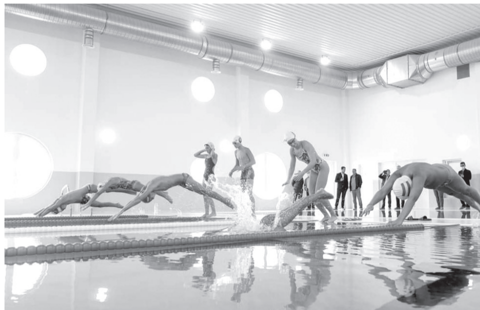
A tanuszoda átadására meghívták nagyvárad Crișul Sportklub úszóit is

Hivatalosan is megnyitotta kapuit a székelyhídi tanuszoda. A sportlétesítményben egy úgynevezett fél olimpiai (25 méter hosszú és 12,5 méter széles), valamint egy kisebb (6x12,5 méteres), gyermekek úszásoktatására alkalmas medence kapott helyet. A székelyhídi úszásoktatás beindításának hármas célja van. Egyrészt, hogy a gyerekek magabiztosan mozogjanak a vízben. Továbbá az egészséges életmódra való nevelés is kiemelten fontos, hiszen az úszás az egyik legegészségesebbnek tartott mozgásforma, mely hozzájárul az izomzat normális fejlődéséhez. Harmadsorban pedig azt szeretnék, hogy a helyi tehetséges fiatalok közül a vizes sportágban sikereket elérő él-sportolók kerülhessenek ki.