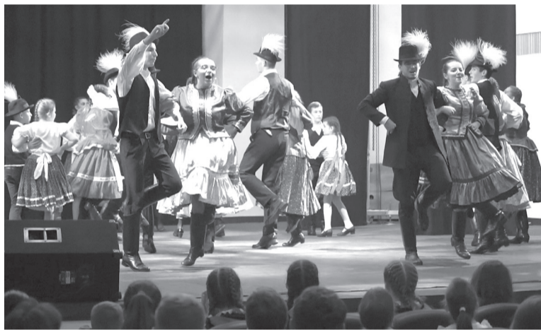
A micskei Görböc táncosai makkfalvi és tyukodi táncokkal léptek fel