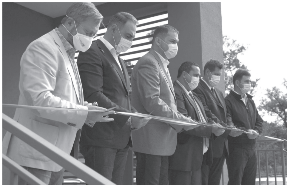
A most felavatott létesítményben két (25x12,5 és 6x12,5 méteres) medence kapott helyett

A befektetés a gyermekeknek és felnőtteknek egyaránt sportolási, kikapcsolódási lehetőséget nyújt