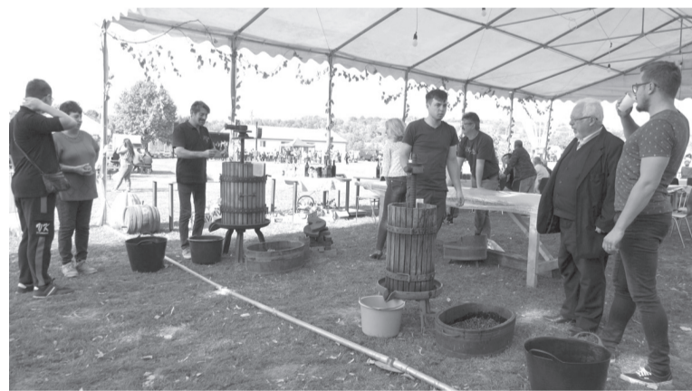
Must- és borkóstolót is tartottak a szentjobbi rendezvénysorozaton

gi fegyverek bemutatója, szüreti népszokások előadása stb. Az esemény főszervezője a Pro Szentjobb Alapítvány volt, és társszervezőként közreműködött a helyi polgármesteri hivatal, a helyi népdalkör és a huszár hagyományörzők is.