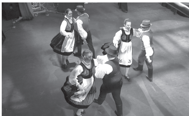
A Ficergők marossárpataki táncokkal jeleskedtek a színpadon