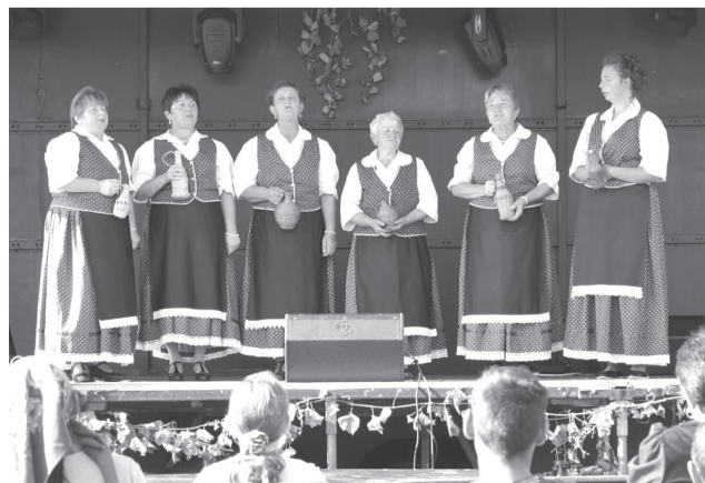
Több néptáncgyűttes és népdalkör is fellépett az eseményen

A rendezvénysorozatot a magyar kormány és az agrárminisztérium támogatta, és a Hungarikum Bizottság települési, tájegységi értéktárak létrehozását célzó pályázatának keretében rendezték meg. A nagyszabású eseményen helyi értéktár-konferenciát tartottak, melyen a település épített, kulturális, természeti, gasztronómiai és ipari értékeiről volt szó. Ugyanakkor a szórakoztató események sem hiányozhattak, mint például a hagyományörző, gasztronómiai és kézműves termékek bemutatója, de volt íjászat, bográcsfőzőverseny, must- és borkóstoló, sárkányrepülés, kézműves foglalkozások, lova-