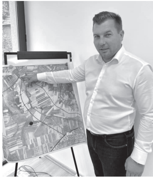
A polgármester az építendő utakról is beszélt

A polgármester és a helyi tanács négyéves mandátuma első évének összefoglalójaként elmondható, hogy a rövid távra kitűzött céljaik nagyrészt