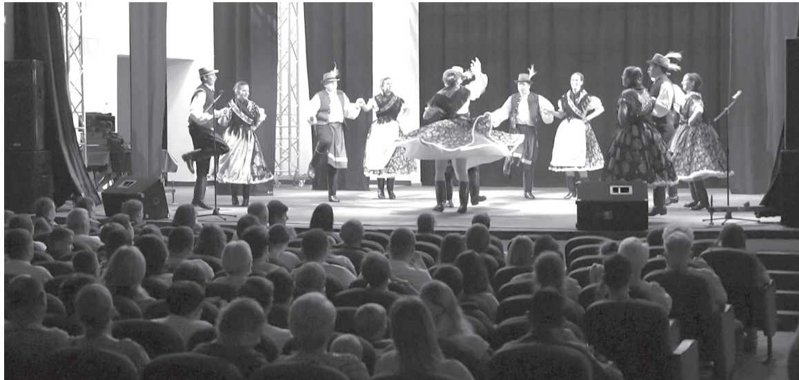
A Bodzavirág csoportja szilágysági táncokat hozott Székelyhídra

A magyar néptánc remekeiből kapott ízelítőt a közönség az az Együtt dobbanó című ünnepségen