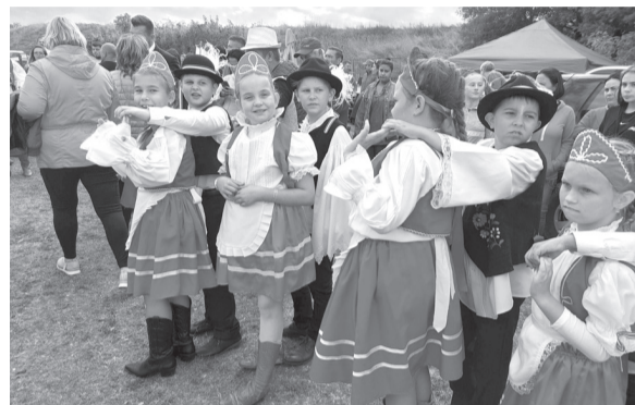
Nagyon jó volt a hangulat a bihari szüreti rendezvényen

sikerként könyvelik el azt is, hogy hosszas bürokratikus hercehurca során végre az önkormányzat tulajdonként telekkönyvezték a bihari földvárat. Ezzel egy időben megújult a bihari értéktári bizottság is, mely a jövőre nézve több helyi érték feltérképezését és értéktárba vételezését tűzte ki célul.