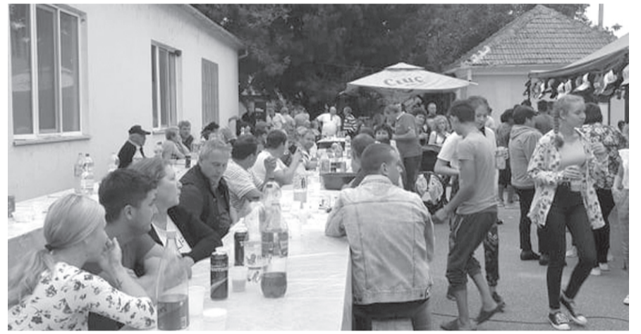
Nagyon jól érezte magát mindenki a családi napok rendezvényein