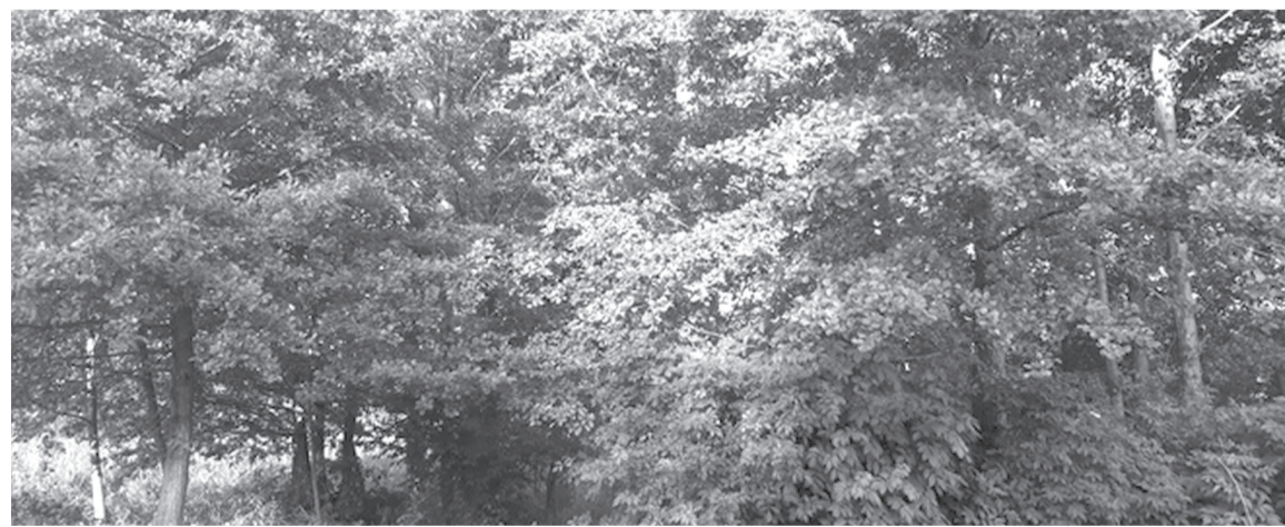
A jövő generációit is megilleti az erdők tiszta levegője. Becsüljük meg, óvjuk és gyarapítsuk a zöld területeket

Dugványozással könnyen szaporítható fajták közé tartozik az összes nyárfa és fűzfafajta. A dugványokat ez esetben levághatjuk fiatalabb fánkról, erre alkalmasak a korona csúcsából az egy-két éves fiatal hajtások.