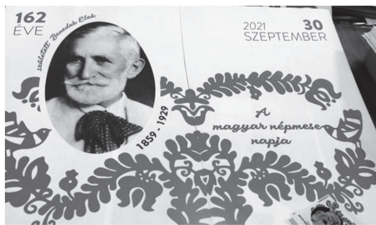
A nagy mesemondó, Benedek Elek születésnapját ünnepelték meg, ami egyben a magyar népmese napja