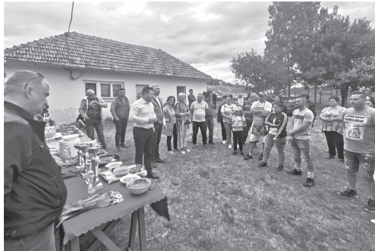
A bihari szüreti vásáron gulyáskészítő tudásukat is összemérték a csapatok

A további sportágak kapcsán pedig komoly távlatot nyit az elmúlt időszakban aláírt szerződés egy új sportcsarnok megépítésére, ami a fejlesztési minisztériumhoz benyújtott egyik nyertes pályázatnak köszönhető.