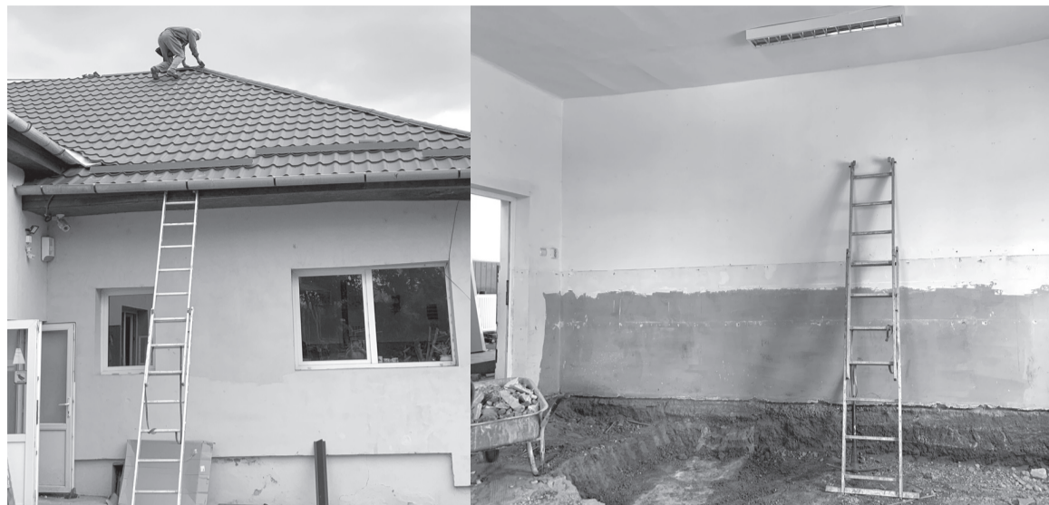
A bogoyoszlói általános iskola régi tetőszerkezetét újra cserélték ki, s egy újabb osztálytermet is teljesen felújítottak

Teljesen új tetőszerkezetet kapott a tanintézmény