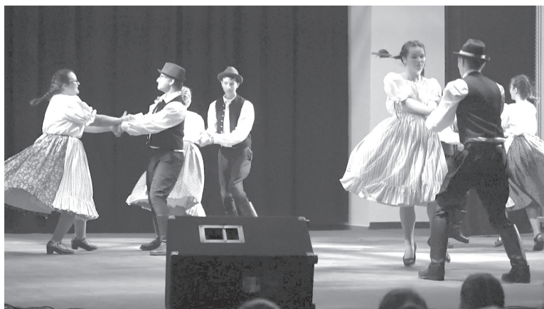
Ugrós és csallóközi táncok a csokalyi Fényes néptáncsoport előadásában