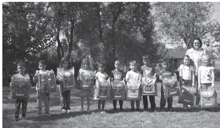
A csokalyi kisdíjak új iskolatáskájukkal