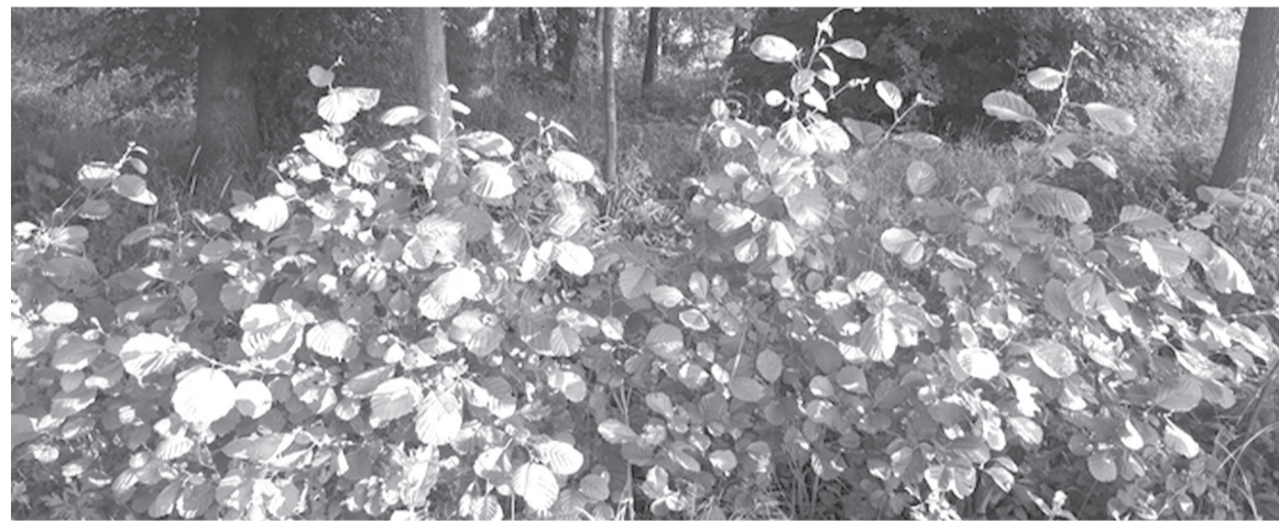
A magok közötti vetési távolság 10–20 cm mind a lombhullató fajtáknál, mind a túlevelűeknél, örökzöldeknel

fűzfa- és égerfafajták. A szárazabb, terméketlenebb, meredek területekre pedig ültethetünk különböző lombhullató fajtákat, mint a tölgy, cser, akác, kocsányos tölgy, nyír, fekete-amerikai dió (kókuszfa). Magasabb dombvidékek és hegyek esetében pedig a túlevelűek ajánlottak, mint a lucfenyő, jegenyefenyő, simafenyő, fekete-fenyő, erdeifenyő stb.