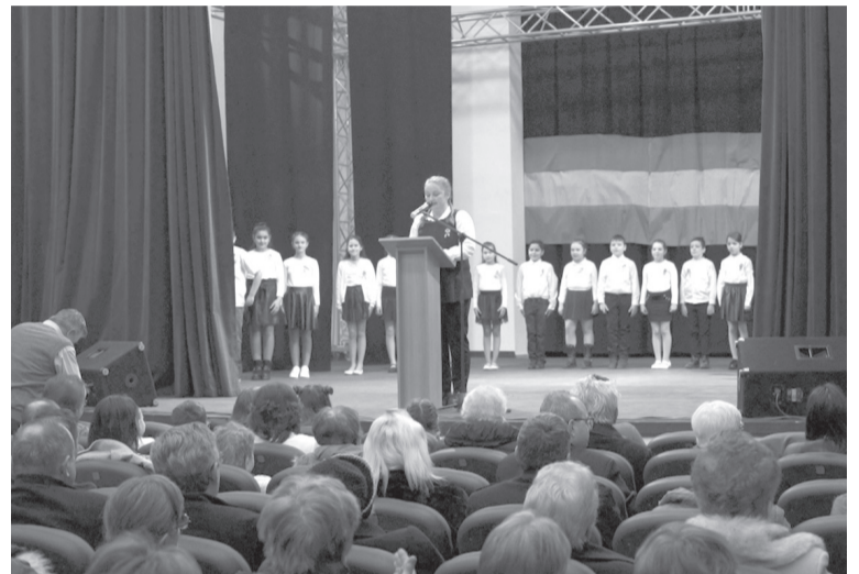
A változatos színházi programok lélekben is összehozták az ünneplőket

mit jelent számára e megemlékezés napja, majd a nagy kérdést a hallgatóságnak is feltette: mit jelent neked március 15-e? Büszkeséget afelől, amit őseink teljesítettek? Elszántágot a mindennapokban való kitartáshoz? Tenni akarást a közösségért, amelyben élünk? Vagy netalán szegyenérzetet amiatt, hogy elengedjük a magyarságunkat jelentő szokásokat, pilléreket az életünkől? Elmékedésre sarkallta a nézőtérre ülőket, hogy a közösségünk, a szülőföldünk elvesztésétől való félelem helyett arra válaszoljunk: mit tudunk mi tenni a megmaradásunkért?