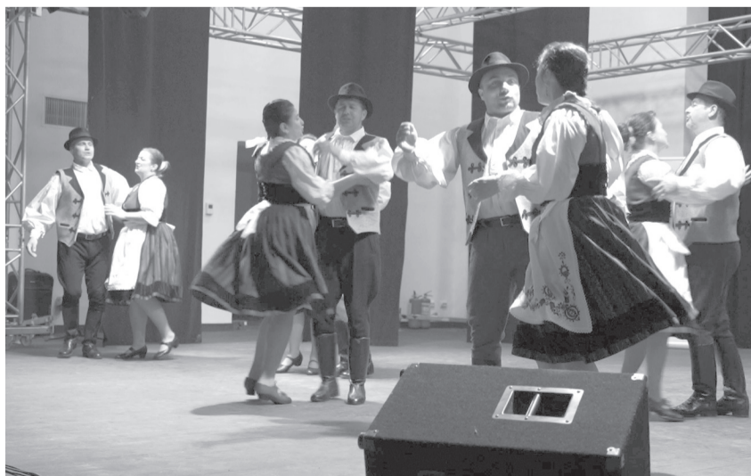
A Bábota 2015 tavaszán alakult meg egyedi amatőr szenior néptánc csoportként Monospetriben

Támogassa adója 3,5%-ával az Ér Hangja Egyesületet!