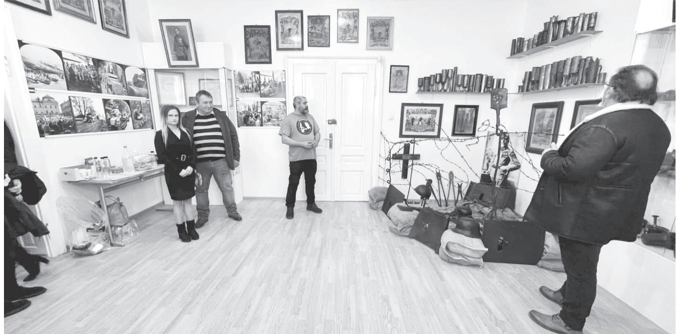
Az állandó kiállítás gyűjteménye folyamatosan bővül a felajánlások révén világháborús emléktárgyakkal

pontjain, a felújított és modernizált elektromos hálózat zavartalan működése kárpótolja a település lakosait az esetleges kellemetlenségekért.