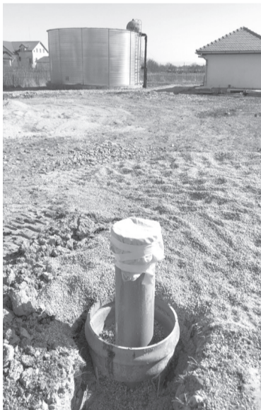
Az új kútban nagyon jó minőségű vizet találtak