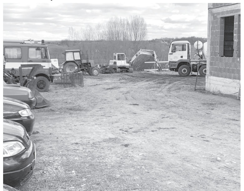
A járművek élettartamát is megnöveli, ha védett helyen lesznek

Megkezdődött Érboggyoszlón annak a hat plusz egy férőhelyes gépszínek a megépítése, amely azt a célt szolgálja, hogy a helyhatóság tulajdonában lévő járműveket és nehézgépeket megfelelő körülmények között tudják tartani akkor is, amikor ezek éppen használaton kívül vannak. Az eredetileg hat férőhelyesre tervezett gépszínt azért fogják még egy külön zárt térrel megtoldani, hogy a 2017-ben vásárolt tűzoltóautó télen is védett helyen legyen; így a fagyásveszély miatt nem kell belőle a vizet leengedni. Eddig ugyanis telente a vizet leengedték a tűzoltókocsiból, és csak riasztás esetén kezdték el újra feltölteni, ami ilyenkor jelentős idővesztéssel járt. Erre jelent megoldást a most készülő zárt helyiség. Hasonló a helyzet a többi járművel is, hiszen mindegyik sokkal hamarabb bevethető, ha nem kell az időt azzal vesztegetni, hogy leseperjék róluk havat vagy a szélvédőről lekaparják a jeget. A gépszín helyet ad majd a polgármesteri hivatal