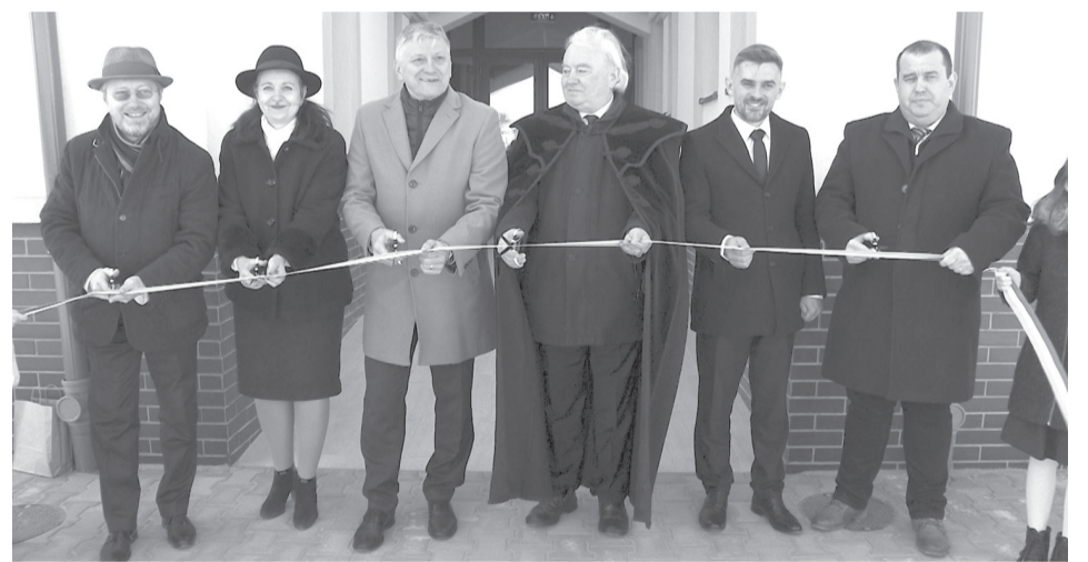
A bölcsőde átadása hatalmas mérföldkő a település életében

Húsz magyar gyermeknek biztosít majd korszerű nevelési és oktatási feltételeket az új szalárdi bölcsőde, amelyet a Kárpát-medencei Óvodafejlesztési Program kere-