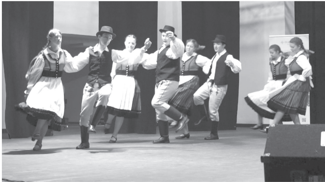
A házigazda Zajgó Néptánc csoport felcsiki táncai megalapozták az est hangulatát