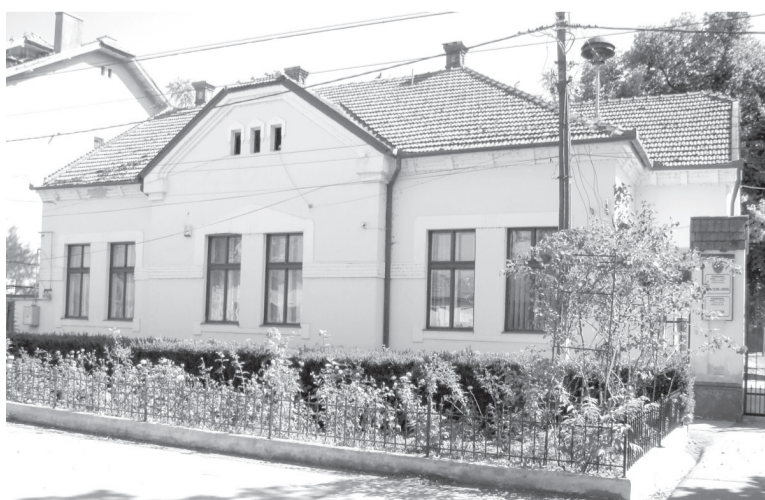
Megerősítik a 110 éves impozáns épület tartószerkezetét

kibővül Szalárd község polgármesteri hivatala. A 15,8 millió lej összértéket meghaladó beruházást a Fejlesztési, Közigazgatási és Közmunkákért Felelős Minisztérium biztosítja. A megújult épület belső terét összesen 1274 négyzetméterre bővítik. A kibővített épületben a házasságkötési és lakosság-nyilvántartási szolgáltatások is helyt kapnak majd. A munkálatok során a több mint 110 éves épület tartószerkezetét megerősítik, hőszigetelik és energiatakarékossá teszik. A felújításnak köszönhetően pedig az épület fenntartásának költsége is jelentősen csökken. A kivitelezési szerződés értelmében a munkálatok 26 hónapot vesznek majd igénybe.