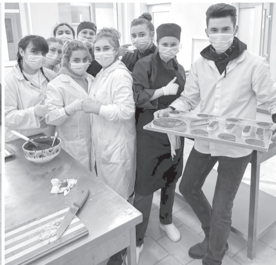
Mind a szakács-pincér, mind a pék-cukrász szakos diákok tapasztalt szakemberek bevonásával fejlesztik gasztronómiai tudásukat

Nagy hangsúlyt fektetnek a pék-cukrász, illetve szakács-pincér szakos diákok oktatására a Nagykágyai 1-es Számú Technológiai Líceum vezetői és élelmiszeripari szaktanárai. Az elméleti és gyakorlati órák mellett tapasztalt szakemberek bevonásával igyekeznek élményekben gazdag, kreatív módon kihasználni a képzés nyújtotta lehetőségeket.