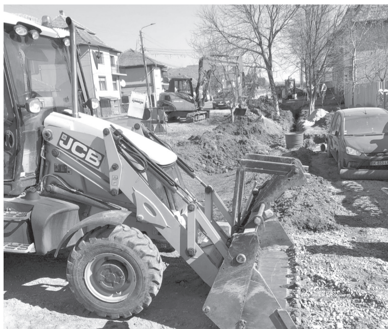
Korszerű gépek és megbízható szakmunkások biztosítják a csatornázás jó ütemben haladását

Mind az öt csapat felszereltsége kiváló: új gépekkel dolgoznak a fiatal mérnökök és szakmunkások. Ahol nem volt más megoldás, ott fel kellett törni az utat vagy a járdát, de ahogy haladtak a munkálatokkal, ezeken a helyeken megtörtént a visszabetonozás, és – ahol szükséges volt – az aszfaltozás. Terv szerint ez a beruházást december 31-ig be kell fejeznünk, ám reményeim szerint – a haladást látva – akár már ősze befejezhetőnek a munkálatok. Ezáltal év végére az emberek már rácsatlakozhatnak az új rendszerre, hogy többé ne az utcára folyjon ki a szennyvíz, és ne hagyjon kellemetlen szagot maga után. Így mindannyian élhetőbb környezetben folytathatjuk mindennapjainkat.