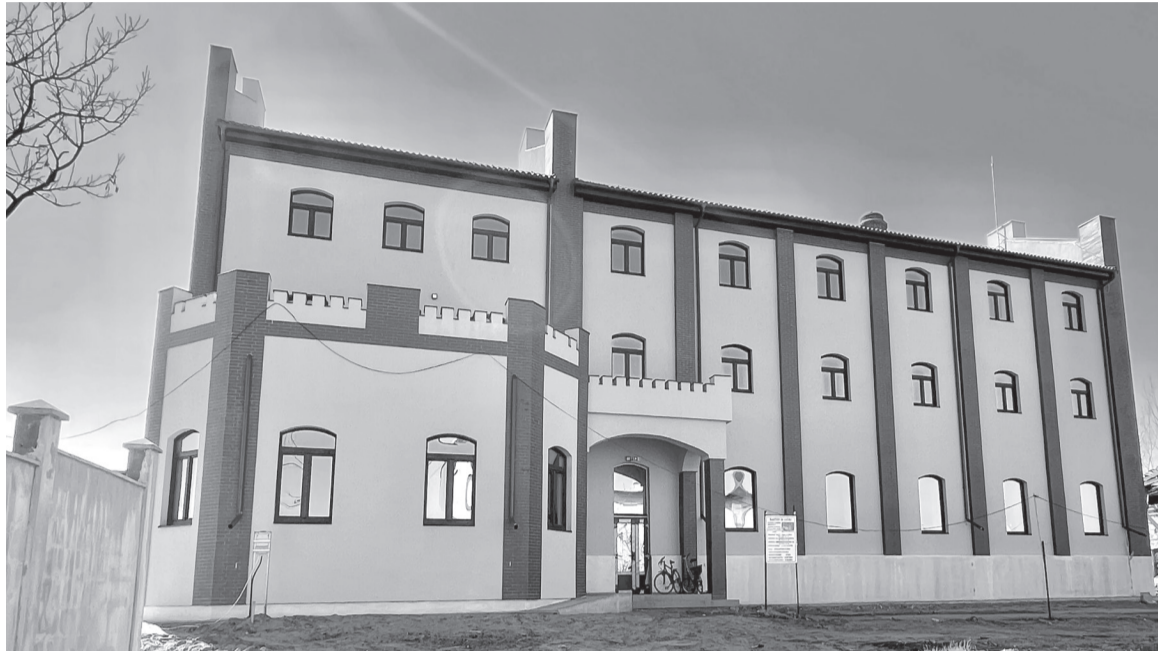
A Gizella-malom a felújítás után a környék egyik legimpozánsabb kulturális központja lesz

Az Érmellék „fővárosában” is folynak a fejlesztések, több beruházás is szimultán zajlik, sok már meg is hozta a gyümölcsét, amelyek főként az itt élők életkörülményeit hivatottak javítani. Uniós finanszírozásból a tavalyi év során közel négy kilométernyi