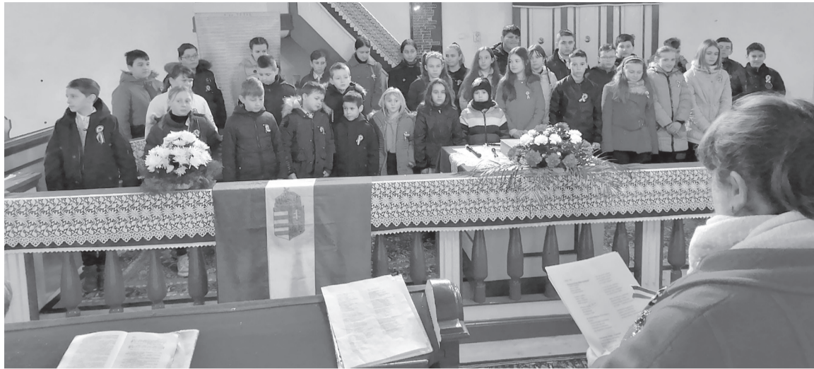
Kis- és nagydiákok közös előadása emelte az ünnepi istentisztelet hangulatát