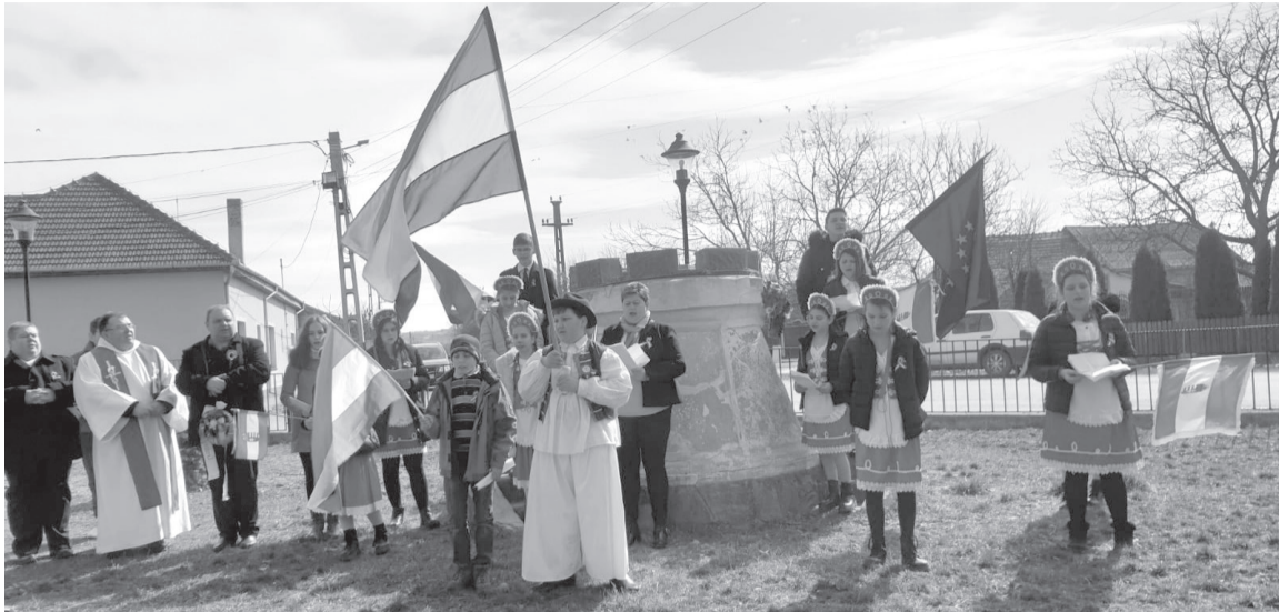
A gyerekek ünnepi műsorral tisztelegtek a forradalom hősei előtt

Ezenkívül fontos előrelépés, hogy az érado nyi iskolában kamerarendszert szereltünk fel: négy darab benti és kilenc darab kinti kamerával, valamint riasztórendszerrel láttuk el az épületet.