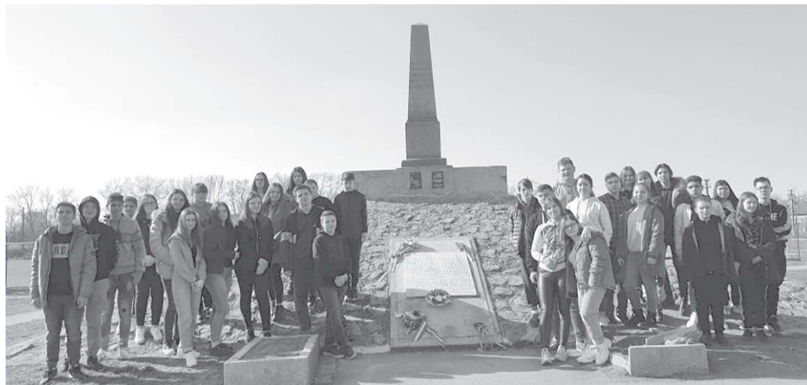
A székelyhídi és nagyváradai diákok a tizenhárom aradi vértanú emlékműve előtt

Közel 500 km-nyi „zarándokúton” vettek részt két partiumi középiskola diákjai március 19-én, ezáltal az 1848–49-es forradalom és szabadságharc hőseinek emléke előtt tisztelgettek.