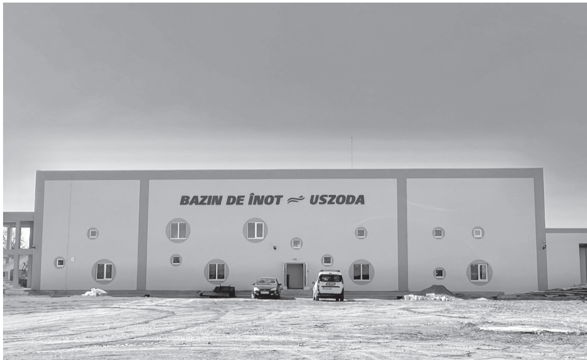
Az uszoda közeljövőben történő átadása szintén mérföldkő a város életében

Eddig a kerékpárutak szejgelyét sikerült kiépíteni körülbelül tíz-tizenöt kilométer hosszan. Mivel a város nagy területen fekszik, adott a lehetőség és az igény a városi tömegközlekedés megvalósítására is. Ennek elősegítésére közszállítási szolgáltatást fognak biztosítani. Ez nagyban megkönnyíti majd a helyi lakosok számára a bevásárlás lebonyolítását, a munkába, iskolába való eljutást.