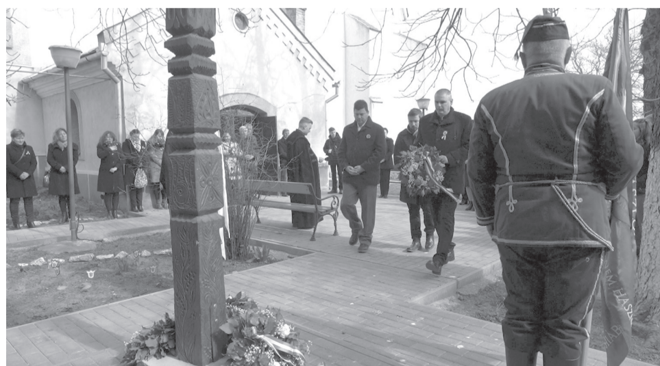
Az ünneplők megkoszorúzták a szalárdi református templom udvarán álló kopjafát