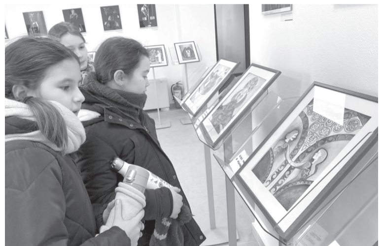
Az illusztrációk népmesei hangulatot varázoltak a színház előcsarnokába

A kiállítás a székelyhídi Szabó Ódza Városi Színház előcsarnokában is megtekinthető volt március 5-én a 16 órakor kezdődő Tavaszváró népdal- és néptáncelőadás végéig. Azok a székelyhídi diákok, akik ellátogattak a kiállításra, szintén lelkesen fogadták a színes illusztrációkat, nagy érdeklődéssel