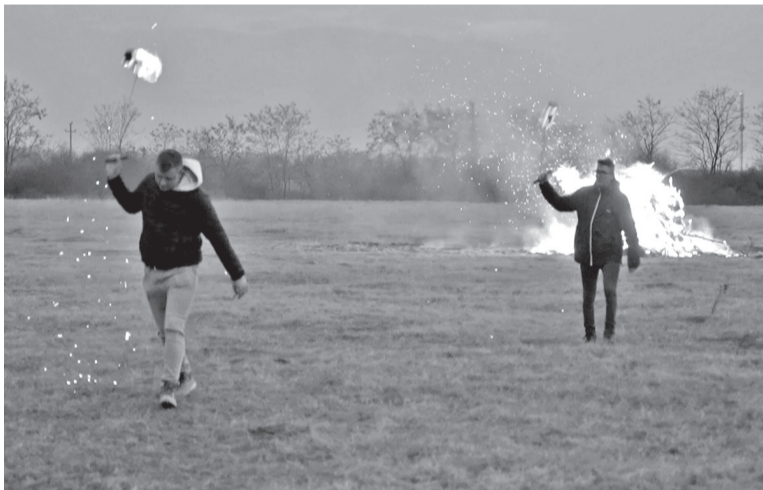
Ha a bükkfakarika-korongok magasra röpködnek, a kívánságok beteljesülnek

A hagyomány és az elnevezés a német 'Scheibé', vagyis korong szóból származik, és a szatmári svábok honosították meg a történelmi Magyarország északi területein.