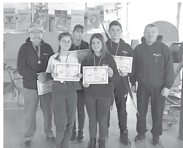
Öt teremjászunknak sikerült dobogós helyezést elérnie