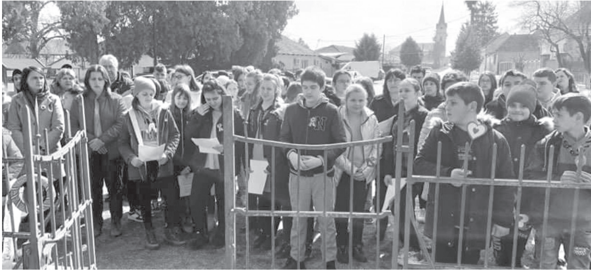
Az iskolások közös énekkel emlékeztek az 1848-as forradalomra

A helyi iskola mögötti téren kialakított emlékhely a világháborúban elesettekre mutat erőt adón, bátorító lendülettel. Ezúttal is sokan gyűltek össze az 1848–49-es forradalom és szabadságharc emléknapján, március 15-én, magyarságtudatot ápoló szándékkal.