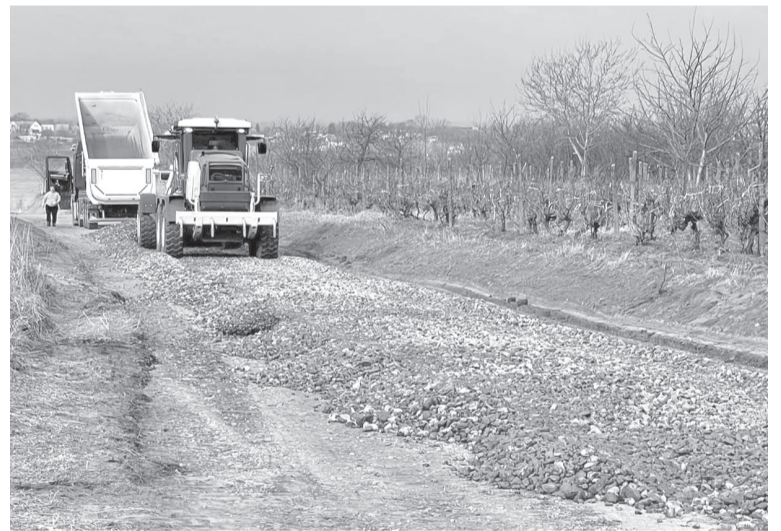
A hegyre kivezető utak kiszélesítése és lekövezése segíti a gazdák munkáját