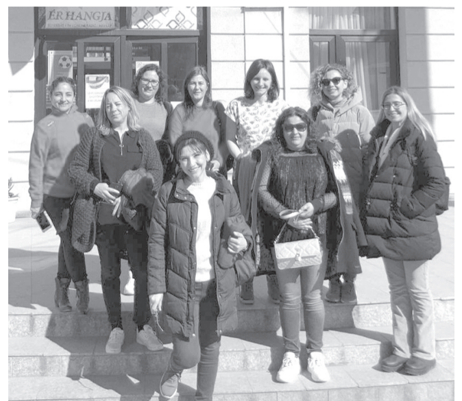
A vendégek otthonosnak találták az Ér hangja stúdióját