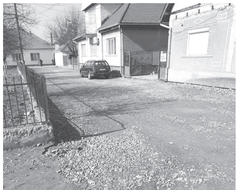
Az értarcsai polgármesteri hivatal előtti park melletti út kövezése