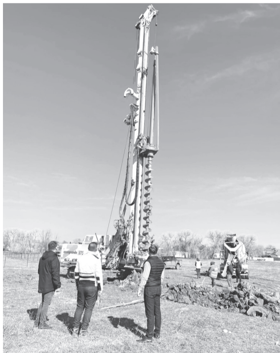
Megkezdődött a sportcsarnok építése