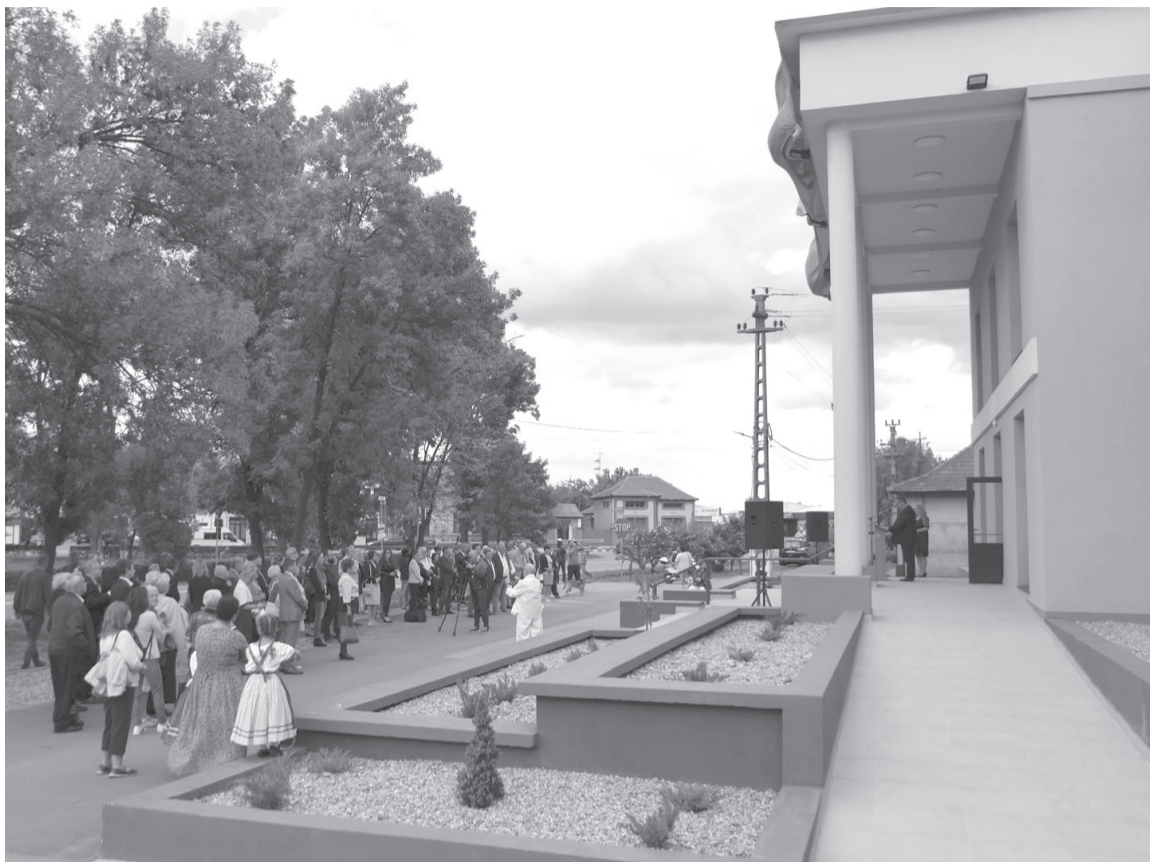
A székelyhídiak többéves álma vált valóra a Szabó Ódzsa Városi Színház átadásával