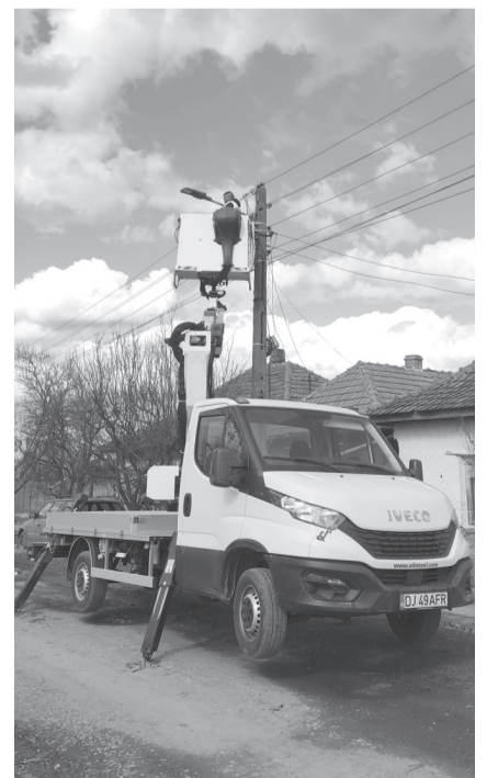
A város több utcáján már az új égők teremtenek jobb látási viszonyokat