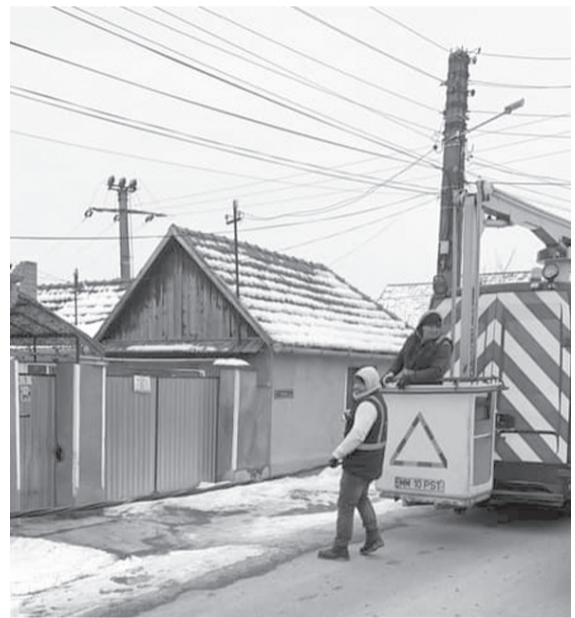
A felújított elektromos hálózat zavartalanabb áramszolgáltatást eredményez

Február elején a polgármesteri hivatal az Electrica áramszolgáltató vállalattal közösen olyan új fejlesztés kivitelezését végezte el, melynek eredményeképpen reményeik szerint sikerül végleg kiküszöbölni az időnként előálló áramingadozásokat, illetve váratlan áramkimaradási problémákat. Bár a munkálatok időszakos áramszünetekkel jártak a község különböző