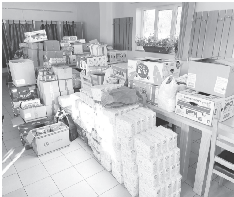
Nagy mennyiségű adományt gyűjtöttek össze a bihariak az ukrajnai rászorulóknak

Bihar községben számos olyan fejlesztés és megvalósítás történt, melyek az ott élők mindennapjait igyekeznek megkönnyíteni, kelle-