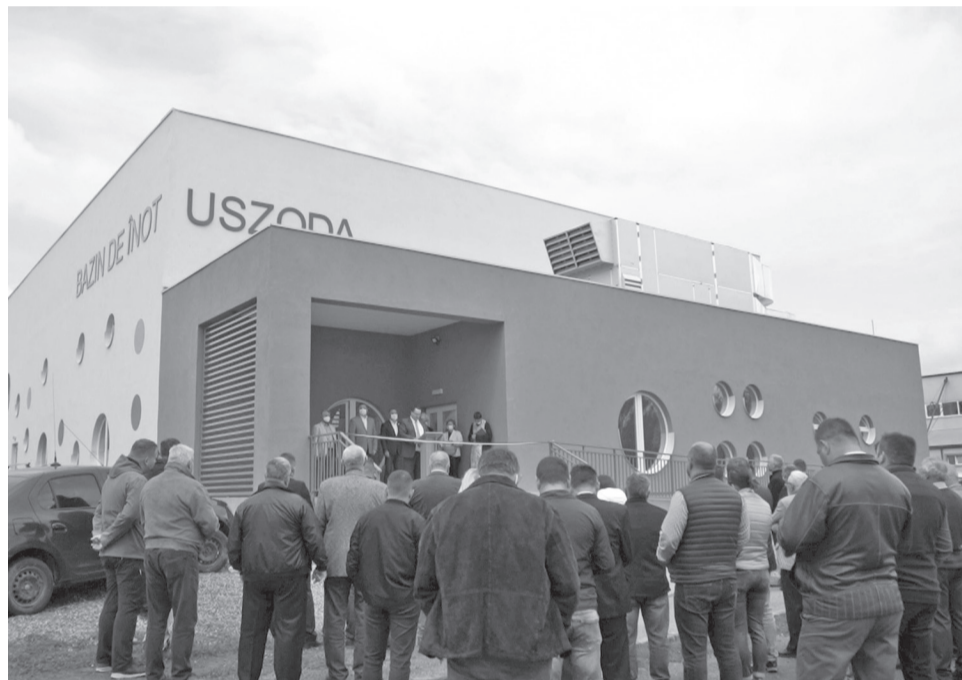
Az uszoda átadásával bővült a sportolási lehetőségek skálája