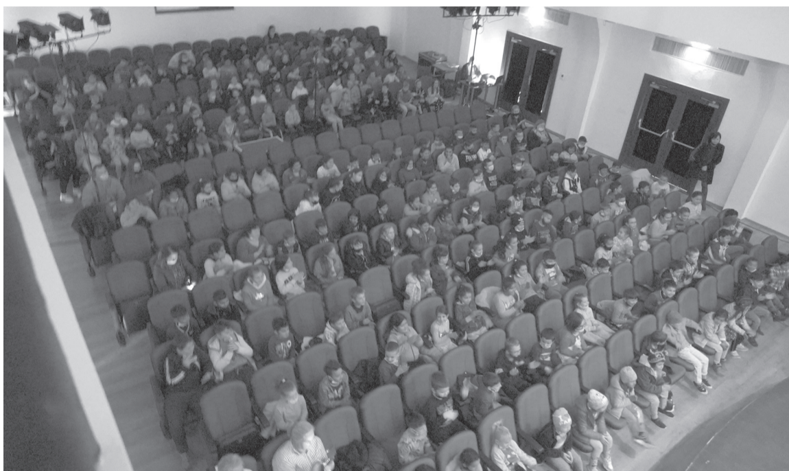
Betöltik a 346 férőhelyes nézőteret az érdeklődők a kulturális eseményeken

nek keretében hét településen kezdődtek el, illetve folynak a kivitelezési munkálatok. Elsőként Székelyhídon adták át az uszodai létesítményt az elmúlt év szeptemberében. A 25 méter hosszú nagy medence mellé épült egy tanmedence is, ahol szakemberek irányításával folyik az úszások-