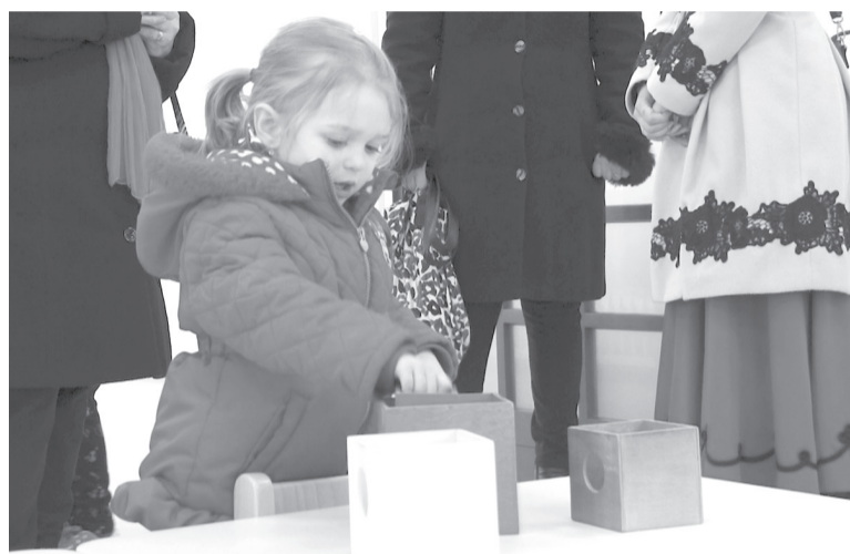
Legyen egy hely, ahol óvodás kor előtt foglalkoztatni tudják a gyermekeket