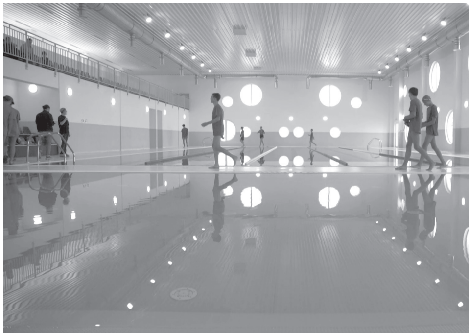
A sportlétesítmény nagyon népszerű az úszást tanulni vágyó gyerekek körében