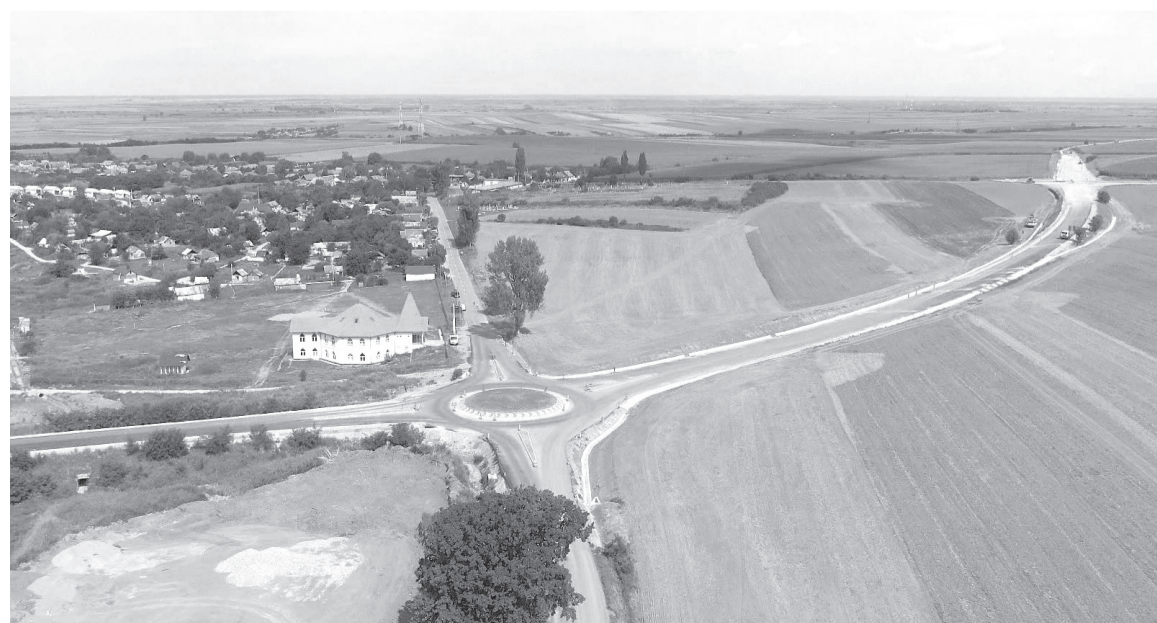
Az elkerülőút megkönnyíti a város lakóinak mindennapjait

Örömmel osztja meg a jó hírt beszélgető partnerem miszerint a városközpont egyik jellegzetes épülete, az egykori járásbíróház, ami jelenleg tanintézetként funkcionál, egy sikeres pályázat eredményeként új „köntös” ölt magára. Ugyanennek a pályázatnak másik komponense a Csokalyon megépítendő multifunkcionális épületgyűttes. Ez a közösségi tér színházi előadások, családi események megtartására is alkalmas lesz majd. Lesz egy „kinyitható” része is a komplexumnak, ami tornaórák megtartására nyújt majd lehetőséget. Szintén ennek a pro-