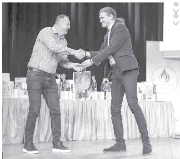
A Quintessence díjátadó gáláján többször is szólították

A benevezett székelyhídi pálinkák közül hat minta aranyéremes, három pedig championdíjas is lett, ami az adott kategória legjobb pálinkáját jelenti, illetve a közönség nagydíját is elhozták. Ezek az Irsai Olivér szőlőpálinka, a birsalmapálinka és egy szőlőkeverék: a feketeleányka, merlot és cabernet sauvignon elegye, a közönségdíjas pedig a magyarádi fehér szőlőből készült italuk lett.