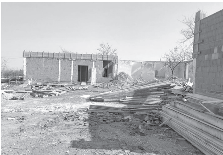
Zajlik a gálospetri iskola újjáépítése és bővítése

Értarcsán a helyi rendőrségnek otthont adó épületet sikerült újrafesteni és benti mosdót kialakítani. Ugyanitt 110 méteren utcát köveztünk, várjuk, hogy rákerüljön az aszfaltréteg. Ezenkívül az értarcsai polgármesteri hivatal előtti park mellett is zajlik az út lekövezése, terveink szerint ide is aszfalt kerül