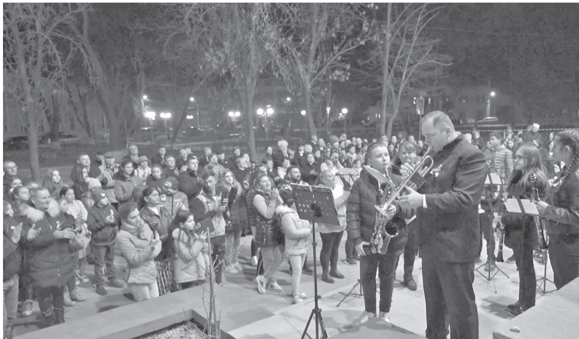
A két év után újra, korlátozások nélkül összegyűltek a kis helyi rézfúvósokra is rácsodálkozhattak

A magyar szabadság születését ünnepeltük március 15-én