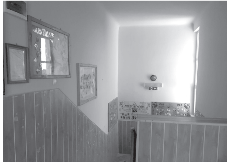
Az értarcsai iskola több helyiségét újrafestették