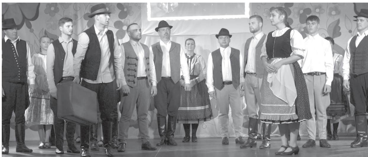
Gyertek, magyar fiúk volt a címe a Bábota március 15-i előadásának