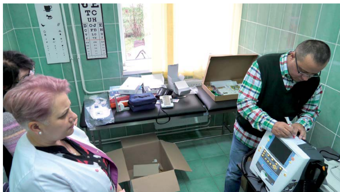
Az oktatás ideje alatt iskolaorvos fogadja a gyerekeket az újonnan berendezett rendelőben

már nagyon régen megérett az aszfaltozásra. Mindemellett sajnos a városvezetés nagyon sokszor olyan problémákba ütközik, amelyek tőle függetlenek és kevés ráhatása