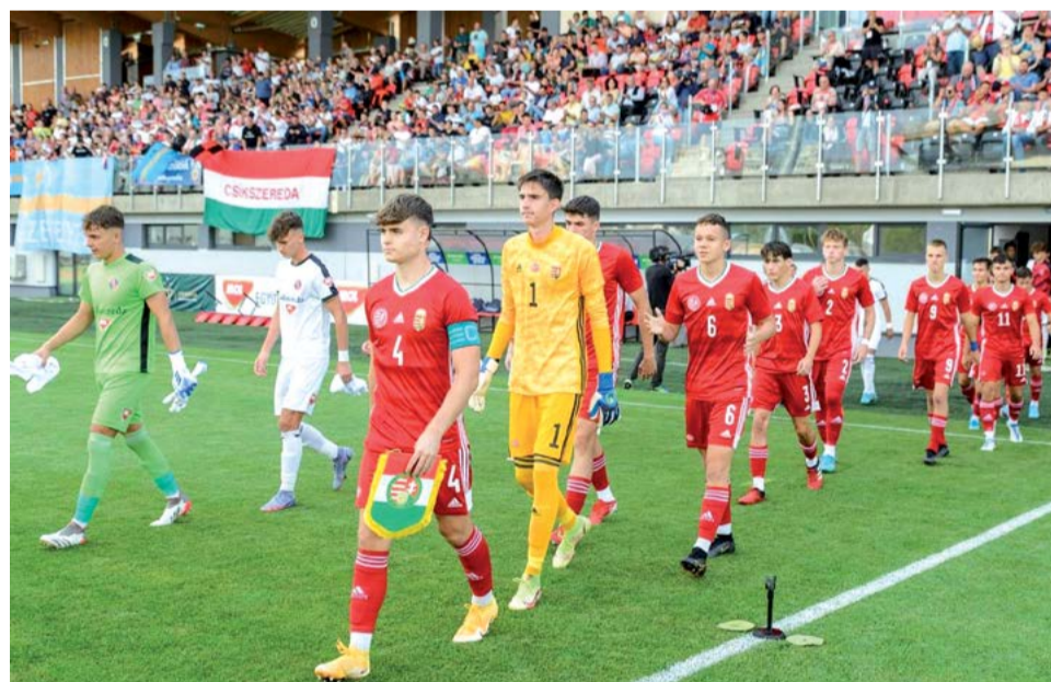
„Óriási élmény volt az U18-as magyar nemzeti válogatottat Csíkszeredában csapatkapitányként a pályára vezetni” – vallja interjúalanyunk

– Munka, szorgalom, alázat és önbizalom: ha te nem hiszed el magadról, hogy képes vagy rá, akkor mások sem fognak hinni benne.