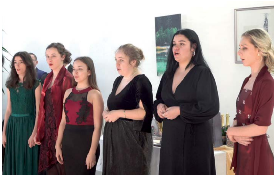
A Partiumi Keresztény Egyetem magánének szakos hallgatóinak hölgy tagjai