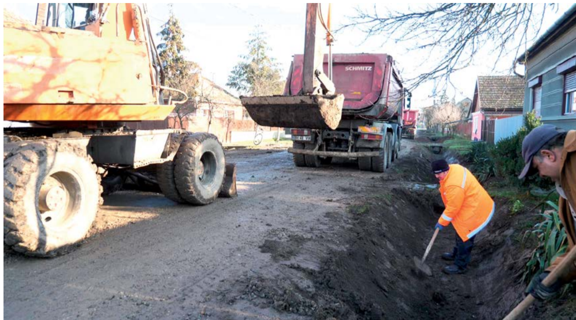
Székelyhid számos utcáján gőzerővel zajlik a hidak, árkok kialakítása, az utak aszfaltozásra való előkészítése

A felsoroltakon túl az előjáró további fontos előrelépésként említette, hogy tavaly sikerült megvalósítani Székelyhid és a hozzá tartozó települések közvilágításának korszerűsítését, valamint a hálózat bővítését, melynek során összesen 965 darab különböző erősségű LED-es égőt cseréltek ki vagy szereltek fel újonnan. A kivitelező cég egyrészt a már meglévő régi, elavult és nagyfogyasztású égőket cserélte ki, más-