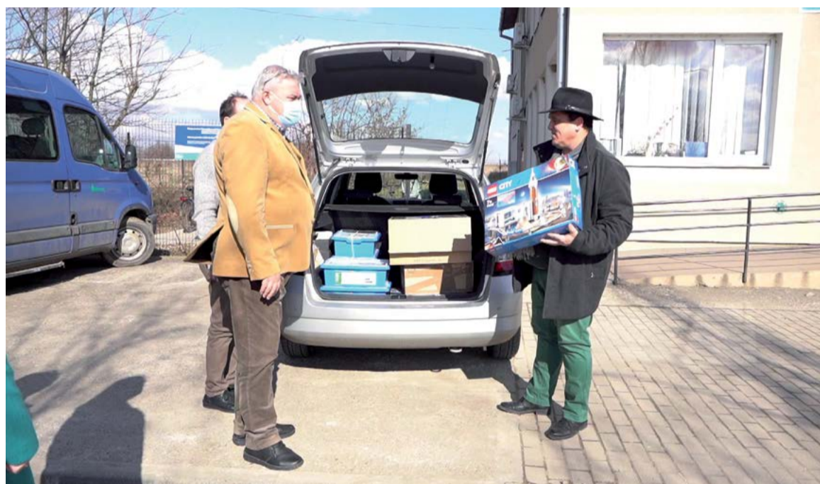
Átadják a legésszközöket. Használatuk ma már az oktatás szerves részét képezi Székelyhídon