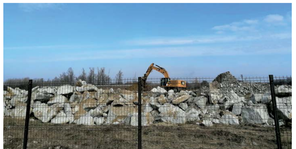
Zajlik a tereprendezés az iskola mögött, ott ahová az új iskola épül majd