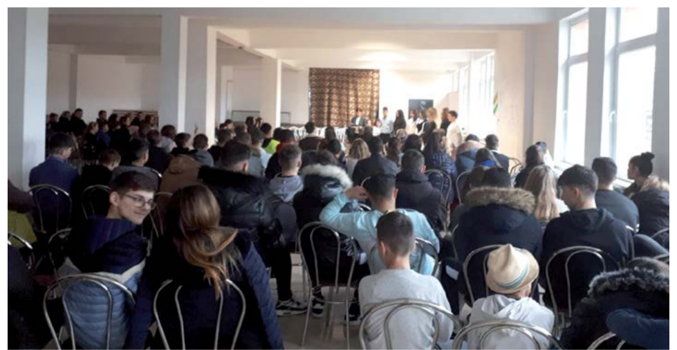
A megemlékezésen a tanintézmény tanárai és diákjai egyaránt részt vettek

Nemzetünk költőóriására emlékeztünk Petőfi Sándor születésének 200. évfordulója alkalmából a Nagykágyai 1-es Számú Technológiai Líceumban január 20-án, pénteken. A jeles ünnepi alkalommal az iskola közösségi termében a VI–VIII. osztályos tanulóink szereplésével elevenítettük fel Petőfi életútjának állomásait is jelölő egy-egy jellemző alkotását.