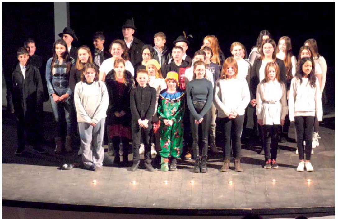
A nagykányai diákok először léptek fel a székelyhídi színházban