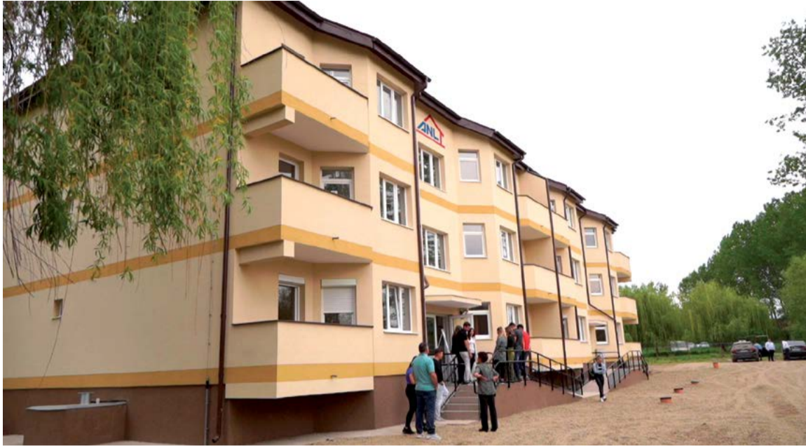
Az ANL által tavaly májusban átadott tömbházban összesen 18 bérlakás kapott helyet

Egy másik nyertes projekt a városháza külső-belső felújítása és további irodákkal való bővítése teszi lehetővé. Ennek kiegészítéseként leadtak és megnyertek egy olyan pályázatot is, mely az intézmény digitalizációjára irányul. Ez abban áll, hogy tervek szerint a szolgáltatásai egy részét digitalizálni fogják, lehetőség lesz a számlák online kifizetésére, hogy ne kelljen az embereknek annyit sorban állni. Másrészt ablakos rendszert is szeretnének bevezetni, ahol sorsszámok alapján sokkal gyorsabban és egyszerűbben lehet majd ügyeket intézni, anélkül, hogy számos irodát végig kellene járni. Ez leegyszerűsítene, optimalizálná a polgármesteri hivatal adminisztrációs működését, hiszen eljutott hozzájuk a lakosság irányából érkező, sokszor való-