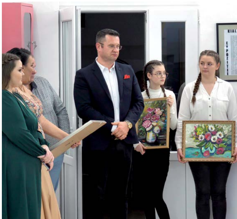
Ki ad többet? Idén is jelentős összeg gyűlt össze az aukción Bőjte Csaba testvér neveltjeinek támogatására