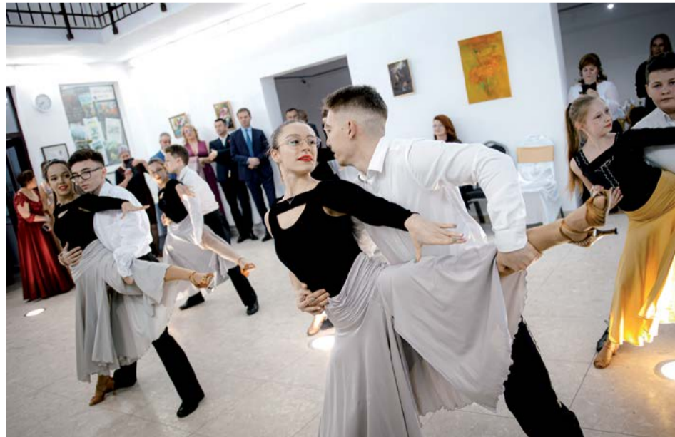
A Tini Dance Center Táncstúdió előadásában bécsi keringőt láthattak a jelenlévők