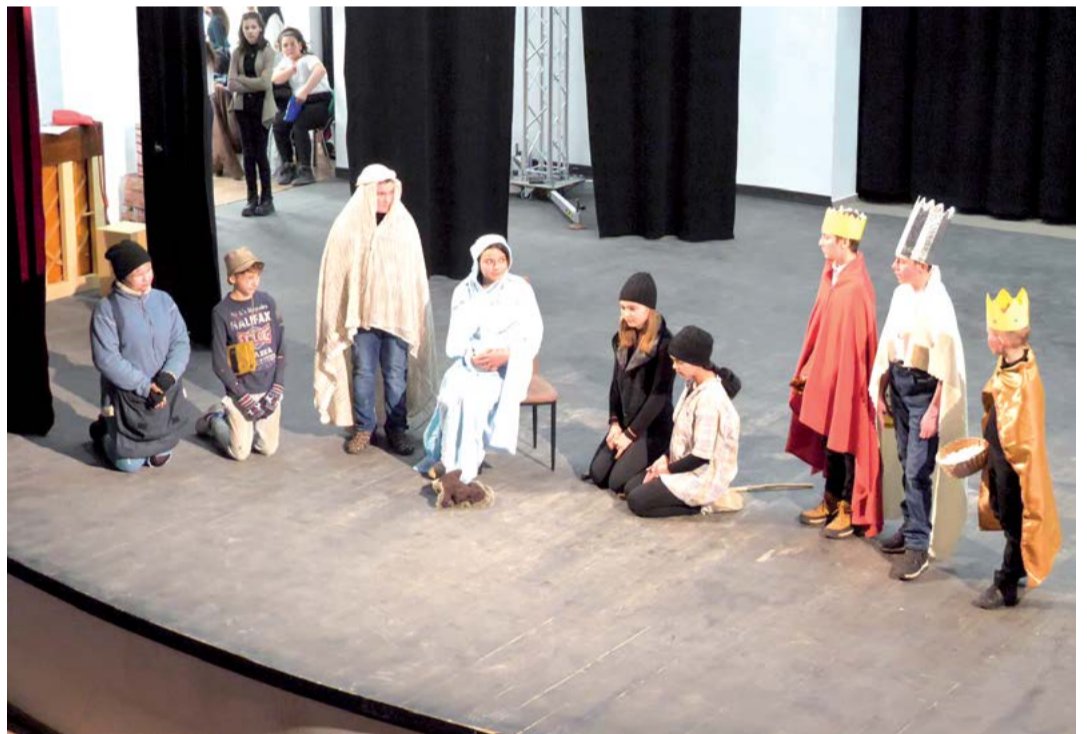
A NagySzakSztár szereplői a Csavargók éjszakája című karácsonyi színdarabban