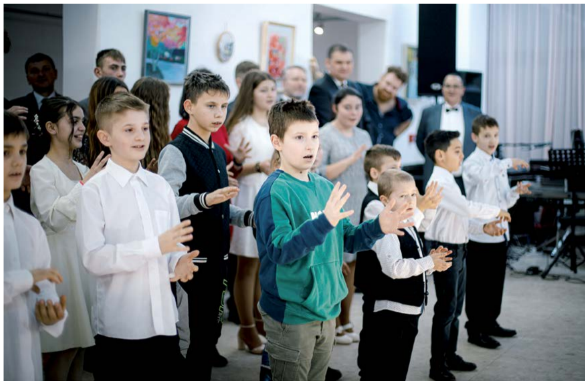
Jelbeszéddel is elmutogatták az egyik éneküket a Székegyházi Gyermek Jézus Otthon kis lakói

Ajándék volt a bálozóknak a felépők műsora, szívet, szemet-lelket melengető ajándék. Fergeteges hangulatot teremtettek a Béres Csilla vezette Zajgó Néptáncsoport táncosai. Már hetyke, legényes bevonulásuk is sikert aratott, az eltáncolt rábaközi táncokat pedig szünni nem akaró vastappsal jutalmazta a bálozó közönség.