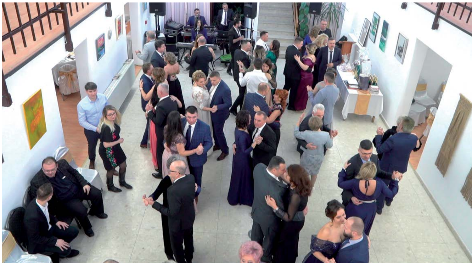
A Desszert együttes előadásában felhangzott ismert slágerek a táncparketre csalogatták a bál résztvevőit