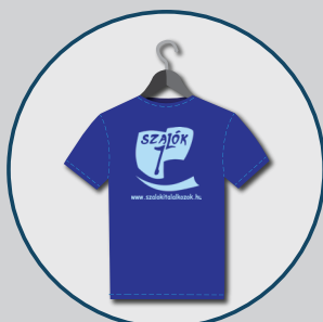
Egerszalóki Ifjúsági Találkozó