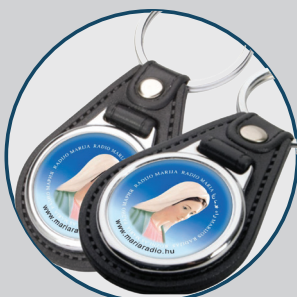
Mária Rádió kulcstartói

Email: keresztenydekor@gmail.com Tel.: 06 20 459-5402