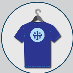
Póló egyedi igény alapján