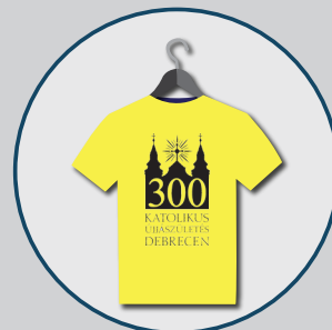
Szent Anna Plébánia

Keresztény családi vállalkozásként munkánk során is hitünk megélésére törekszünk. Katolikus rendezvényekre, szervezetek és közösségek számára készítünk reklámruházatot és rendezvénykellékeket. Hisszük, hogy munkánkkal evangelizálunk is!