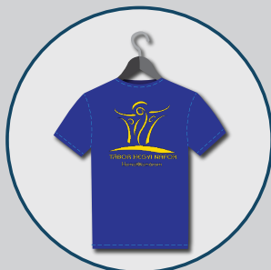
Nyolc Boldogság Közösség