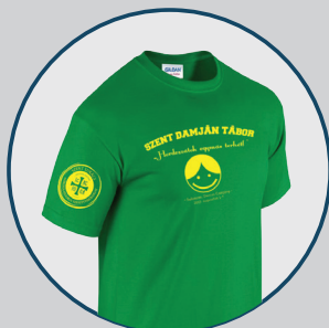
Szent Damján Tábor