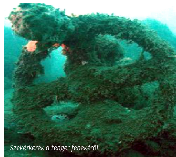
Szekérkerék a tenger fenekéről