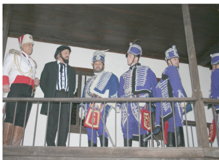
Kossuth és kísérete a sumeni házbán

Az emigránsok Sumenbe érkezésének időpontja is vitatott; de az biztosnak tűnik, hogy a karácsonyi böjt időszakába esett. Pásztor Imre szerint az elszállásolásuk nemcsak rang szerint történt (tehát a tisztok jobb szállást kaptak), hanem vallás szerint is, hiszen a muzulmán hitre áttérteket a lovassági lakatnyában helyezték el. Sztilyán Csilingirov ezt a vallás alapján történő szeparációt nem említi, azonban megjegyzi, hogy a jelesebb előjárókat bolgár előjárókhoz, a közkatonákat pedig vagy bolgár magánházakhoz, vagy laktanyákhoz szállásolták be. Szlavinszki szerint a nehezen élő, nyomorgó bolgár lakosság számára az érkező „ungurok” a hazájukból menekülni kényszerülő, üldözött sorstársak voltak, ezért úgy fogadták őket, mint rokonaikat.