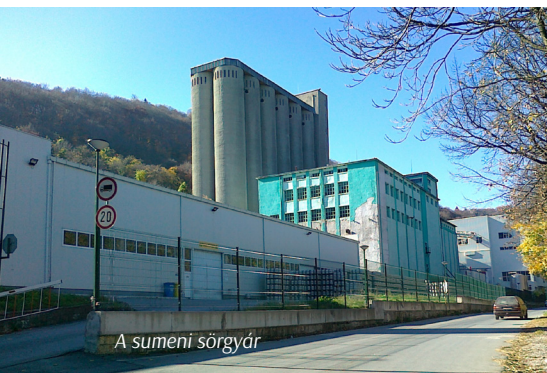
A sumeni sörgyár