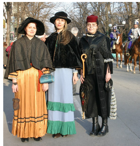
Emigráns magyar asszonyok öltözete