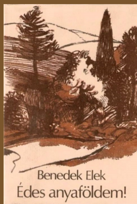
Benedek Elek Édes anyaföldem!

című kötetében elmondja életének döntő jelentőségű húsvétját. Szüleit és testvéreit az erdélyi faluban és a földművelés munkájában hagyva Pestre ment, egyetemre. A nagyváros szellemi és politikai élete elcsavarta a fejét: halogatta a vizsgákat, mert verseket írt, közéleti cikkek szavait finomította. Végül – mivel záróvizsgáit ismét elhalasztotta, s mintegy fél éve az Ellenőr című lap sem reagált beküldött cikkeire – elhatározta, hogy patetikus módon búcsút mond életének. Pisztolyt is szerzett. Húsvét előtt hazautazott azzal a titkos szándékkal, hogy elköszön szüleitől, s nagyszombat éjszakáján öngyilkosságot követ el. A faluban maradt gyermekkori legjobb barátjának, Ignácnak, jóllehet nem fedte fel tervét, sokatmondóan mutogatta a pisztolyát.