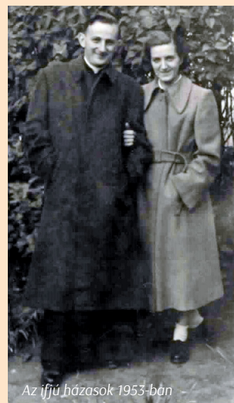
Az ifjú házaspár 1953-ban