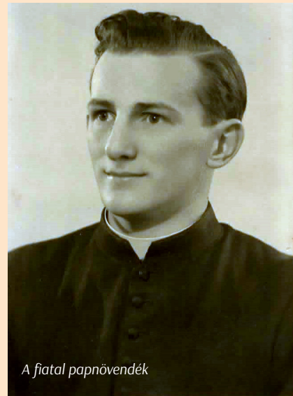
A fiatal papnövendék

Én akkor már döntöttem – meséli Marika néni. – Nagyon sokat imádkoztam mindennap. Gyerekkoromban csak a tanult imákat mondtam, de később rájöttem, hogy fontos a saját szavainkkal is imádkozni, a Jóisten várja is ezt. Ő segített meghozni ezt a döntést is. Tudtam, hogy ez Isten akarata, és tudtam, hogy ez jó lesz nekem. A szeplőtelen fogantatás ünnepe, december 8-án a fiatalok eljegyezték egymást.