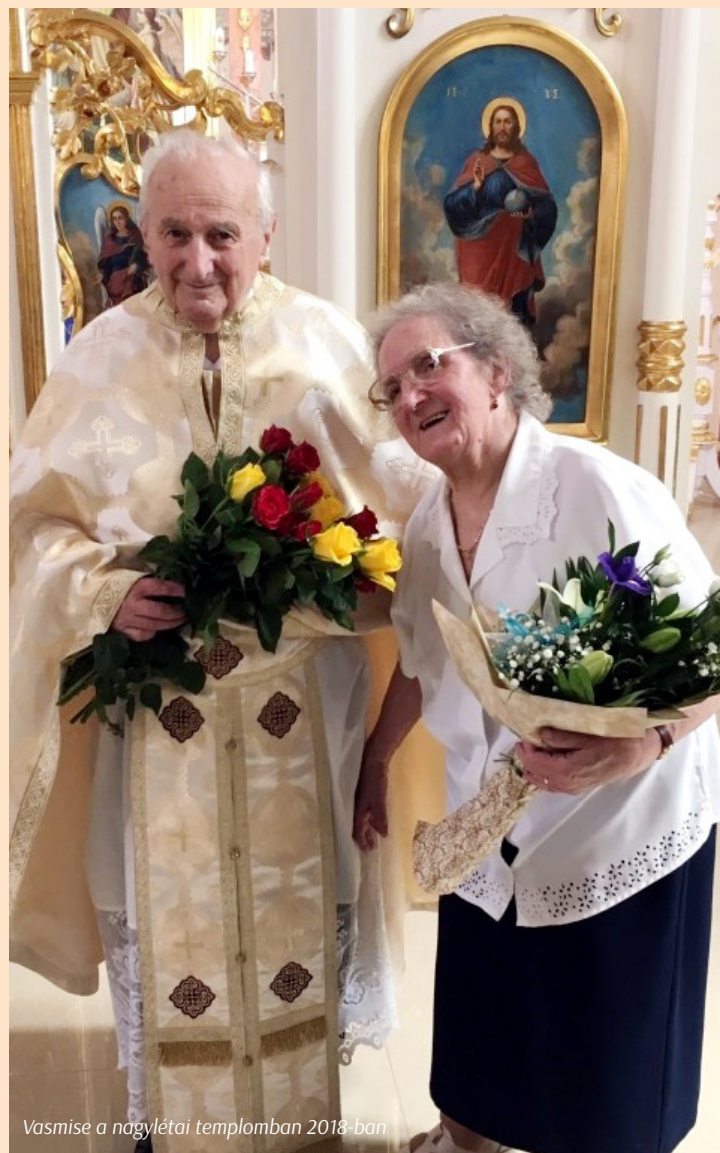
Vasmise a nagylétei templomban 2018-ban