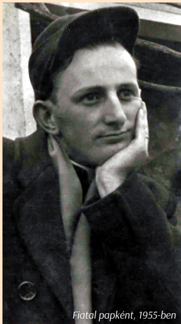
Fiatal papként, 1955-ben