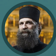
KOCSIS FÜLÖP érsek-metropolita