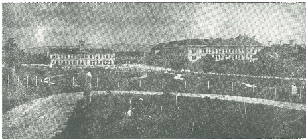
A Szabadság-tér 1900 táján (Postai lev. lap. 1904)

Az 1900—1906-ig terjedő időszak tárgyalásánál a Sepsiszentgyörgyön kiadott Székely A fényképreprodukciókat Paszjár Sándor és Fóris Pál készítette. között eltérés mutatkozott, a Kislexikon adataihoz ragaszkodtunk. házi kislexikon (1969) címszavai alapján készült. Ahol a két lexikon adatszolgáltatása (1930) megjelent M. Színművészeti Lexikon és a Hont Ferenc-Staud Géza szerk. Szín-Székely Nép című hírlap szolgált útmutatásul. Nemzet , az azt követő hét éves időszak történetének felvázolásánál az uo. megjelent Az elszármazott színészek jegyzéke a Schöpflin Aladár szerkesztésében év nélkül