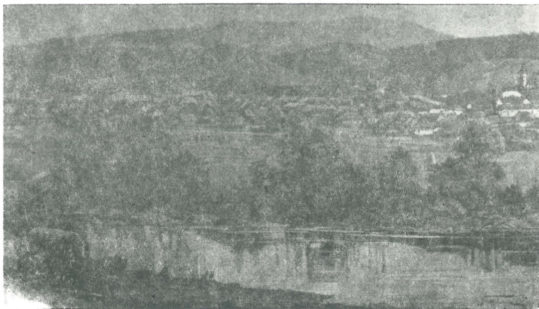
Sepsiszentgyörgy a századfordulón a vasútállomás (Eprestető) felől nézve (Nagy Lázár rajza, 1900).