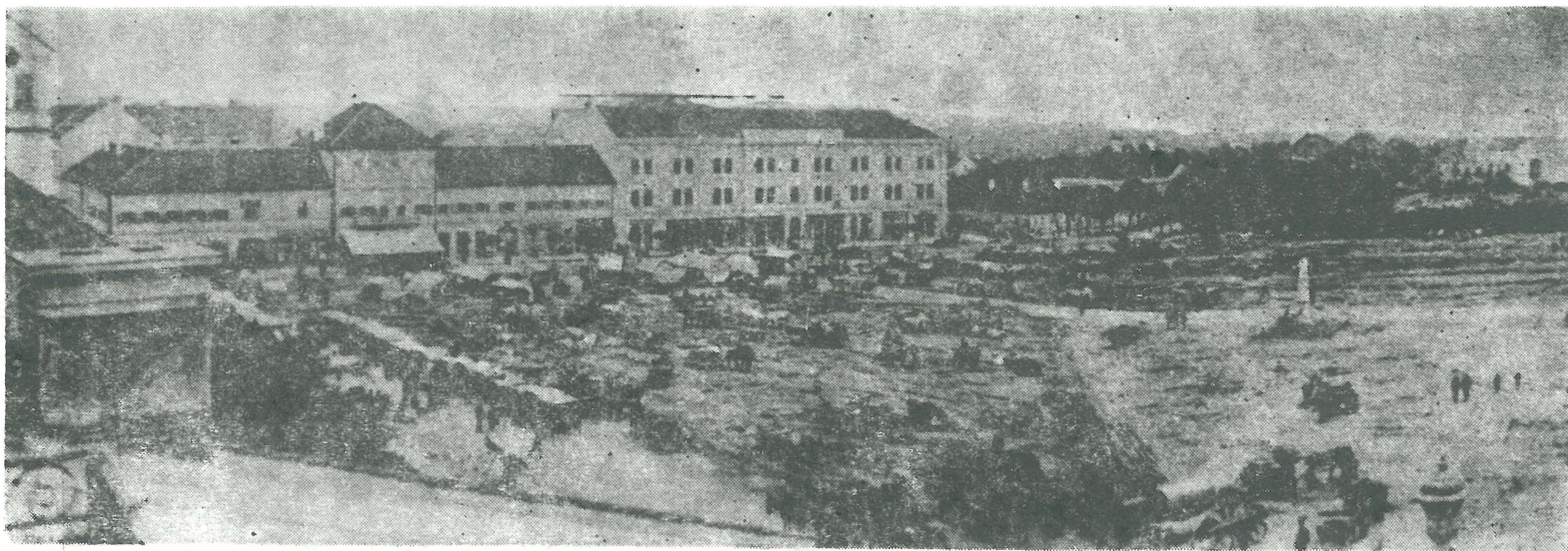
A városliget befásítása (Egykori fénykép után)