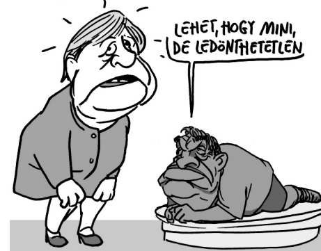
Illusztráció: Pápai Gábor - Népszava

Veszélyes játékba kezdett a magyar miniszterelnök. Szavazatáért cserébe azt akarja, hogy az Unió ne vizsgálhassa hazánkban a demokráciával kapcsolatos problémákat, és a vele szemben kritikus civilek se kaphassanak pénzt az EU-tól.