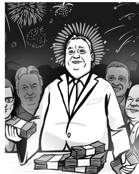
Illusztráció: Buzás Aliz

Az Európai Unió statisztikai hivatala döbbenetes adatokat tett közzé a napokban. A magyar infláció a hatodik legnagyobb az egész Európai Unióban, csak a három balti állam, valamint Csehország és Bulgária fogyasztói árai nőnek durvább ütemben, mint az itteniek. Nálunk azonban a benzin és néhány alapélelmiszer