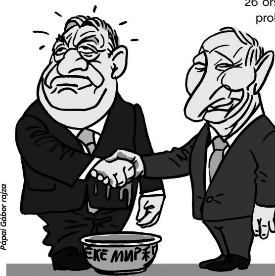
Papai Gábor rajza