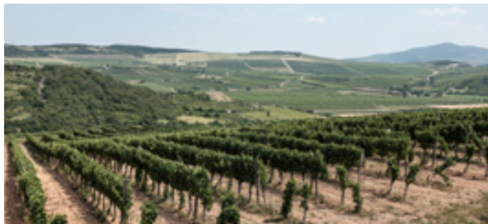
Szent Tamás-dűlő, Mád