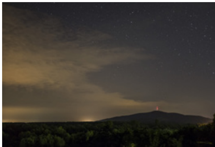
A Tokaj melletti Kopasz-hegy éjszaka

gazdagít, a szállás kevésbé, pedig egy kis odafigyeléssel a Hegyalja egyik legjobb szálláshelye lehetne. Kárpótol a Kisfalucska vendégház Kisfaludon: patyolattiszta, pazar belső dizájn, elsőrangú szolgáltatások nagycsaládosoknak. Mindegyik apartman konyhával