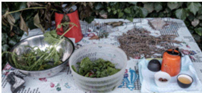
A Terrapolis recepciója