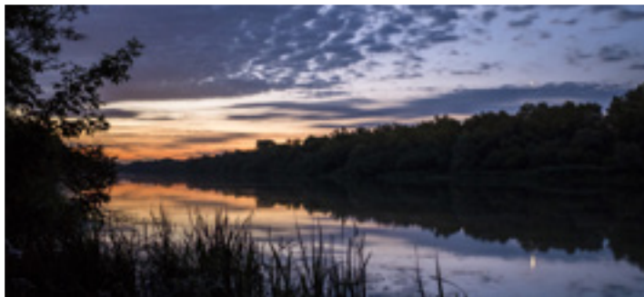
Pirkadatkor a Bodrog-parton