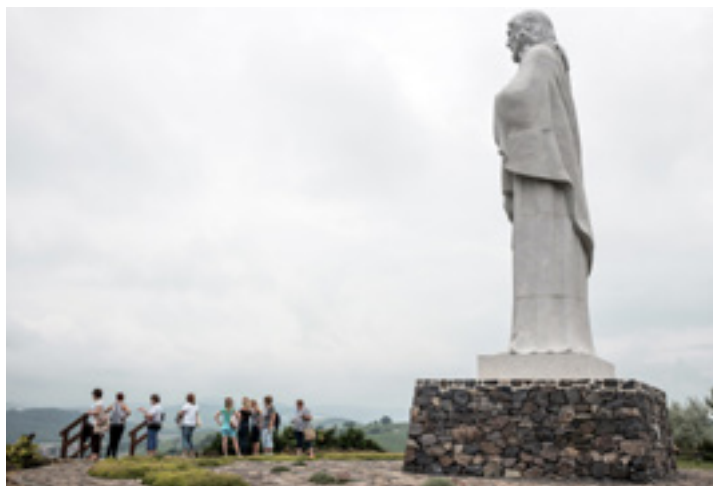
Áldó Jézus-szobor, Tarcal

gazdagít, a szállás kevésbé, pedig egy kis odafigyeléssel a Hegyalja egyik legjobb szálláshelye lehetne. Kárpótol a Kisfalucska vendégház Kisfaludon: patyolattiszta, pazar belső dizájn, elsőrangú szolgáltatások nagycsaládosoknak. Mindegyik apartman konyhával