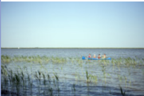
Kajakosok a Fertőn