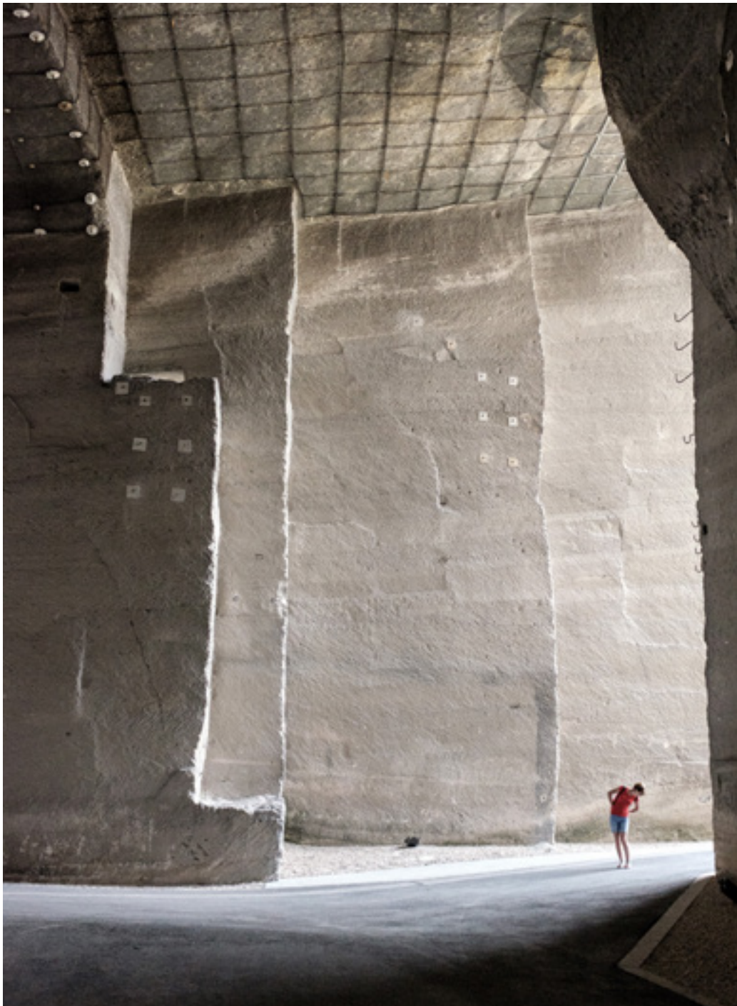
A Fertőrákosi Kőfejtő „előcsarnoka”