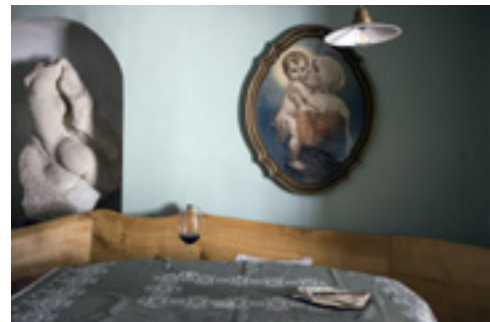
Ráspi étterme (Fertőrákos)