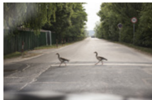
Nyári ludak a Fertő-tóhoz vezető úton

Sopron belvárosában a parkolás a budapestinél is körülményesebb, a többi faluban pedig a víztől leszünk az ideálisnál távolabb. Szálláskereséshez érdemes felkeresni a falu honlapját ( fertoarakos.hu ) az igazán jó „last minute” ajánlatokról pedig telefonon érdeklődjünk! Például a Huber panzió és a Szentesi panzió családbarát szálláshelyek, és míg előbbi kitűnő éttermet működtet, utóbbi tökéletesen gondozott virágos, panorámás kertjével bővül el – négy személy részére jellemzően 15 ezer forint/nap áron foglalhatunk.