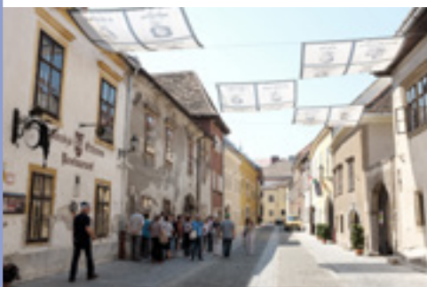
A már felújított Új utca (Sopron)