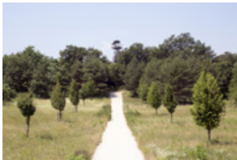
Őrtorony a Páneurópai Piknik emlékhely közelében (Fertőrákos-Piuszpuszta)