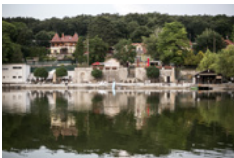
Tómalom fürdő (Sopron)