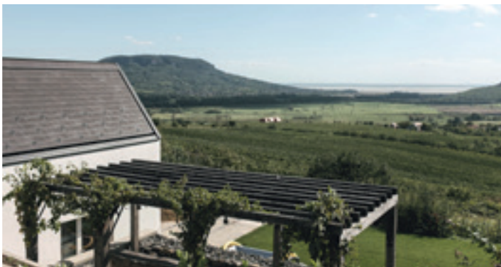
Kilátás a Badacsonyra a Gilvesy Pincészet teraszáról