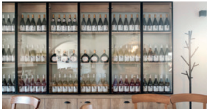
A Borbarátok vendéglő egész éves nyitvatartással várja a vendégeket