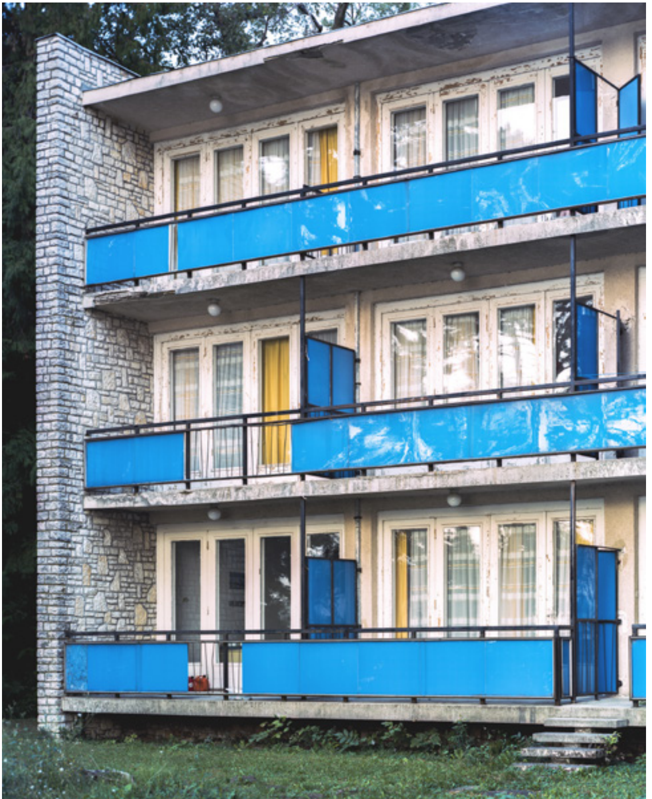
∧ A IX-es villa épülete