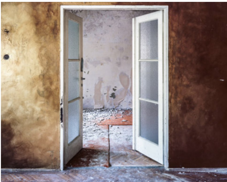
∨ Szobabelső az V-ös villában