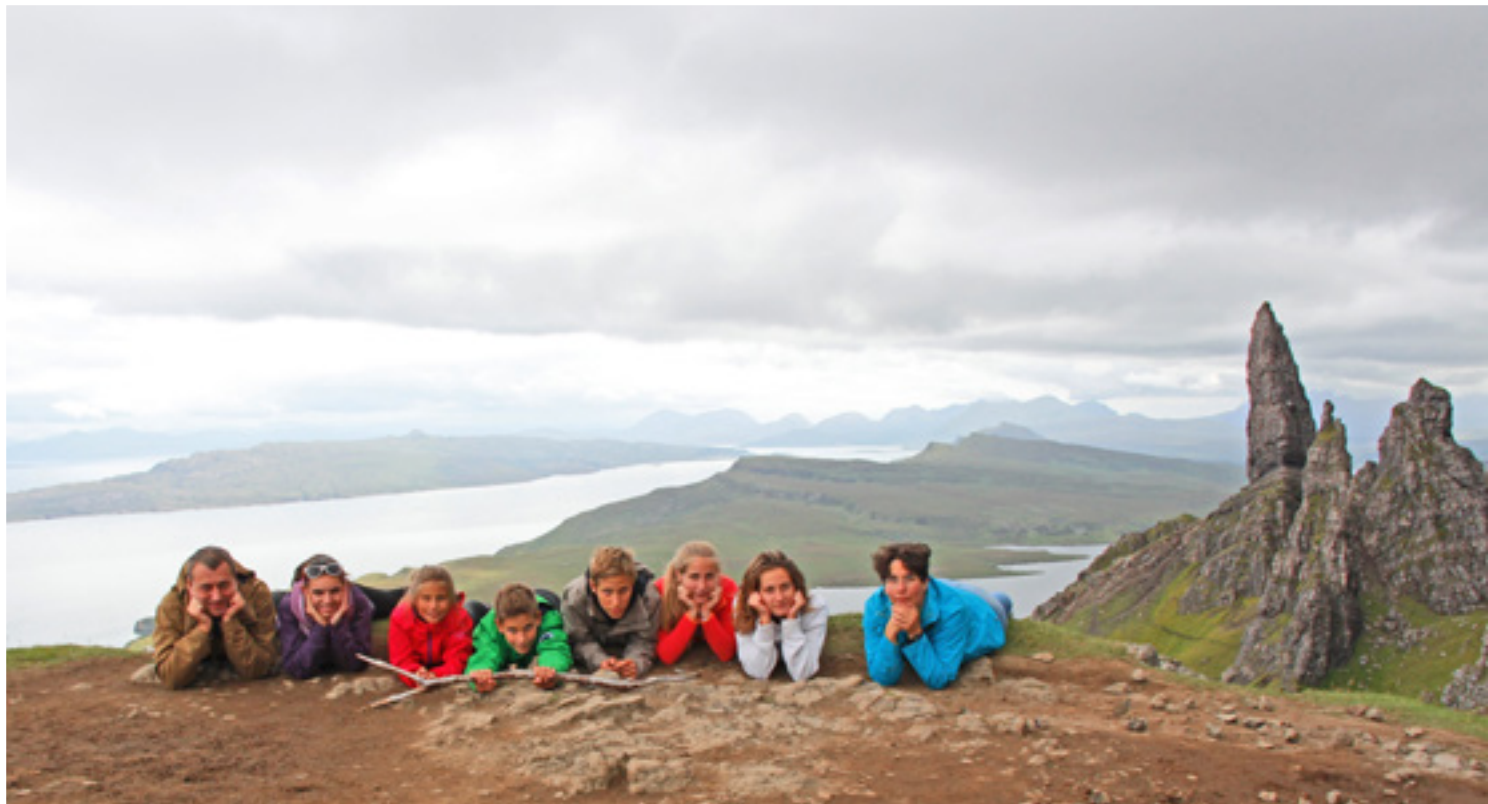
A Fogarasi család