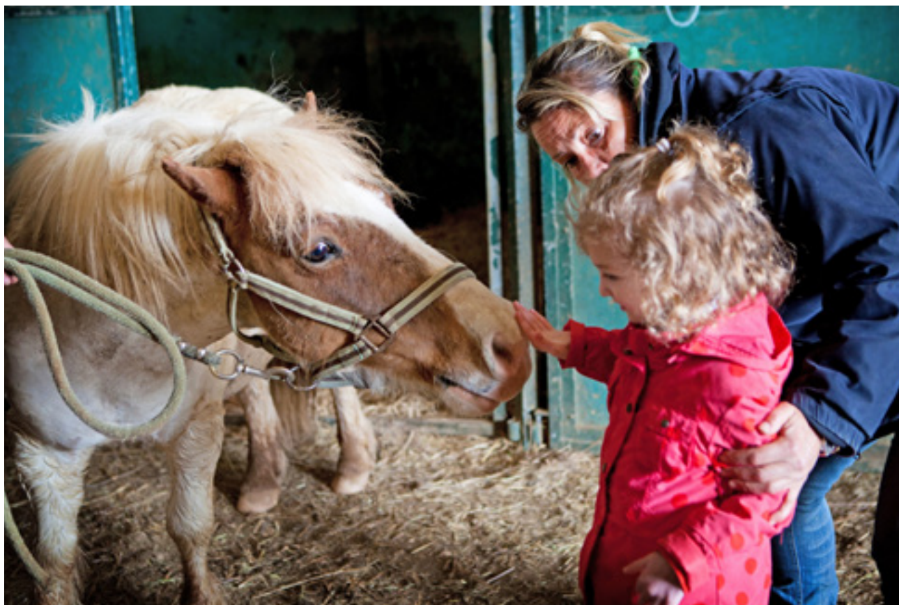
Terápia az EQUISENS lovasterápia központban (Asniere-les-Dijon, Franciaország)

és hagyja magát irányítani. Az istálló, a karám, a lovarda sajátos környezete is hozzájárul a kezelés sikeréhez. Természetesen ilyen tevékenységet csak képzett oktató irányításával szabad végezni, és kizárólag teljesen megbízható, jólnevelt állat lehet alkalmas rá, hiszen nemcsak a terápia sikere, de még a páciens testi épsége is múlhat a négylábú asszisztens viselkedésén.