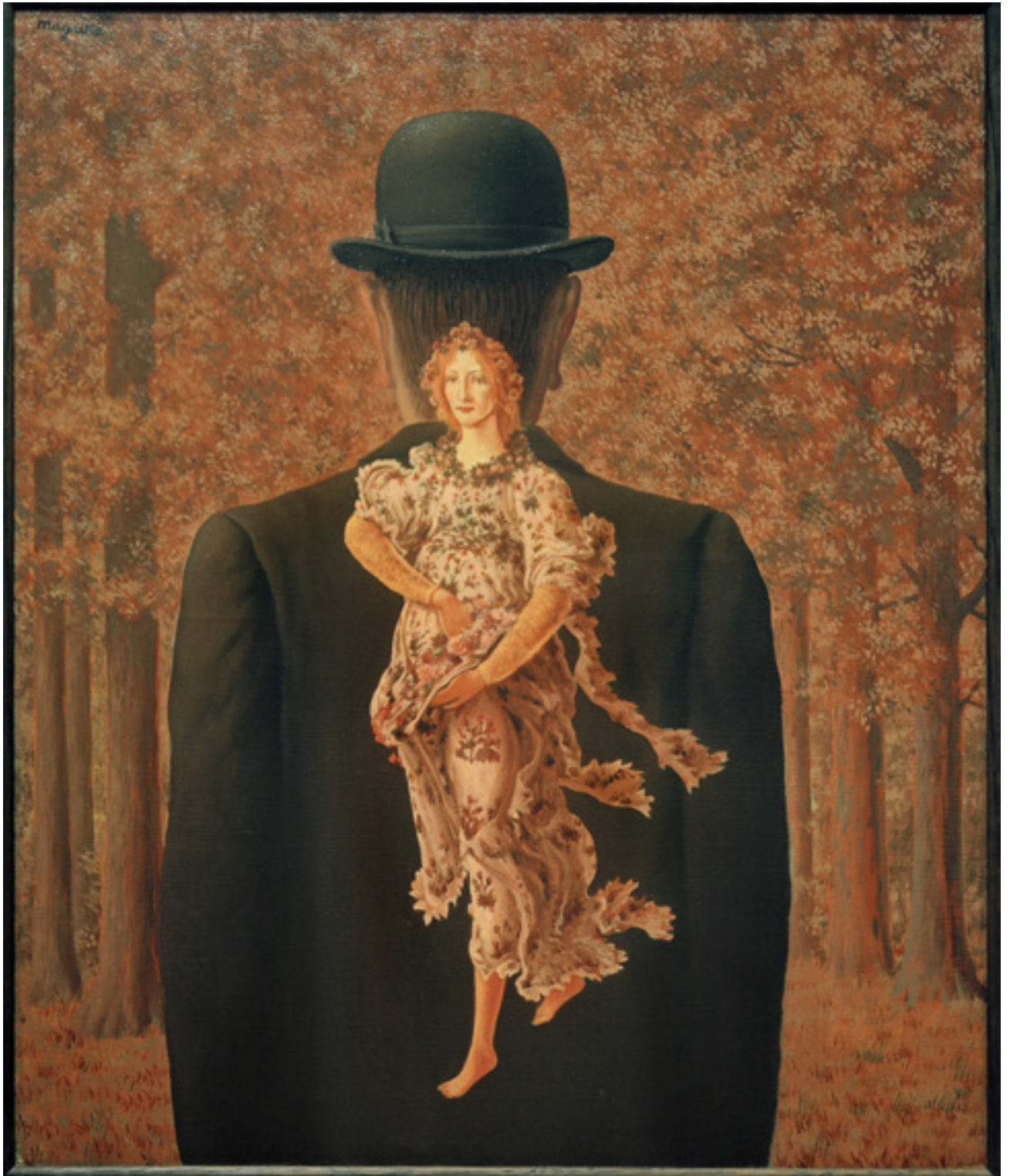
René Magritte (1898–1967): Le Bouquet tout fait (olaj, lenvászon, 60 × 50 cm, 1956)