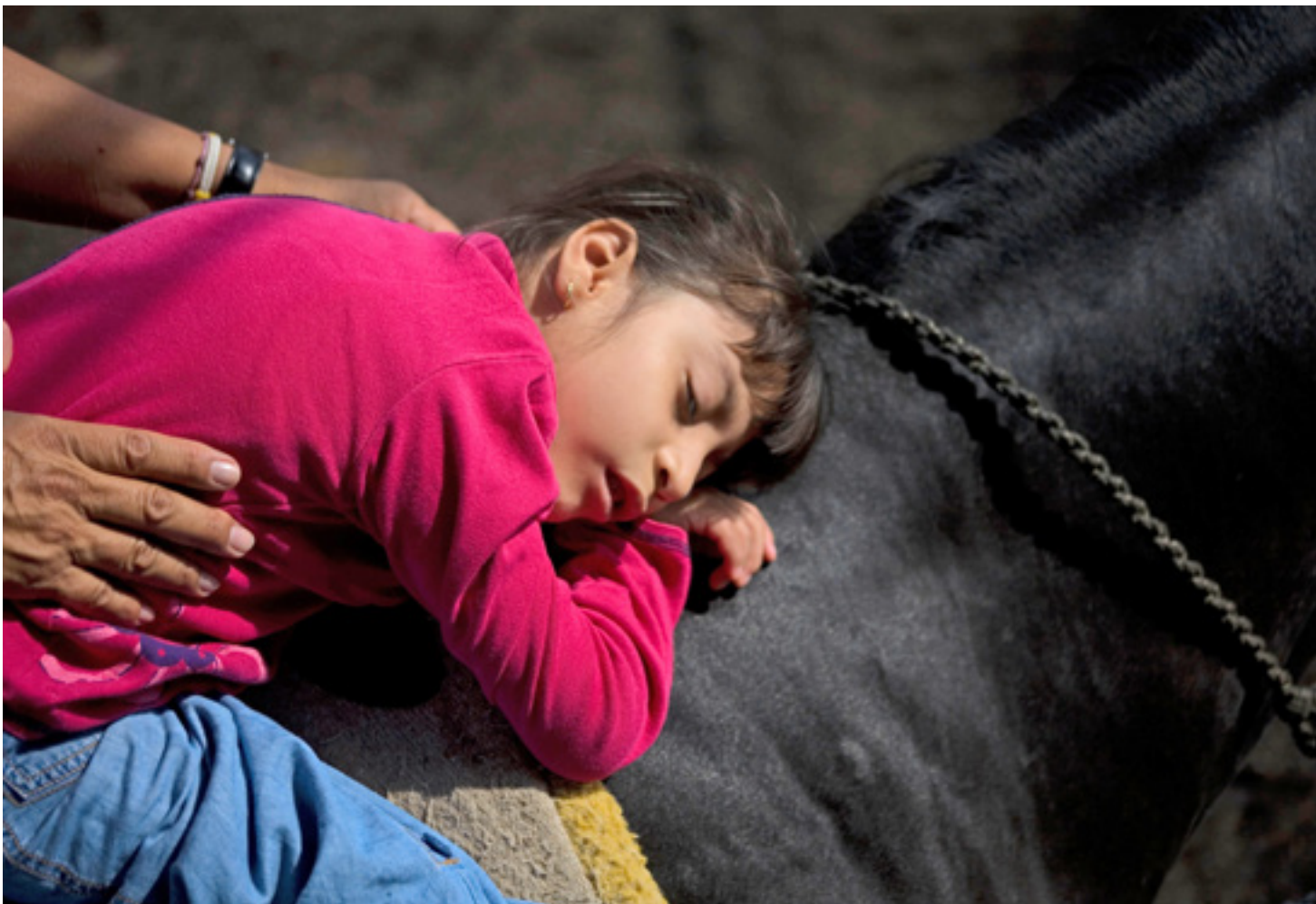
Cerebrális parézisben szenvedő gyerek lovasterápiája, Mexikóváros, 2010

stimulálja az egyensúlyérzék idegi központját, javul tőle a testtartás, a mozgáskoordináció, a légzés, az állóképesség vagy a test szimmetriája, és még sok minden más. Talán sokaknak meglepő módon – a ló mozgásának ritmikussága hozzájárul a beszéd fejlődéséhez, ezért beszédzavarok kezelésében is igen jó eredményeket lehet várni a gyógylovaglástól. Ezzel együtt a hippoterápiának csak egyik ága a gyógylovagoltatás, a lovas kezelések egy részében a páciens sosem száll nyeregbe.