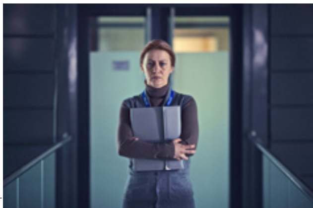
Részlet a filmből