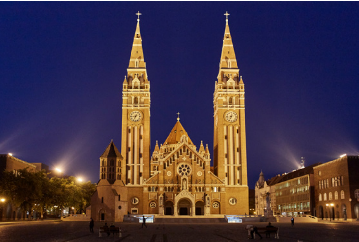
A Fogadalmi templom, a Dömötör-torony és a Dóm tér

szintjét mutató márványtáblát, az 1903-ban elkészült Új Zsinagógában (Jósika u. 10.) pedig a Róth Miksa műhelyben készült üvegablakok és a páratlan szépségű, szimbolikus üvegkupola kápráztatja el a látogatót. Az Alsóvárosi Ferences Látogatóközpontban (Mátyás tér 26.) a szerzetesi élet mindennapjaiba nyerhetünk bepillantást, a kolostor udvarán kialakított kézművesműhelyekben agyagozhatunk, nemezelhetünk és gyertyát is önthetünk; www.latogatobarat.hu .