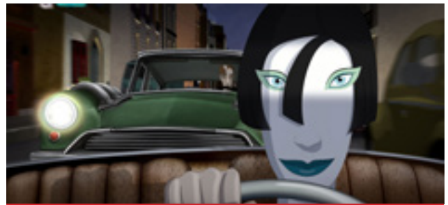
Részlet a filmből

A teljesen magyar gyártású egész estés animációs film novemberben kerül a mozikba. A történet szerint különös rablószorozat rázza meg a világ leghíresebb múzeumait: egy rejtélyes bűnbanda egymás után szerzi meg a legértékesebb képeket. Hiába minden óvintézkedés, semmi sem akadályozza meg a Gyűjtőt (Kamarás Iván) és