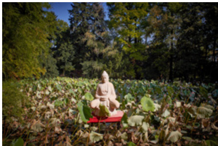
Fűvészkert, lótuszos tó

Szeged környéke is bővelkedik látnivalókban, így – ha tehetjük – szánjunk legalább egy napot ezek bejárására. Sokunknak ismerős, családdal úgymond kötelező program elzarándokolni Feszty Árpád monumetális körképéhez