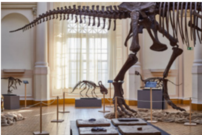
Az Évmilliók urai dinókiállítás a Móra Ferenc Múzeumban

filmek szakmai tanácsadója – grandiózus dinókiállítását. Így nyár közepe óta óriás őshüllők bömbölésétől hangos a Tisza partja, a múzeumtérben pedig párját ritkító kiállításon láthatjuk a valaha élt legnagyobb állatok élethű és mozgó makettjeit, csontvázakat és fossziliákat. A kiállítás fő termében különös hangulatot teremt a Munkácsy Mihály Honfoglalása előtt tornyosuló 25 méteres brachiosaurus csontváza, a Jurassic Parkban szerepelt velociraptornak pedig már csak az állandó kiállításon maradt hely a rókák és medvék közt! www.moramuseum.hu .