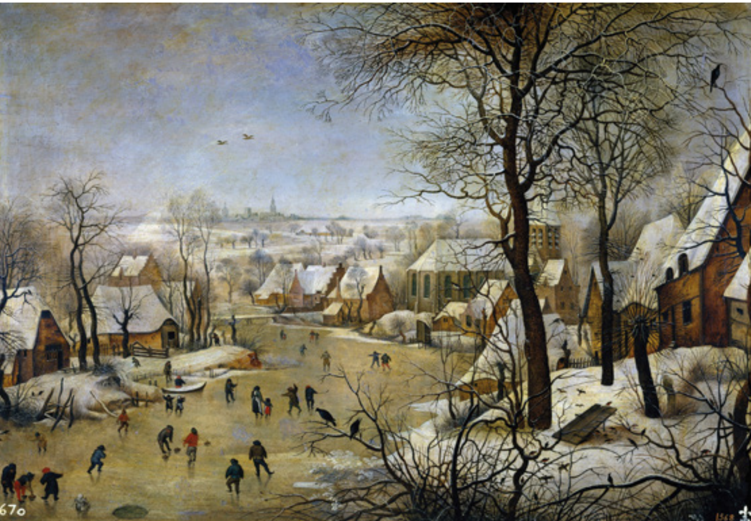
Ifjabb Pieter Bruegel (1564–1638): Téli tájkép madárcsapdával; 1601 körül, Museo del Prado, Madrid

A kérdésre József Attila verse ad feleletet: A lombok meghaltak, de született egy különleges ember. Ennyi. Ez az egyszerű tény az, amit mindenki, hívő és nem hívő elfogad, s ezzel együtt elfogadja a két kijelentés közötti reményt adó kontrasztot is, a reményt a reménytelenségben.