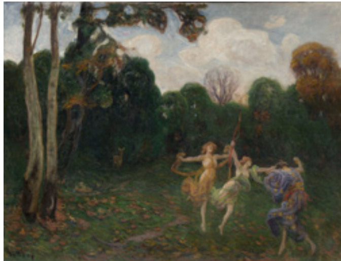
Hollósy Simon: Táncoló lányok az erdő szélén, 1895. olaj, vászon, 151×200 cm | keret: 174×225×9 cm Szépművészeti Múzeum – Magyar Nemzeti Galéria, Budapest, 2018