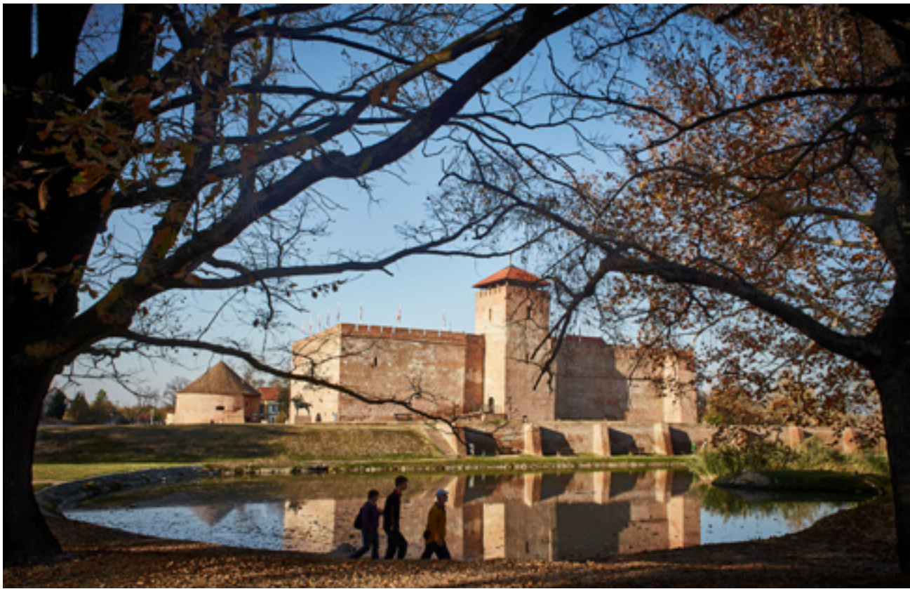
A gyulai vár