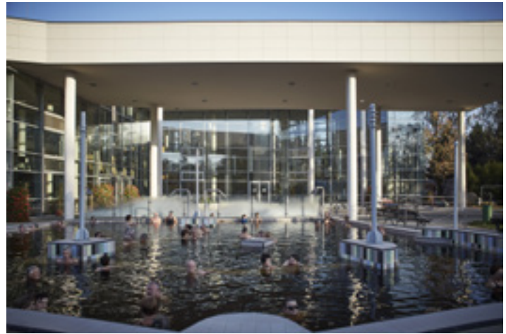
A Gyulai Várfürdő egyik medencéje

Az Erkel Ferenc Emlékház nemzeti himnuszunk zeneszerzőjének, a magyar nemzeti opera megteremtőjének állít emléket. A kiállítás nyitóterében Európa himnuszait bemutató terminálok fogadják a látogatókat, majd az európai zene terme következik. A 19. századi osztályteremben lévő interaktív sarokban korabeli feladatok megoldására nyílik lehetőség, az „Erkel-emlékszoba” a zeneszerző személyes tárgyait, relikviáit mutatja be, a hálószoba, a szalon és a népies konyha a Gyulára Pozsonyból 1806-ban érkezett Erkel család egykori otthonát idézi fel.