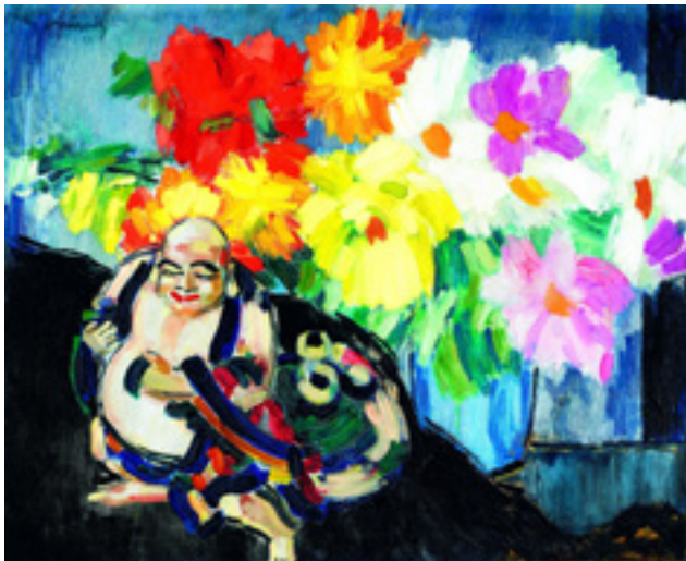
Vaszary János: Csendélet keleti porcelánnal, 1926 71,5×88 cm olaj, vászon Magántulajdon – a Kieselbach Galéria közvetítésével