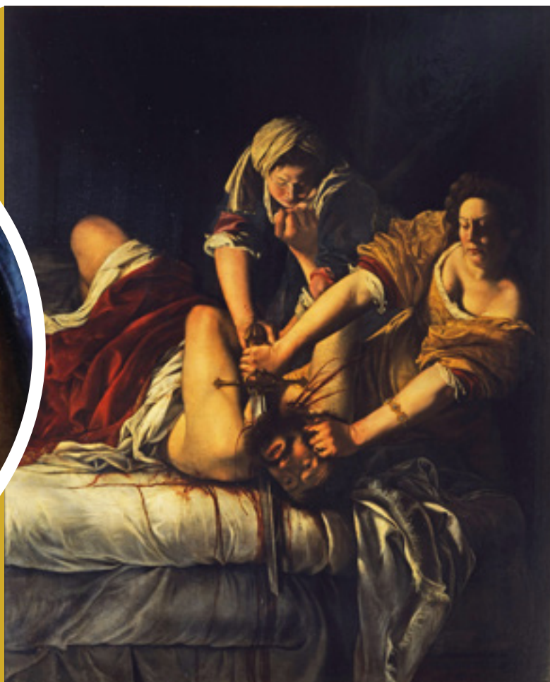
Önarckép: Mártírnő (1620 körül) | Judit lefejezi Holofernést (1620)

Kivételt akkor tett először, amikor festőtanítót keresett a számára, hogy még tovább fejlessze a lánya tudását. Oraziónak volt kiközül válogatnia, mert a kor Rómája hemzsegett a nagy művészekről, ő pedig szinte mindegyiküket ismerte; Caravaggioval például rendszeresen együtt iszogott. A választása végül régi barátjára, Agostino Tassira esett. A harmincas éveiben járó férfi hírneves festőművész volt. A leggazdagabb római uraknak és a pápának is teljesített megbízásokat. Formabontó, az emberi szemet becsapó műveit a mai napig tisztelettel mutogatják a turistáknak. Szabad bejárást kapott a Gentileschi-házba, és rendszeresen kettesben is maradt Artemisiával.