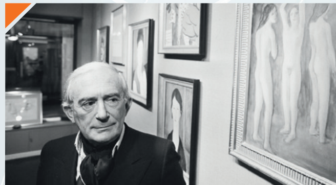
Elmyr de Hory