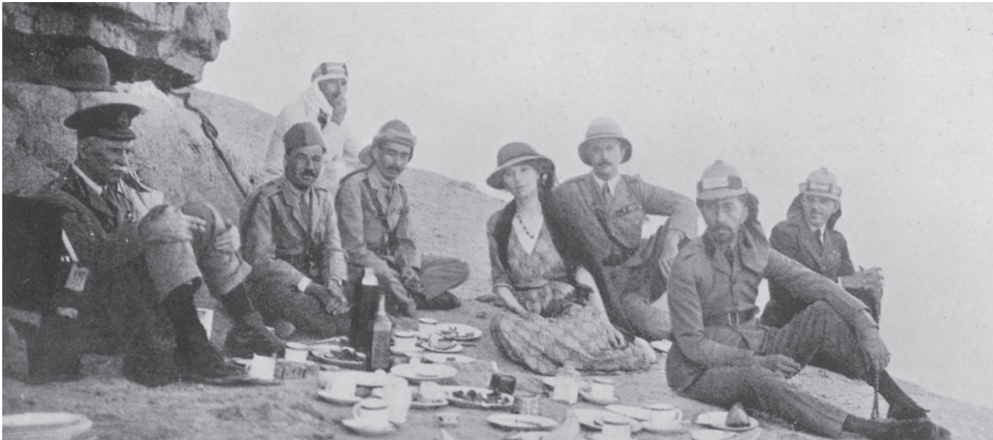
Gertrude Bell egy iraki expedíción I. Fejszál szaúdi királlyal, 1922.

Gertrude Bell tapasztalatai és szándékai szerint nyerte el a mai határait, az arab országok az ő közreműködésével lettek önálló államok, a kurdok pedig részben az ő hatására veszítettek el szinte mindent, ami fontos volt nekik.