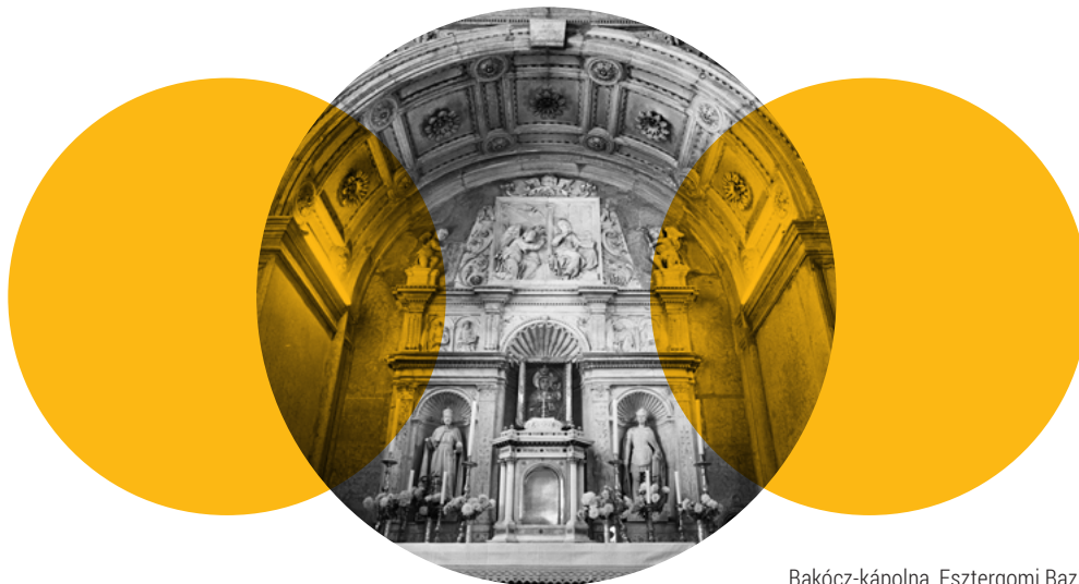
Bakócz-kápolna, Esztergomi Bazilika

Idehaza a gyengekezű király, II. Ulászló mellett Bakócz 1500 után szinte teljhatalommal irányította az ország ügyeit. Életének nagy esélye 1513-ban, II. Gyula pápa halála után csillant fel az ekkor már hetvenedik évén túl járó bíboros előtt.